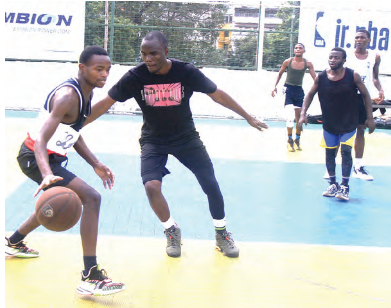
Wachezaji wa timu ya mpira wa kikapu ya vijana wakifanya mazoezi katika viwanja vya Jakaya Kikwete jijini Dar es Salaam jana.

Mchakato wa mabadiliko ndani ya klabu ya Simba ulioanza mwaka 2017 umeonekana kuchukua muda mrefu na mara kwa mara kumekuwa kunai- buka sintofahamu, huku wanachama na mashabiki wa klabu hiyo wakiwa hawajui haswa ni kitu gani, wapi au nani anakwambisha mchakato huo usikami- like.