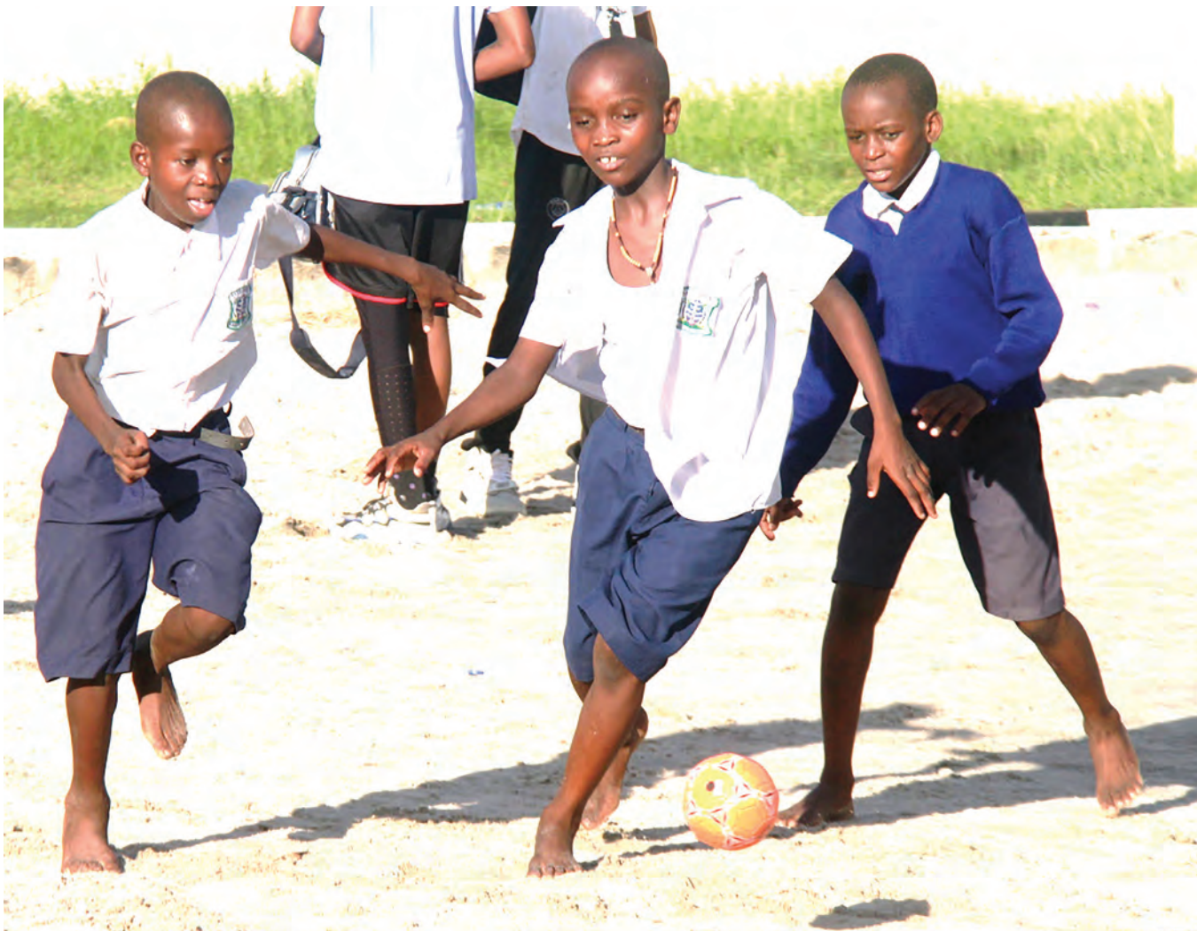
Wanafunzi wa Shule ya msingi Gerezani, wakicheza mpira katika viwanja vya Jakaya Kikwete jijini Dar es Salaam kama walivyokutwa na mpiga picha jana.

Kikosi cha Azam FC kipo kambini na watakuwa na michezo miwili ya kimataifa ya kirafiki watacheza Jumamosi dhidi ya Bandari FC katika uwanja wa Azam Complex, Chamazi.