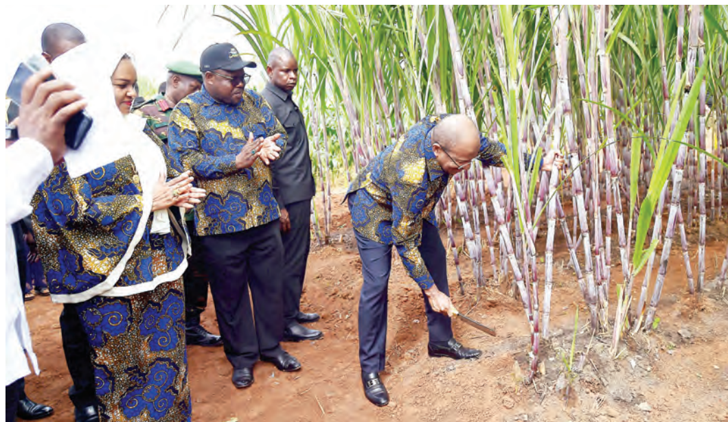
Rais wa Zanzibar, Dk. Hussein Ali Mwinyi akivuna miwa katika shamba la darasa la Chuo cha Mafunzo Zanzibar, katika viwanja vya maonyesho ya kilimo Nanenane Zanzibar Kizimbani Dole, Wilaya ya Magharibi "A" Unguja juzi.