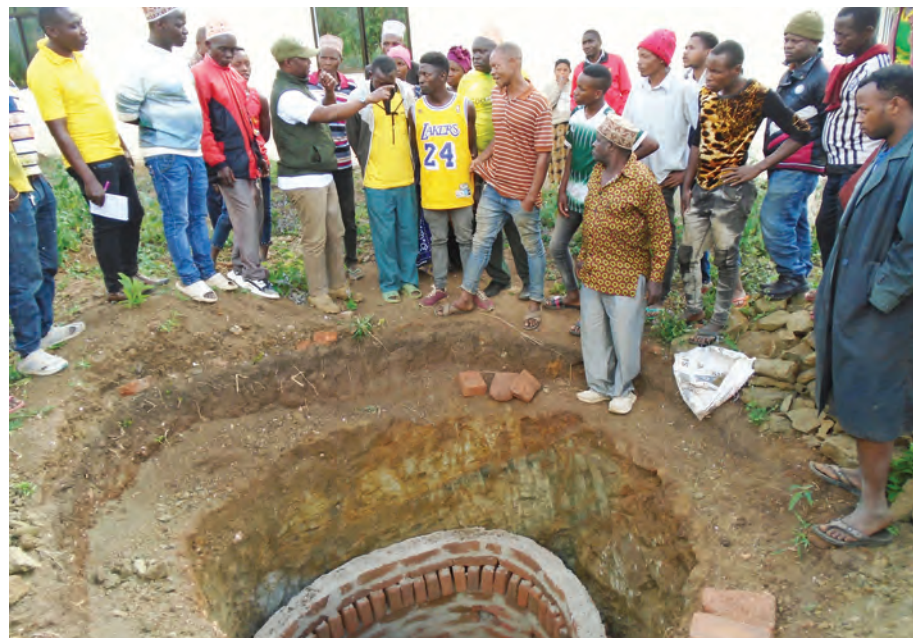
Wakazi wa kijiji cha Mbogo, kata ya Lwande wilayani Kilindi mkoa ni Tanga, wakikagua shimo kubwa la choo linalochimbwa kwa ajili ya zahanati ya kijiji hicho, baada ya kumalizika kwa mkutano mkuu kuhusu mapato na matumizi kijijini hapo, juzi.

Naye Njoka, akizungumza kwa niaba ya wamachinga, alilalamikia wateja kutofika maeneo walitotengewa na serikali kutokana na baadhi kupeleka kwenye masoko yasiyo rafiki. Aliiomba serikali kujenga masoko ya kisasa jijini Arusha ambayo yatawajumuisha wafanyabiashara wote kuuza bidhaa kwa ajili ya kujikwamua kiuchumi.