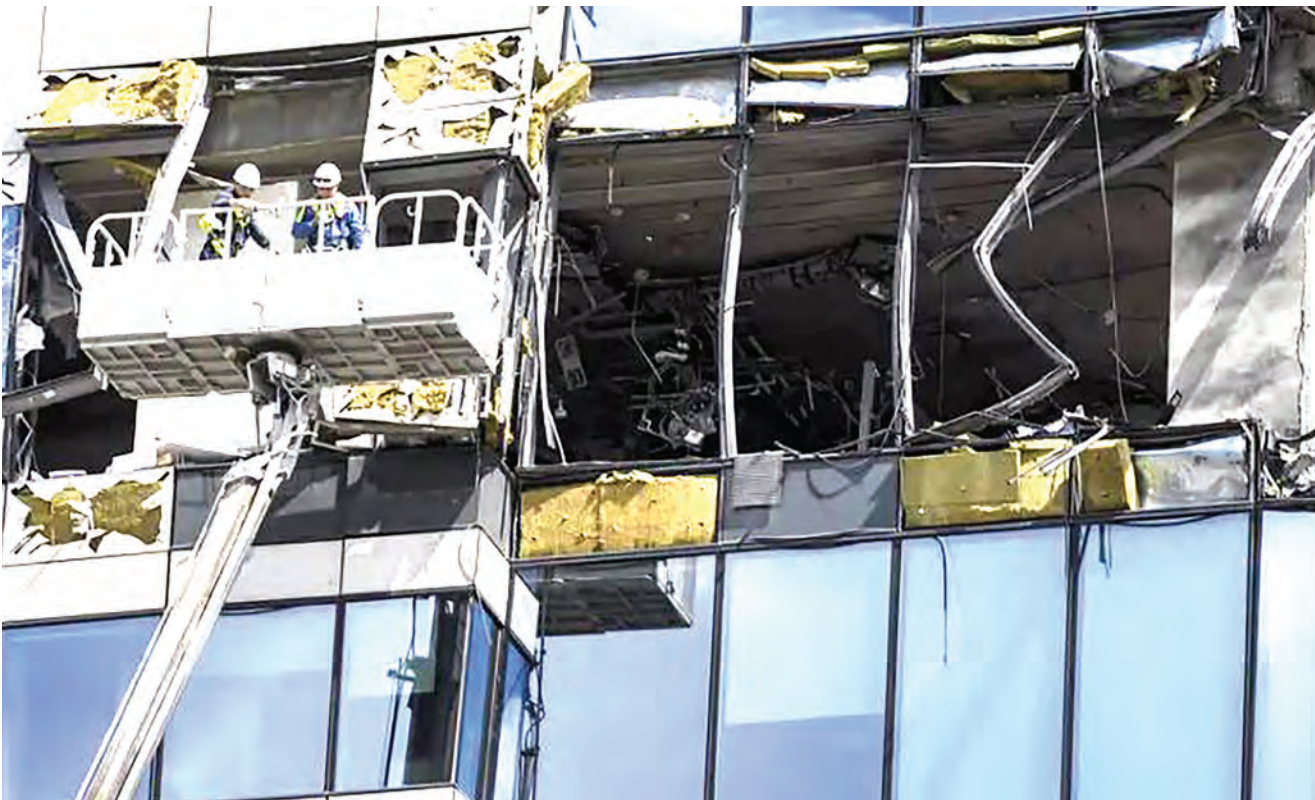
Vikosi vya zimamoto vikichunguza jengo la ghorofa lililoshambuliwa na ndege isiyo na rubani mjini Moscow jana.

Wizara hiyo ilibaini kuwa meli hizo mbili zilikuwa katika harakati ya kudhibiti usafirishaji katika bahari ya kusini-magharibi mwa Sevastopol.