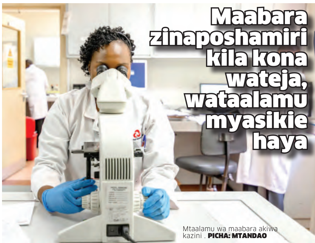
Mtaalamu wa maabara akiwa kazini.

Anahimiza kuacha kutoa vipimo vya uongo na kusisitiza kuwa