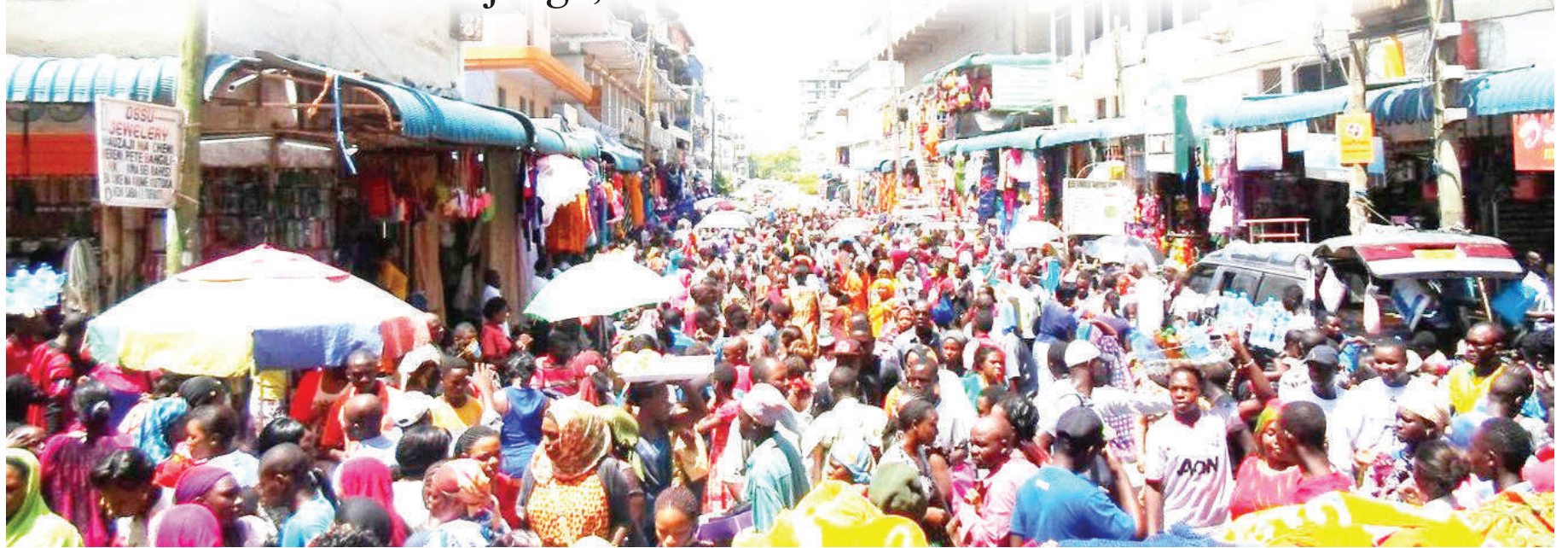
Wananchi wakiwa kwenye pilikapilika katika moja ya mitaa ya eneo la Kariakoo, jijini Dar es Salaam.

• Zabuni yatangazwa kipindi ambacho kuna timu inachunguza usalama wa majengo, wahalifu kitanzini... Endelea Ukurasa 2