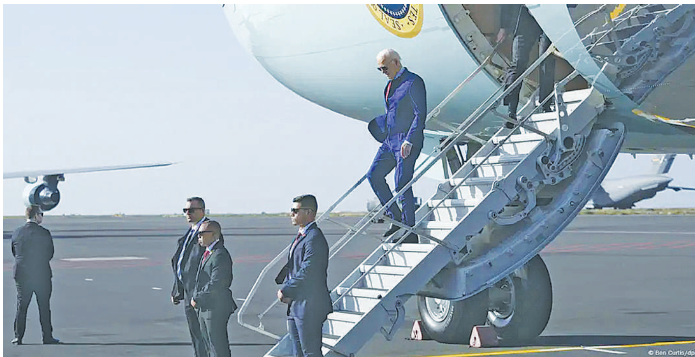
Rais wa Marekani Joe Biden akiwasili Angola, jana.