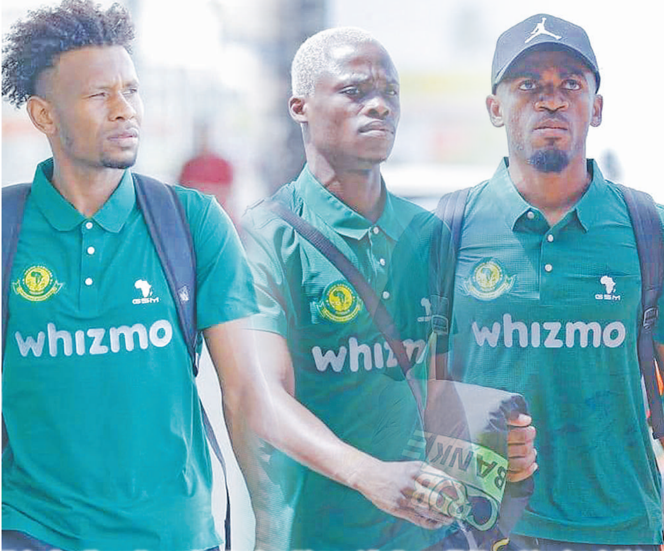
Wachezaji wa Timu ya Yanga wakiwa Uwanja wa Ndege wa Julius Nyerere, jijini Dar es Salaam jana alasiri, tayari kwa safari ya kuelekea Algeria kwa mechi yao ya Kundi A, Ligi ya Mabingwa Afrika dhidi ya MC Alger itakayopigwa Jumamosi saa nne usiku kwa saa za Afrika Mashariki.