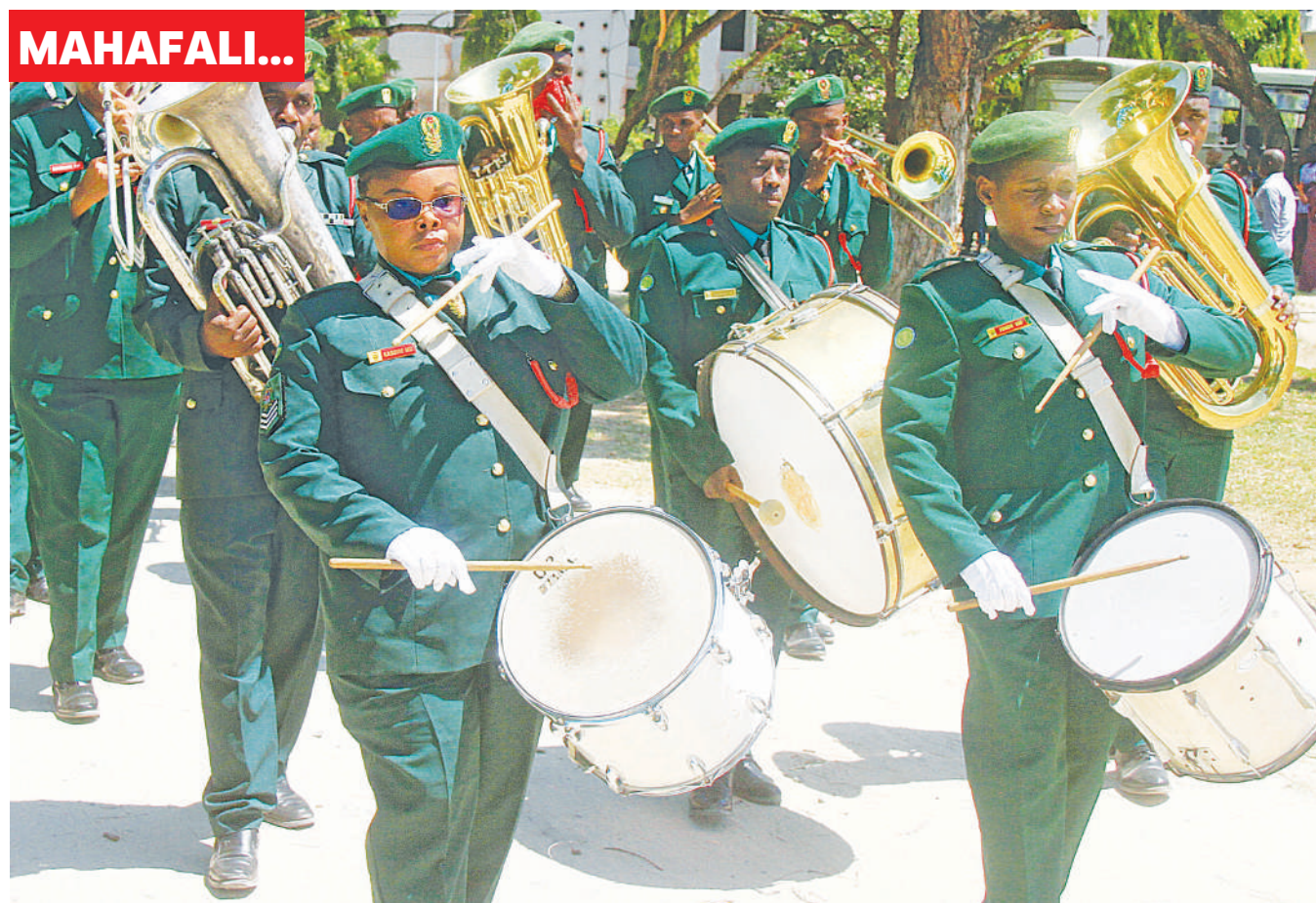
Brasi Bendi ya Jeshi la Wananchi (JWTZ), ikitumbuiza katika Mahafali ya 19 ya Chuo cha Kumbukumbu ya Mwalimu Nyerere, Dar es Salaam hivi karibuni.