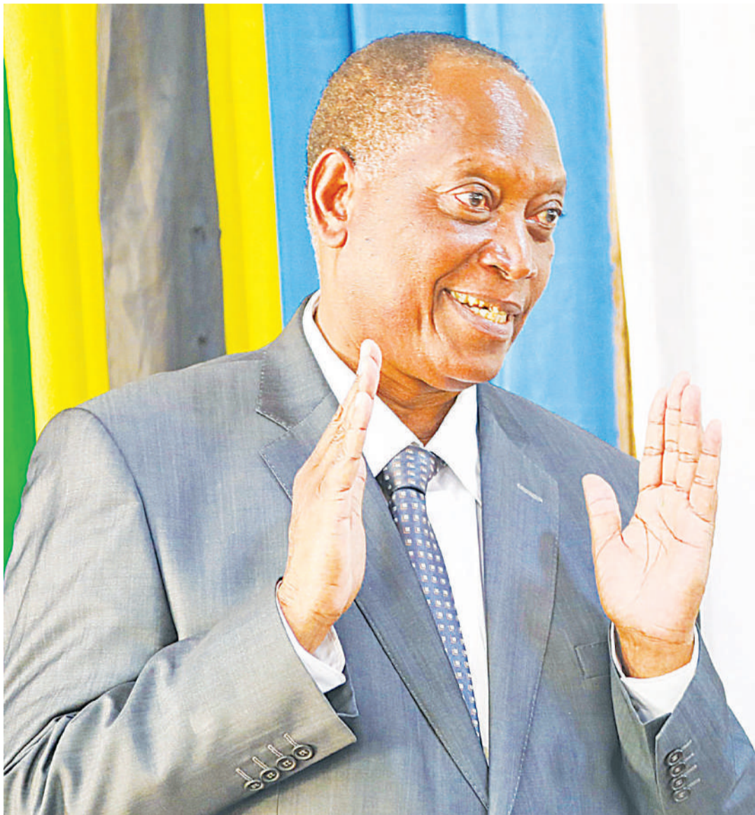
Waziri wa Katiba na Sheria, Prof. Palamagamba Kabudi

Sheria inaeleza ajira haramu ni ile inayomkwamisha mtoto kwenda shule, ni ile inayomwathiri mtoto kimwili na kisaikolojia. Inakuwaje wa-