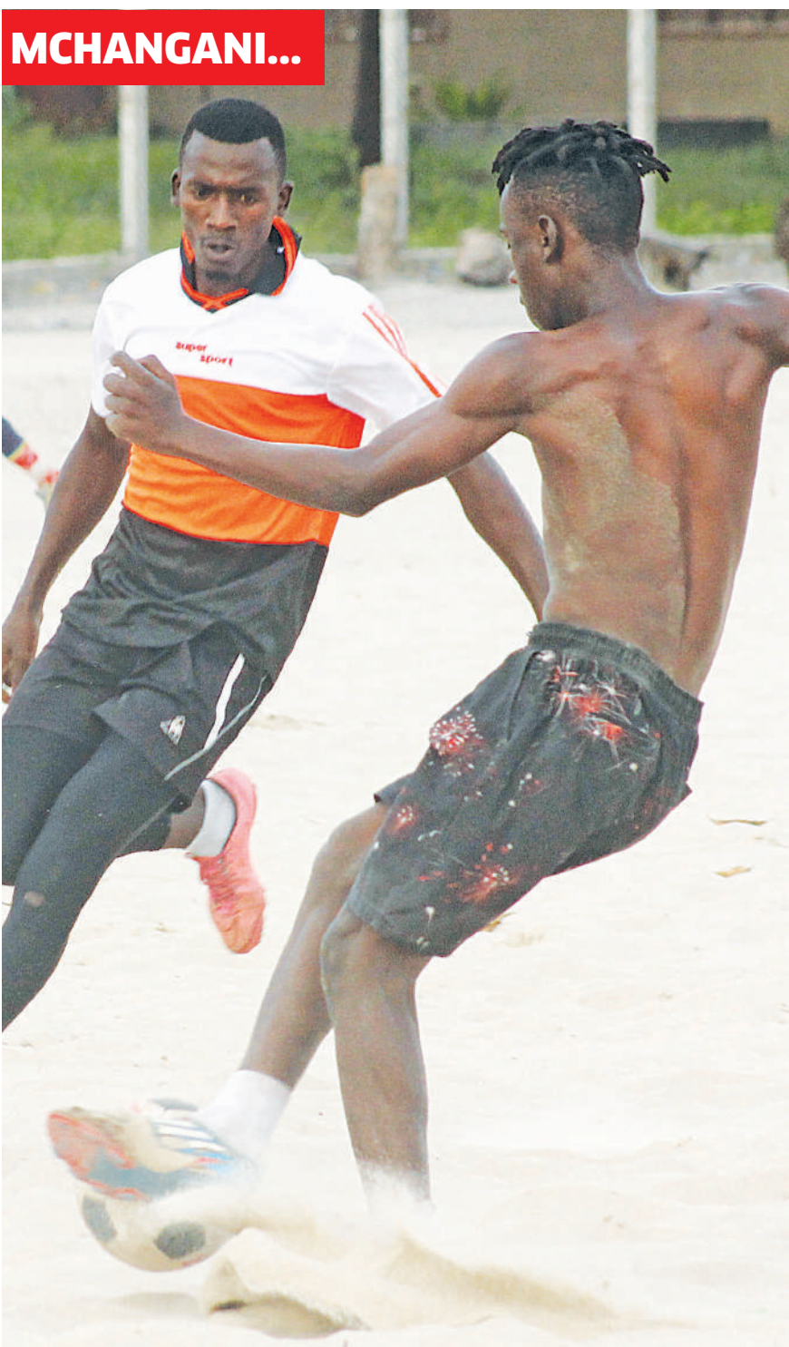
Wachezaji wa timu ya Kitunda ya jijini Dar es Salaam, wakifanya mazoezi katika Uwanja wa Shule ya Msingi Kitunda jana.

Azam imekuwa kwenye kiwango kizuri ambapo kwa sasa inaongoza kwenye msimamo wa ligi ikiwa na pointi 30 baada ya kucheza michezo 13, Simba inashika nafasi ya pili ikiwa na pointi 28, lakini ina michezo miwili pungufu sawa na Yanga inayoshika nafasi ya tatu ikiwa na pointi 27.