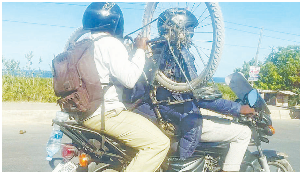
Dereva wa bodaboda akiwa amebeba abiria aliyebeba baiskeli katika Barabara ya Bagamoyo, eneo la Mbuyuni, Dar es Salaam juzi, kitendo ambacho ni hatari kwa usalama barabarani.

Alidai alichukuliwa kwa nguvu na watu sita ambao walimfunga mikono na miguu pamoja na kumfunika uso na baadaye kumpiga sehemu mbalimbali za mwili wake.