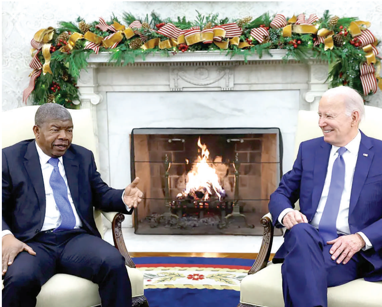
Rais wa Marekani, Joe Biden na Rais wa Angola Joao Manuel Goncalves Lourenco (kushoto) katika Ikulu ya White House, Novemba mwaka jana.