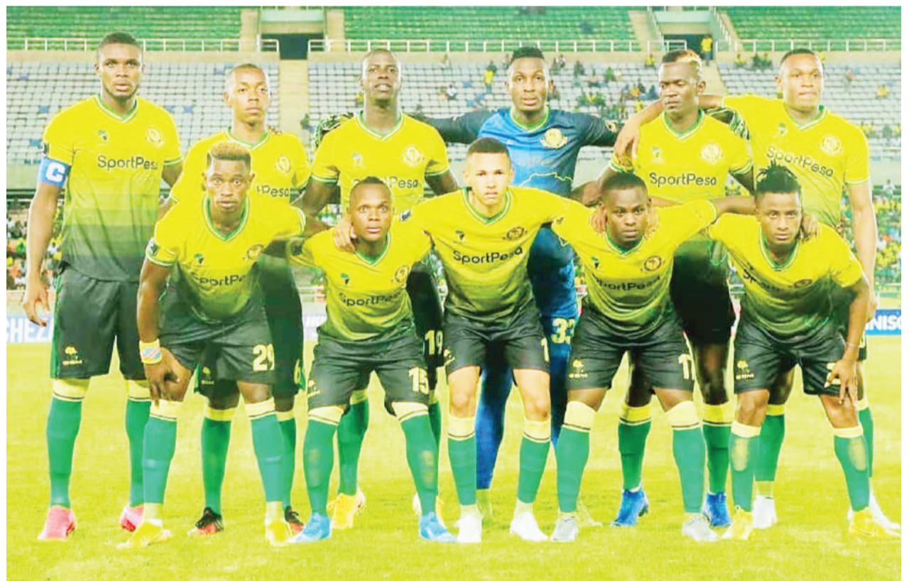
Kikosi cha Yanga kilicholazimishwa sare ya bao 1-1 dhidi ya Namungo FC kwenye Uwanja wa Benjamin Mkapa juzi usiku. Sare hiyo ni ya tatu mfululizo kwa Yanga.

Kwa matokeo hayo ya jana, Namungo inaendelea kushika nafasi ya tisa kwenye msemamo wa Ligi Kuu ikiwa na alama 15 wakati Yanga ambayo imefikisha alama 25 sawa Azam FC iliyopo kileleni, imeshindwa kuwashusha 'Wanalambalama' hao kutokana na kuwa na tofauti nzuri zaidi ya mabao ya kufunga na kufunga.