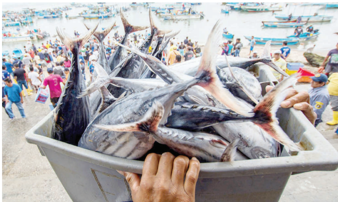
Samaki waliotoka kuvuliwa katika eneo la Santa Rosa de Salinas, nchini Ecuador. Shirika la Chakula na Duniani (FAO), limesema asilimia 95 ya wavuvi wote wapo barani Afrika na Asia katika maadhimisho ya Siku ya Uvuvi Kimataifa, Novemba 21, kila mwaka.

Wakati huohuo TPLF, ilishutumu vikosi vya jeshi kwa kuua raia wakati wa mashambulizi ya anga katika mji wa Adigrat, madai ambayo yamefutuliwa mbali na serikali. RFI