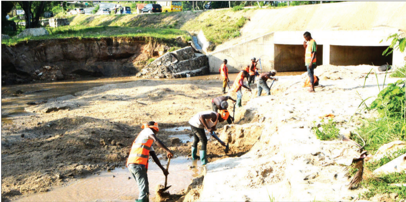
Wafanyakazi wa kampuni ya ujenzi ya Vedma, wakitoa mchanga uliojaa kwenye Mto Tegeta, ili kupanua njia ya maji katika daraja la Goba, barabara ya Madale, jijini Dar es Salaam mwishoni mwa wiki.

Atuganile, alisema shule hiyo ya awali ambayo ina miaka mitatu, aliianzisha kutokana na kuwa na taaluma hiyo na uzoefu kwenye kazi kwa takribani miaka 10. Wizara ya Elimu inawataka wanaoanzisha shule kufuata mwongozo na hatua kadhaa, ikiwamo kuthibitishwa kwa mwenye shule na meneja wa shule, maombi ya usajili na usajili wa walimu, kabla ya kuanzisha shule.