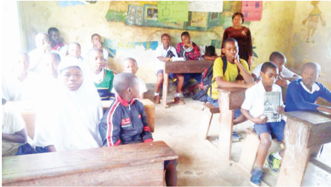
Wanafunzi wa Morogoro wakiwa masomoni.

Anafanua kuwa moja ya darasa la kituo cha watoto wanaoishi kwenye mazingira magumu kina-chomilikiwa na Faraja kimelezimika kusimamiwa na Shule ya Mwere A