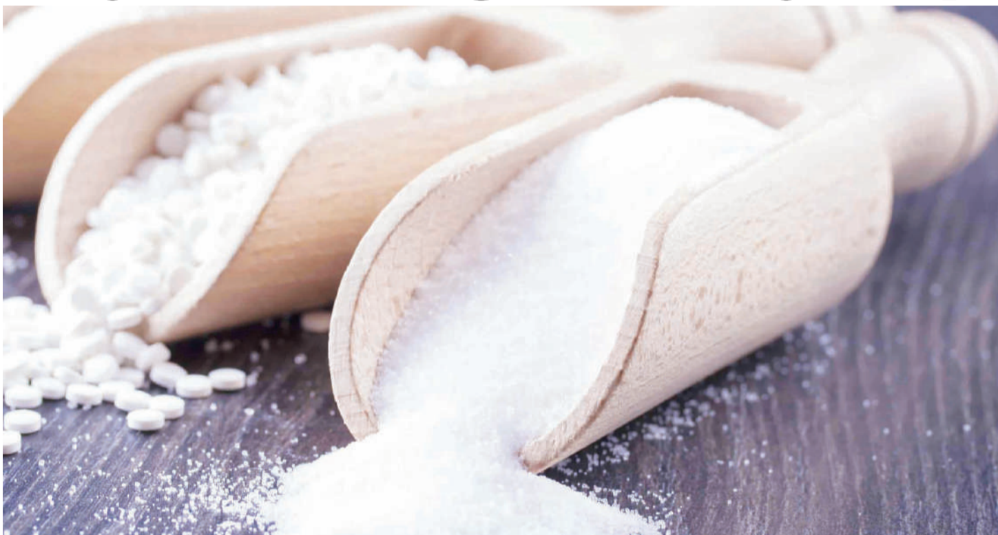
Sukari yenye utamu bandia 'aspartame' inayotumiwa kutengeneza vyakula na vinywaji vya aina mbalimbali inaelezwa kuwa si salama kiafya.

D UNIA ya sasa imejaa bidhaa zenye sukari au utamu bandia ambao huitwa aspartame. Hii ni bidhaa yenye utamu mara 200 ikilinganishwa na sukari hasa ya miwa.