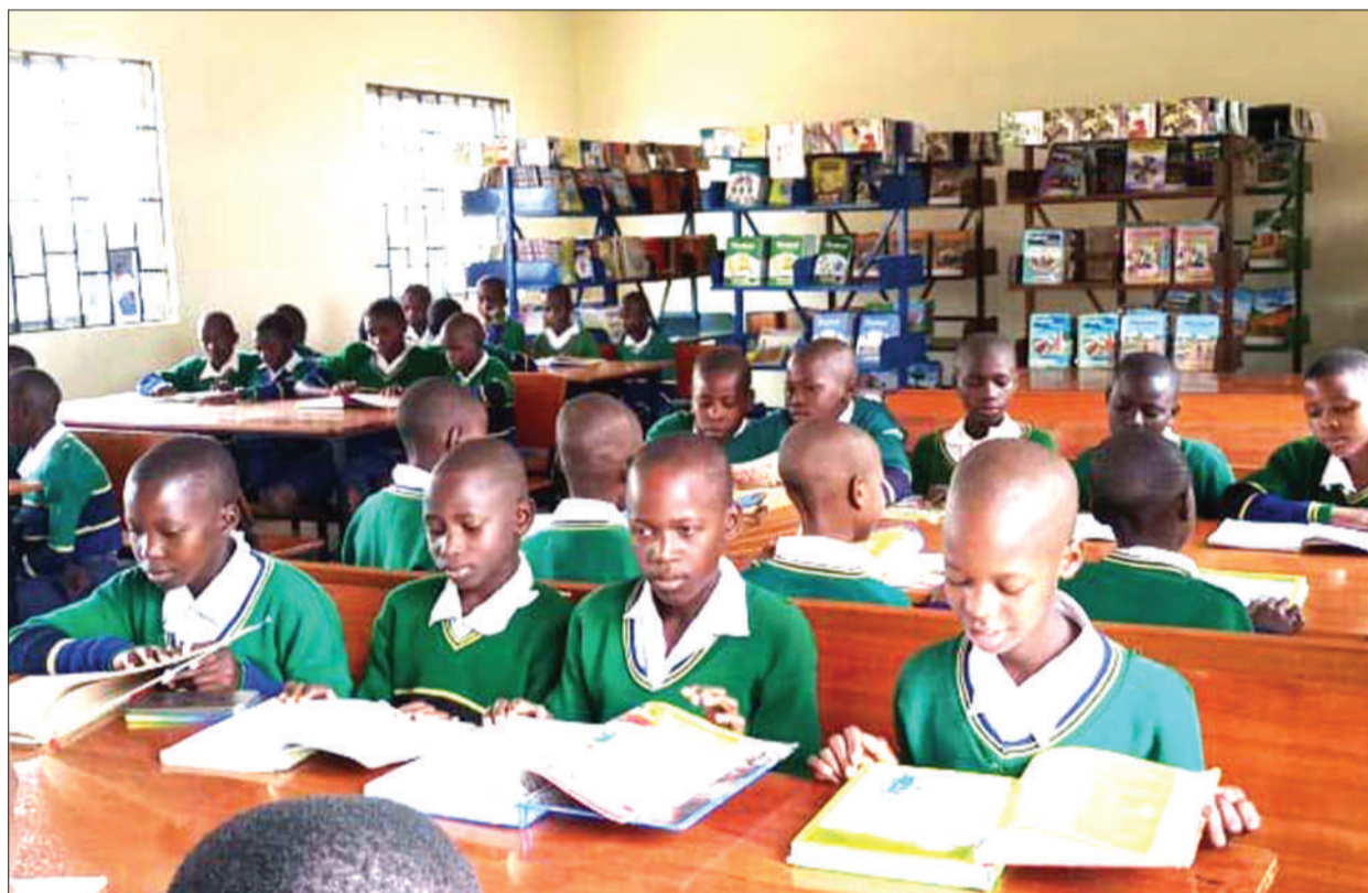
Baadhi ya wanafunzi wa Shule ya Msingi Butata, Kata ya Bukima, Musoma Vijijini mkoani Mara, wakijisomea katika maktaba mpya ya shule hiyo, mwishoni mwa wiki, ambayo imejengwa kwa nguvu za wananchi, mbunge na Shirika la Kimataifa la Maendeleo ya Jamii (PCI).