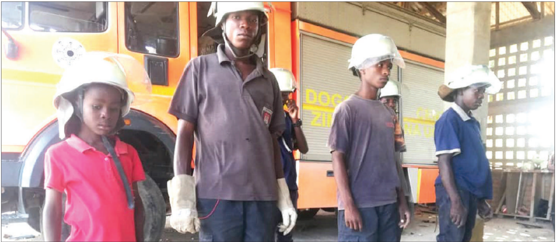
Baadhi ya watoto wa kituo cha kulelea yatima cha Bunju A, wakiwa katika shughuli mbalimbali wanazofundishwa kituoni hapo.