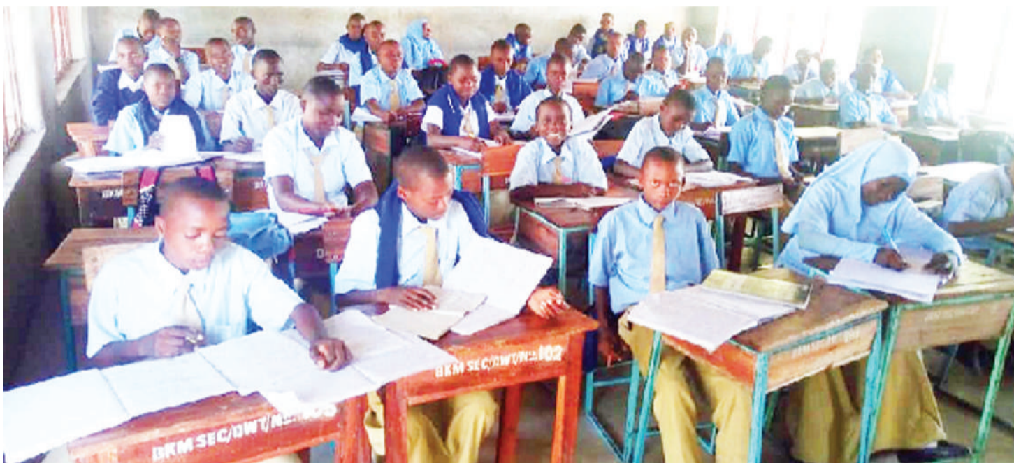
Baadhi ya wanafunzi wa Shule ya Sekondari Bukima wakiendelea na masomo darasani.

B AADA ya awamu ya tano kuanza kugharamia elimu kuanzia darasa la awali hadi sekondari ni hatua inayoendana na ongezeko kubwa la wanafunzi kuanzia usajili shule ya msingi hadi kuingia vyuo vikuu.