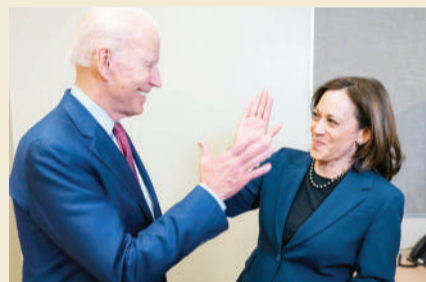
Rais mteule wa Marekani, Joe Biden akiwa na Makamu wake, Kamala Harris.