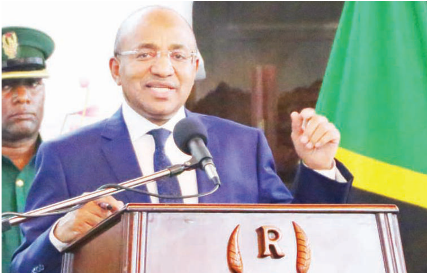
Rais Hussein Ali Mwinyi.