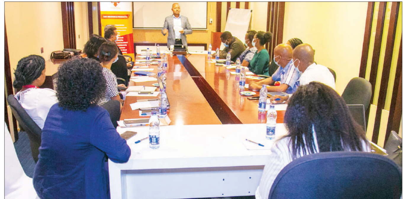
Washiriki wa mafunzo ya mfumo wa 'smart health', yanayotolewa na Shirika la Bima la AAR, unaolenga kuboresha huduma kwa wateja na utendaji katika sekta hiyo wakipata mafunzo hayo jijini Dar es Salaam jana.

Hatua ya Kampuni ya AAR Insurance kuanzisha mfumo wa smart health unaakisi jitihada za dunia katika kufanikisha mfumo wa bima ya afya unaotolewa moja kwa moja kwa njia ya mtandao (eHealth System).