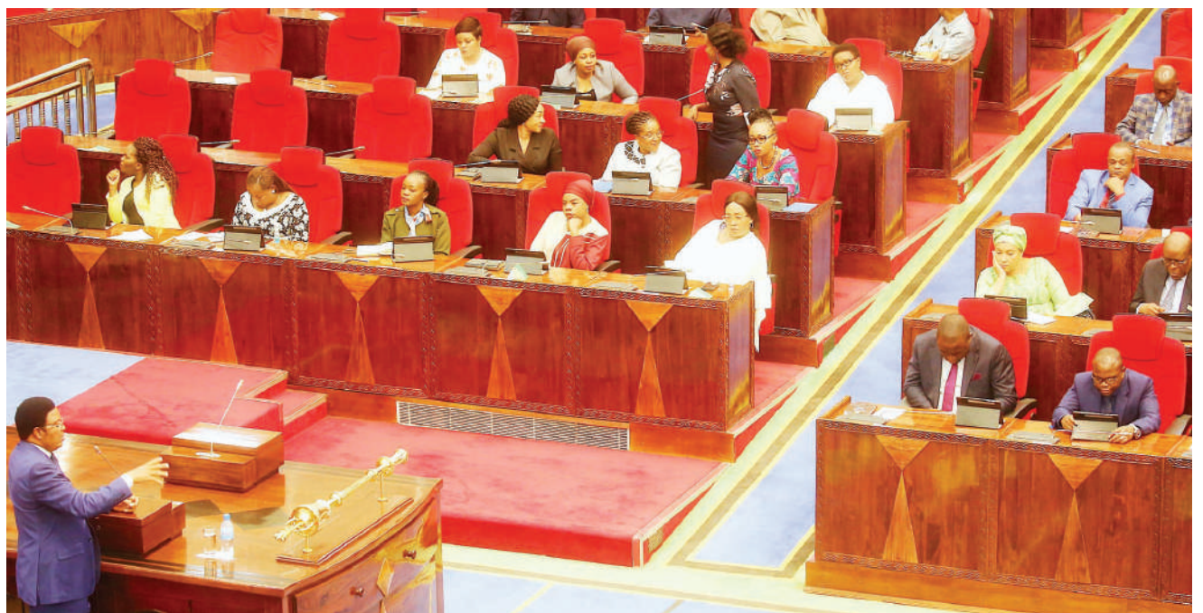
Waziri Mkuu, Kassim Majaliwa, akijibu maswali ya wabunge katika kipindi cha Maswali kwa Waziri Mkuu, Bungeni jijini Dodoma, jana.

Kadhalika, imevishauri vyombo vya habari vitumie taarifa rasmi inayotolewa na TMA kufikisha taarifa kwa wananchi ili kusaidia kuepuka maadhara yanayoweza kutokea.