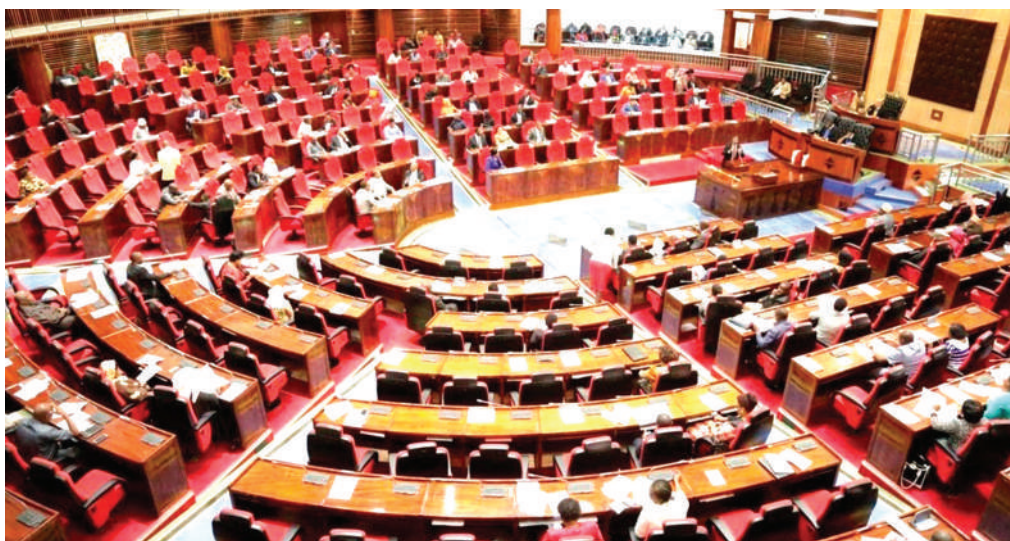
Kikao kimojawapo cha Bunge kilipoendelea.

Yako maeneo ambako kutakuwa na mabadiliko katika mpangilio wa bajeti na utawala wa fedha kutoka vyanzo mbalimbali na hasa kutoka mashirika ya nje au nchi wafadhili.