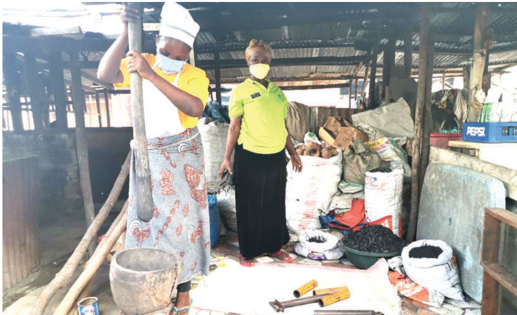
Wanakikundi cha Fahari Yetu wakiwa kazini. Chini, bidhaa yao makaa ya mawe.

Kikundi pia kinatengeneza mkaa unaotokana na taka za vifuu, ikinufaisha kikundi na mwa-