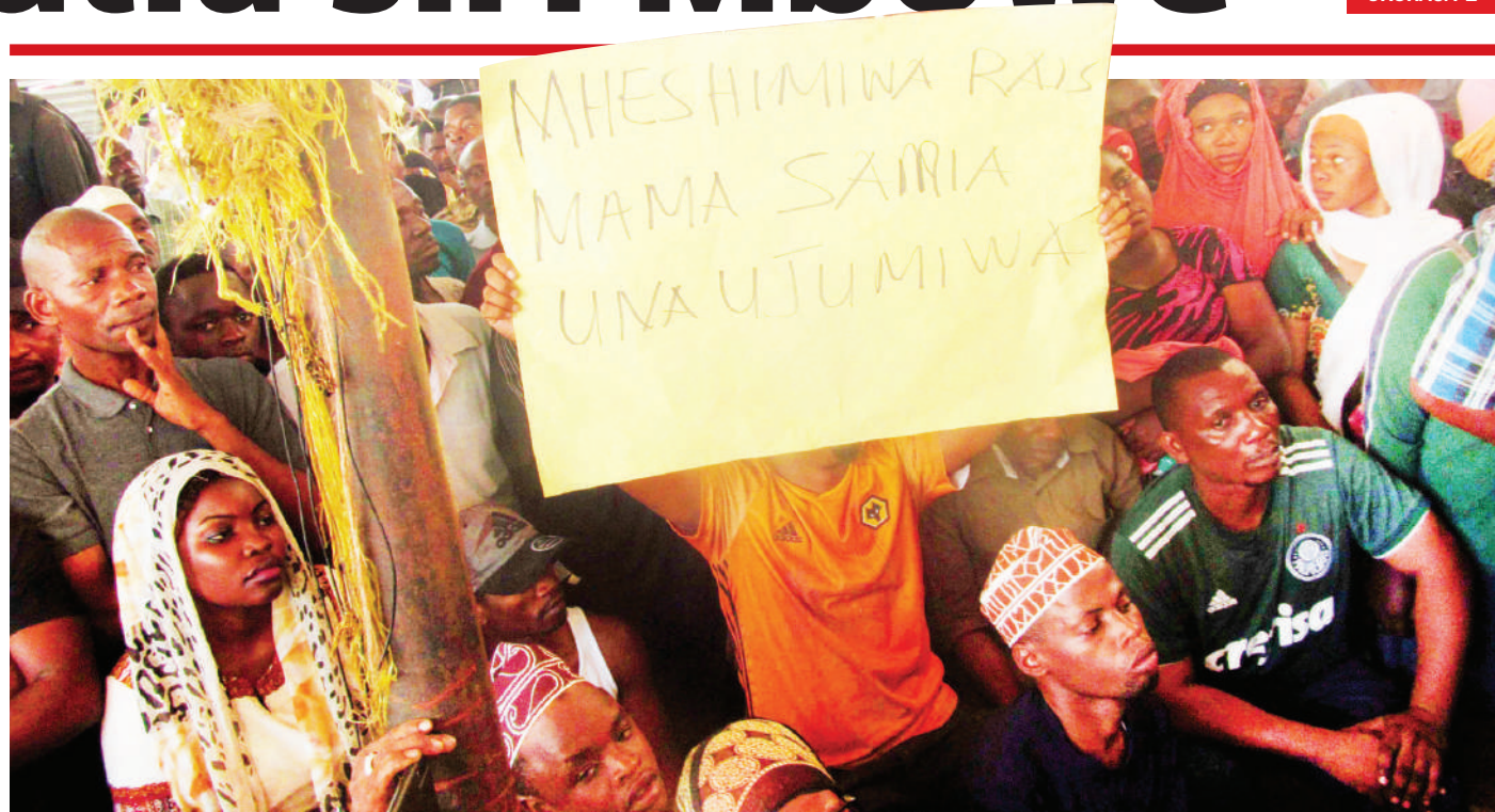
Wafanyabiashara wa soko dogo la Kariakoo, jijini Dar es Salaam, wakiwa katika mkutano jana, kwa ajili ya kujadili hatima yao baada ya kutakiwa kuhama, ili kupisha ujenzi wa ghorofa.