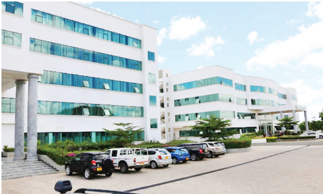
Sehemu ya Hospitali ya Benjamin Mkapa, Dodoma.

“Upasuaji hufanya kwa kuondoa nyumba ya uzazi na matezi ambayo yapo kwenye nyonga na kuondoa sehemu ya juu ya uke (Radical Hysterectomy).”