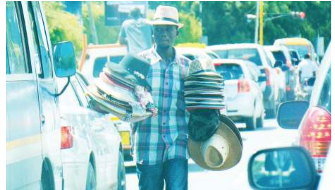
Machinga akinadi kofia katikati ya Barabara ya Ali Hassan Mwinyi, eneo la Daraja la Selander, jijini Dar es Salaam jana.