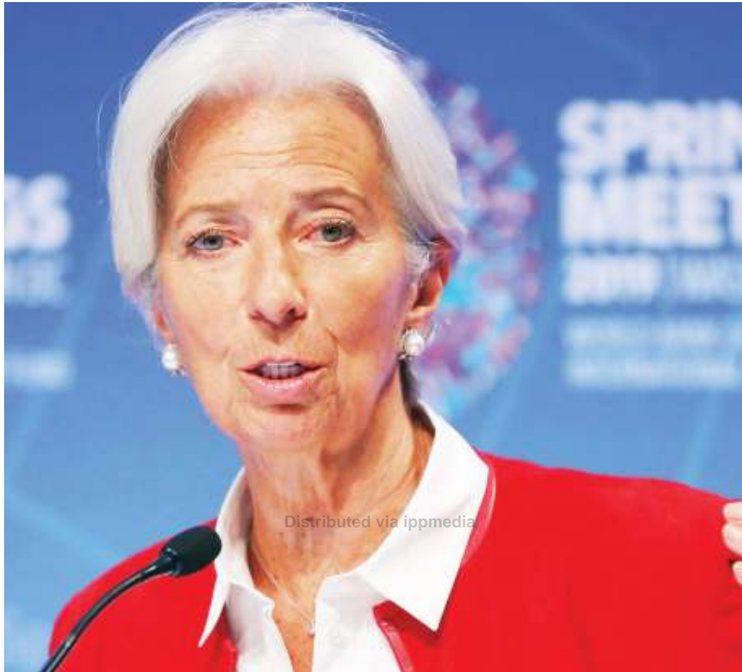
Christine Lagarde; Mkurugenzi Mtendaji wa IMF anayeondoka.

Alithibitisha kuwa kati ya sarafu mtandao 1,600 zilizokuwa sokoni tayari, nyingi tu zitayeyuka katika mchakato wa kuchuja pale sarafu kubwa na muhimu zikianza kujithibitisha katika soko.