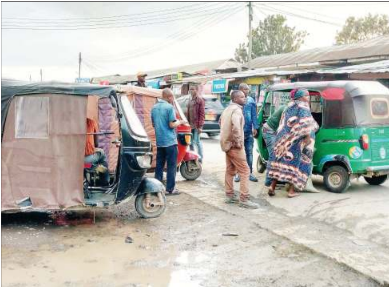
Vijana wa Bajaj wakieleleza na harakati za kubeba abiria katika kituo walichotengewa cha Kabwe jijini Mbeya juzi, eneo ambalo hujaa maji nyakati za mvua.