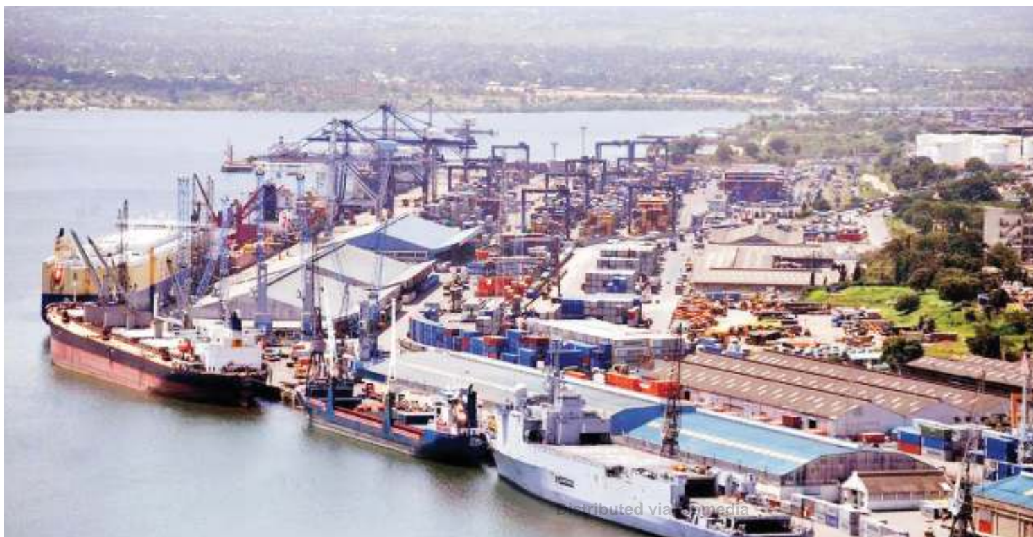
Mandhari ya Bandari ya Tanga.