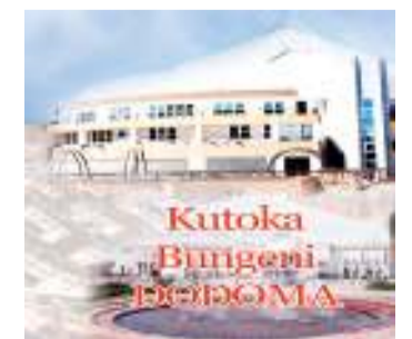
Habari zote na Augusta Njoji, DODOMA

Bashungwa alisema wizara imeweka msukumo wa pekee katika kuhamasisha ujenzi wa sekta Binafsi ya Kitanzania iliyo imara ili iweze kushiriki na kuchangia ipasavyo katika ujenzi wa uchumi wa viwanda na hatimaye kushiriki ipasavyo katika kutoa ajira.