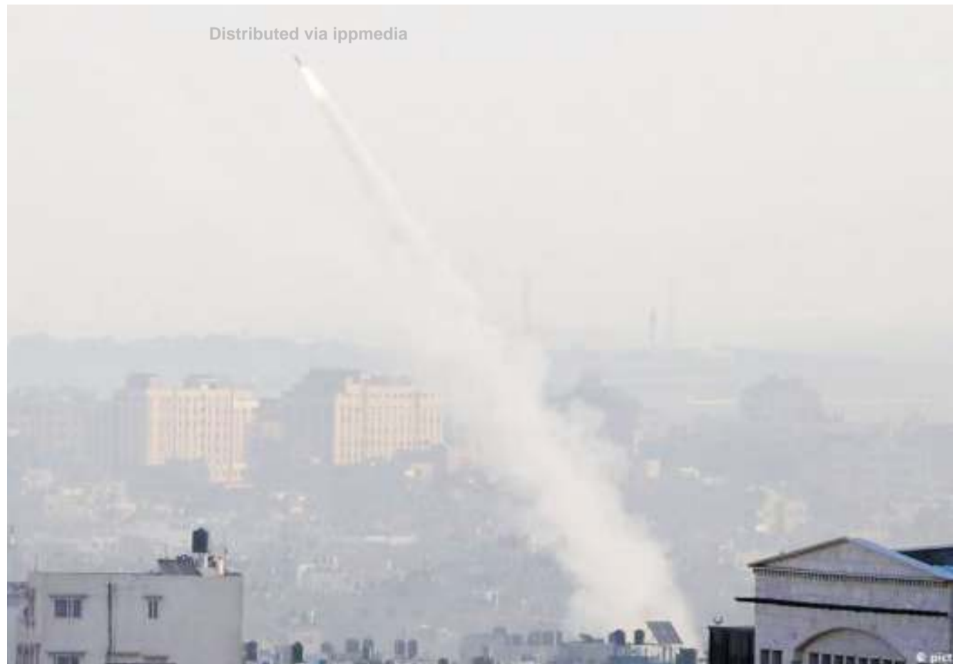
Moja ya makombora yaliyotikisa Ukanda wa Ghaza.

Aidha, kujitenga kwa kundi la wanamgambo la Hamas ambalo ni kubwa na lenye nguvu zaidi kuliko kundi la Islamic Jihad katika maafikiano hayo ya kusitisha mapigano, kumetafsiriwa kuwa sio mwisho wa vita kati ya Israel na makundi ya wanamgambo. DW