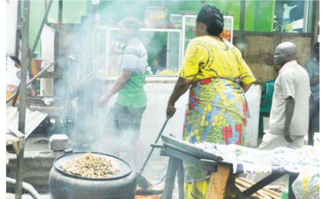
Mama mkaanga samaki akiandaa kitweo hicho, kwaajili ya wateja wake, kando ya Barabara ya Mabibo, eneo la Urufiki, jijini Dar es Salaam jana.