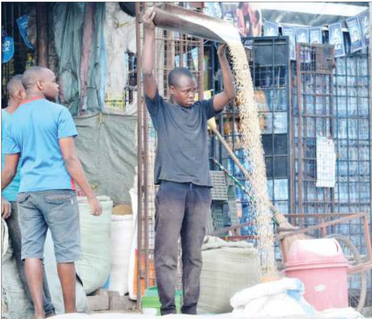
Kijana akipepeti mchele na kutoa uchafu ili kuuweka kwenye hali ya usafi wakati akisubiri wateja, katika eneo la Mburahati, jijini Dar es Salaam jana.