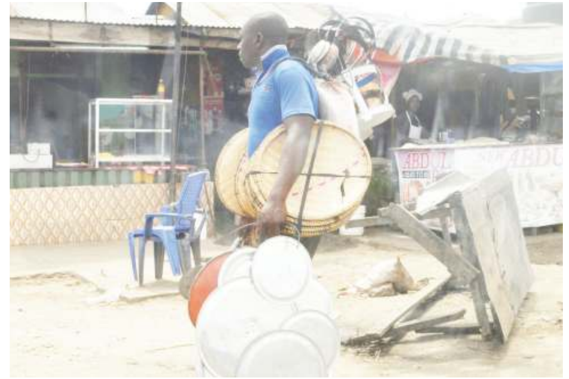
Mchuzi akitembeza bidhaa zake, katika eneo la Mabibo, jijini Dar es Salaam jana.