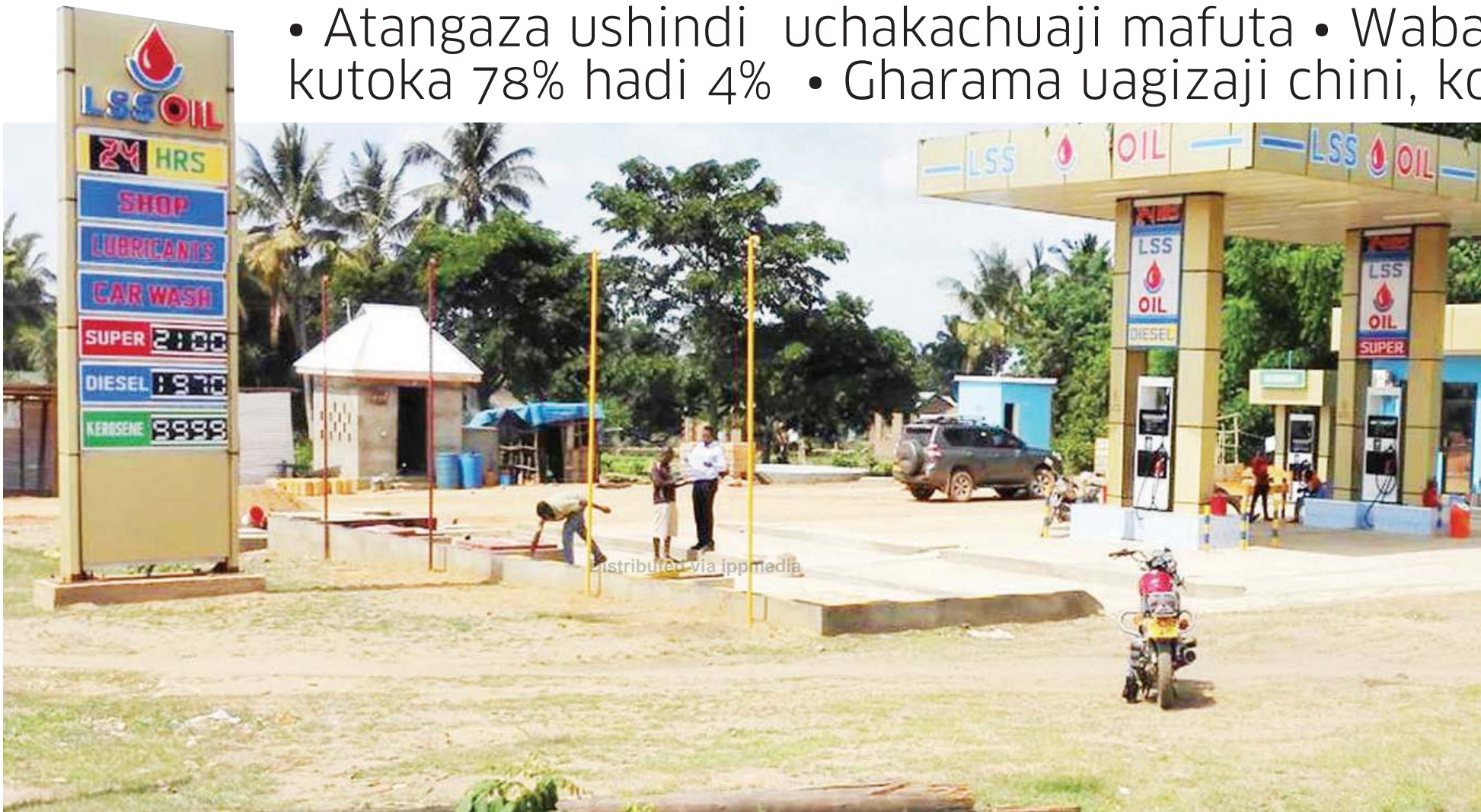
Kituo cha mafuta ambacho kimejengwa maeneo ya vijijini.

• Atangaza ushindi uchakachuaji mafuta • Waba kutoka 78% hadi 4% • Gharama uagizaji chini, ko