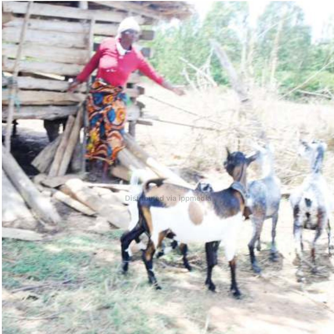
Auleliya akitoa mifugo kwenye banda.

"Hali ya maisha ilianza kubadilika kidogo, mawazo hasa niliyokuwa napata juu ya chakula cha watoto yaliisha. Kabla ya hapo,