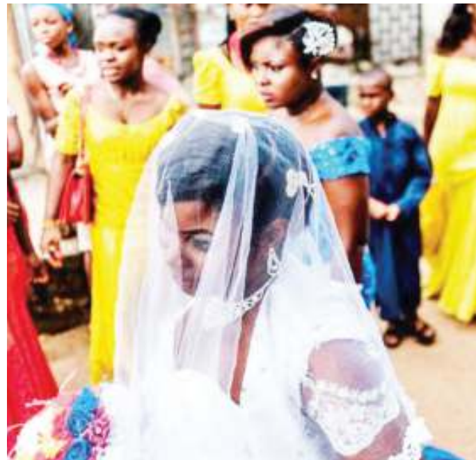
Shughuli za harusi zikiendelea nchini Nigeria.

Ni takribani miezi minne sasa hakuna ndoa iliyo- fungwa katika kijiji kimoja la jimbo la Kano, nchini Nigeria tangu chifu wa eneo hilo kuanzisha malipo ya kodi ya harusi.