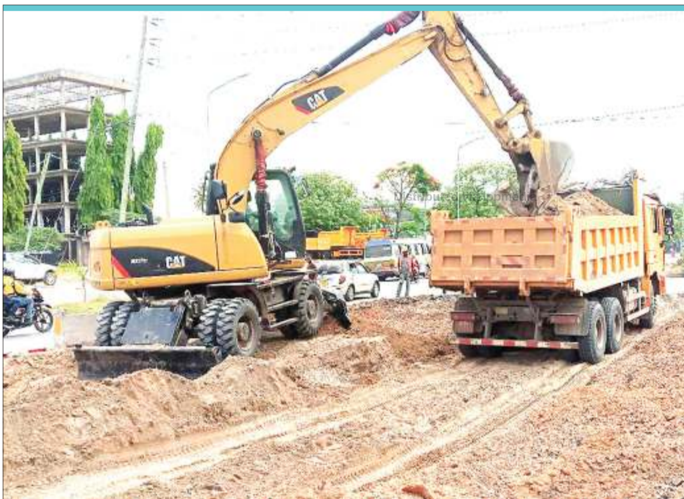
Ujenzi wa barabara ya mwendokasi kutoka Gerezani kwenda Mbagala, jijini Dar es Salaam, inayojengwa na mkandarasi kutoka China ukiteendelea katika Barabara ya Kilwa, eneo la Jitegemee, juzi.