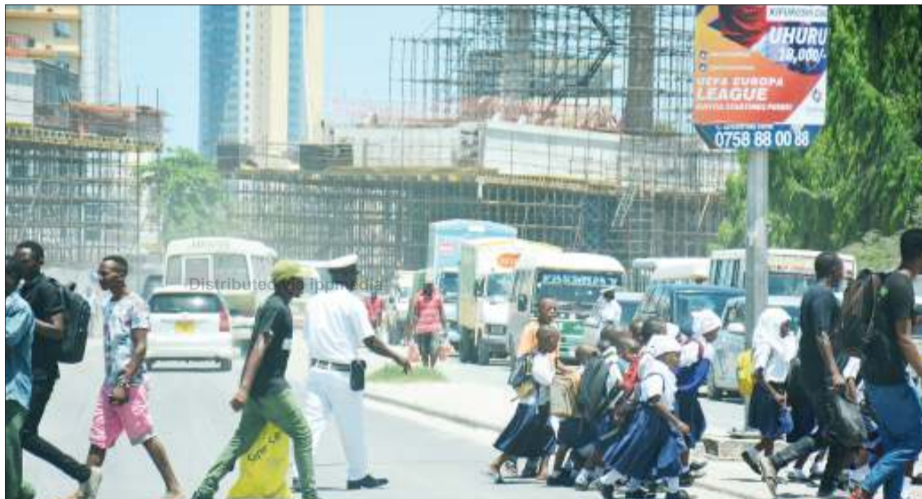
Askari wa Kikosi cha Usalama Barabarani, akiwawusha barabarani wanafunzi wa shule ya msingi katika eneo la Kamata, Kata ya Gerezani, jijini Dar es Salaam jana.