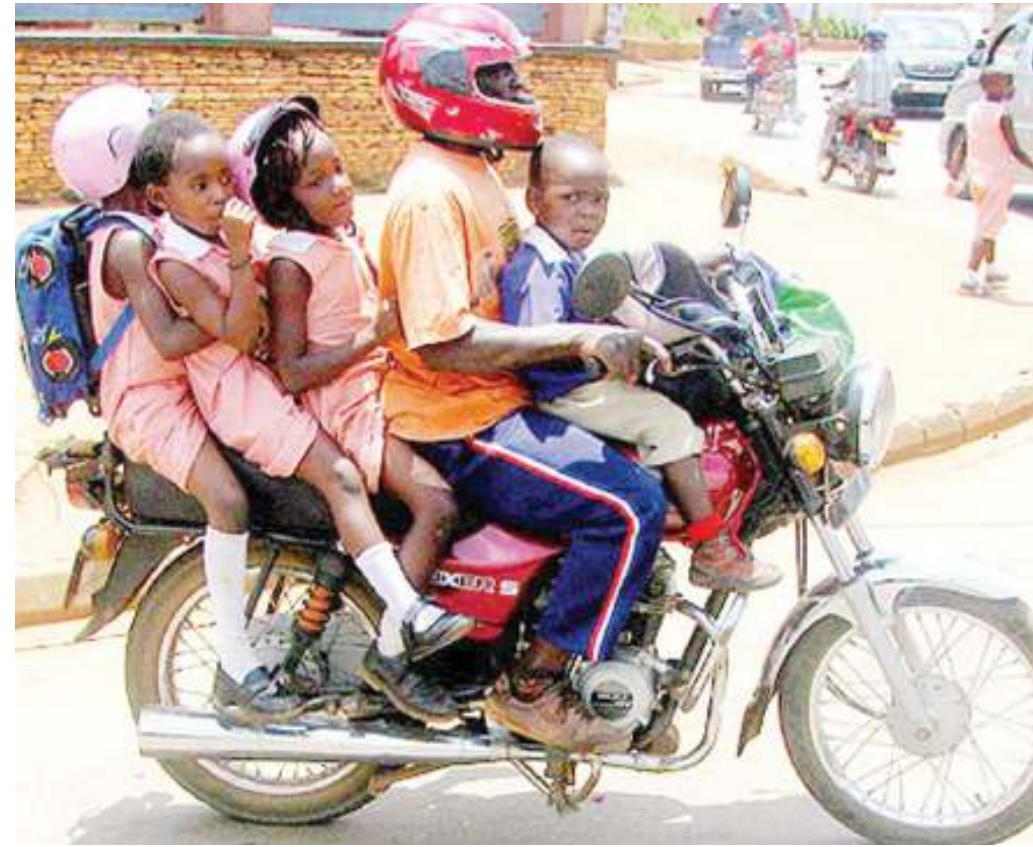
Picha halisi ya maisha ya barabarani yanayozaa kilio kutoka kwa madereva na abiria wa boda boda.

• Kila kukicha mpya kibao kila mahali • Neno usalama barabarani kwao 'sifuri' • Wajipanga 'chamoto' matajiri, madereva