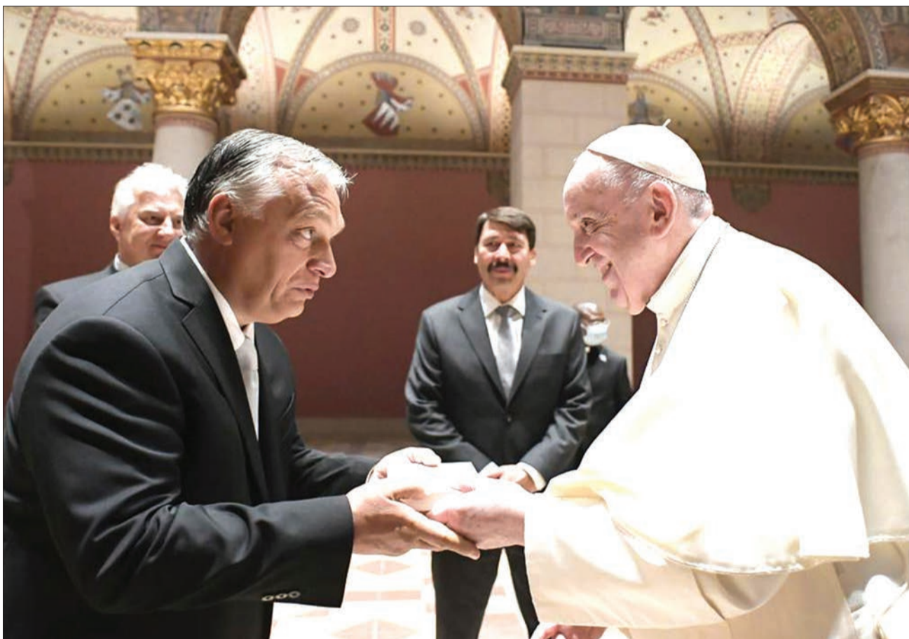
Kiongozi Mkuu wa Kanisa Katoliki Duniani, Papa Francis, akisalimiana na Waziri Mkuu wa Hungary Viktor Orban, wakiwa eneo la makumbusho ya sanaa Budapest, jana. Ikiwa ni ziara ya kwanza kwa Papa Francis kusafiri nje ya nchi tangu alipofanyiwa upasuaji mkubwa wa tumbo, Julai mwaka huu nchini Italia.