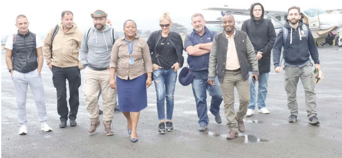
Mawakala wa utalii kutoka nchini Georgia wakiwasili Uwanja wa Ndege wa Arusha kutembelea vivutio vya utalii vilivyoko mashariki mwa Tanzania, ikiwa ni hatua za awali za kukamilisha mchakato wa kuanza kuleta makundi ya watalii kutoka nchi hiyo.

Alisema madhumuni makubwa ya kufanya sensa ya watu na makazi ni kupata takwimu za msingi za watu na hali ya makazi ambazo zitasaidia kutunga sera na kupanga mipango ya maendeleo ya kimkakati inayolenga kukuza usatawi wa nchi na watu wake. “Takwimu hizo pia hutumika kupima kiwango cha maendeleo kilichofikiwa pamoja na kuandaa miongozo itakayotumika katika kutayarisha mipango ya maendeleo ya muda mfupi na muda mrefu,” alisisitiza Mtaka.