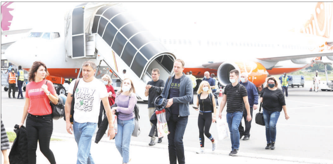
Baadhi ya watalii wakiteremka katika ndege ya Shirika la Sky up Airline kutoka Ukraine ikiwa na watalii 215 liyowasili juzi, katika Uwanja wa Ndege wa Kimataifa wa Abeid Amani Karume kwa ajili ya kufanya shughuli za utalii Zanzibar.

Kwa upande wao watalii hao, walisema kuwa wamefika Zanzibar kwa sababu imekuwa ikisifika sana kuwa na vivutio vingi, zikiwamo fukwe nzuri pamoja na mandhari yake.