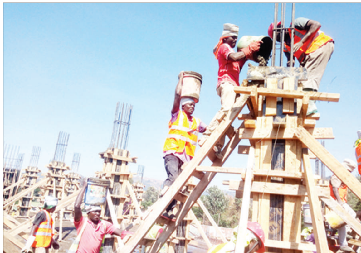
Baadhi ya mafundi wanaojenga jengo la Ofisi ya Mkuu wa Mkoa wa Mbeya wakien- delea na ujenzi wa nguzo mwishoni mwa wiki.

Alisema kwa sasa barabara hizo zinajengwa kwa kiwango cha changarawe, lakini baada ya muda sio mrefu zitaingizwa kwenye mfumo wa ujenzi kwa kiwango cha lami. "Hii barabara tunataka izungukie Iziwa, Nsoho mpaka Itagano, lakini itaendelea mpaka kwenye Kata ya Iwambi na itatumika kama njia ya mkato kwenda Mbalizi," alisema Chalamila.