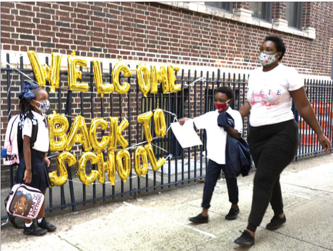
'Karibu tena shule' ni ujumbe uliopo kwenye wigo wa Shule ya PS 245 Brooklyn, jijini New York nchini Marekani, huku watoto wakiwasili shuleni kwa kusindikizwa na wazazi wao, juzi. Shule za umma zimefunguliwa na kuwarudisha mamiliononi wa wanafunzi jijini humo, baada ya kufungwa kwa kipindi kirefu kutokana na corona.