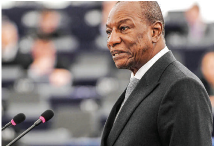
Aliyekuwa Rais wa Guinea, Alpha Conde.

“ Mkiangalia hali za barabara zenu, hospitali zetu utajua kuwa huu ndiyo wakati wa kuamka na kufanyakazi. Tuamke na tulitete taifa letu.