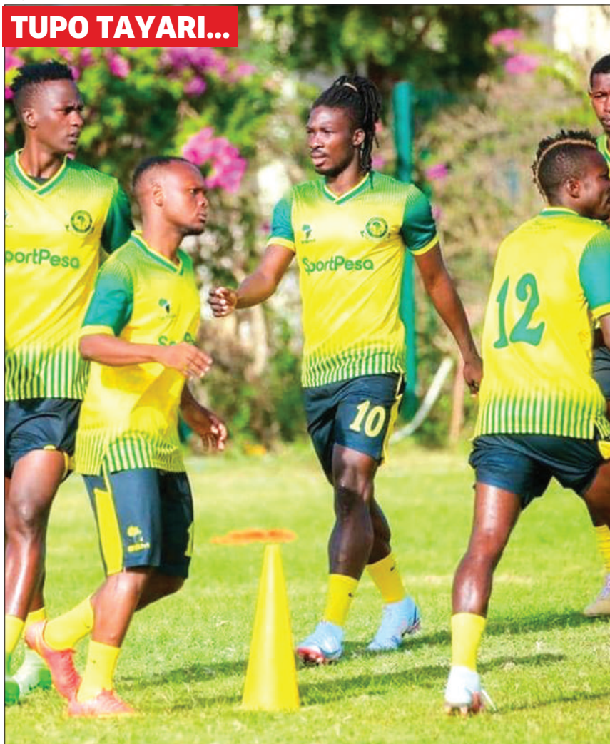
Wachezaji wa Yanga wakiendelea na mazoezi katika kambi ya timu hiyo, Avic Town, Kigamboni nje kidogo ya Jiji la Dar es Salaam.

timu hiyo inatarajia kwenda Nigeria Ijumaa kwa ndege ya kukodi ya Air Tanzania na wametoa nafasi ya mashabiki 48.