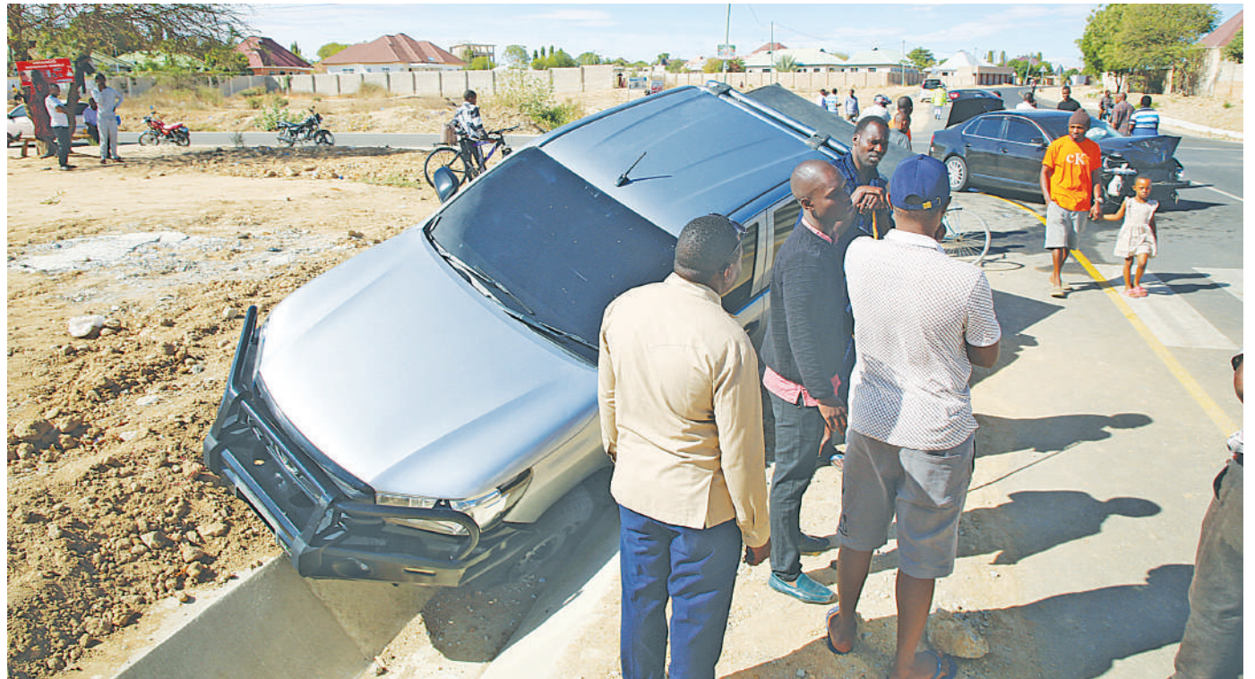
Baadhi ya wananchi wakiangalia magari yaliyopata ajali baada ya kugongana katika eneo la Kisasa, jijini Dodoma jana. Hakuna mtu aliyejeruhiwa.

"Hawa ni jamii ya wafugaji ambao wao hawataki kujenga vyoo hivyo wakaamua kuwapiga wataalam wetu ambapo huyu mmoja alianguka wakati akikimbia na kumvunja taya zake na hivi sasa amelazwa katika hospitali ya rufaani ya mkoa wa Dodoma" alisema.