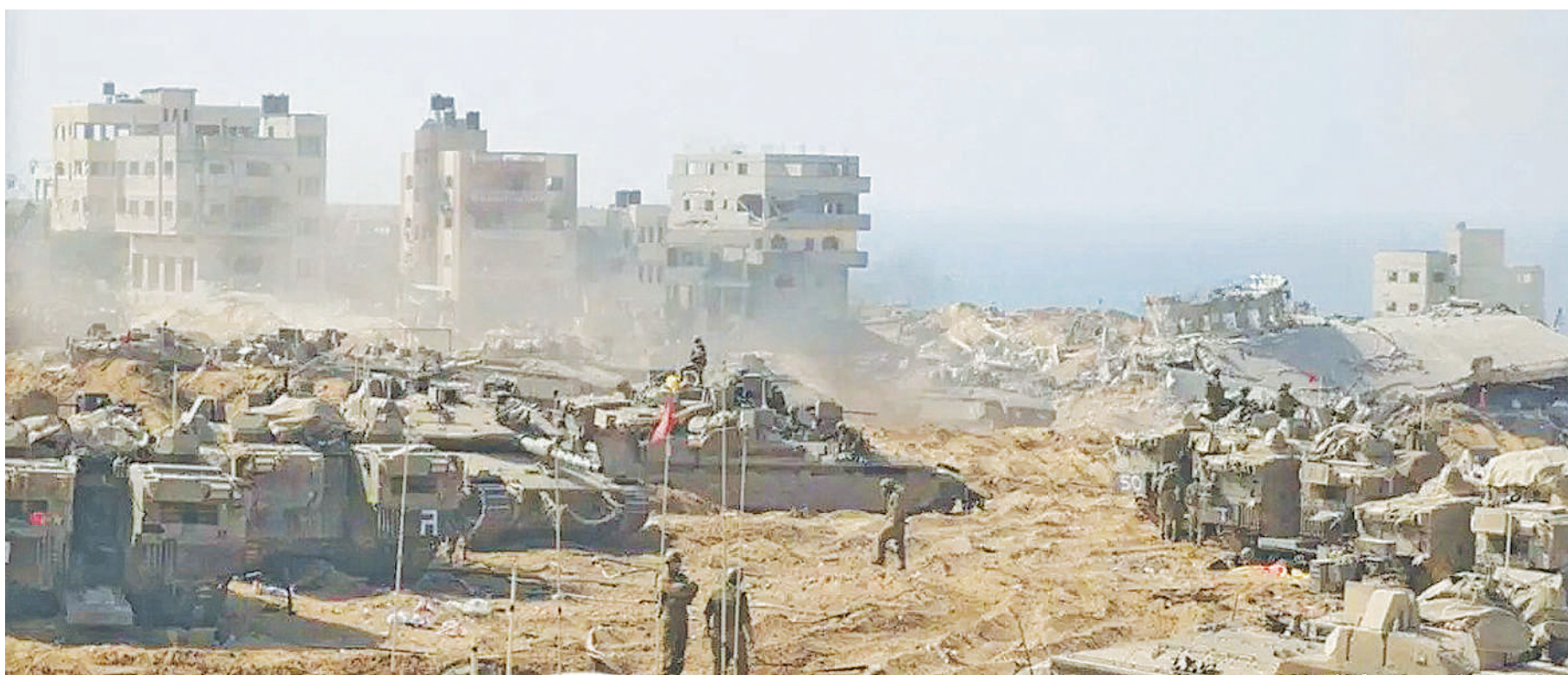
Vifaru vya Jeshi la Israel vikiwa vimeenea katika maeneo ya Gaza kutokana na vita vinavyoendelea.

BBC "Nilikuwa katika usingizi mzito kwa sababu sikuwa nimelala siku zilizopita," aliambia BBC. BBC