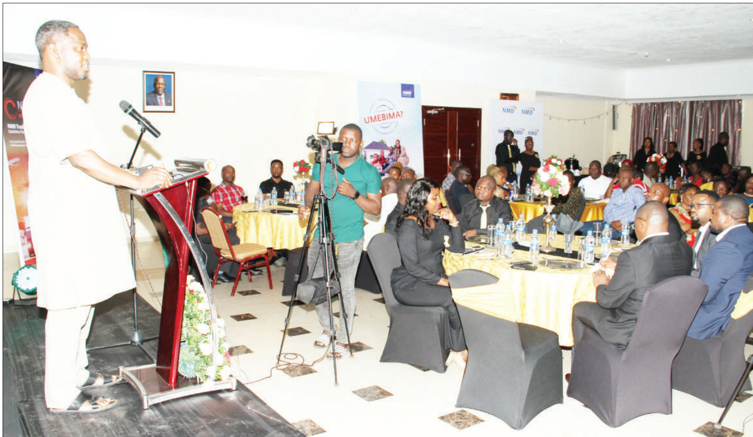
Mkuu wa Mkoa wa Mtwara, Gelasius Byakamwa, akizungumza wakati wa Kongamano la wafanyabiashara wakubwa na wa kati lililofanyika mkoani Mtwara jana. Benki ya NMB ilikutana na zaidi ya wafanyabiashara 900 kutoka mikoa ya Kusini wa lengo la kuboresha uhusiano.

Vile vile, alisisitisa suala la kuboresha miundombinu ya barabara katika jimbo hilo ili barabara ziwewe kupitika katika kipindi chote cha masika na kiangazi.