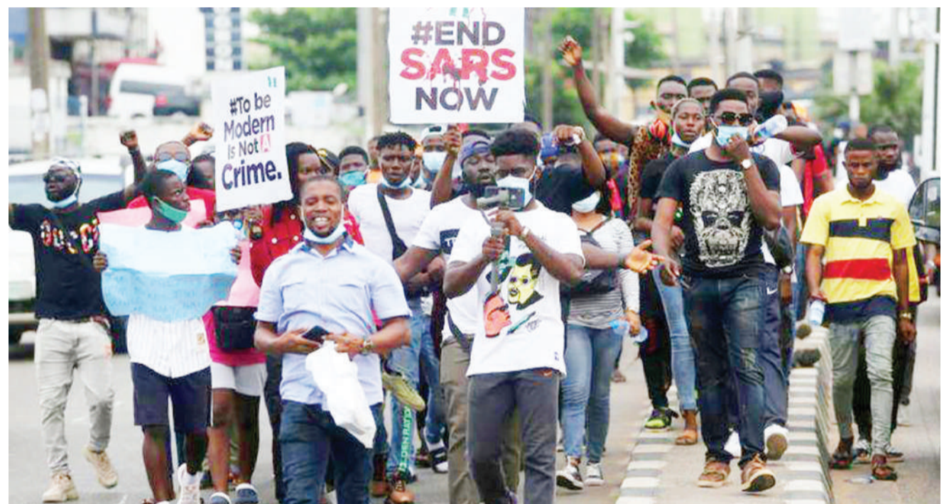
Waandamanaji nchini Nigeria kupitia kampeni yao maarufu kama 'Kampeni ya End Sars', wakipinga vitendo vya ukatili vinavyofanywa na Jeshi la Polisi.

Taifa hilo la Afrika Magharibi limekumbwa na vipindi kadhaa vya machafuko ya kisiasa tangu lilipopata uhuru wake kutoka kwa Ufaransa mwaka 1958, mara nyingi machafuko hayo huchochewa na migogoro ya kikabila. DW