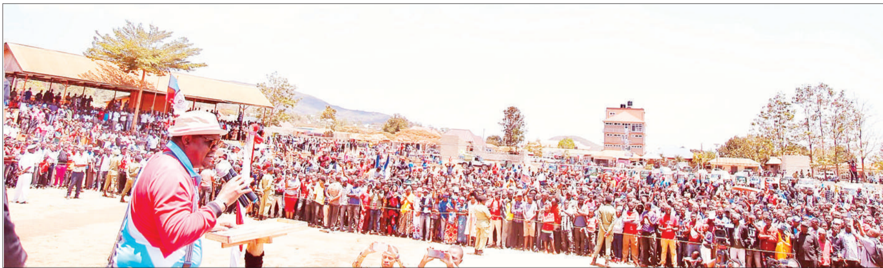
Mgombea wa Urais kupitia CHADEMA, Tundu Lissu, akihutubia mkutano wa kampeni katika viwanja vya Raha, Wilaya ya Babati, mkoani Manyara jana.