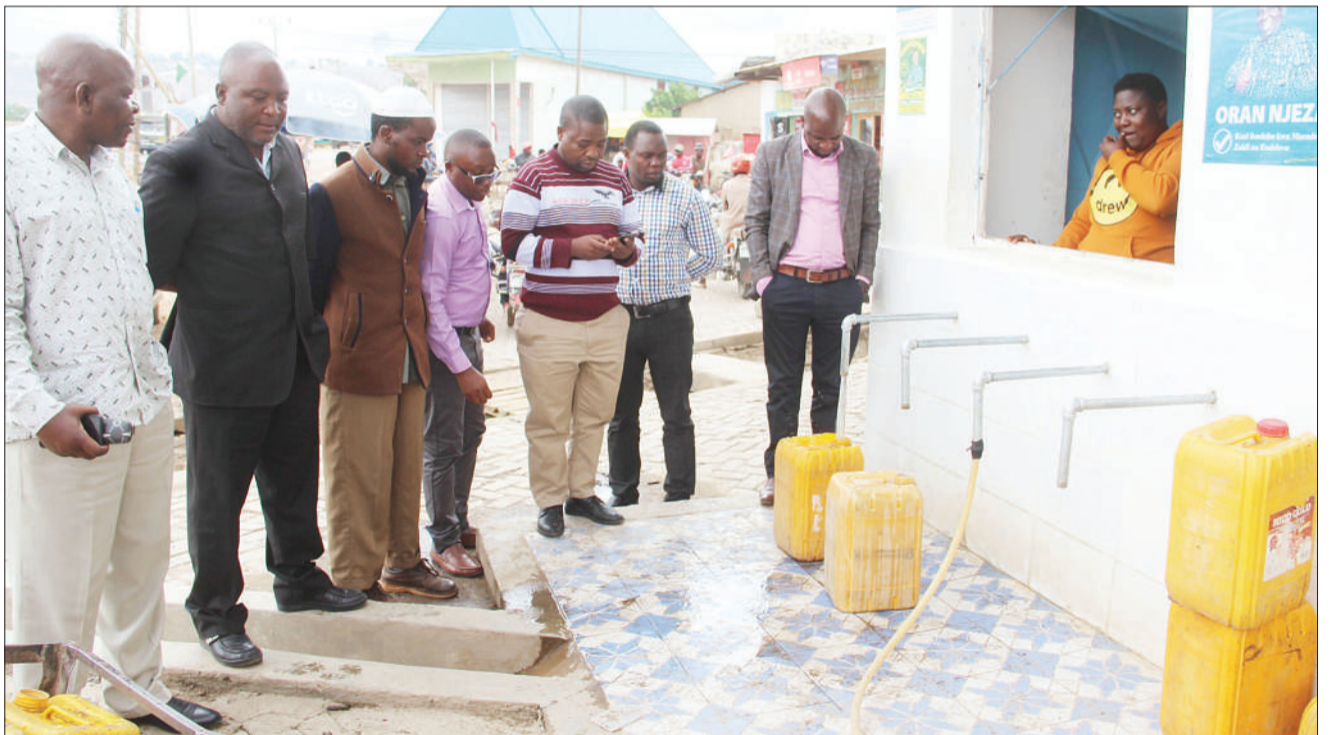
Maofisa kutoka Wizara ya Maji, Mamlaka ya Majisafi na Usafi wa Mazingira Mbeya (Mbeya-WSSA) pamoja na wa Mamlaka ya Maji mjini na vijijini (RuWasa) wa mkoa wa Mbeya, wakikagua moja ya vituo vya kuuzia maji katika Mamlaka ya Mji Mdogo wa Mbalizi mwishoni mwa wiki.

Alisema vitendo hivyo vinakwamisha jitihada za Mamlaka katika kutoa huduma bora na kwamba katika kukabiliana na tatizo hilo wanakusudia kuanza kutumia huduma ya malipo ya kabla.