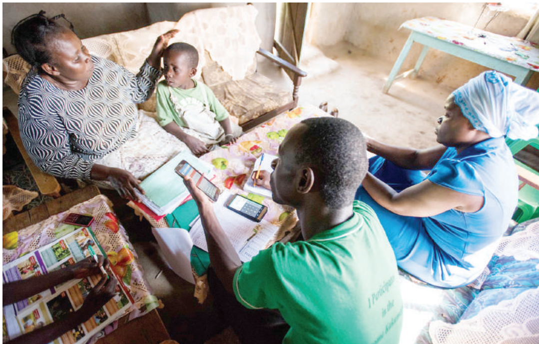
Vijana wanapata pesa kwa kutegemea simu na kompyuta wakiingiza muziki na kuonyesha picha za video.

Nchi zinazoinukia kiuchumi mfano Tanzania zimejikuta zipo katika hali ngumu kumudu maisha kwa sababu vijana maisha wanayoyajua ni "maliza kila kitu kiganjani" kwa mantiki kuwa kupata riziki ya kila siku kwa kutegemea teknolojia za kielektroniki na TEHAMA kwa kutumia simu janja na kompyuta.