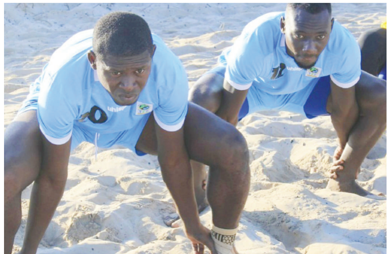
Wachezaji wa Timu ya Soka ya Taifa ya Ufukweni, wakifanya mazoezi kwenye ufukwe wa Coco jijini Dar es Salaam, kwa ajili ya kujiandaa na fainali za Kombe la Mataifa ya Afrika (BSAFCON 2021), zinazotarajiwa kufanyika baadaye mwaka huu nchini Senegal.

Kwa ushindi huo wa juzi usiku, Azam FC imefikisha pointi 54 na kuendelea kukaa katika nafasi ya tatu huku Yanga ikibaki ya pili na pointi 57 wakati mabingwa watetezi, Simba wanaongoza kwenye msimamo wa ligi hiyo wakiwa na pointi 58 lakini wamecheza mechi pungufu.