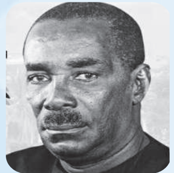
Hayati Sheikh Abeid Amani Karume Rais wa Kwanza wa Zanzibar