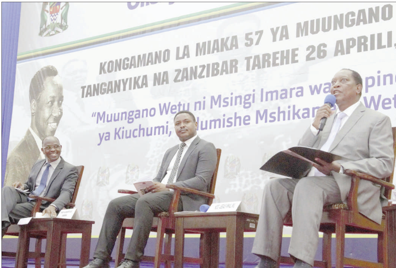
Waziri wa Katiba na Sheria Prof. Palamagamba Kabudi (kulia) akitoa mada kwenye Kongamano la miaka 57 ya Muungano wa Tanganyika na Zanzibar lililofanyika jana ukumbi wa mikutano Chimwaga Jijini Dodoma jana.

Aidha, alishukuru wanufaika hao kutatua kero hiyo ambapo pia alieleza baadhi ya kero zinazowakabili ikiwamo usafiri na upungufu wa walimu 15, wa masomo ya sayansi.