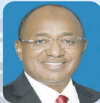
Dr. Hussein Ali Mwinyi Rais wa Zanzibar