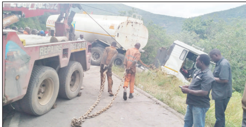
Vijana wakivuta mnyororo kwaajili ya kuvuta lori la mafuta ambalo liligon-gana na lori lililobeba shehena ya mkaa na kukaribia kutumbukia kwenye mteremko wa mlima Kitonga mkoani Iringa mwishoni mwa wiki PICHA JOSEPH MWENDAPOLE

Imetolewa na Kitengo cha Habari na Mawasiliano