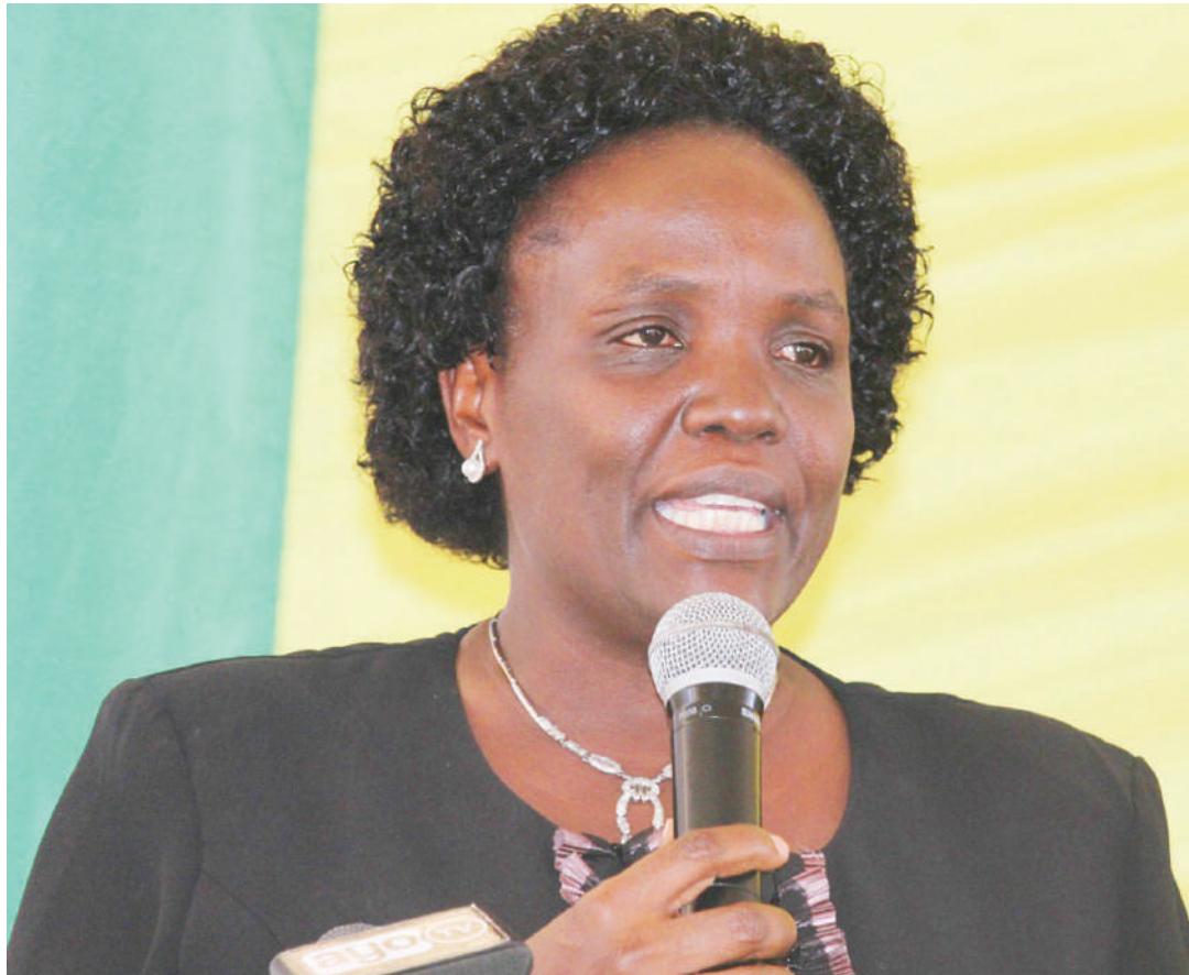
Waziri wa Elimu, Profesa Joyce Ndalichako.

Utaratibu unaelekeza aondolewe shuleni na kamati ya shule inahusika kutimiza jukumu hilo.