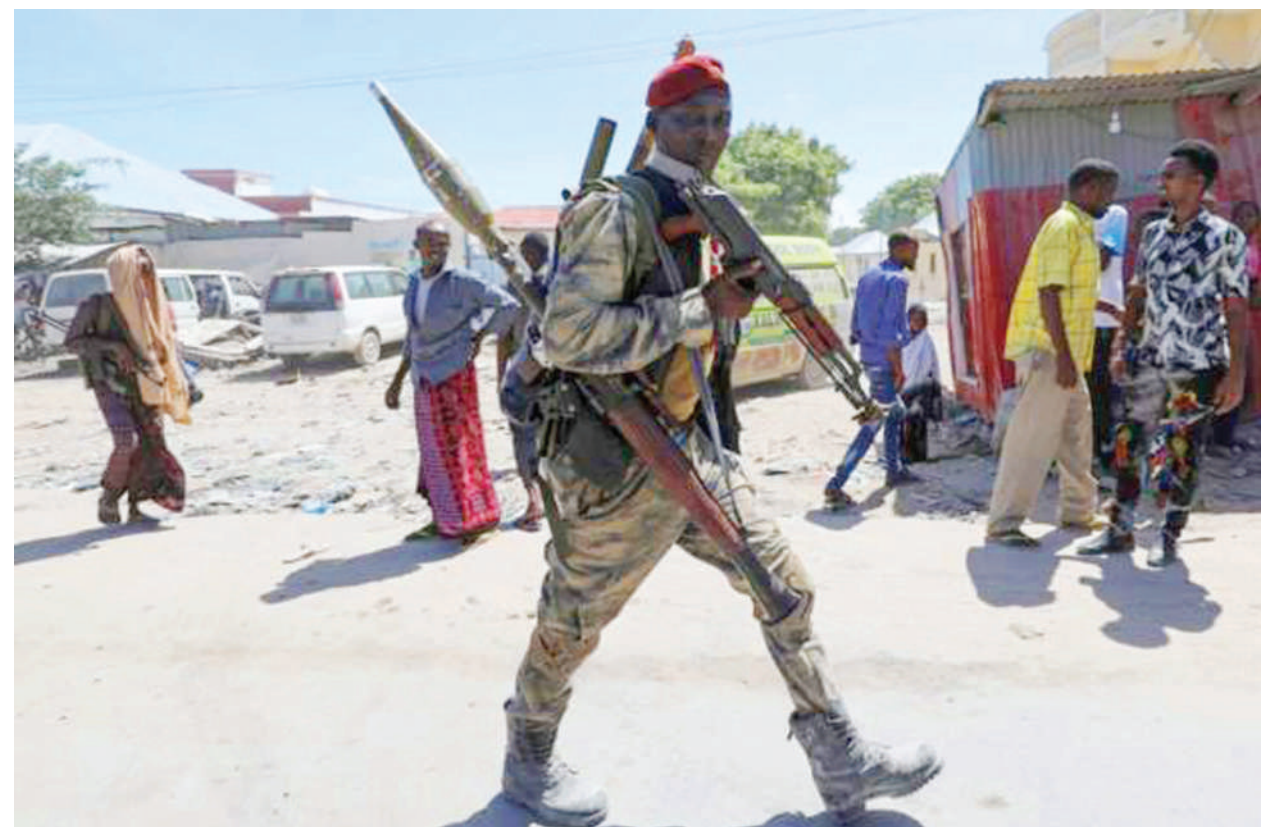
Mji Mkuu wa Somalia, Mogadishu, jana ulikuwa shwari baada ya mapigano kati ya wanaounga mkono upinzani na vikosi vya usalama vya serikali, kwa mujibu wa redio binafsi nchini humo. PICHA: BBC