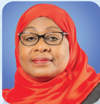
Mhe. Samia Suluhu Hassan Rais wa Jamhuri ya Muungano wa Tanzania