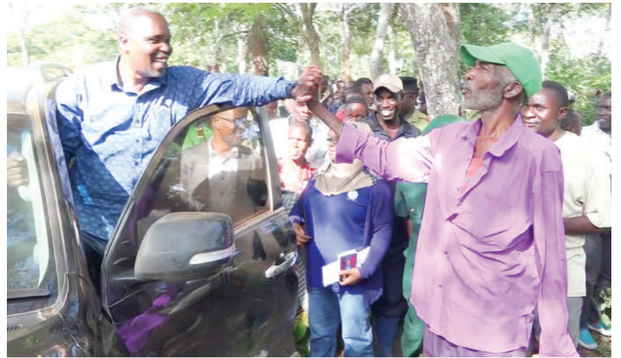
Wananchi wa Kijiji cha Mpeti wakiagana kwa furaha na Waziri wa Mifugo na Uvuvi, Mashimba Ndaki (katikati kulia), muda mfupi baada ya kumalizika kwa mkutano wa Waziri huyo na Wananchi wa Kijiji hicho uliofanyika wilayani Uvinza, Mkoani Kigoma juzi.