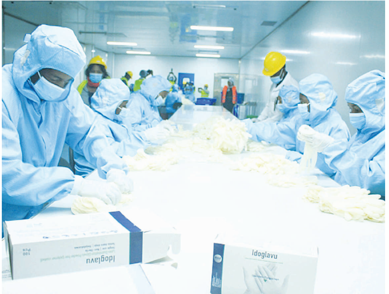
Baadhi ya wafanyakazi wa kiwanda cha Idofi kinachozalisha glovu za uchunguzi, wakizihakiki kwa ajili ya kuzifungasha.

kwa wakazi wa Makambako na kufanya ununuzi kwenye kampuni mbalimbali zilizopo eneo hilo. Kwa kutengeneza mipira ya mikono ya kiuchunguzi pekee kiwanda kitaweza kuokoa zaidi ya Sh. bilioni 11,” anasema.