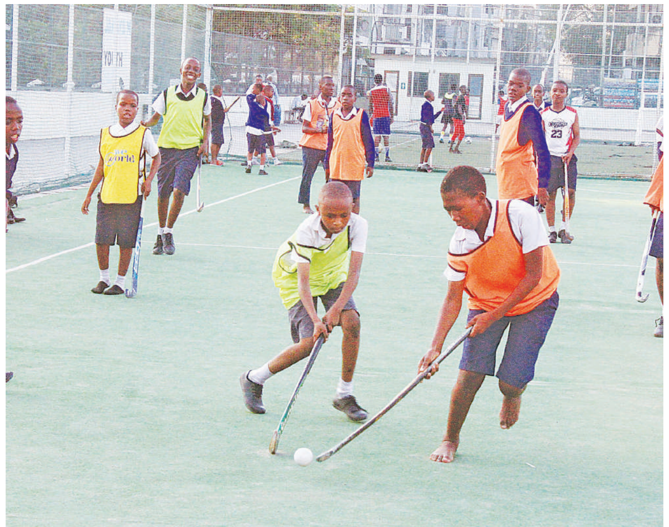
Wanafunzi wa Shule ya Msingi Lumumba jijini Dar es Salaam, wakifanya mazoezi ya kucheza mpira wa magongo katika Uwanja wa Jakaya Kikwete, Dar es Salaam jana.

„Waogeeleaji wamekuwa wakifanya mazoezi katika mazingira magumu kwa kuwa hatuna bwawa lolote zaidi ya kutegemea mabwawa ya shule za watu binafsi, hivyo tunaishukuru serikali kwa maamuzi hayo, alisema Mwaipasi.