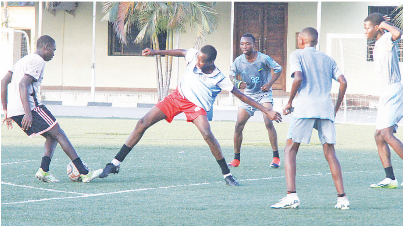
Vijana wanaolelewa katika Kituo cha Michezo cha Jakaya Kikwete jijini Dar es Salaam, wakiwania mpira walipokuwa wakifanya mazoezi katika uwanja wa kituo hicho jana.

Kamati hiyo ilisema kuwa haikupata ushahidi wowote kutoka kwa KMC kuwa Simba SC ilimrubuni mchezaji huyo kwenda Simba lakini wameipa klabu hiyo na kusisitiza ifuate taratibu pale inapohitaji kusajili mchezaji.