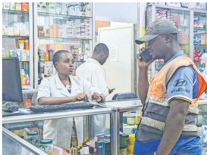
Mteja akihudumiwa kwenye duka la dawa.

Mengine yanatajwa kuwa ni pamoja na kuongezeka kwa usugu wa vimelea vya magonjwa