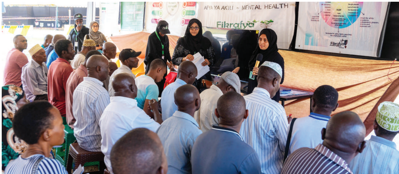
Wananchi waliojitokeza katika kambi ya siku tatu ya upimaji wa afya bure katika viwanja vya Mnazi Mmoja, jijini Dar es Salaam jana, wakipatiwa huduma na madaktari bingwa kutoka hospitali zinazomilikiwa na Jumuiya ya Khoja Shia Ithnashar, ambao ni waandaaji wa kambi hiyo.

Kunenge alisema malengo yake ni kuona wakazi wa mkoa huo wakitoka maoni yenye tija kwa ajili ya vizazi vijavyo, ambayo yatatumika katika Dira ya Taifa ya Maendeleo.