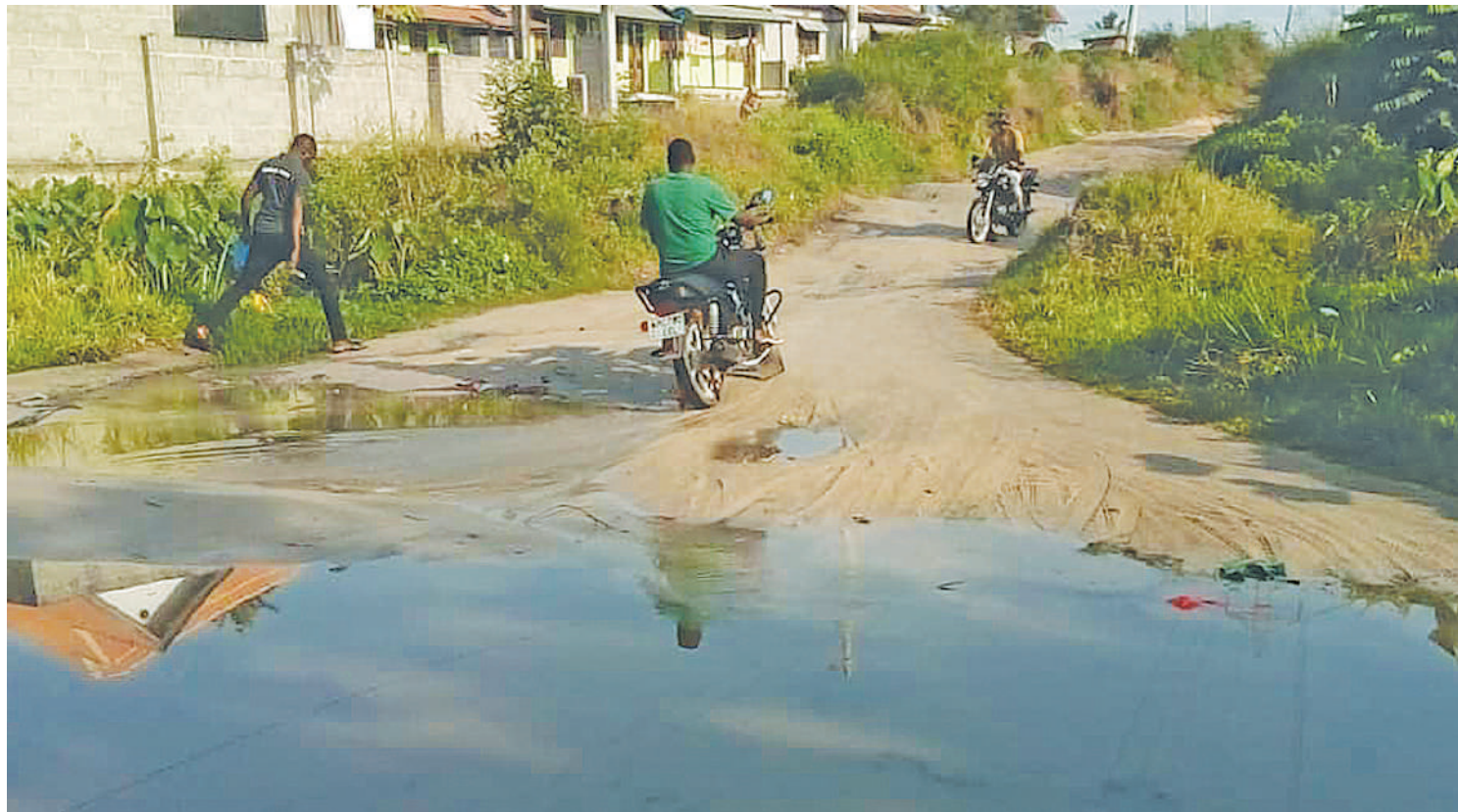
Maisha ya 'wagumu' wanaoishi Mtaa wa Machimbo Segerea.

toa ushirikiano kwa makandarasi na walinzi shirikishi kwa kukusan- ya taka na kuchangia walinzi.