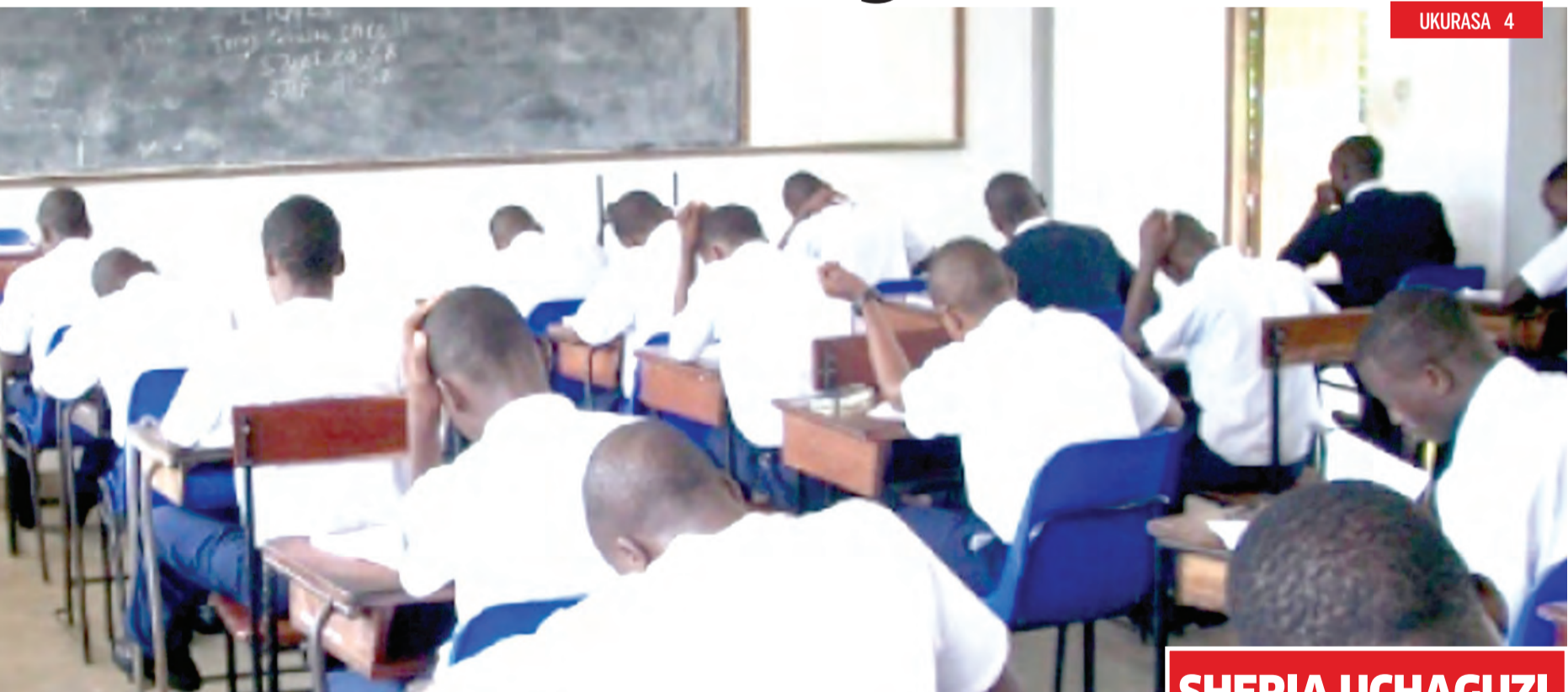
Wanafunzi wakifanya mitihani.