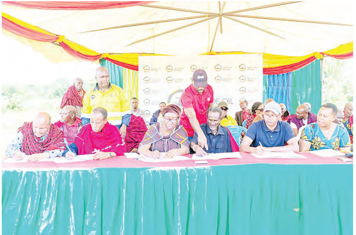
Baadhi ya viongozi wa kimila wa kabila la Wabarbaig pamoja na baadhi ya viongozi wa bomba la mafuta ghafi la Afrika Mashariki wakisaini mkataba wa kuchepusha bomba la mafuta linalopita katika kijiji cha Gorimba, Wilaya ya Hanang' jana ili kukwepa kaburi la mmoja wa viongozi wa kimila wa kabila hilo.

Alisema wanakwenda kupunguza visumbufu vya mimea kwa maana ya magonjwa na wadudu waharibifu wa mazao na kuwapa viuatilifu bandia sokoni.