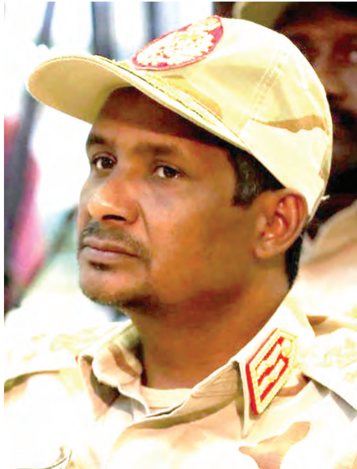
Mkuu wa kundi la Rapid Support Forces nchini Sudan, Mohamed Hamdan Dagalo.