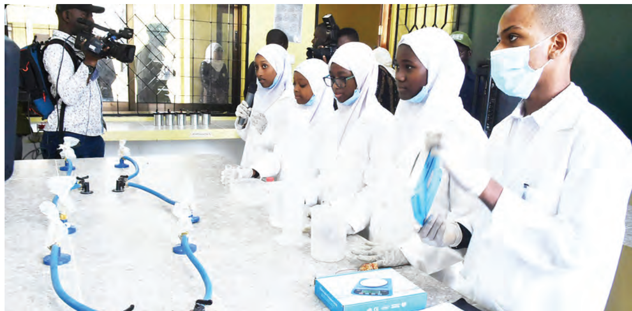
Wanafunzi wa Shule mpya ya Sekondari ya Tumekuja wakiwa katika chumba cha maabara wakati Rais wa Zanzibar, Dk. Hussein Ali Mwinyi (hayupo pichani), alipotembelea madarasa mbalimbali baada ya kuifungua, iliyojengwa Mwembeladu Wilaya ya Mjini, Mkoa wa Mjini Magharibi jana.

Hata hivyo aliendelea kuwasihi wananchi kununua mafuta katika vituo halali sambamba na kudai risiti za kielektroniki.