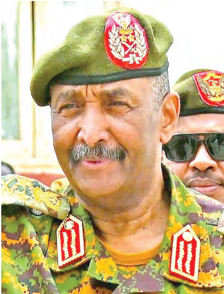
Kiongozi wa Sudan, Jenerali Abdel Fattah al-Burhan.