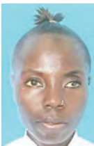
Na Tuntule Swebe