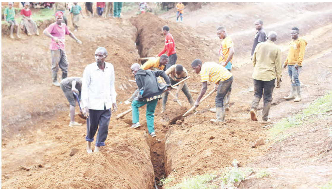
Wakazi wa Kijiji cha Shisyente Kilichoko Kata ya Shizuvi katika Halmashauri ya Wilaya ya Mbeya, wakishiriki kwenye shughuli ya kuchimba mtaro kwa ajili ya kupitisha bomba la maji ya mradi wa maji wa Kijiji hicho unaotekelezwa na Wakala wa Maji Vijijini (RUWASA) hivi karibuni.