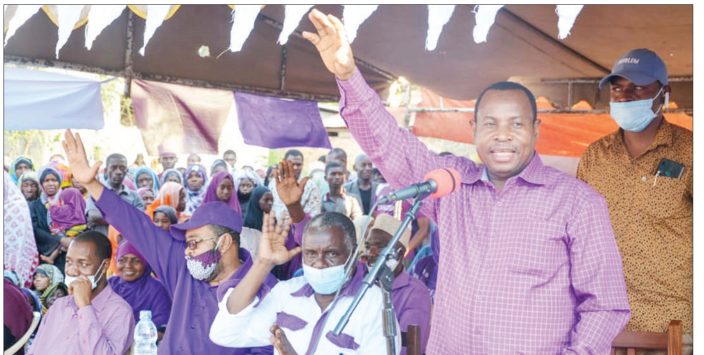
Makamu wa Kwanza wa Rais, Othman Masoud, akizungumza na wafuasi wa Chama cha ACT-Wazalendo alipotembelea Kisiwa cha Tumbatu Mkoa wa Kaskazini Unguja.

nyakati za usiku ili kupata muda wa kwenda chooni kwa sababu ugonjwa huo unatibika. Alisema utamaduni wa uvalishwaji wa pampasi kwa watoto kunachangia kuongezeka kwa idadi ya vikojozi, kwa sababu katika ukuaji wa mtoto kiakili anatakiwa kwenda chooni mwenyewe umri kuanzia miaka miwili. Alisema mtoto kuanzia miaka miwili anatakiwa kupewa elimu ya huduma ya choo, lakini kutokana na uvivu wa wazee na walezi mtoto wa miaka minne bado anavalishwa pampasi. Alisema vikojozi wanaofuata huduma za afya hospitalini hapo hupatiwa tiba na wengi wao hupona kabisa.