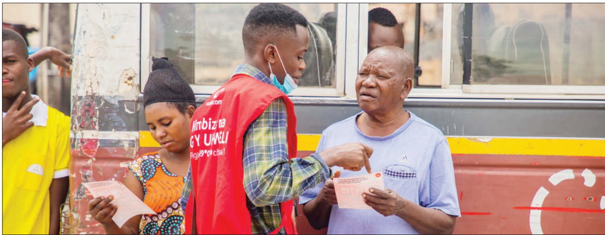
Wakala wa kampuni ya simu za mkononi ya Vodacom Tanzania akimpa maelekezo mkazi wa Dar es Salaam juu ya kampeni mpya ya 'Kimbiza na 4G ya Ukweli' yenye lengo la kuifahamisha jamii kuhusu kasi na uhakika wa mtandao wake unaowezeshwa na uwekezaji katika teknolojia pamoja na upana wa huduma inazotoka kwa wateja wake.

Pia alisema Shule ya Ebonite ni moja ya shule zinazofanya vizuri mitihani yake ya kitaifa katika Manispaa ya Ubungo.