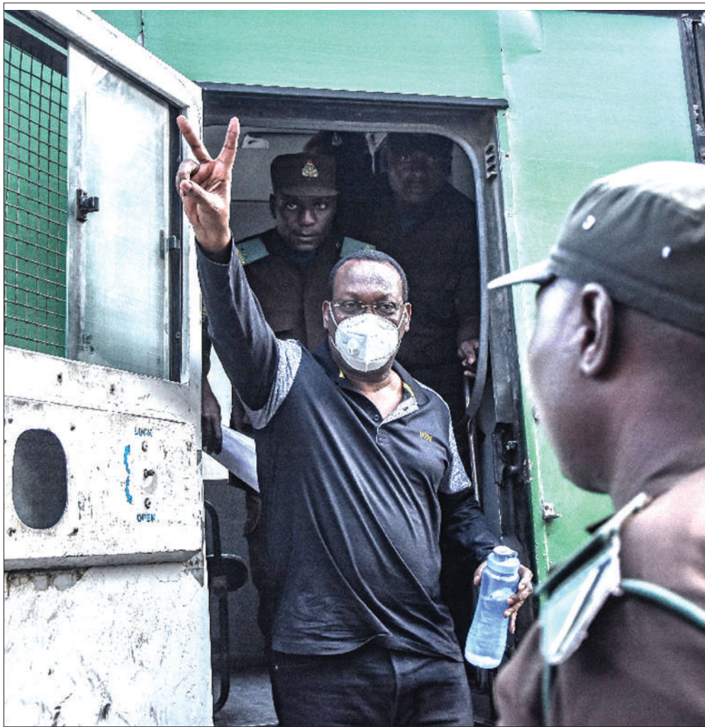
Mwenyekiti wa CHADEMA, Freeman Mbowe, akiteremka kwenye gari la Magereza wakati akisawili Mahakama ya Hakimu Mkazi Kisutu jijini Dar es Salaam.