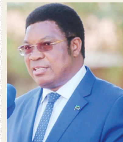
Na Mwandishi Wetu

WAZIRI Mkuu, Kassim Majaliwa, amesema serikali itaendelea kusimamia uhuru wa kuabudu kwa kila mwananchi kwa mujibu wa Katiba ya Jamhuri ya Muungano wa Tanzania.