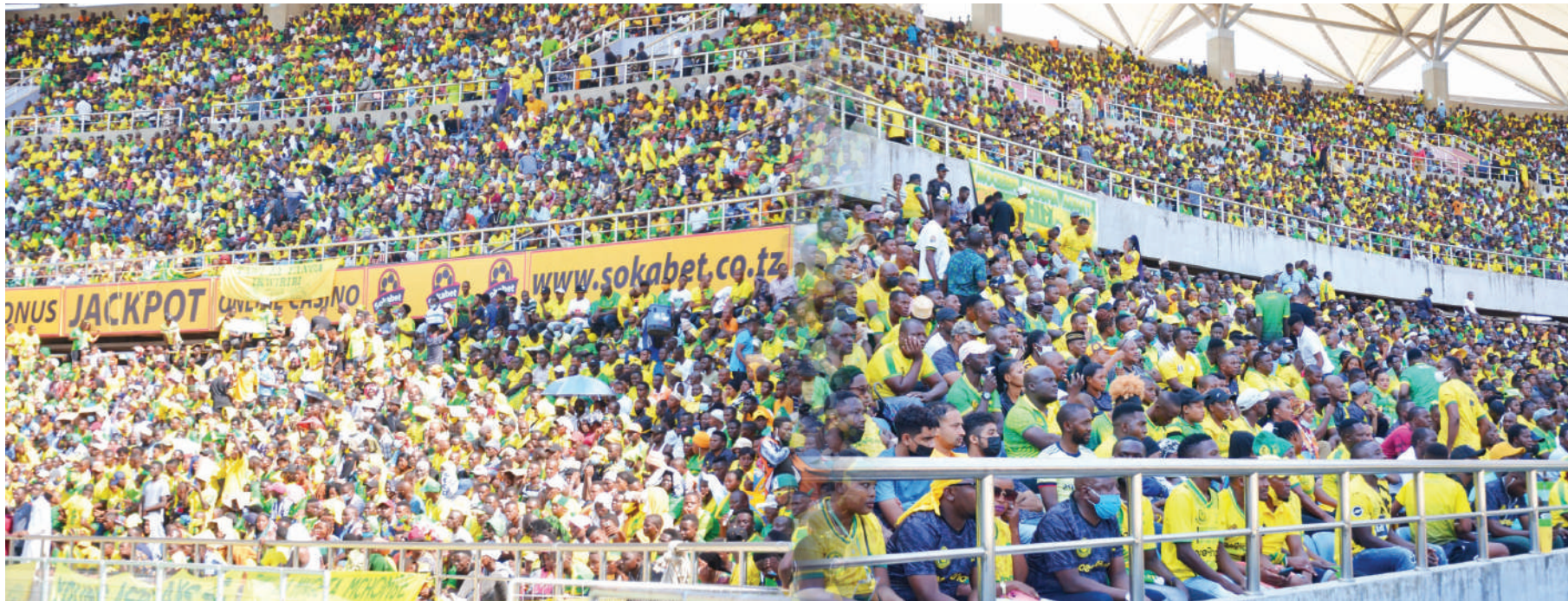
Mashabiki wa Yanga wakiwa Uwanja wa Benjamin Mkapa kushuhudia tamasha la Kilele cha Wiki ya Mwananchi jana.