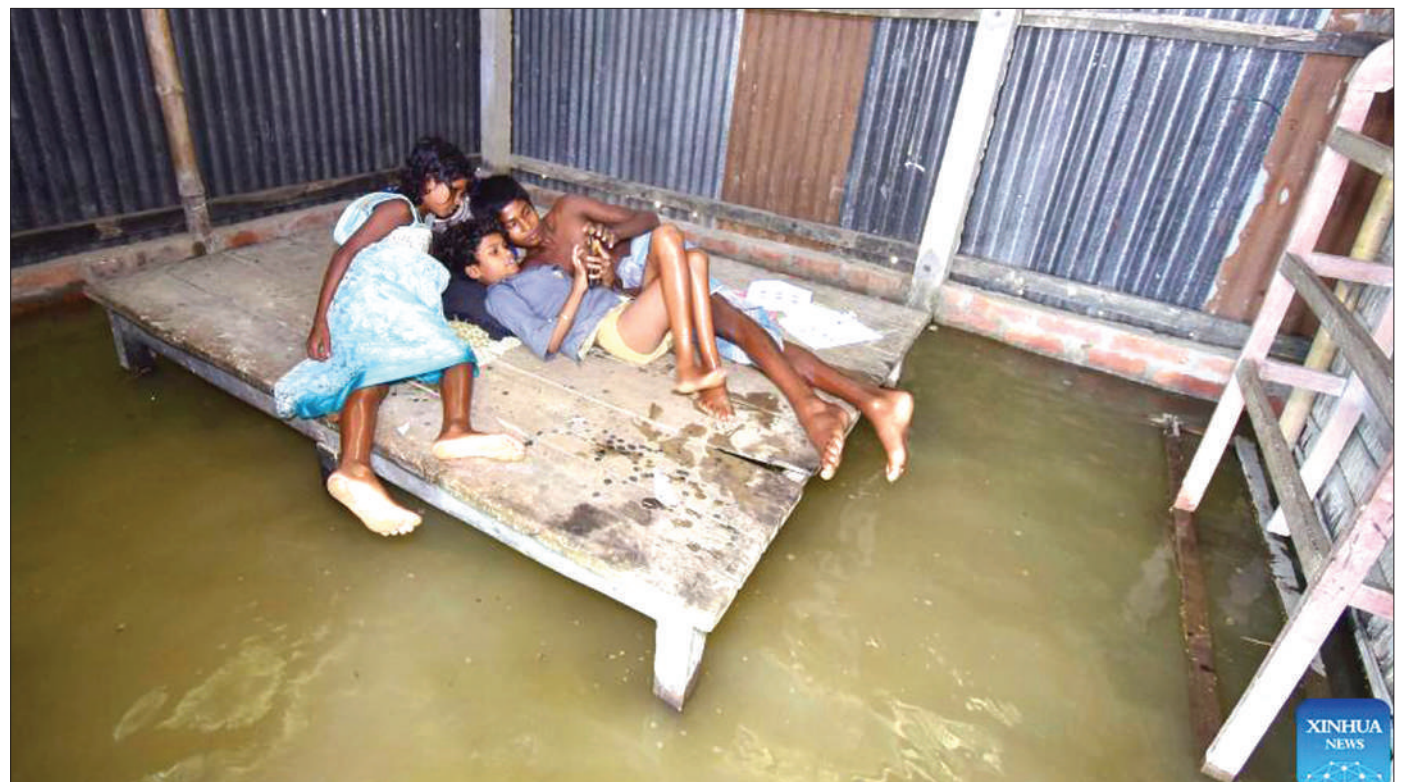
Watoto wakipumzika ndani ya nyumba iliyojaa maji Wilaya ya Morigaon Jimbo la Assam, Kaskazini Mashariki mwa India, juzi, baada ya eneo hilo kukumbwa na mafuriko.