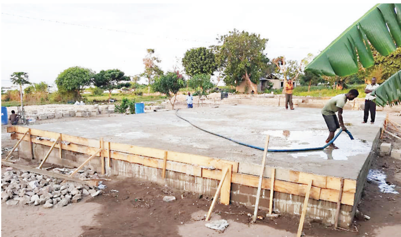
Mafundi wakijenga msingi wa wodi ya mama na mtoto kwa ajili ya Kituo cha Afya cha Kisiwa cha Rukuba, Musoma Vijijini mkoani Mara juji, ikiwa ni mkakati wa kusogeza huduma za afya karibu na wananchi.