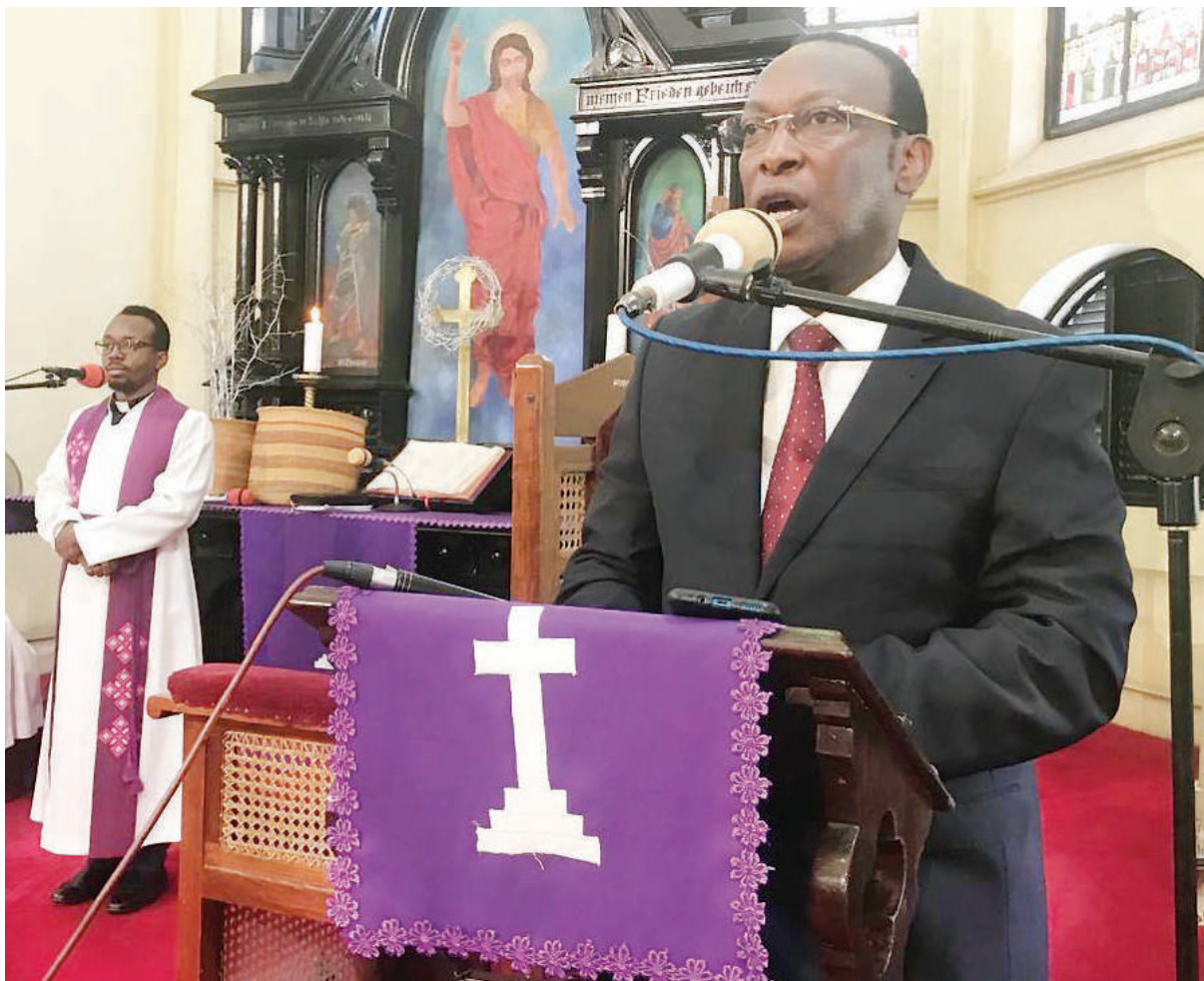
Mwenyekiti wa Chama cha Demokrasia na Maendeleo (CHADEMA), Freeman Mbowe, akizungumza wakati akitoa shukrani katika Kanisa la Kiinjili la Kilutheri la Azania Front jijini Dar es Salaam jana.

• Atoa shukrani kanisani, aeleza miezi 8 ya maisha yake gerezani, kuzungumza na Watanzania... Endelea ukurasa 2