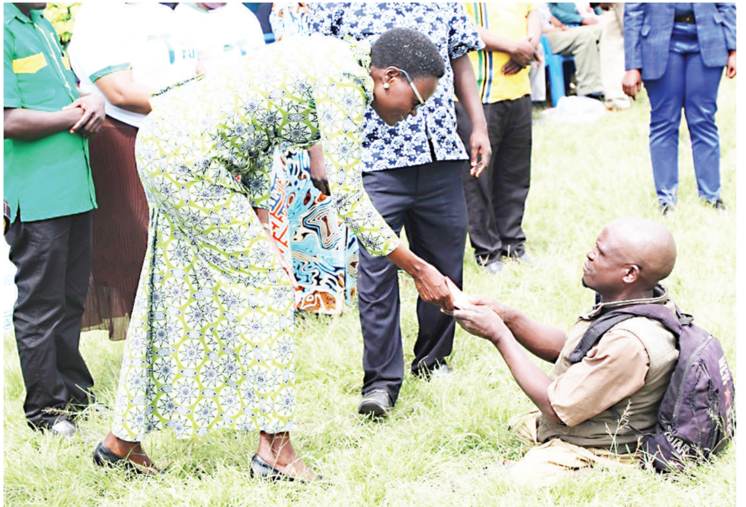
Spika wa Bunge, Dk. Tulia Ackson ambaye ni Mbunge wa Jimbo la Mbeya Mjini, akimkabidhi fedha mmoja wa watu wenye ulemavu ili zikamsaidie kukidhi mahitaji yake, juzi katika kongamano la uwezesaji kiuchumi wanawake wa Mkoa wa Mbeya.

Alisema suala lingine ni wadumu kwa afya ngazi ya jamii kuhakikisha wanawahamiza kinama kuwapeleka kwenye vituo vya afya au maeneo yaliyotengwa kwa ajili ya utoaji wa chanjo kwa kuwa watoto wanaweza kuwa kwenye hatari kubwa ya kupata ugonjwa huo.