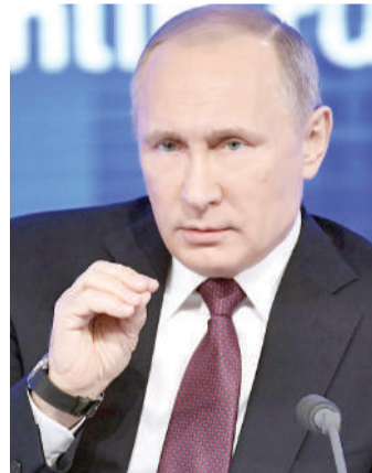
Rais wa Russia, Vladimir Putin.

Kiongozi wa Kanisa Katoliki Duniani, Papa Francis, jana, ametoa wito wa kukomeshwa