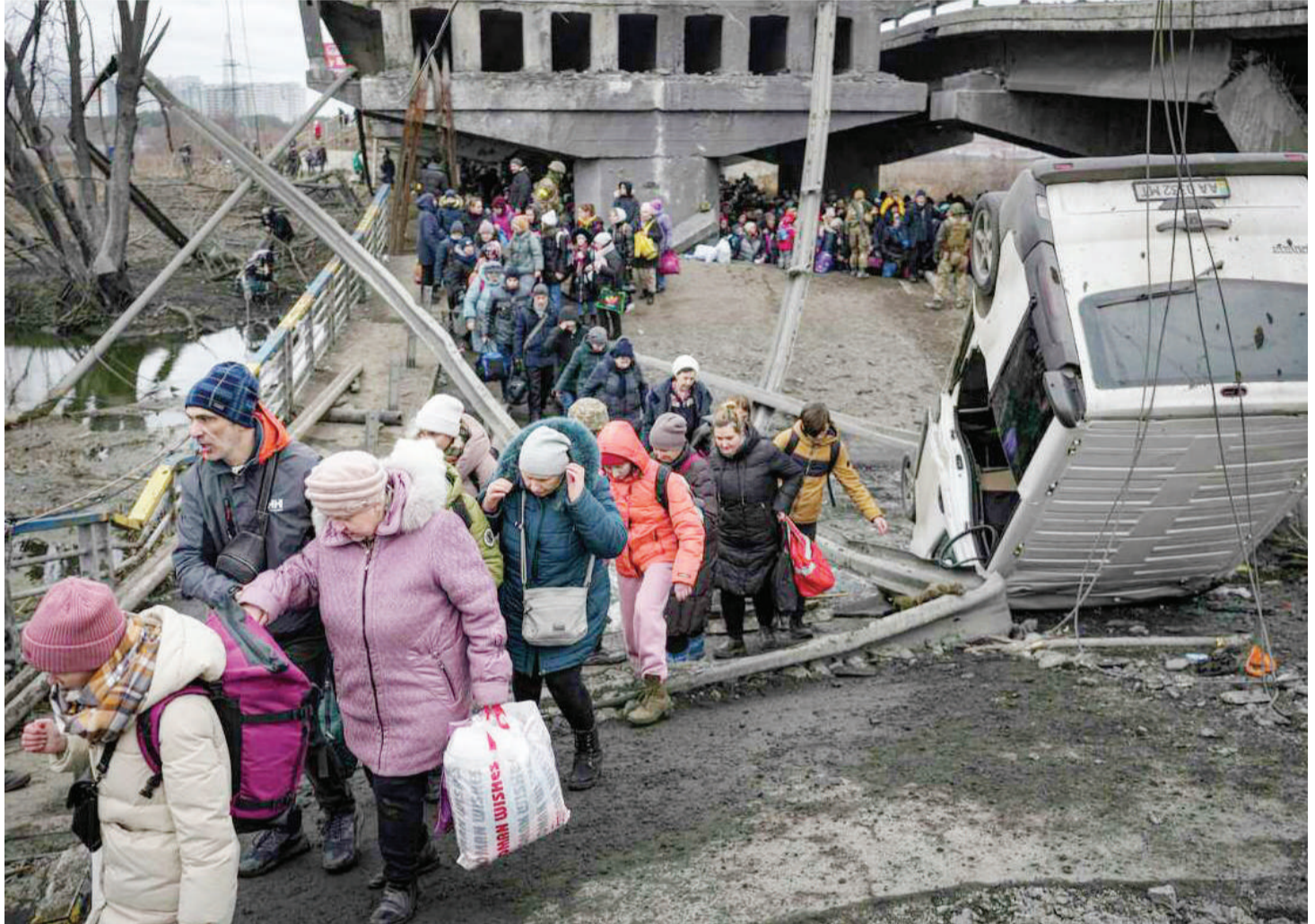
Wakazi wa mji wa Irpin nchini Ukraine, wakiondoka nchini humo, baada ya Russia kuendelea na mashambulizi katika miji mikuu, licha ya wito wa kusitisha mashambulizi ili kupisha raia kuondoka.