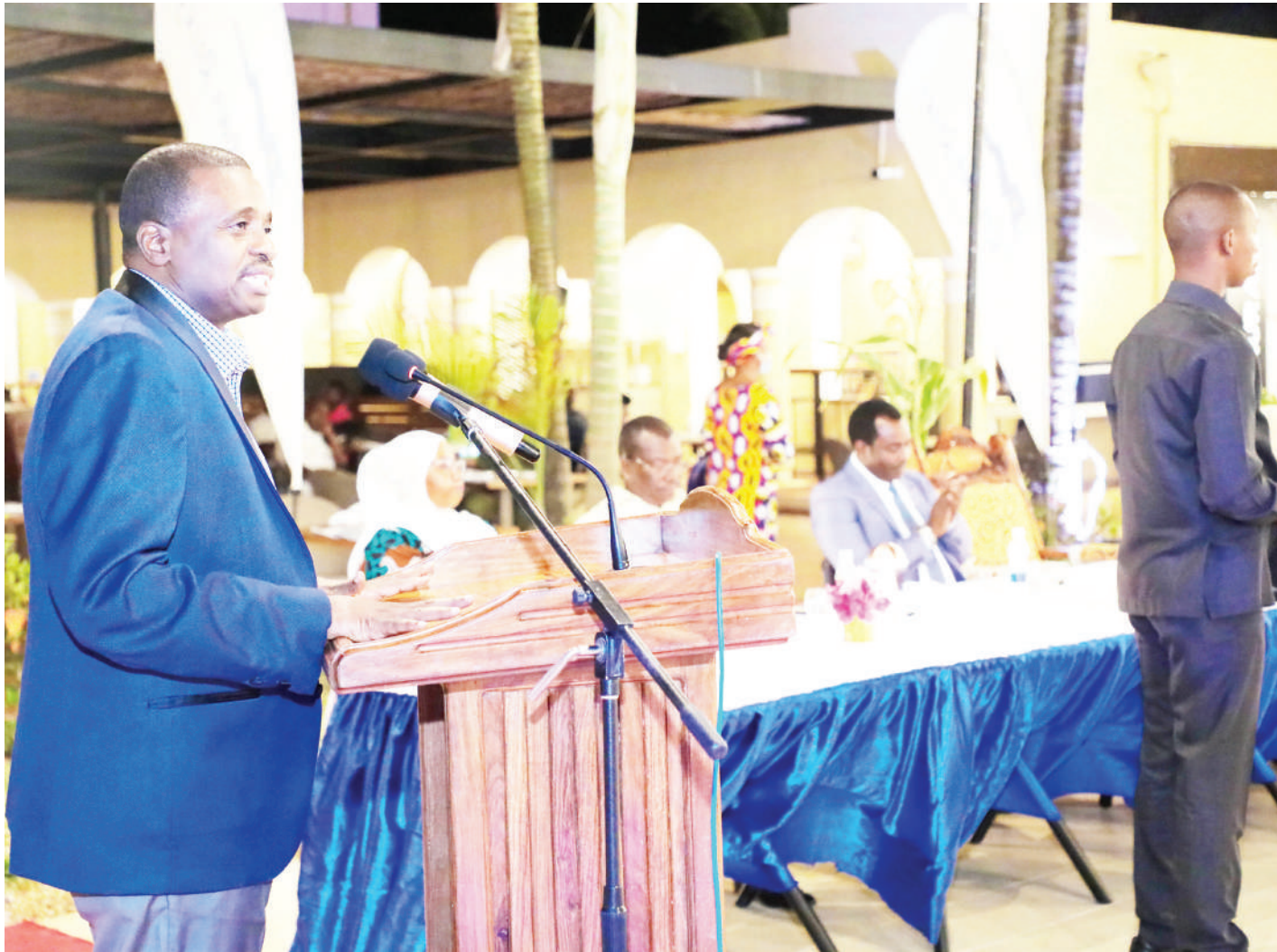
Makamu wa Pili wa Rais akizungumza katika uzinduzi wa makala ya hazina ya kutangaza vivutio vya utalii Mkoa wa Kaskazini Unguja iliyo-fanyika katika hoteli ya Tui Blue Bahari Zanzibar, iliyoko Pwani Mchangani mkoani humo.