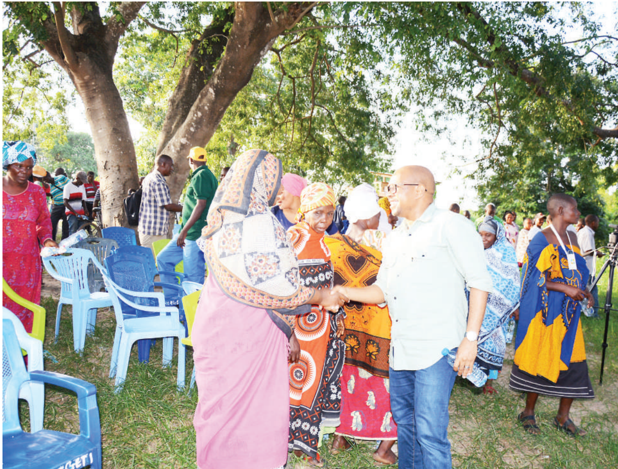
Naibu Waziri wa Ardhi, Nyumba na Maendeleo ya Makazi, Ridhiwani Kikwete, akisalimiana na mmoja wa kinamama wa Kata ya Vgwaza kwenye ziara yake katika Jimbo la Chalinze, jana.