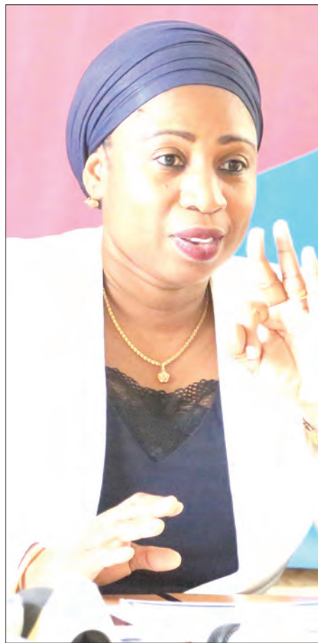
Waziri wa Nchi, Ofisi ya Rais, Tawala za Mikoa na Serikali za Mitaa, Ummu Mwalimu.

na hali ilivyokuwa, darasa moja lilisheheni wanafunzi 77, ambayo inakaribia kuwa sawa na madarasa mawili.