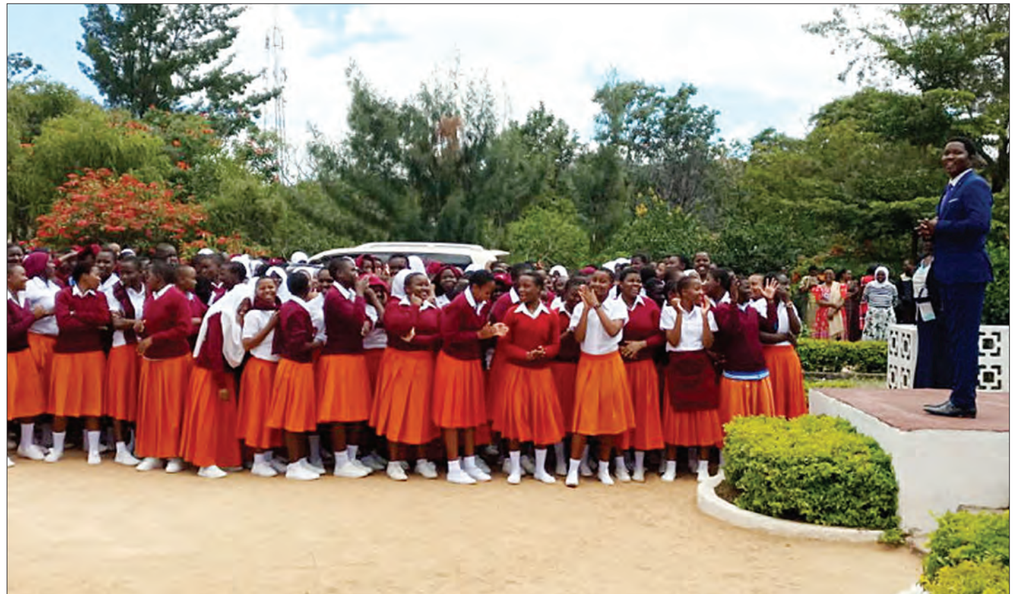
Wanafunzi wasichana wakiwa katika hadhira inayowahusu.

Ndiyo hapo inazaliwa dhoruba ya mwelekeo wa uzazi na malezi katika karne iliyopo hata katika nchi za Afrika, kwani kusambaa