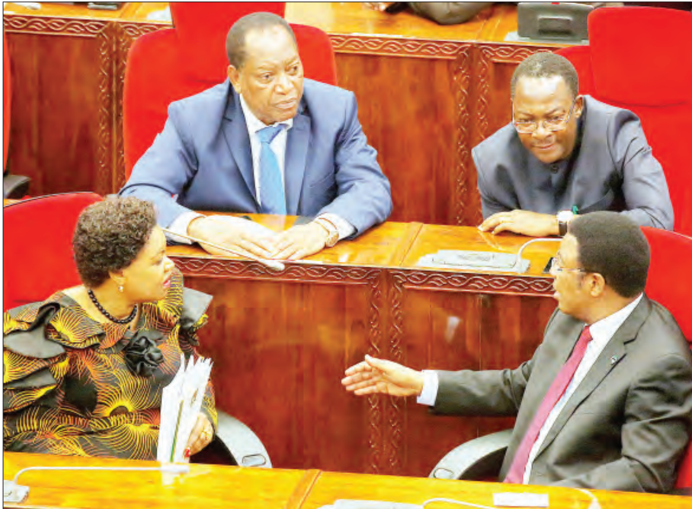
Waziri Mkuu Kassim Majaliwa, akizungumza na Waziri wa Nchi, Ofisi ya Waziri Mkuu, Sera, Bunge, Kazi, Vijana, Ajira na Wenye Ulemavu, Jenista Mhagama (kushoto), Waziri wa Katiba na Sheria, Prof. Palamagamba Kabudi (wa pili kushoto) na Waziri wa Mambo ya Ndani, George Simbachawene, Bungeni jijini Dodoma jana.