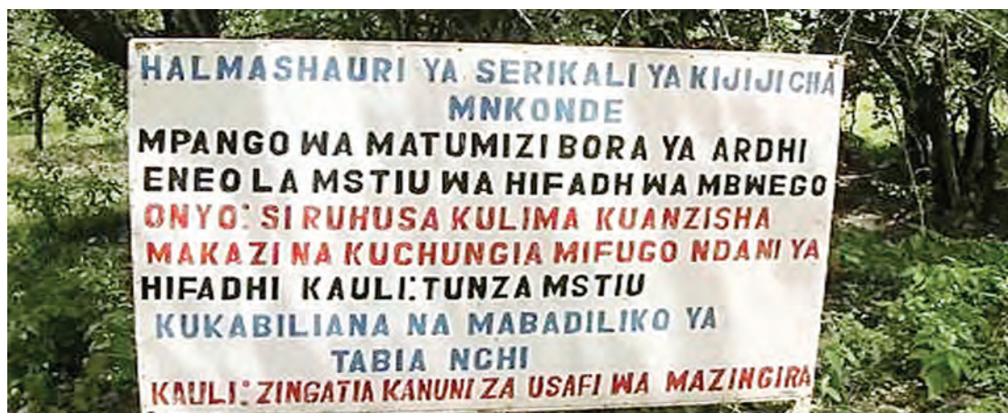
Moja ya matangazo yanayohusu hifadhi ya misitu katika kijiji cha Mnkonde, wilayani kilindi.

“Tunaomba mafunzo kwani tangu tumalize mafunzo mwaka 2010 hadi sasa hatujawahi kupata mafunzo au semina aina yoyote,” anahitimisha.