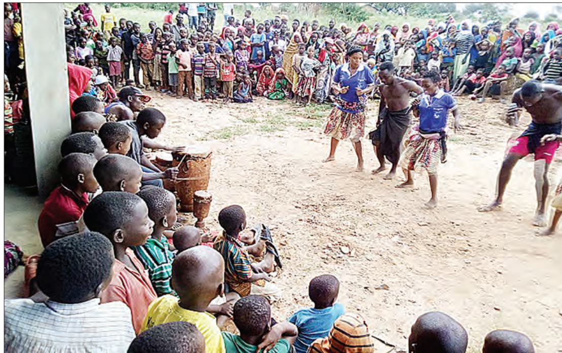
Watumbuizaji wa Kabuku Sanaa Group, wakifanya maigizo kuelimisha jamii kuhusu usimamizi shirikishi wa misitu kijijini Mnkonde, wilaya ya Kilindi.

wala bora na usimamizi wa fedha zitokanazo na mazao ya misitu kijijini, mkufunzi mkuu akiwa Mradi wa Mnyororo wa Thamani wa Mazao ya Misitu (FORVAC), unaofadhiliwa na serikali nchini na wabia wao wa Finland.