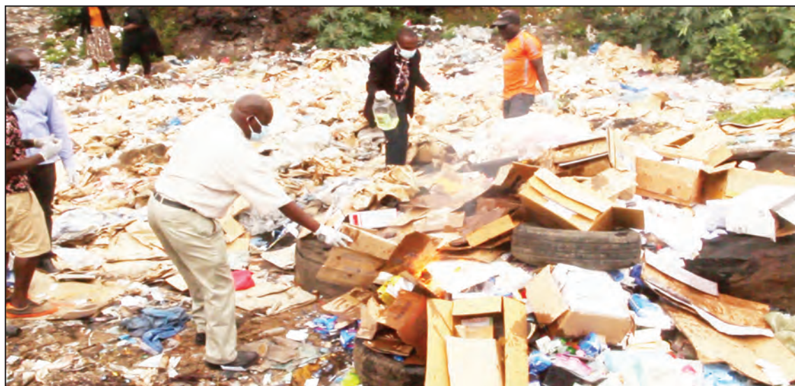
Baadhi ya maofisa wa Mamlaka ya Dawu na Vifaa Tiba (TMDA), wakiteketeza dawa za binadamu na mifugo zilizokwisha muda wake katika dampo la Mbalizi, jijini Mbeya juzi, ambazo walizikamata kwenye operesheni waliyoifanya maeneo mbalimbali ya mikoa ya Nyanda za Juu Kusini.

"Lakini pia tumeamua kuchangia meza 50 na viti 50 kwa shule ya Sekondari Mengele, na hili ni miongoni mwa majukumu ya benki yetu, tunashirikiana na jamii kwenye uboreshaji wa sekta hii muhimu," alisema Cholongola. Mkuu wa Wilaya ya Mbarali, Mfune alikiri kuwapo kwa tatizo la uhaba wa madawati katika shule hiyo pamoja na shule zingine ndani ya wilaya yake huku akiitaka jamii kujitolea kuboresha miundombinu ya shule.