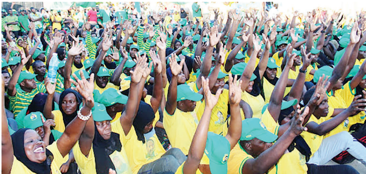
Somo la uraia-‘civics’ ndilo linaloanzisha vuguvugu la vijana na uongozi katika hatua za mwanzo ambao baadaye huunda umoja wa vijana wa vyama mbalimbali ndani kama ilivyo UVICCM.

safi na umuhimu wa ushiriki wao katika mifumo ya kidemokrasia kuanzia shuleni, nyumbani na ndani ya jamii.