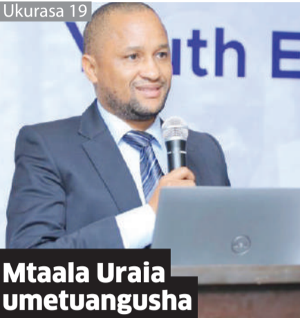
Mtaala Uraia umetuangusha