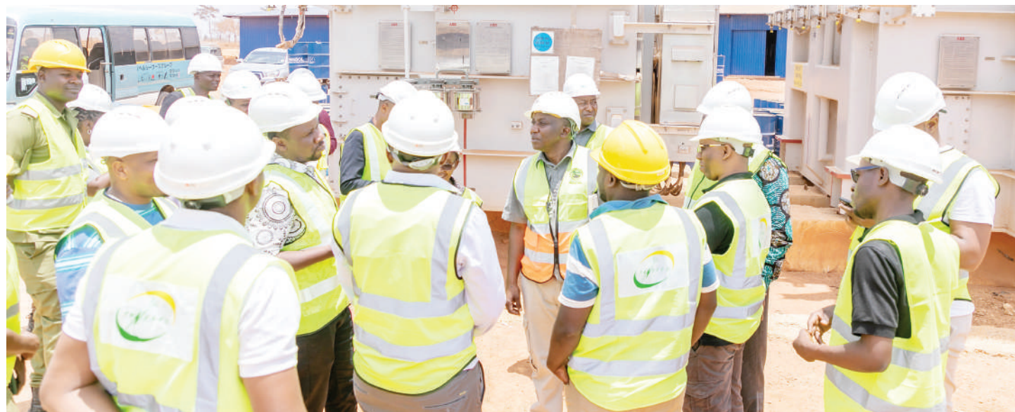
Kamati ya Kudumu ya Bunge ya Nishati na Madini, ikiangalia Transfoma zitakazotumika katika mradi wa kuzalisha umeme wa JNHPP baada ya kuutembelea mradi huo.

Vilevile, alisisitiza kutolewa taarifa endapo kutakuwa na watu wenye dalili za kipindupindu katika jamii kwa kupiga namba ya simu 199 bila malipo.