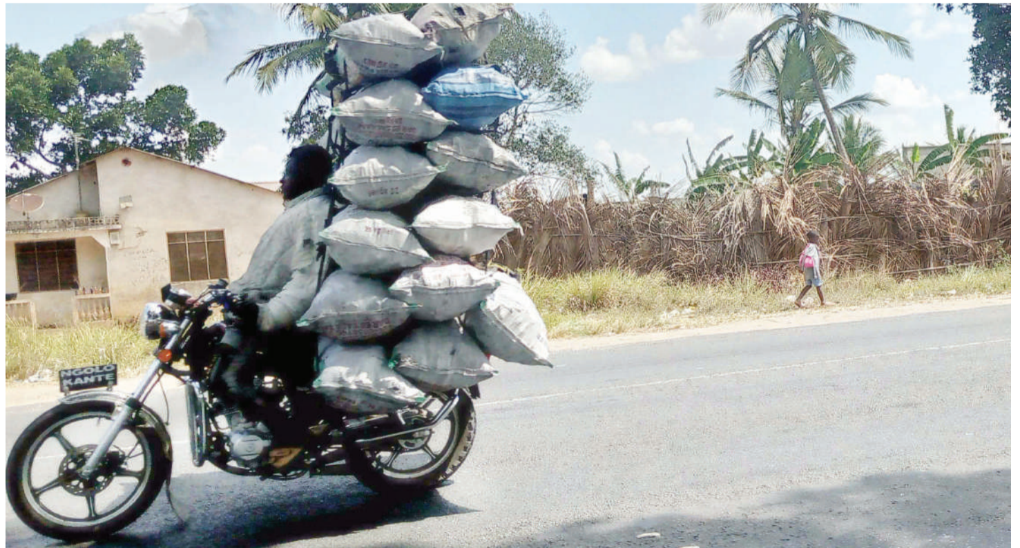
Mfanyabiashara akiwa na viroba vilivyosheheni kwenye bodaboda.

• Licha ya kusababisha ajali za mara kwa mara misitu inateketea, mazingira yakibaki taabani