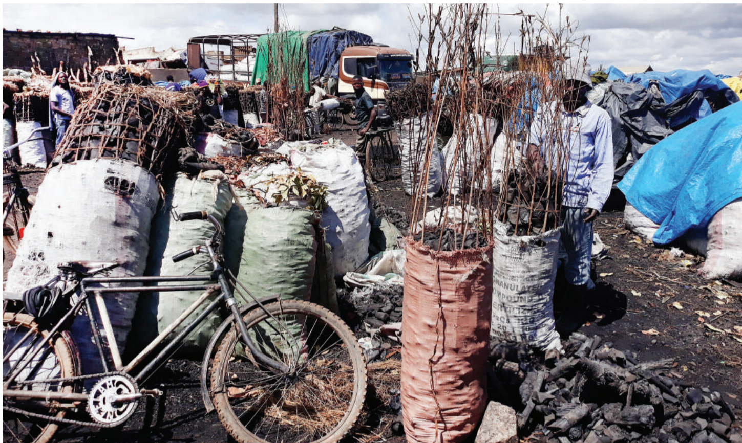
Mkaa unaosubiri wateja wakiwamo bodaboda ili kuufikisha kwa wateja mijini hasa Dar- Es- Salaam.

Kupotea kwa kasi kubwa uoto wa asili ikiwamo misitu, ni janga kubwa kwa Watanzania kuelekea kukosa mvua za kutosha, ardhievu ikiwamo mito, maziwa na mabwawa kujaa udongo na taka nyingine kutokana na mvua kusababisha mmomonyoko wa udongo kirahisi na kusombwa hadi mabondeni na kwenye hizo ardhievu.