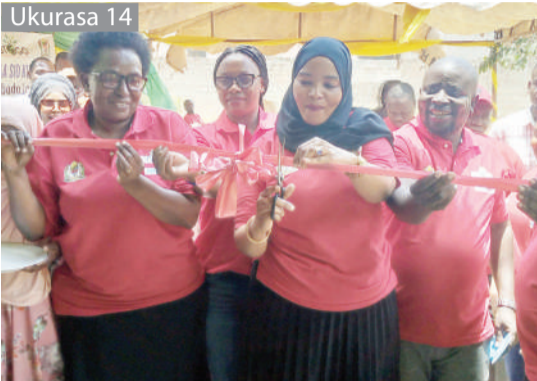
Waliokatishwa masomo 70 wanavyonufaika ni shule tena