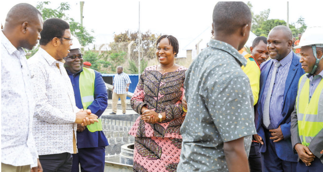
Waziri Mkuu, Kassim Majaliwa, akisalimbia viongozi mbalimbali wa serikali alipowasili katika Daraja la Magufuli la Kigon-go-Busisi kwa ajili ya kukagua ujenzi wake jijini Mwanza.