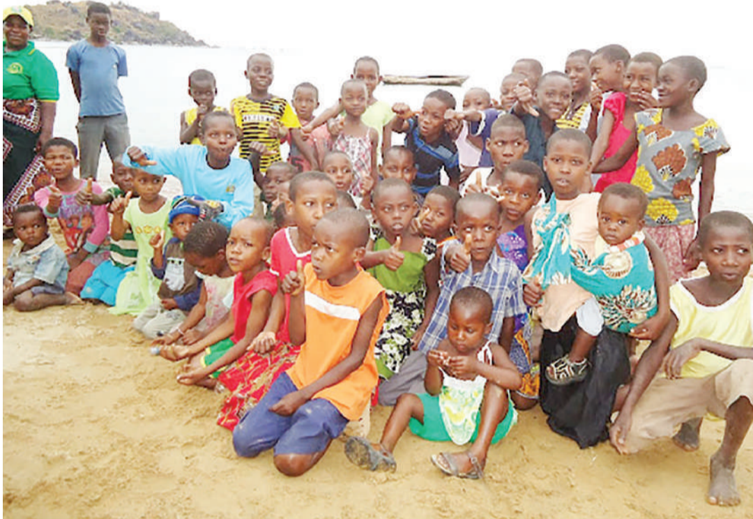
Watoto wanapokusanyika wafurahiane si kuzomeana wala kuchekana.

• Wazazi, walimu acheni kuhamasisha, mnabomoa hamjengi