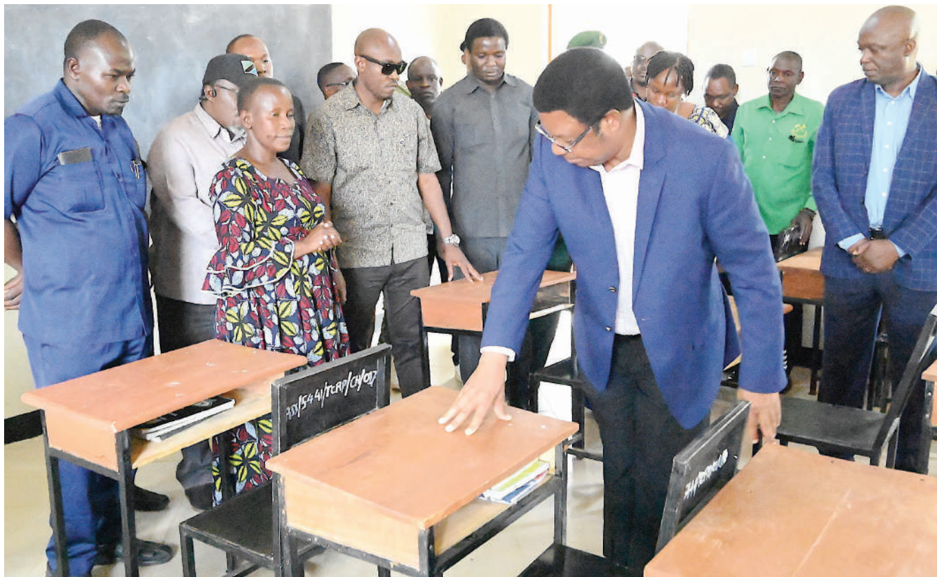
Waziri Mkuu, Kassim Majaliwa akiangalia madawati alipokagua madarasa sita katika Shule ya Sekondari Irugwa wilayani Ukerewe yaliyojengwa kwa Sh. milioni 250.