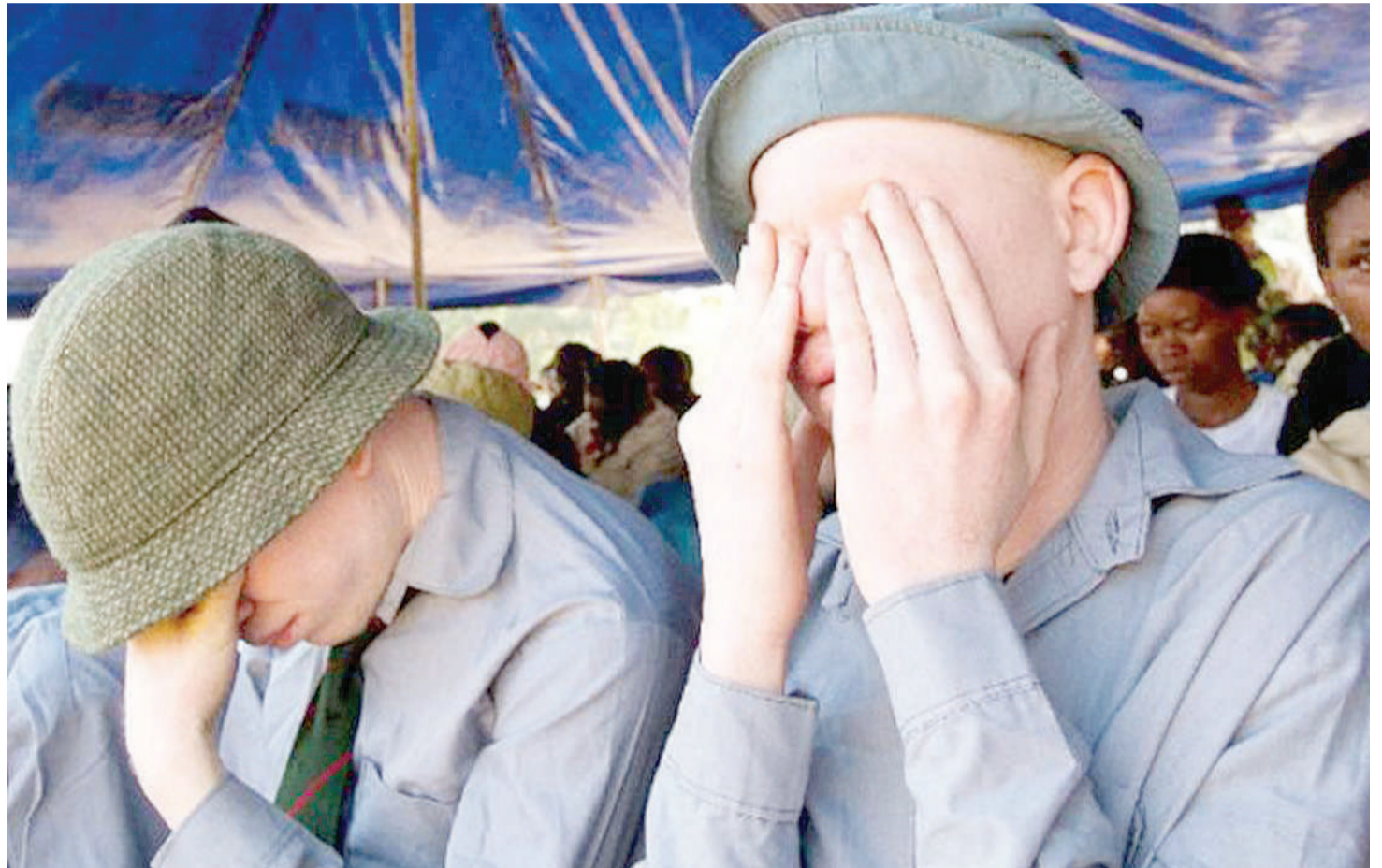
Jeni au nasaba zinazosababisha kuzaliwa na ualbino zinaweza kuhaririwa kwa kuboreshwa zaidi kupunguza na kuondoa maumbile hayo.

• Kusuka upya mifumo asilia kukabili udhaifu unaorithiwa