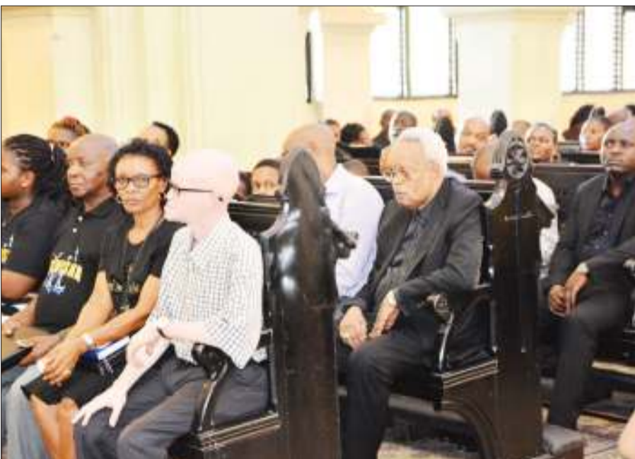
Sehemu ya waumini wa kikristo waliohudhuria ibada ya Ijumaa Kuu katika kanisa la KKKT Azania Front, jijini Dar es Salaam jana.