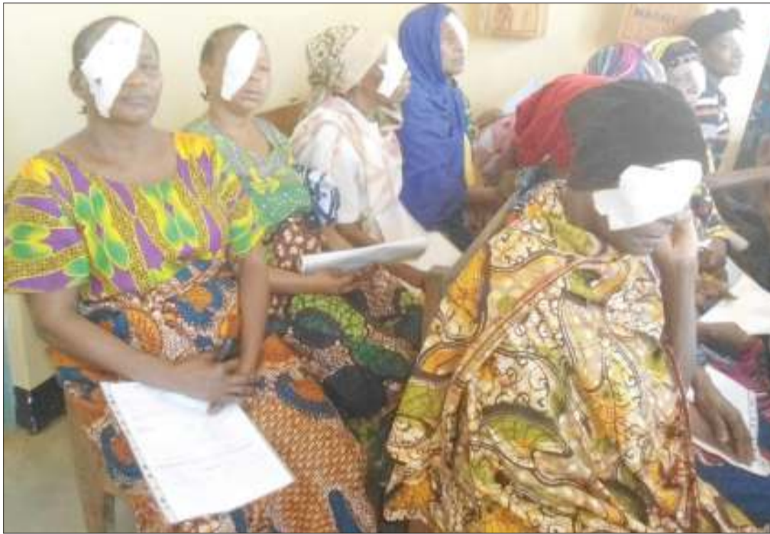
Mgonjwa wa mtoto wa jicho. Picha nyingine, matibabu ya ugonjwa huo.