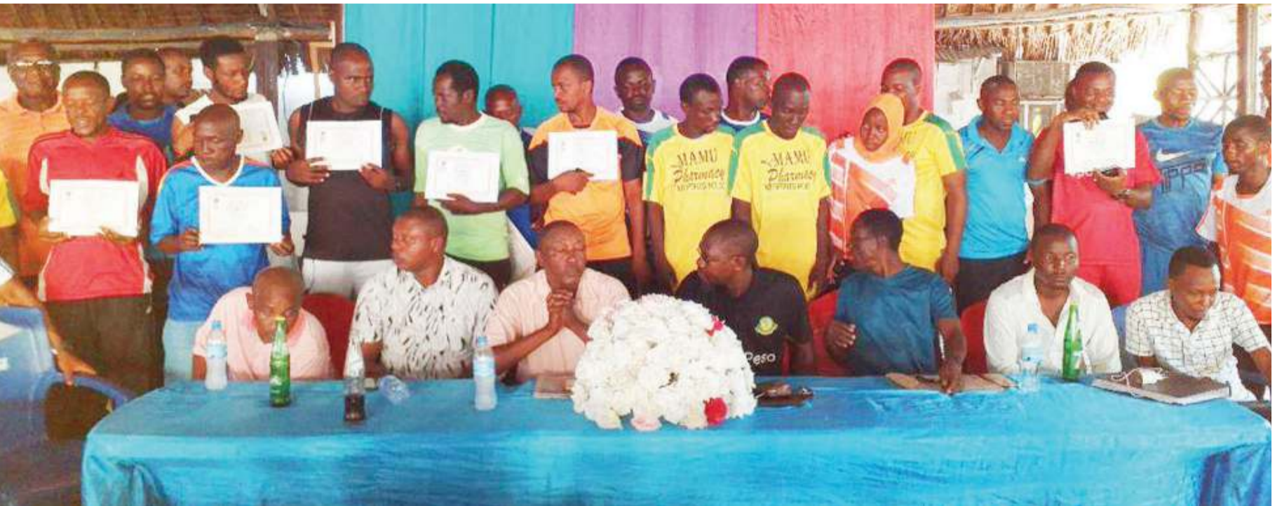
Wahitimu wa kozi ya ukocho wa mpira wa miguu ngazi ya kati, wakiwa na viongozi wa Chama cha Soka Ubungo (UFA) iliyoko jijini Dar es Salaam, ambao ndio waandaaji wa kozi hiyo.