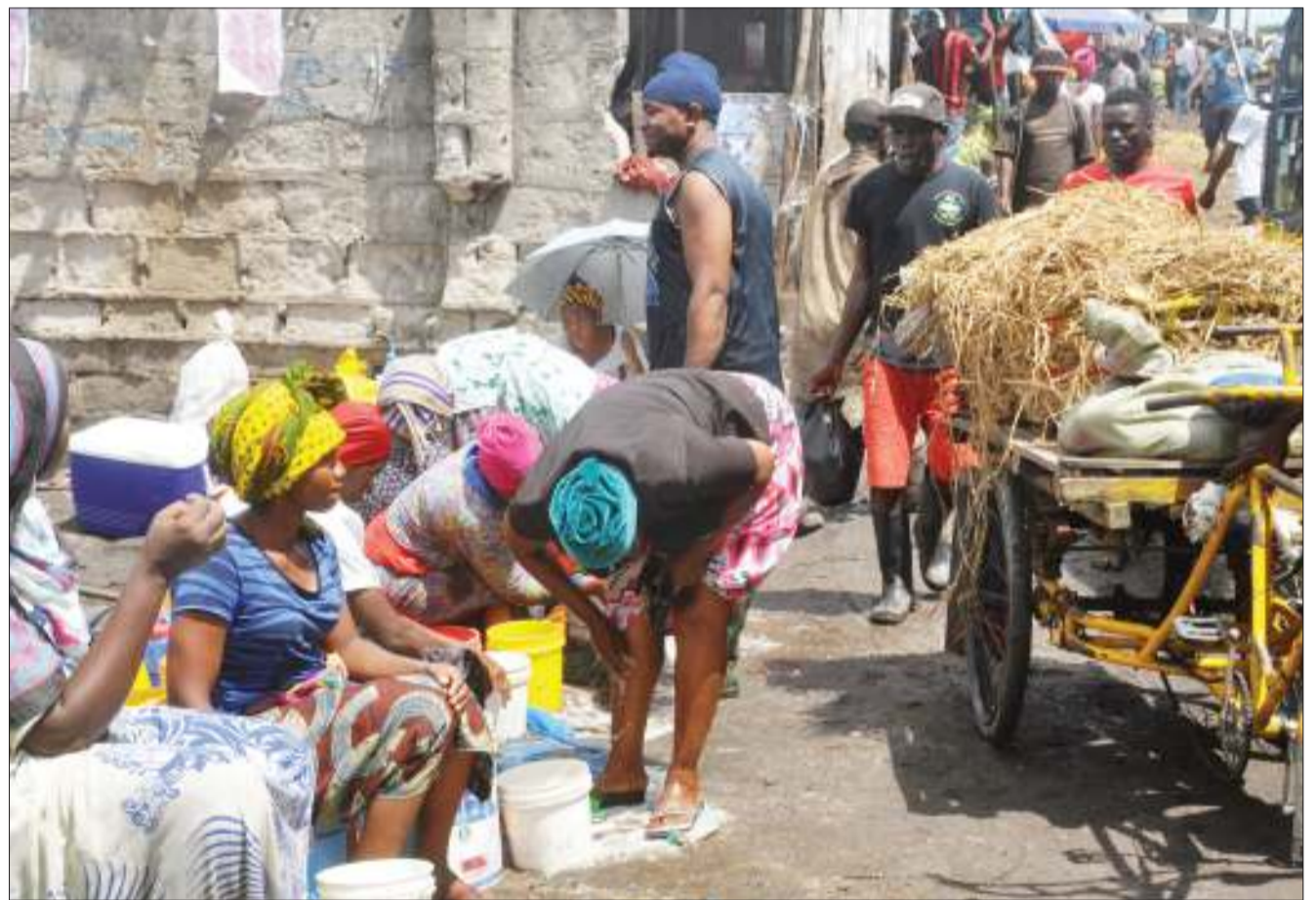
Wakazi wa Jiji la Dar es Salaam wakijipatia riziki kwa kuwaosha miguu watu waliotoka katika Soko la Mabibo maarufu kama Mahakama ya Ndizi jana. Soko hilo limejaa matope mengi yaliyosababishwa na mvua zilizonyesha. Gharama ya kuosha inanzia 200/- hadi 500/-.

Wanasheria hao walisema wanafunzi hao walimfikisha mshtakiwa kwa walimu wao, ambao nao walimfikisha polisi kwa hatua kisheria.