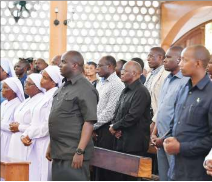
Rais Dk. John Magufuli akiwa pamoja na waumini wengine akishiriki Misa Takatifu ya Alhamisi Kuu katika Kanisa Katoliki la Mtakatifu Petro Parokia ya Oysterbay, jijini Dar es Salaam juzi.