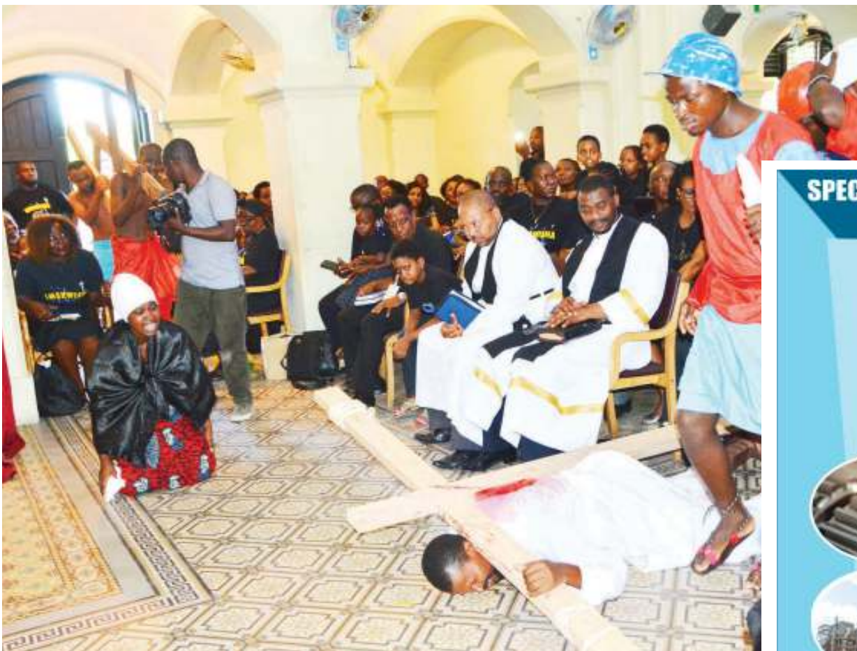
Waumini wa Kanisa la Kiinjili la Kilutheri Tanzania (KKKT), Usharika wa Azania Front, wakiigiza mateso ya Yesu Kristo, wakati wa Ibada ya Ijumaa Kuu kanisani hapo, jijini Dar es Salaam jana.

• Ni kutokana na kukosekana mvua, viongozi waonywa kutowaonea wanyonge... Ukurasa 2