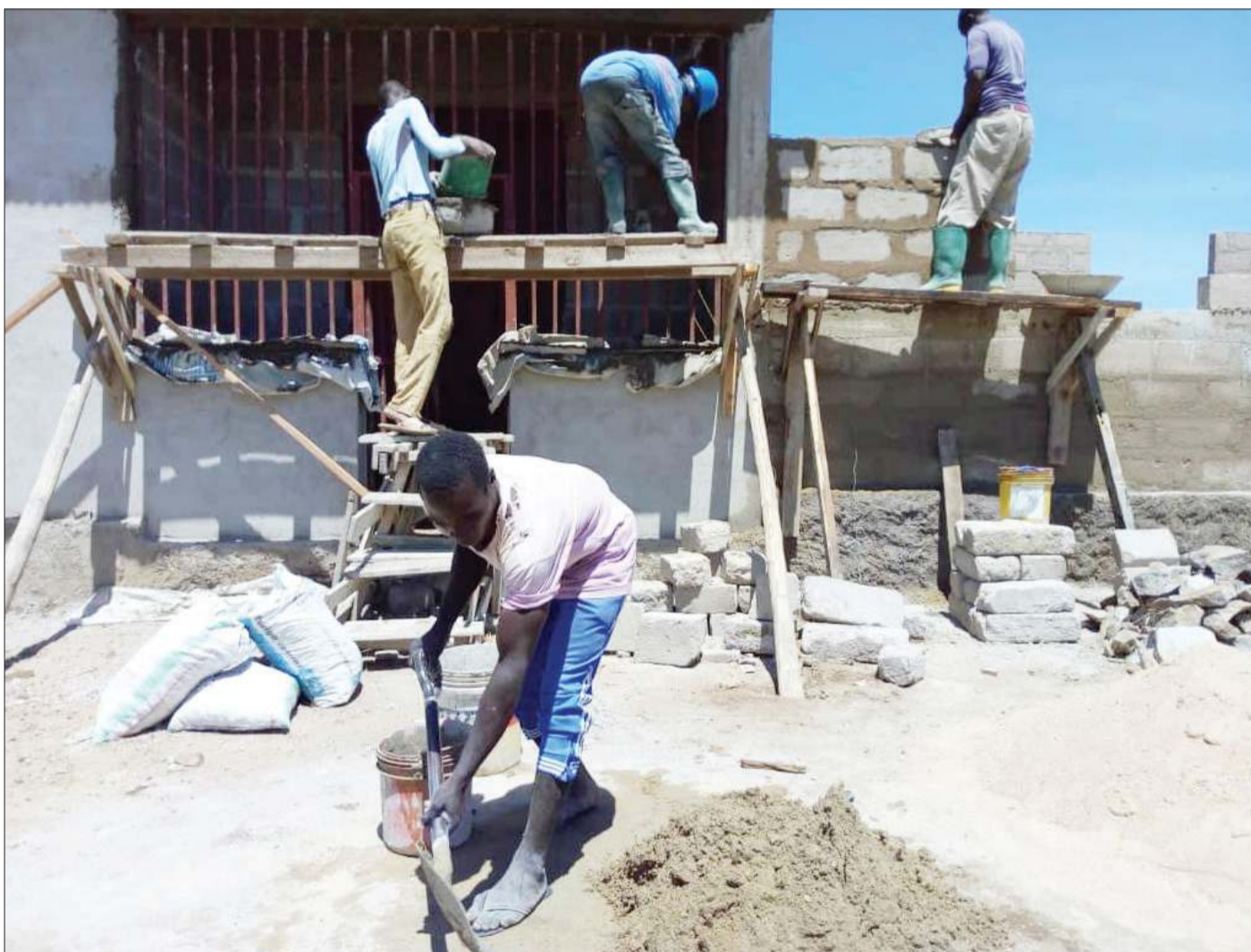
Mafundi wakijenga jengo la maabara ya kisasa ya huduma za afya ya Kanisa Katoliki, Parokia ya Bukima, Musoma Vijijini, mkoani Mara juji, ili kuwapunguzia wananchi usumbufu wa kusafiri umbali mrefu kufuata huduma hiyo.