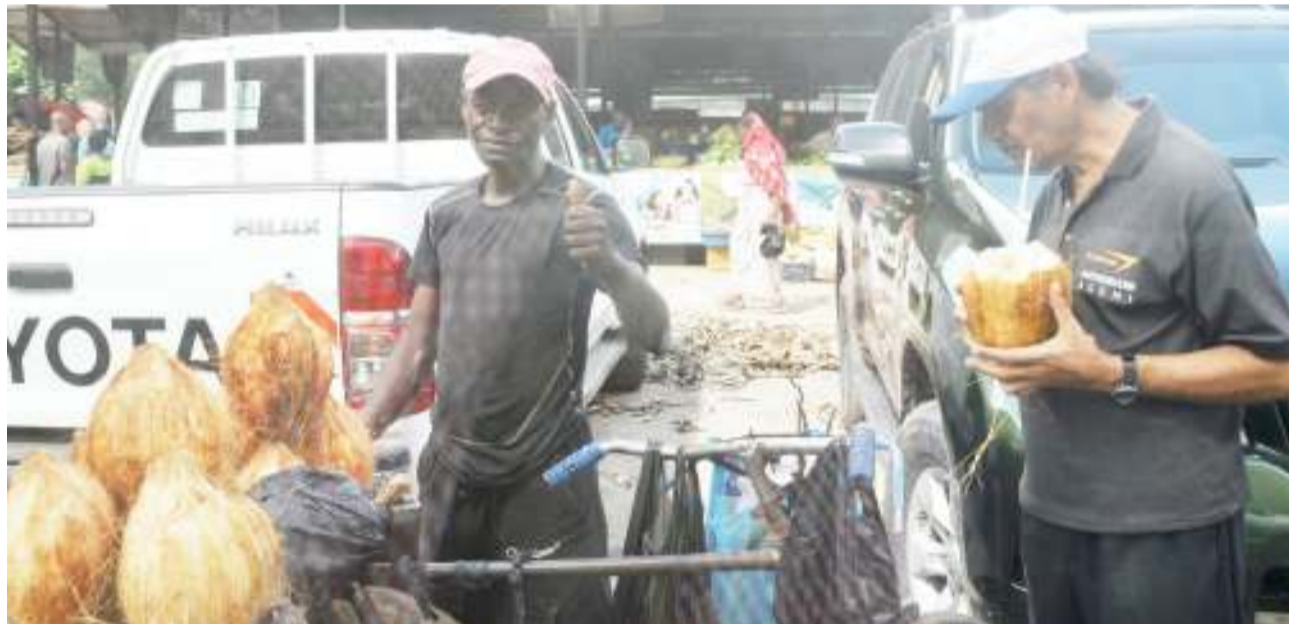
Mchuzi wa madafu akimhudumia mteja wake katika Mtaa wa South, katikati ya Jiji la Dar es Salaam jana.