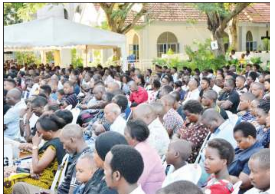
Sehemu ya umati wa waumini wa kikristo waliohudhuria ibada ya Ijumaa Kuu katika kanisa Katoliki la Mtakatifu Joseph, Barabara ya Sokoine, jijini Dar es Salaam jana.