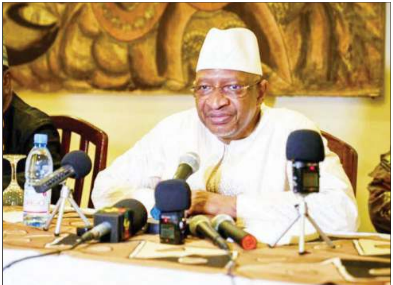
Waziri Mkuu wa Mali, Soumeylou Boubeye Maiga ambaye ametangaza kujiuzulu. PICHA: AFP

India kuna vyama mbalimbali na vile vya muungano ambavyo huchanganya wapiga kura. BBC