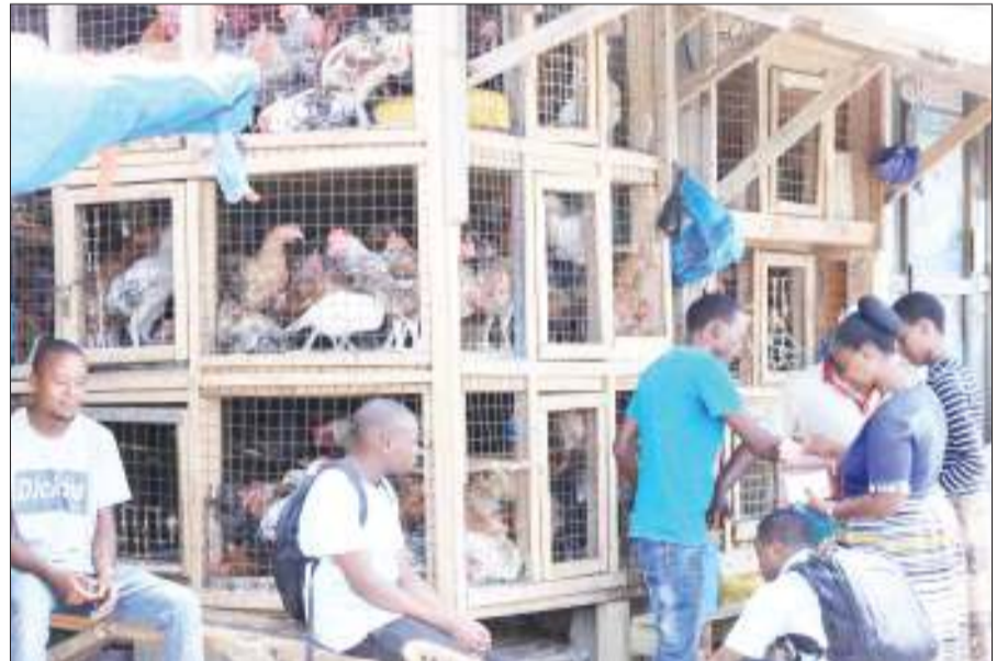
Baadhi ya wakazi wa Jiji la Dodoma, wakifanya maandalizi ya sikukuu kwa kununua kuku, katika Soko Kuu la Majengo, jana.