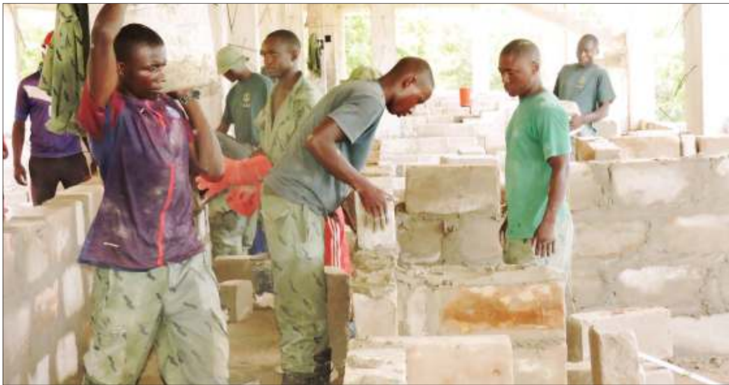
Baadhi ya vijana wa Kikosi cha Shirika la Uzalishaji Mali la Jeshi la Kujenga Taifa (SUMA JKT), wakiendelea na ujenzi wa nyumba za askari Magera, Ukonga, jijini Dar es Salaam juzi.

"Vijana wamewekwa katika mazingira malumu wakijifunza masuala ya biashara katika kilimo cha mbogamboga pamoja na mifugo, kazi hiyo ilifanywa na kituo kinachosimamiwa na PASS kitiwacho Kituo cha Ubunifu katika Kilimo," alisema Bohay.