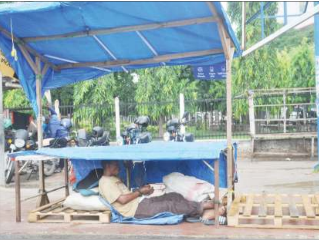
Mfanyabiashara mdogo akiwa amejificha chini ya meza yake ya biashara katika eneo la Mnazi Mmoja, akijikinga na mvua zilizonyesha, jijini Dar es Salaam juzi.