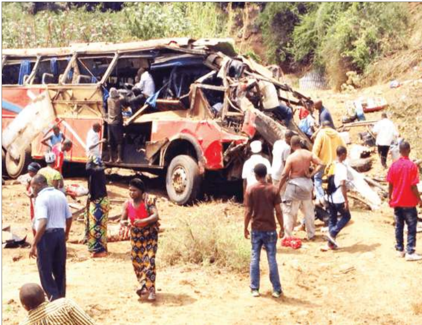
Moja ya ajali mbaya zinazolalamikiwa kila siku, kusababisha vifo, majeruhi na hasara za mali nchini.

Inawezekana bajaji, pikipiki ambazo ni kama teksi, huku zama zilizopo kuna magari mbadala wa mabasi yakiwamo ya safari ndefu. Si jambo baya.