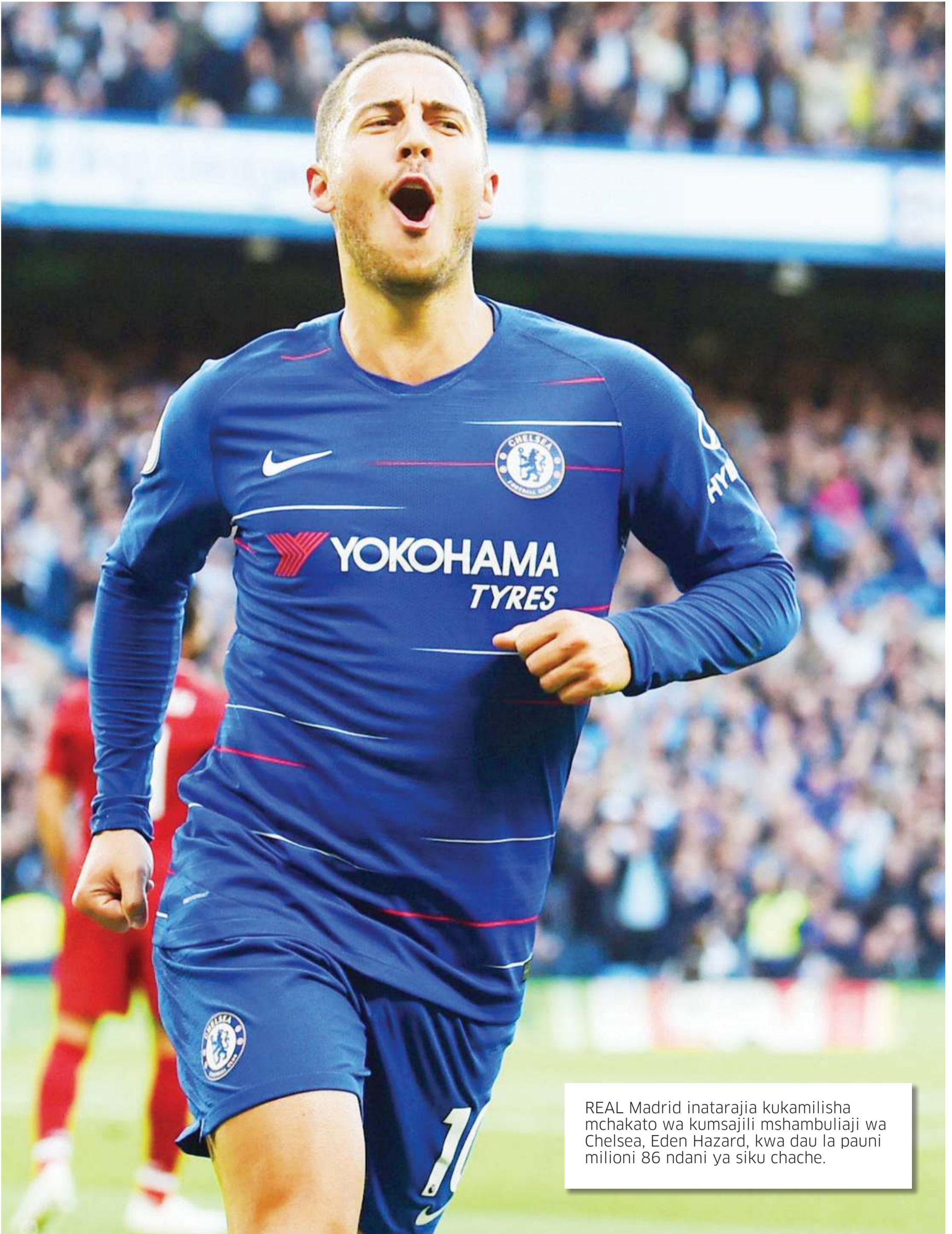
REAL Madrid inatarajia kukamilisha mchakato wa kumsajili mshambuliaji wa Chelsea, Eden Hazard, kwa dau la pauni milioni 86 ndani ya siku chache.