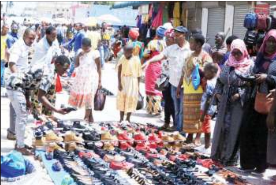
Baadhi ya wazazi wakinunua viatu kwa ajili ya watoto wao, katika Mtaa wa One Way jijini Dodoma jana, ikiwa ni maandalizi ya sikukuu ya Pasaka inayotarajiwa kusherehekewa kesho.