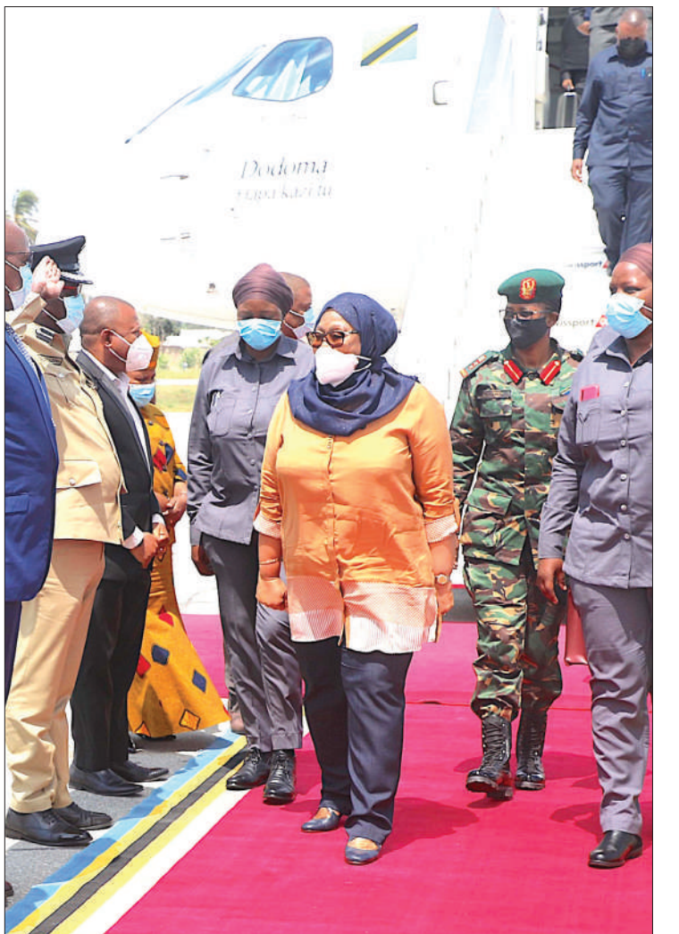
Rais Samia Suluhu Hassan akisalimiana na viongozi mbalimbali baada ya kuwasili katika Uwanja wa Ndege wa Dodoma akitokea Dar es Salaam jana.