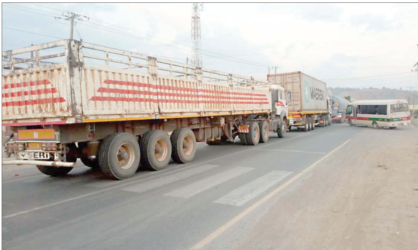
Magari ya mizigo yakiwa yamekwama katika Mji Mdogo wa Mbalizi juzi, baada ya malori mawili kugongana uso kwa uso kwenye mteremko wa Mlima Iwambi na kufunga barabara kwa zaidi ya saa nne.