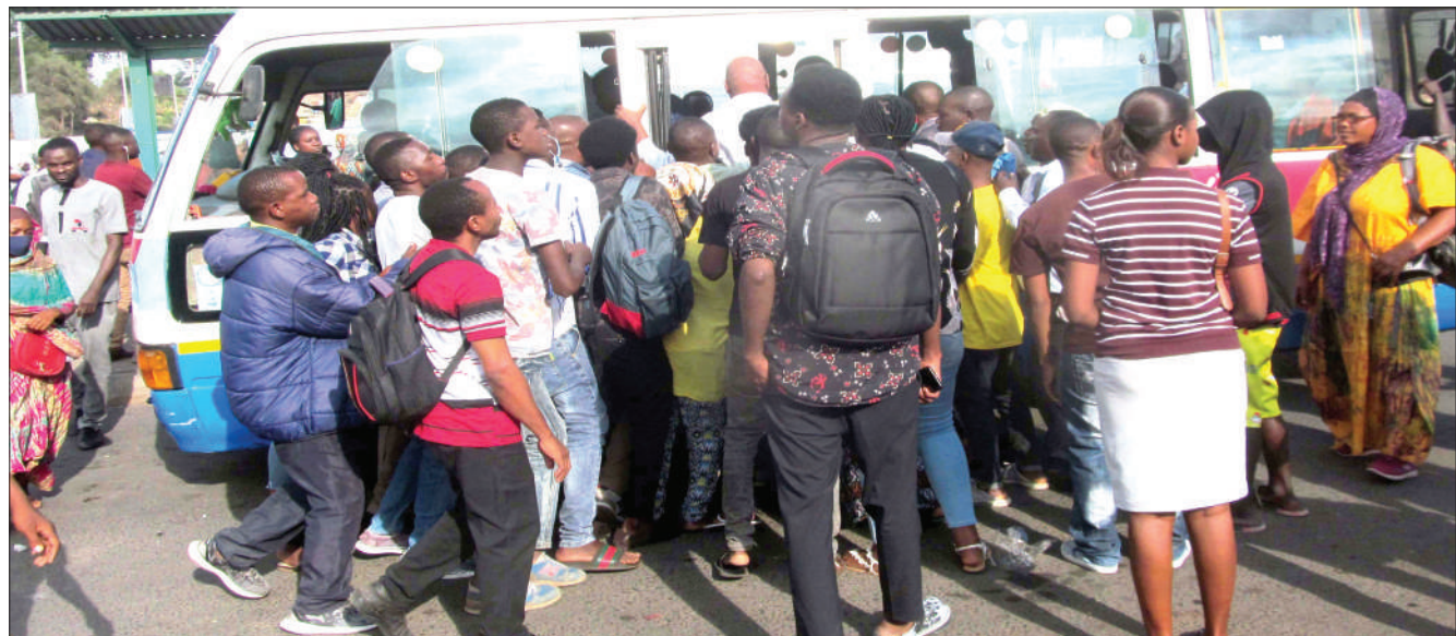
Abiria wakijaribu kuingia katika daladala, kituo cha Mbezi Mwisho jijini Dra es Salaam juzi, huku wengine wakiwa hawajavaa barakoa kama tahadhari ya kujikinga na corona.