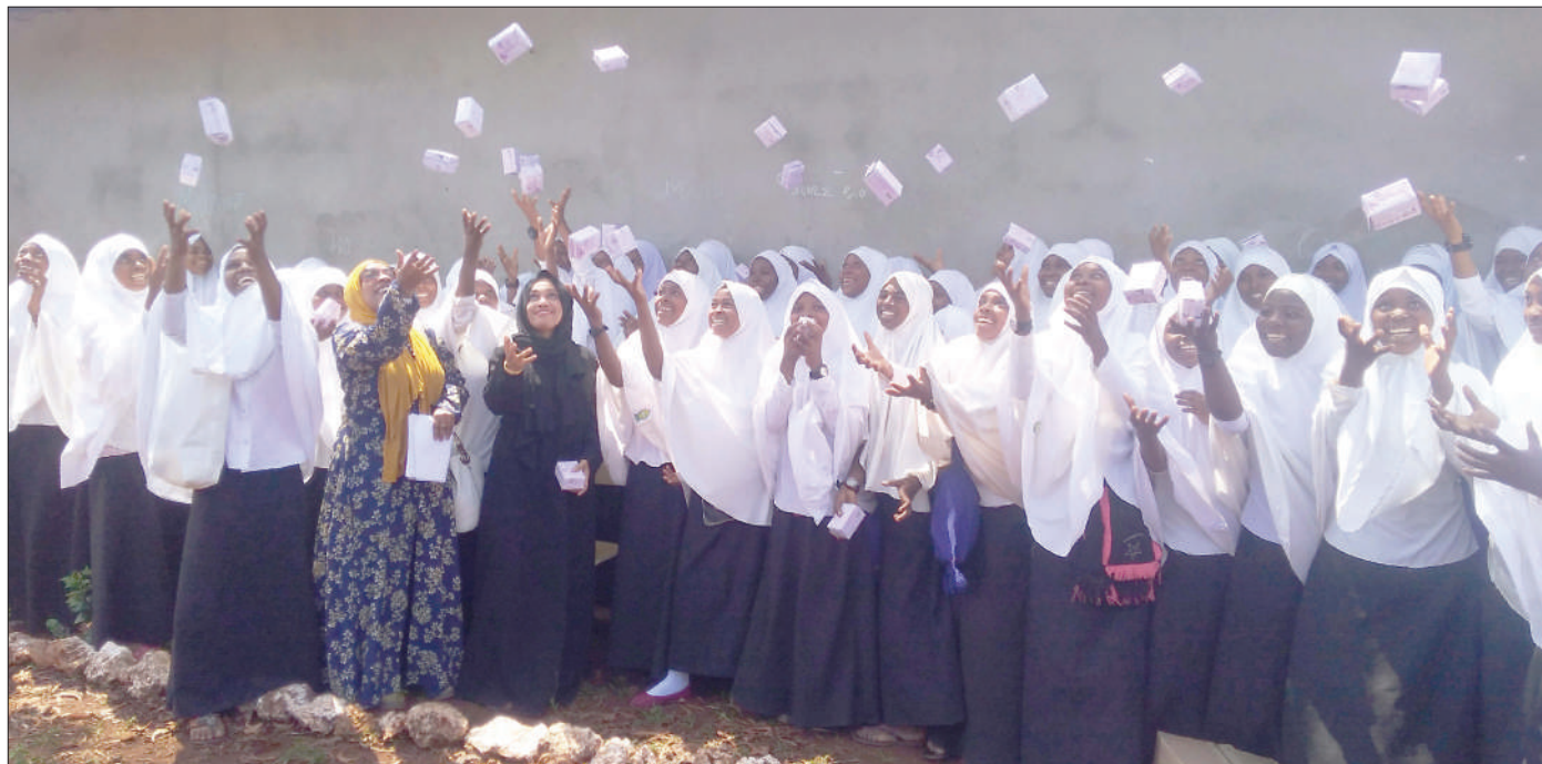
Wanafunzi wa kike wa Shule ya Sekondari Tumbatu wakifurahia msaada waliopewa wa taulo za kike ambazo zimetolewa na Taasisi ya Asma Mwinyi Foundation pamoja na mwenyekiti wa taasisi hiyo.