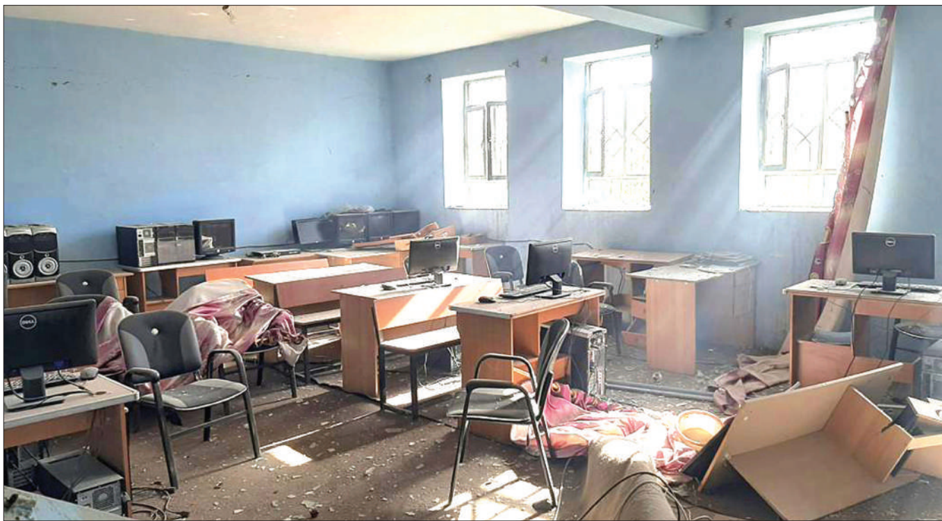
Darasa likiwa limeharibiwa na shambulizi la angani jijini Lashkar Gah Jimbo la Helmand, Kusini mwa Kabul nchini Afghanistan, huku shambulio hilo likiathiri kituo cha afya na shule, jana.