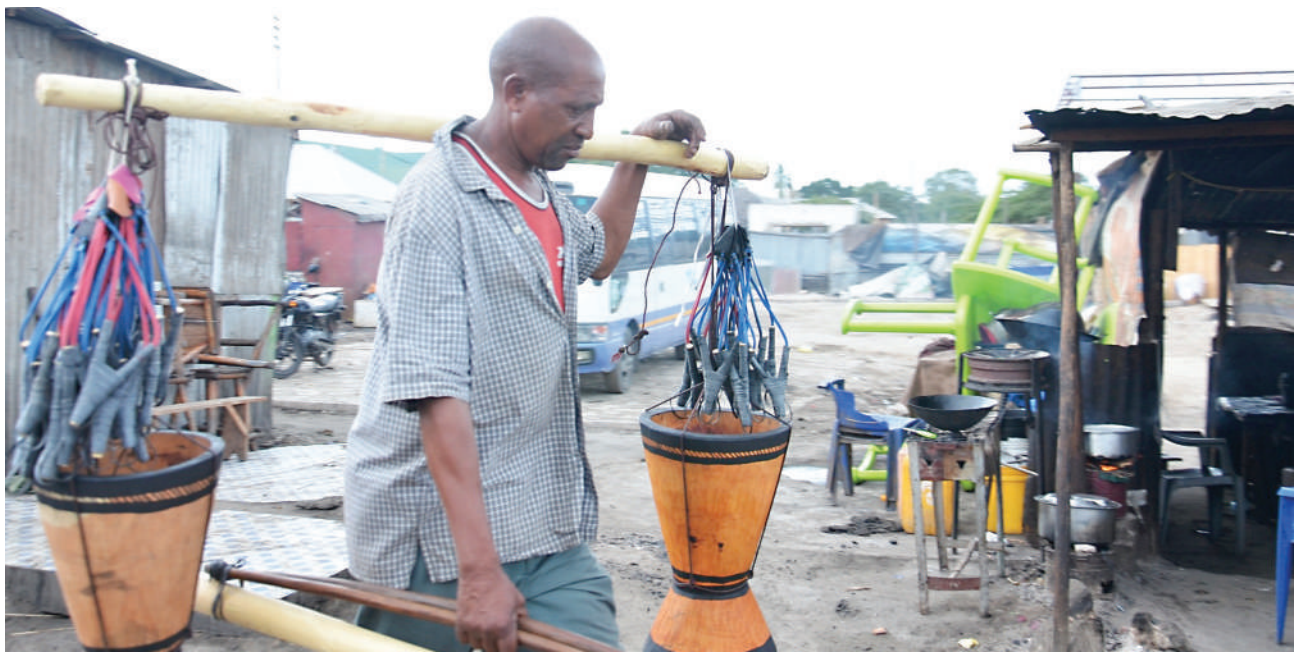
Mjasiri-mali akiwa amebeba vinu vya kutwanga akitafuta wateja katika eneo la Banana jijini Dar es Salaam mwishoni mwa wiki.

“Ninaomba Rais Samia aingilie jambo hili na kuhakikisha Mbowe anaachiwa huru na mashtaka dhidi yake yanafutwa kabla mambo hayajaharibika zaidi. Ni nasaha zangu pia viongozi na wanachama wengine wa vyama vya siasa na wanasiasa waliokamatwa kwa makosa yanayotokana na shughuli za kisiasa waachiwe huru ikiwamo wananchi wengine wanaosota mahabusu kwa miaka kadhaa.”