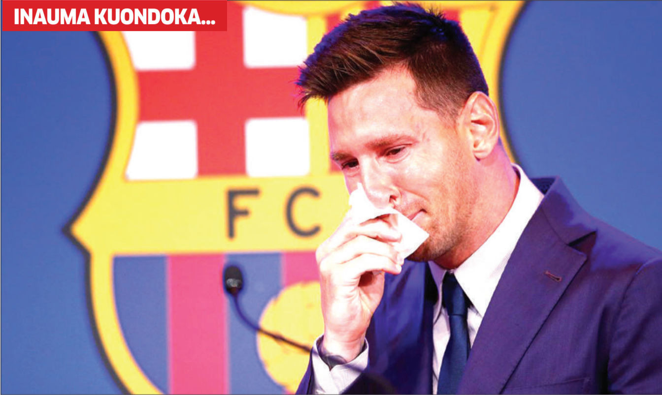
Lionel Messi akishindwa kujizuia kumwaga machozi wakati akiaga rasmi katika Uwanja wa Camp Nou kuachana na klabu hiyo jana. Messi ambaye ameshinda mataji 35 na klabu hiyo, alisema kwa uchungu "mwaka jana, sikutaka kubaki na nilisema; mwaka huu, nilitaka kubaki na hatukuweza."