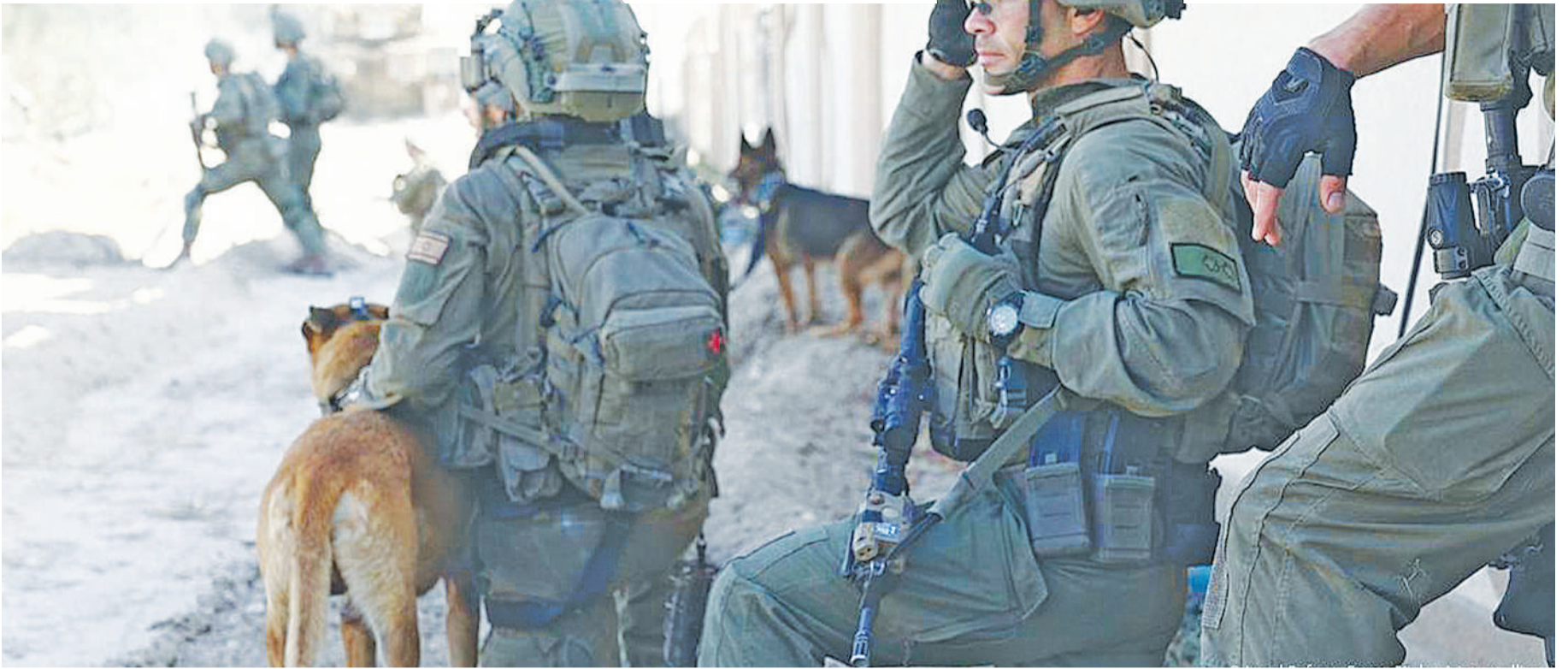
Wanajeshi wa Israel wakiwa na mbwa katika doria, huko ukanda wa Gaza, jana.