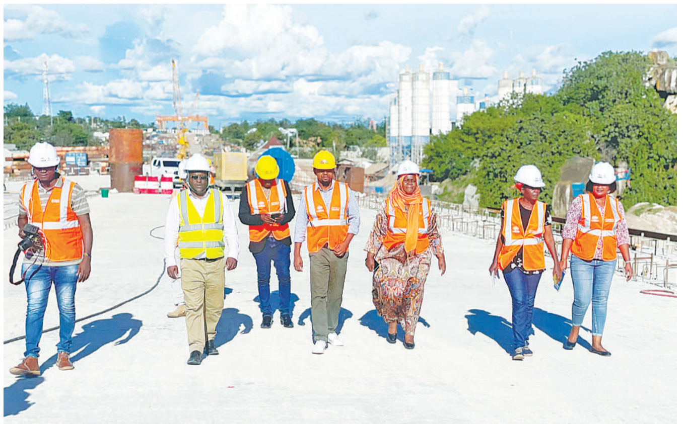
Waandishi wa habari kutoka mikoa ya Kanda ya Ziwa wakiwa na baadhi ya maafisa wa wakala wa barabara nchini (TANROADS), wakikagua ujenzi wa daraja la Kigongo-Busisi, walipofanya ziara ya kujifunza katika mradi huo, jijini Mwanza jana.

Alisema kuwa katika tukio hilo zaidi ya watu 35 wakiwamo viongozi wa kijiji wanashikiliwa na polisi ili kusaidia uchunguzi na maamuzi ya mahakama.