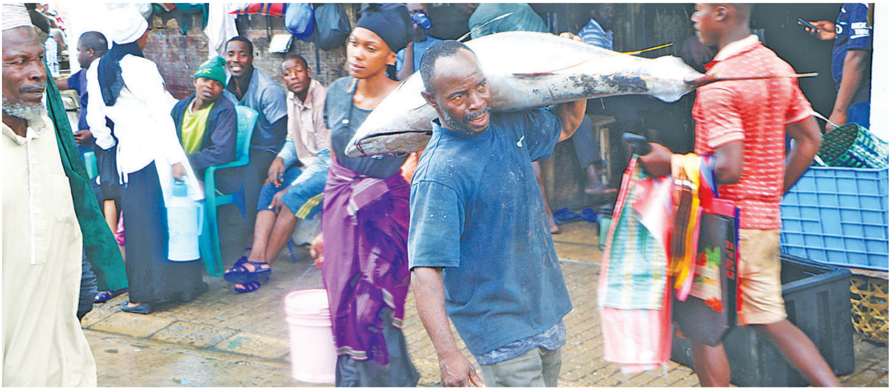
Mkazi wa Dar es Salaam, akiwa amebeba samaki aina ya jodari baada ya kumnunua katika Soko la Kimataifa la Samaki Magogoni 'feri', jijini Dar es Salaam hivi karibuni.