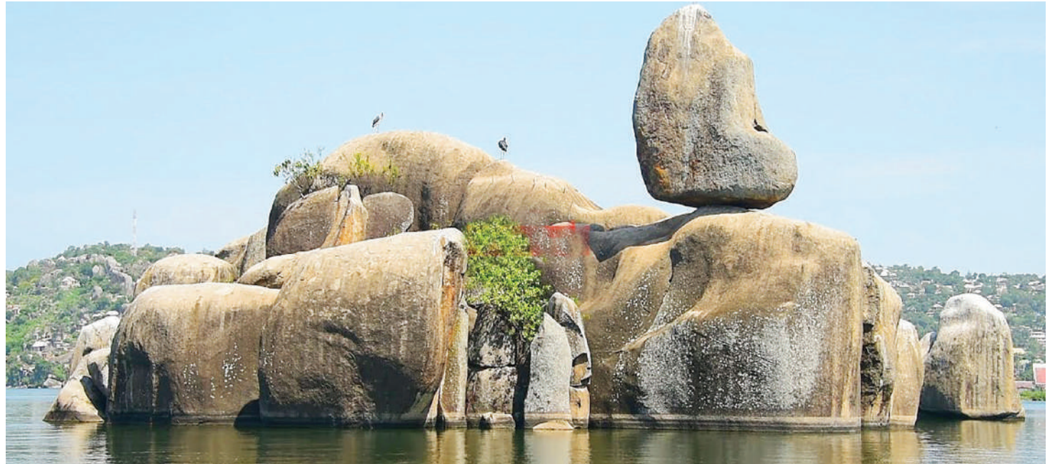
Jiwe la Bismarck linaloelea kwenye maji ya Ziwa Victoria ni kivutio kikubwa katika Jiji la Mwanza.

Baharia huyo, ambaye ana uzoefu wa takribani miaka 20 katika kufanya shughuli hiyo Ziwa