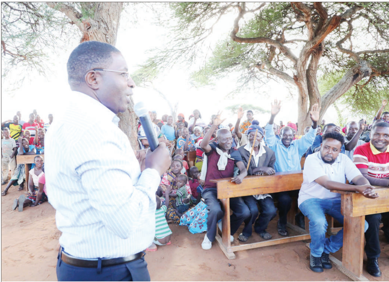
Waziri wa Nishati, Dk. Medard Kalemani, akizungumza na wananchi wa eneo la Mbande, wilayani Kongwa, Mkoa wa Dodoma.

Hata hivyo, Katibu huyo wa CHAWATA aliwaomba wabunge kufanya kazi iliyowapeleka ya kupitisha sheria na bajeti ili fedha zitoke zikatoe huduma mbalimbali kwa wananchi kama ilivyokusudiwa.