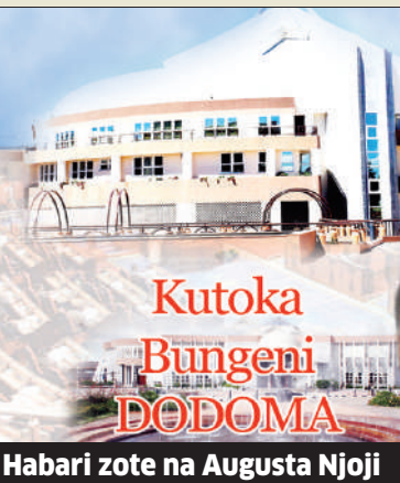
Habari zote na Augusta Njoji

Naibu waziri huyo alisema kuwa baada ya usanifu kuka-milika, ujenzi wa daraja hilo utanza kulingana na upatikanaji wa fedha.