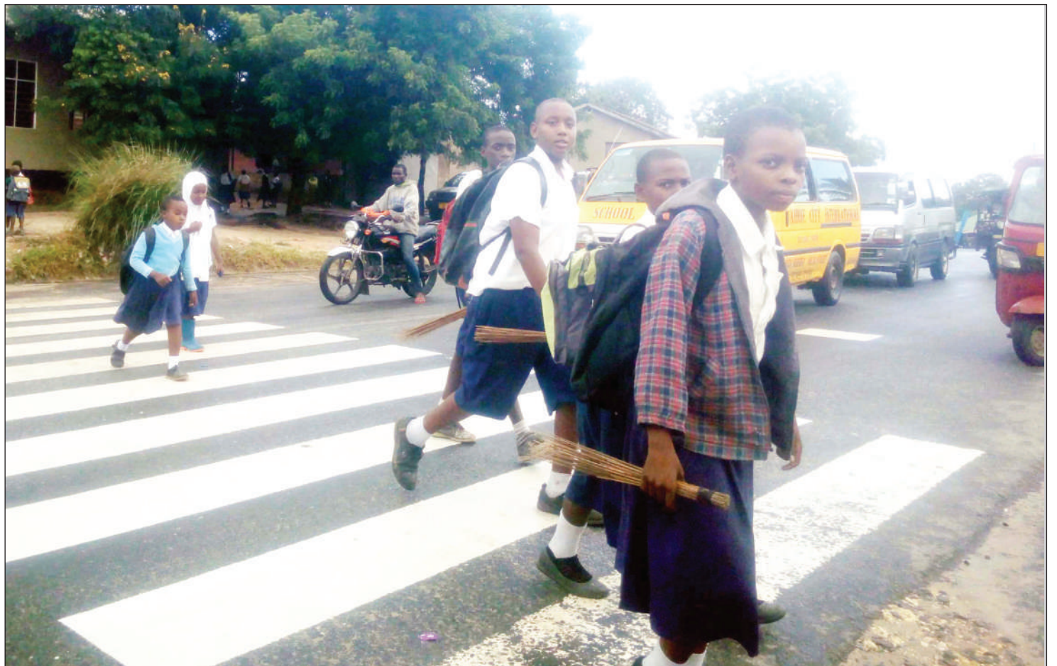
Wanafunzi wa Shule ya Msingi Kifuru, jijini Dar es Salaam, wakivuka barabara jana, huku magari yakiwasubiri ikiwa ni sehemu ya utii wa sheria za usalama barabarani.

Alisema uuzaji wa tiketi utafanywa na mawakala watatu wa China.