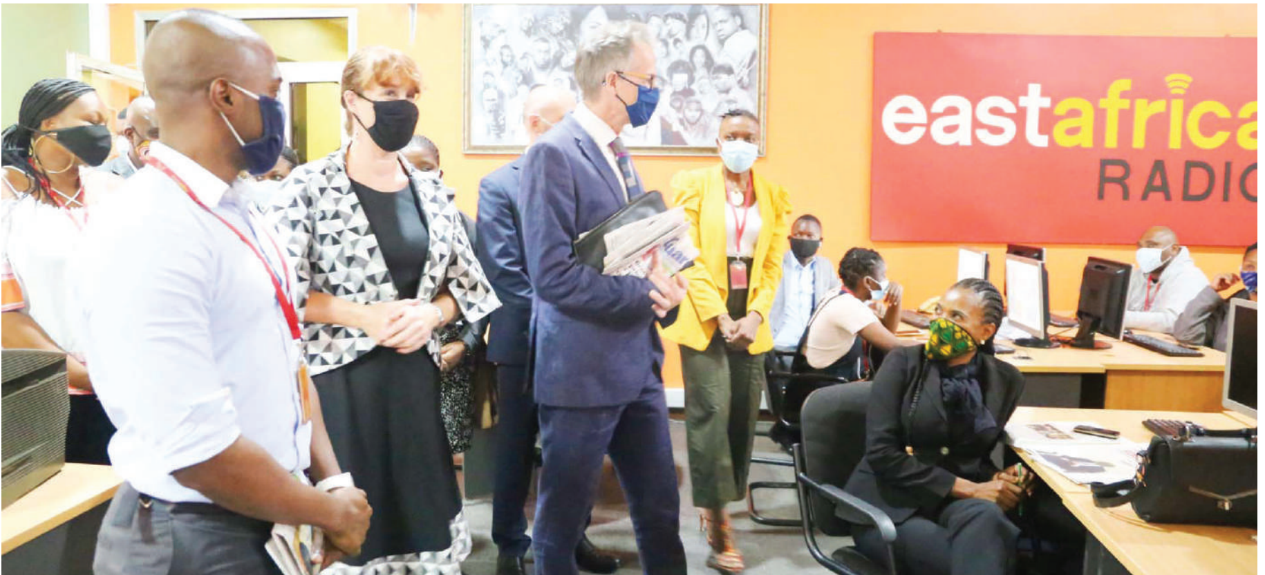
Mabalazi wa Canada na Uingereza wakitembelea chumba cha kutayarisha vipindi cha East Africa Radio na Televisheni.