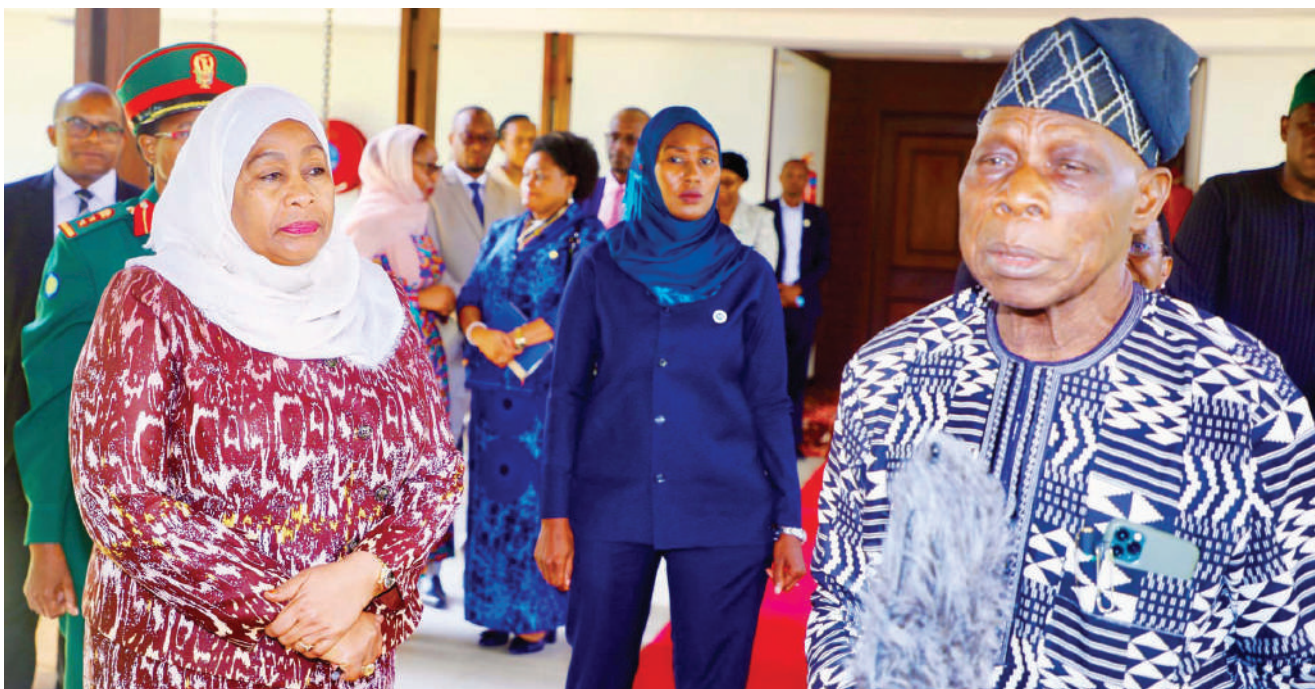
Rais Samia Suluhu Hassan akiwa na Rais mstaafu wa Nigeria, Jenerali Olesegun Obasanjo, aliyemtembelea Ikulu Chamwino mjini Dodoma jana.