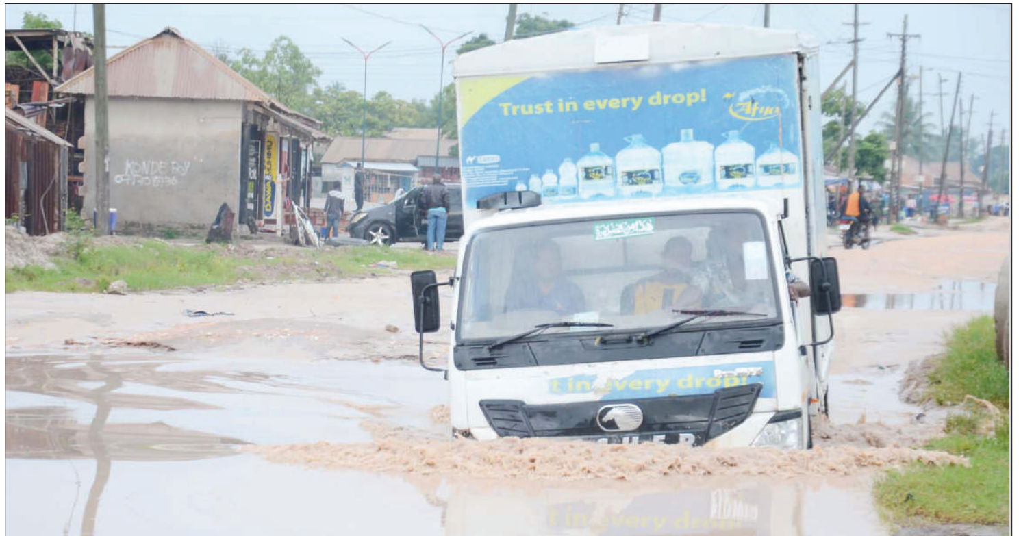
Gari likipita kwenye dimbwi la maji kutokana na mvua zinazoendelea kunyesha na kuharibu barabara katika eneo la Kitunda Kivule jijini Dar es Salaam jana.

Aidha, watu wengine watatu ambao wanadaiwa walikuwa pamoja na watu hao waliouawa, hawajulikani walipo mpaka sasa na kufanya idadi ya watu wanaohofiwa kuuawa ndani ya hifadhi hiyo kuwa sita.