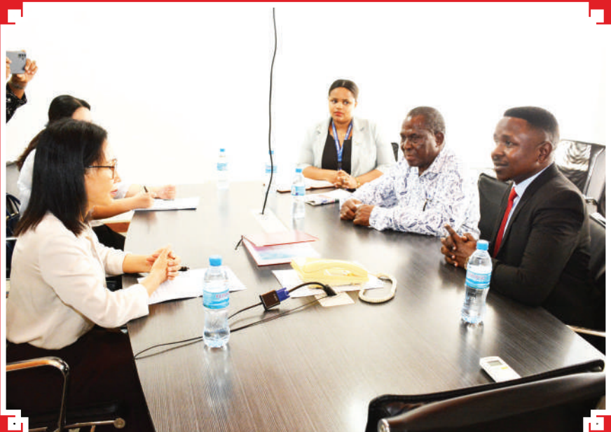
Uongozi wa Kampuni ya The Guardian Ltd ukiwa katika mazungumzo na Balozi huyo baada ya kutembelea kampuni hiyo jana.