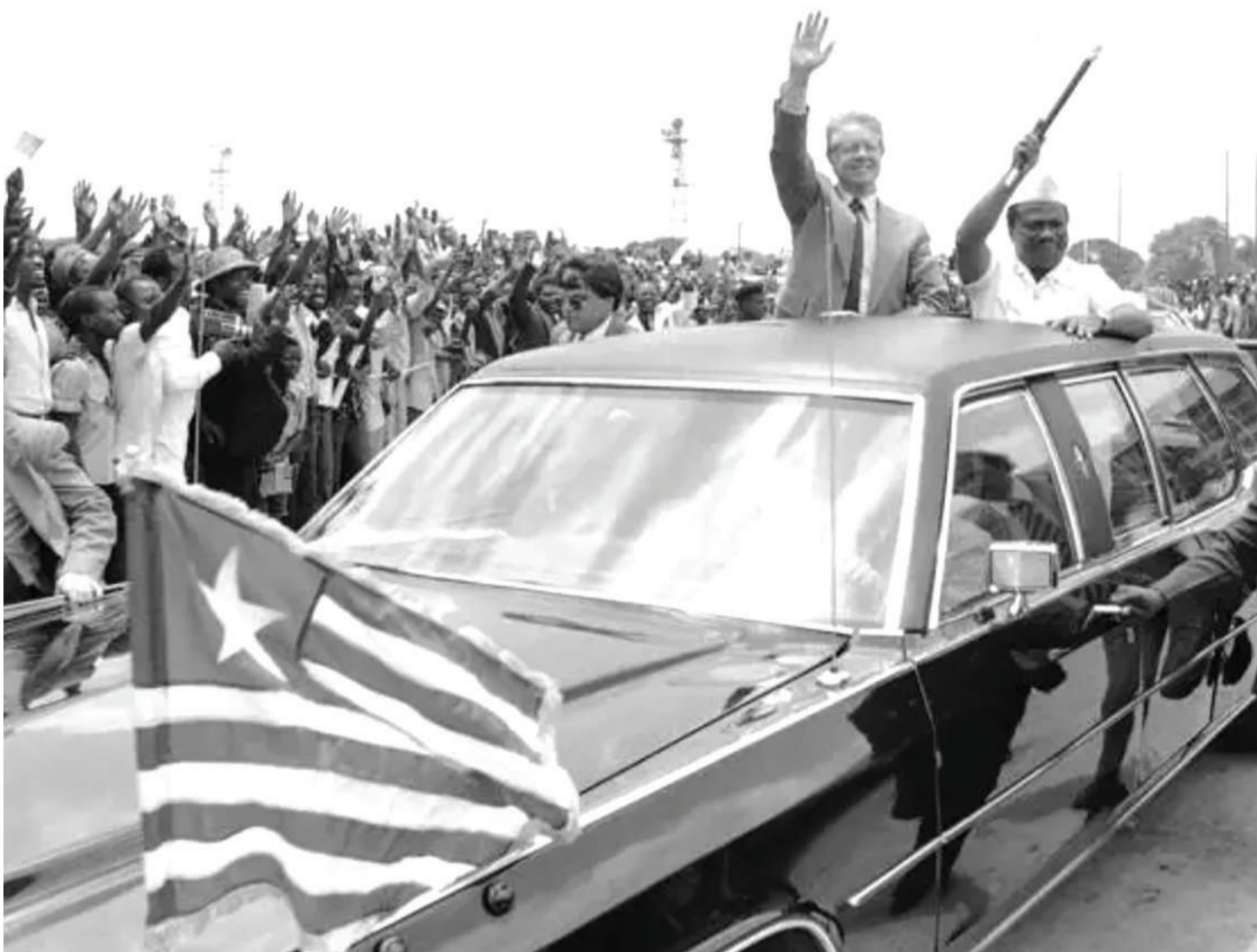
Marais Jimmy Carter (kushoto) na William Tolbert wa Liberia wakisalimiana na umati jijini Monrovia, Liberia Aprili, 1978.