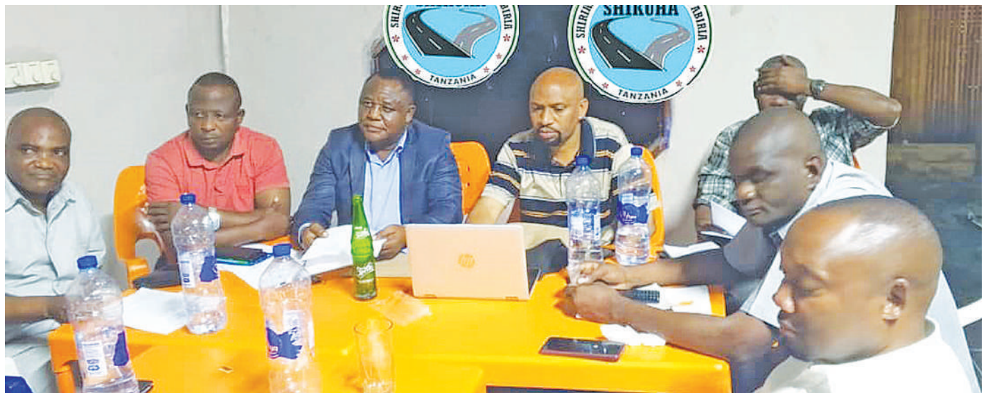
Baadhi ya viongozi wa Shirika la Kuteteza Haki za Abiria wakiwa katika kikao cha ndani cha kupanga mikakati ya kuimarisha zaidi utendaji kazi wa shirika hilo jijini Dodoma juzi.