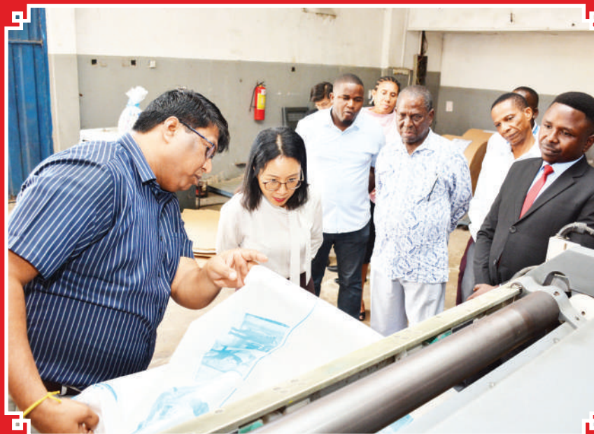
Balozi wa China akiangalia namna mchakato wa uchapaji wa magazeti una- vyofanywa wakati alipotembelea kiwanda cha uchapaji cha The Guardian Ltd Mikocheni jijini Dar es Salaam jana.