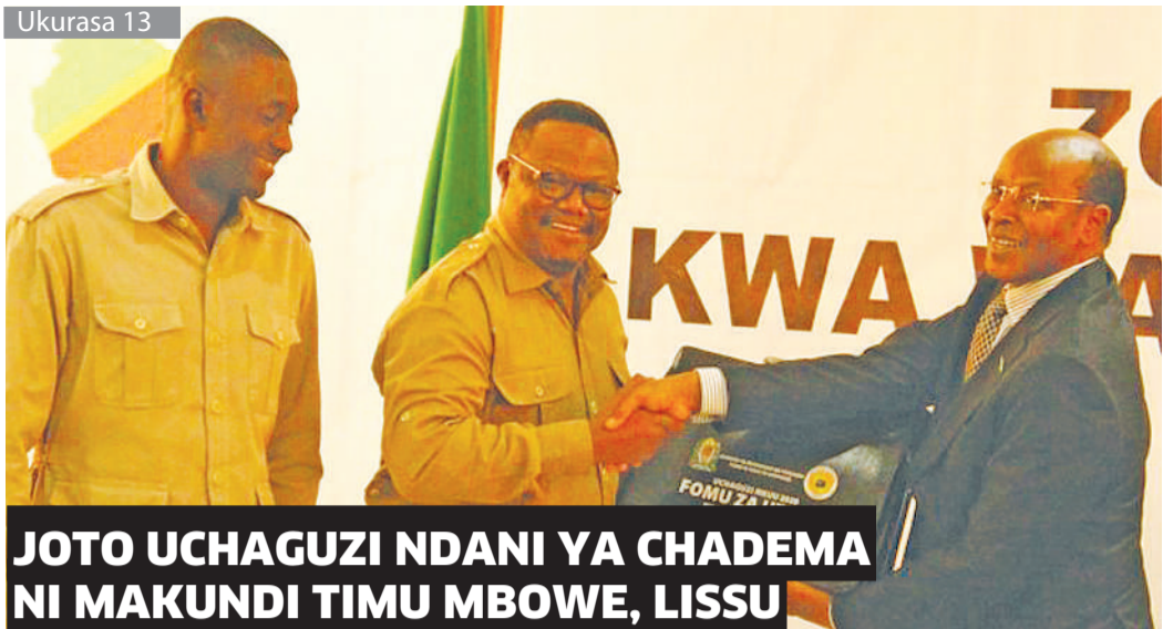
JOTO UCHAGUZI NDANI YA CHADEMA NI MAKUNDI TIMU MBOWE, LISSU