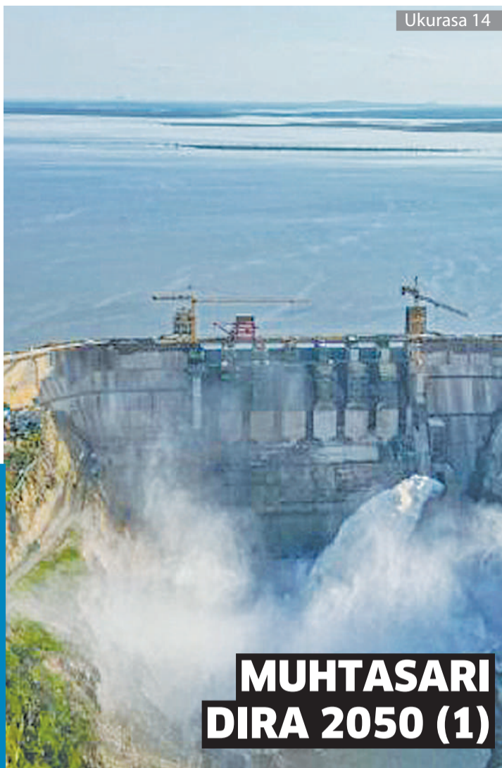
MUHTASARI DIRA 2050 (1)