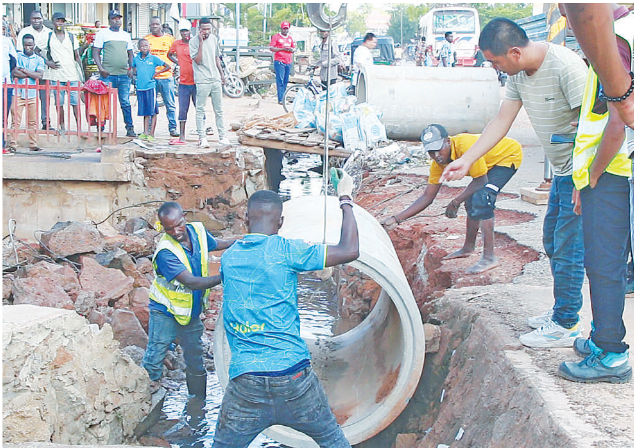
Mkandarasi wa ujenzi wa mradi wa barabara wa uboreshaji wa miundombinu ya miji Tanzania (TACTIC) katika Halmashauri ya Manispaa ya Kahama mkoani Shinyanga, akiendelea na ujenzi wa mitaro ili kuzuia maji kutuama na kuingia katika makazi ya wananchi na kusababisha mafuriko katika mtaa wa Nyasubi jana.