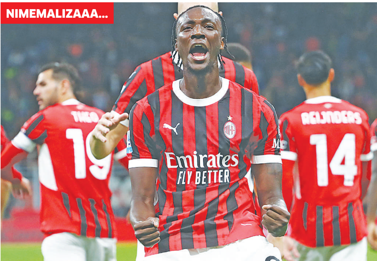
Mshambuliaji wa AC Milan, Tammy Abraham, akishangilia baada ya kuifungia timu yake bao la ushindi wakati ikishinda 3-2 dhidi ya Inter Milan, kwenye mechi ya fainali ya Kombe la Italia (Italian Super Cup), iliyopigwa Uwanja wa Kingdom Arena, Riyadh, Saudi Arabia, usiku wa kuamkia jana.