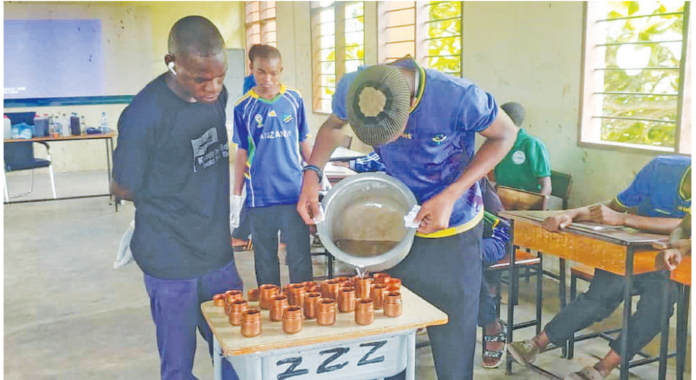
Wanafunzi wa Shule ya Sekondari Mema Asep Learning Centre iliyopo Kisarawe mkoani Pwani wakiwa katika mafunzo ya kutengeneza mafuta ya mgando yaliyotolewa na kampuni ya Matungulu's Product hivi karibuni, kwa lengo la kuwapa ujuzi wa kujijajiri wanapohitimu masomo yao.