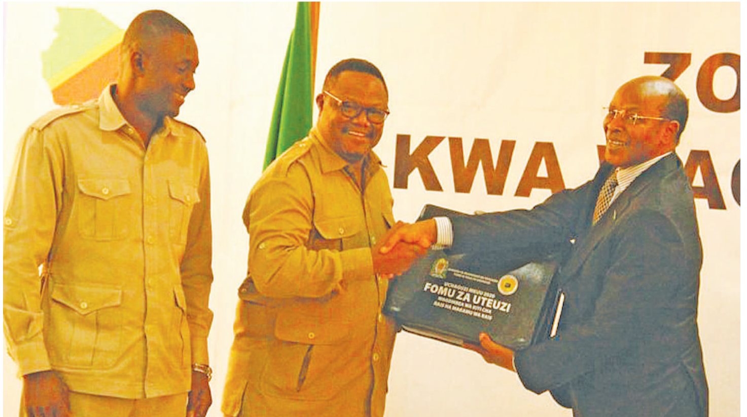
Mgombea wa urais CHADEMA 2020, Tundu Lissu, akipokea begi lenye fomu ya kugombea nafasi hiyo kutoka kwa viongozi wa chama.

Anaongeza: "Mtu wa aina hiyo anatakiwa kuelimishwa au kukumbushwa urithi wetu huu na kwa vyovyote vile asiruhusiwe kutuletea utamadani tofauti katika kubadilishana madaraka na uongozi katika chama chetu."