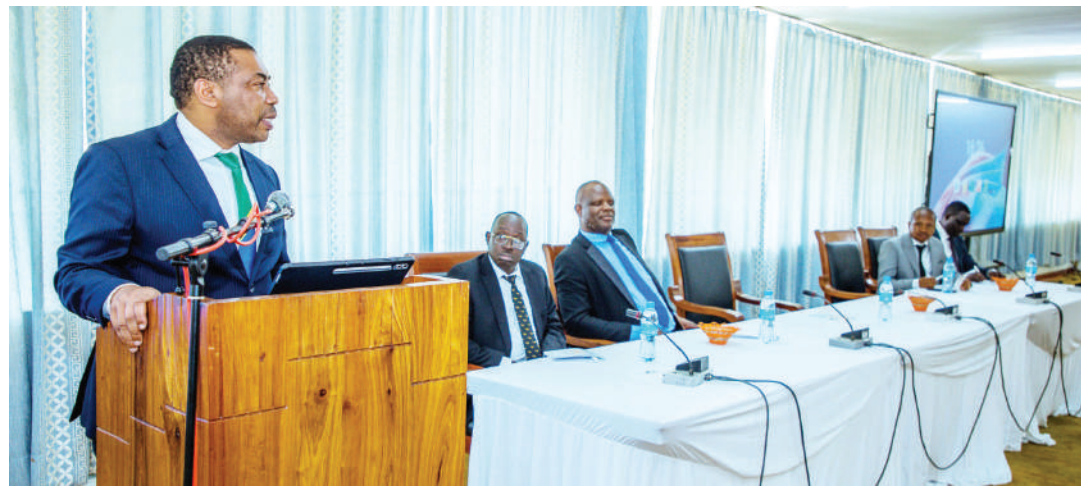
Waziri wa Fedha, Dk. Mwigulu Nchemba, aki- zungumza wakati akifungua mafunzo maalum ya siku tano kwa Kamati ya Kudumu ya Bunge ya Hesabu za Serikali yanayohusu usimamizi wa fedha za umma, yaliyoandaliwa na Wizara ya Fedha kupitia Idara ya Mhasibu Mkuu wa Serikali, yaliyofanyika jijini Arusha jana.

Kwa maoni kuhusu habari hii na nyingine: +255 677 020 701 Email: customerrelations@guardian.co.tz