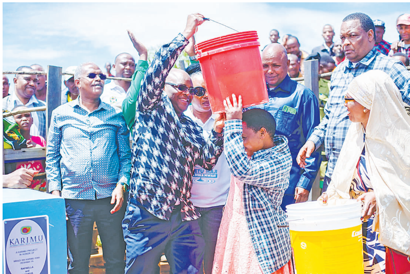
Waziri wa Nchi Ofisi ya Rais, Mipango na Uwekezaji, Prof. Kitila Mkumbo, akimtusha ndoo ya maji mama katika kata ya Arri iliyoopo Halmashauri ya Wilaya ya Babati, mkoani Manyara baada ya kuzindua mradi wa maji juzi, wenye thamani ya zaidi ya Sh. bilioni 2 uliofadhiliwa na Shirika la Karimu Foundation ambao utahudumia zaidi ya wananchi 3,000.