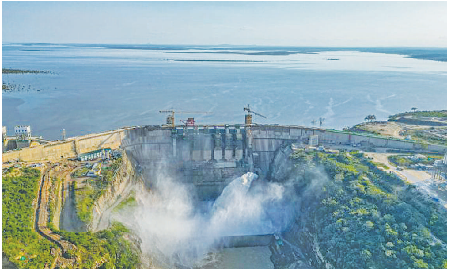
Bwawa la kuzalisha umeme la Mwalimu Nyerere Rufiji, mkakati wa dira 2025 kuongeza umeme.

Ongezeko la watu linaathiri kwa kiasi kikubwa upatikanaji