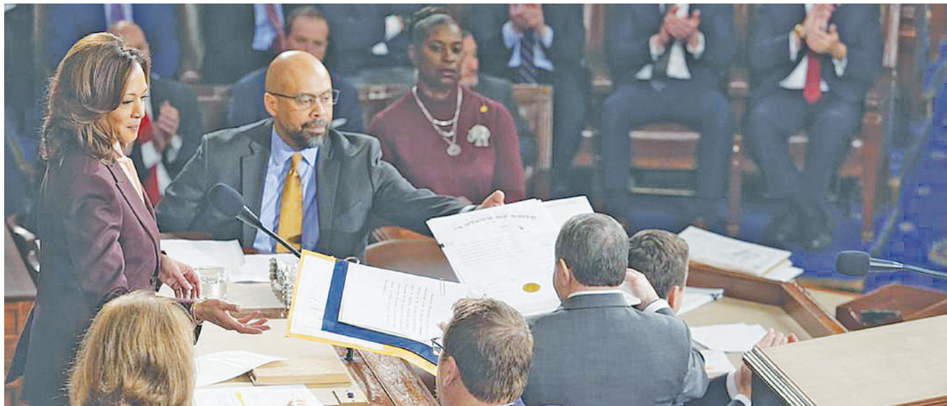
Makamu wa Rais wa Marekani, Kamala Harris, akisimamia uthibitishwaji wa ushindi wa Donald Trump kuwa rais wa Marekani bungeni, jana.