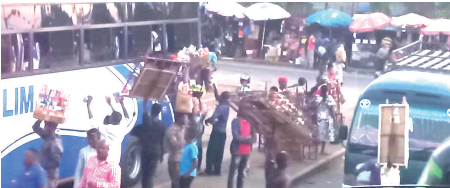
Baadhi ya abiria katika Stendi Kuu ya Mabasi Moshi wakisubiri magari.

• Kila upande unakiri...kitendawili utatuzi