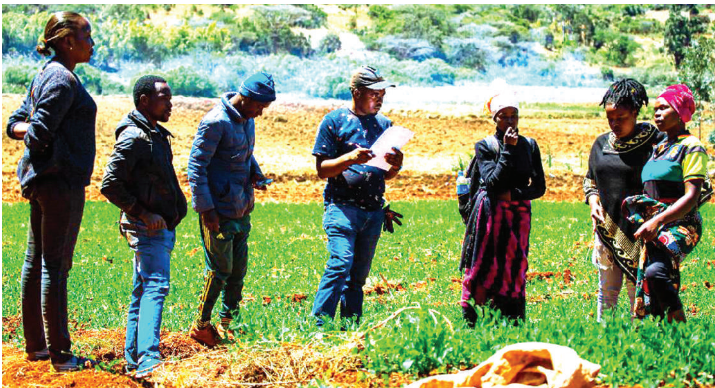
Timu ya Bridge for Change wakikagua moja ya mashamba yanayolimwa na vikundi vya vijana wilayani Kilolo, mkoani Iringa.