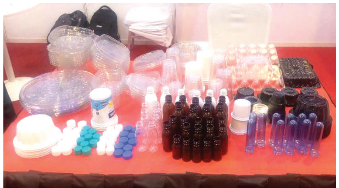
Baadhi ya vifungashio katika maonyesho ya biashara jijini Dar es Salaam wiki iliyopita.

Anatoa mfano wa vifungashio vingine vinavyokosekana ni, vina-vyohusisha vipodozi hasa za bidhaa za 'tyubu.'