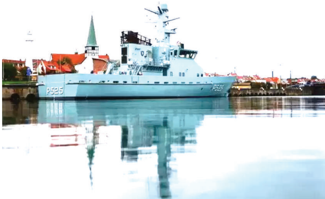
Meli ya kivita ya Denmark ikiwa karibu na kisiwa cha Bornholm, katika doria ya bomba, jirani na eneo la tukio.

"Mlipuko huo ulikuwa na nguvu sana, kwa hivyo itachukua muda kabla ya kuzama