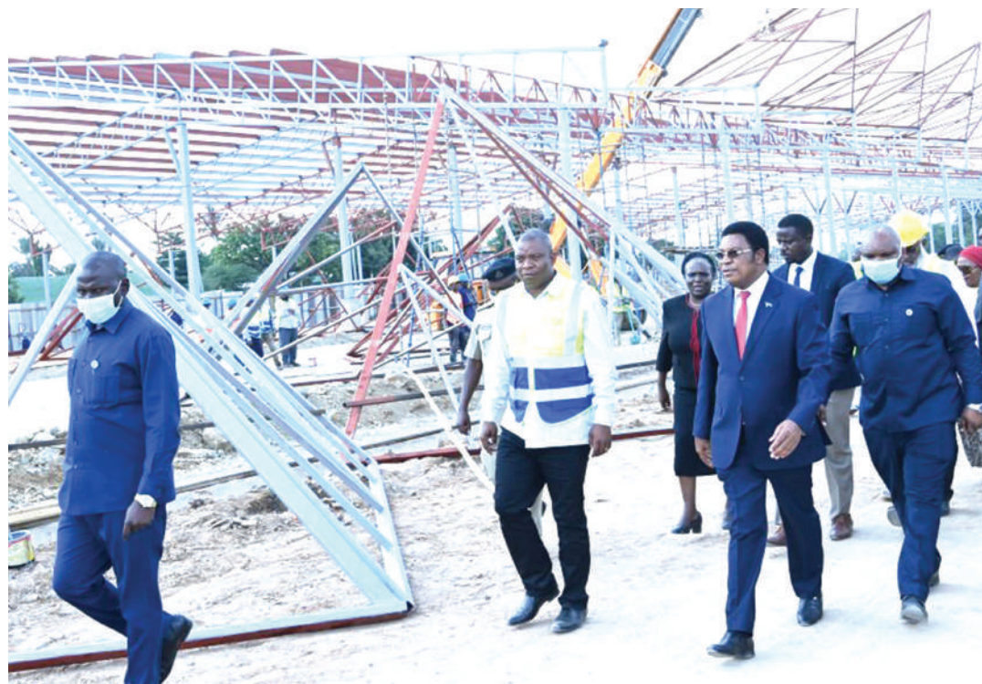
Waziri Mkuu, Kassim Majaliwa, alipokagua ujenzi wa Soko la Machinga Complex, jijini Dodoma.

Hata hivyo, anaitaka serikali kuweka mfumo thabiti utakaowasaidia kudhibiti upotevu wa mapato na uwekezaji hapa ukubalike zaidi.