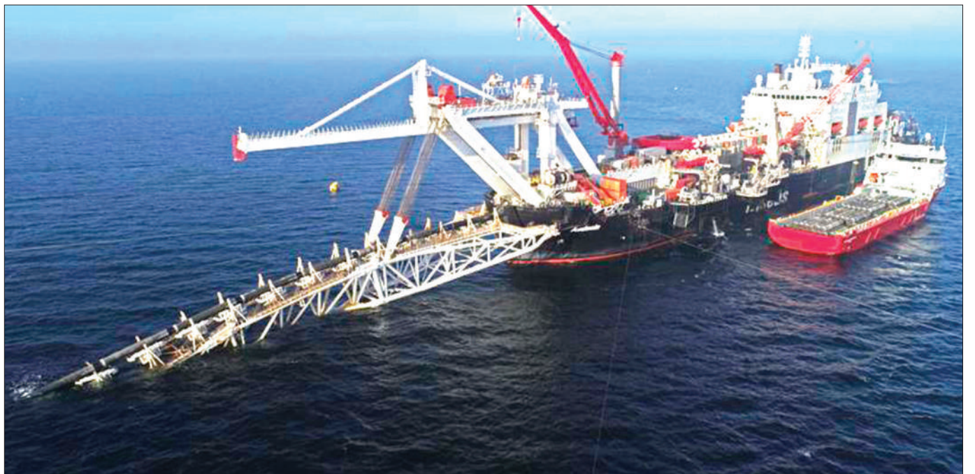
Meli ya kivita ya Denmark karibu na eneo la bomba la gesi lilipasuka katika bahari ya Baltic.