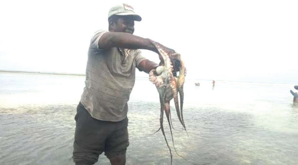
Mvuvu akionyesha pweza baada ya kumvua.