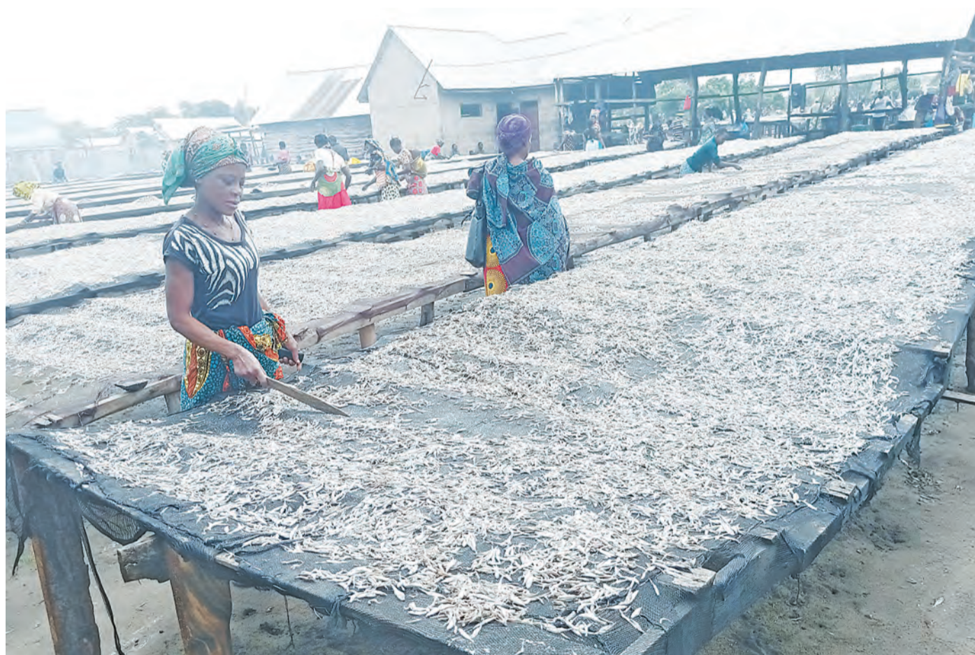
Wafanyabiashara wa dagaa katika mwalo wa Igombe wakikausha dagaa kwenye vichanja, njia ambayo inatajwa kutokidhi vigezo vya dagaa bora kwa sababu hutumia siku nzima kukausha na kuwapa hasara wafanyabiashara hasa kipindi cha mvua.

Alisema daraja hilo linatekelezwa na Mkandarasi China Civil Engineering Construction Corporation (CCECC) kwa gharama ya Sh.bilioni 716.3. Lina urefu wa km 3.2 na litakapokamilika mwakani litarahisisha usafirishaji ndani ya Tanzania na nchi za maziwa makuu.