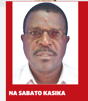
NA SABATO KASIKA

Kwa mujibu wa wataalam wa afya, mvua za aina