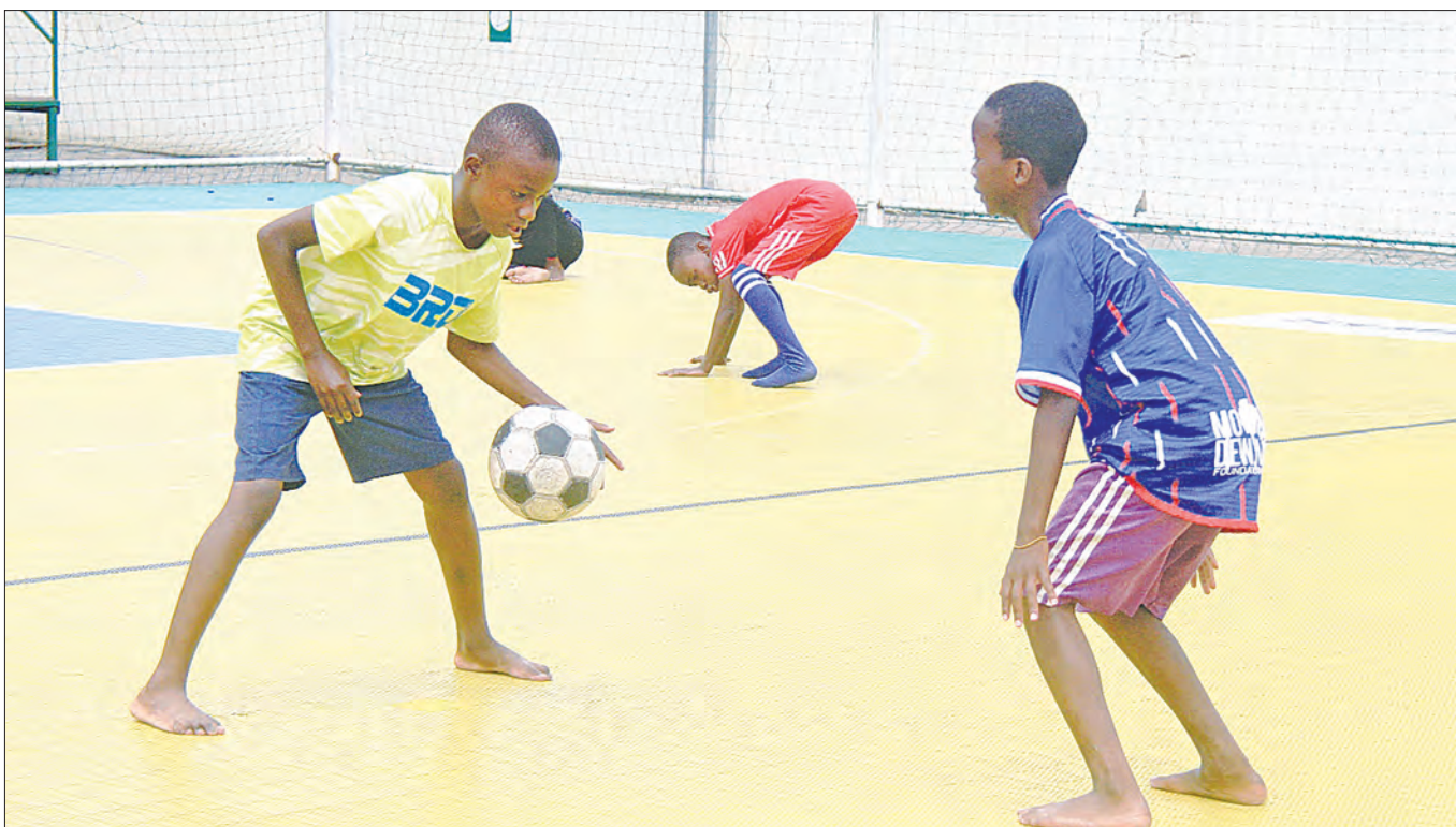
Watoto wakicheza mpira wa kikapu bila viatu kama walivyokutwa jana kwenye viwanja vya Jakaya Kikwete jijini Dar es Salaam.

"Kwa mujibu wa ratiba ya michuano ya CECAFA ilivyo huwa kuna michezo za saa saba mchana ambapo jua huwa kali, sasa ni lazima na sisi katika kipindi hiki tupate nafasi hiyo ya kufanya mazoezi mchana wakati wa jua kali walau kwa wiki moja kabla ya safari lakini hali hewa ya mvua kwetu inatukwamisha" Alisema.