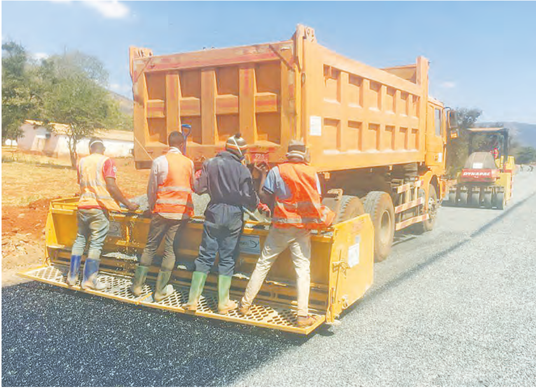
Shughuli za ujenzi wa Barabara chini ya TARURA, zikiendelea.

TARURA ina jukumu la kusimamia matengenezo, ukarabati na