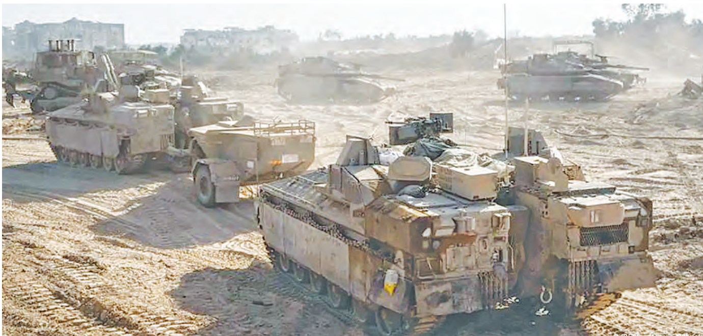
Vifaru vya jeshi la Israel vikiwa ndani ya Ukanda wa Gaza vikifanya mashambulizi.

Uamuzi huo wa Papa Francis unaonekana kumjibu Askofu kutoka Ufilipino ambaye alionyesha wasiwasi wake juu ya kuongezeka kwa idadi ya Wakatoliki katika dayosisi yake wanaoijiunga na vyama vya freemason.