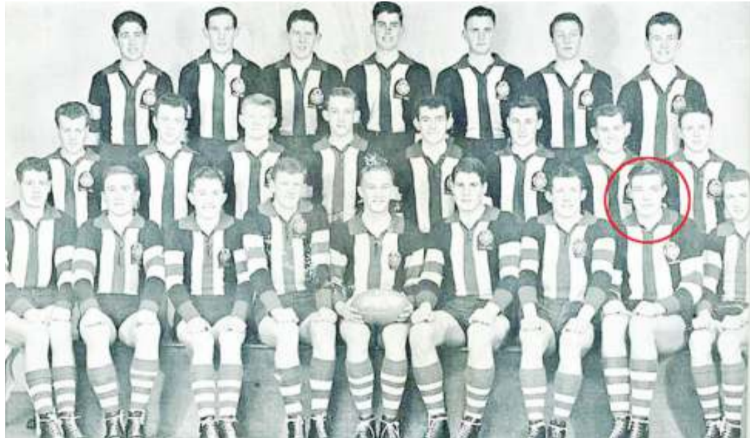
George Pell (aliyezungushiwa, aliyekaa mbele wa pili kutoka kulia), alipokuwa mchezaji soka.

Shida hiyo ya kiafya aliripotiwa kuipata mnamo Januari 2010, hata akalazimika kwenda makao makuu ya kanisa kuhudumiwa kiafya. Ni suala lililozua mjadala kisheria, ukiwapo msukumo wa kisheria uliomhitaji nyumbani. Madaktari waliomtibu, walituma ripoti maalum iliyoeleza afya yake na kwamba hakufaa kusafiri angani, wakiahidi angetarajiwa kuwa