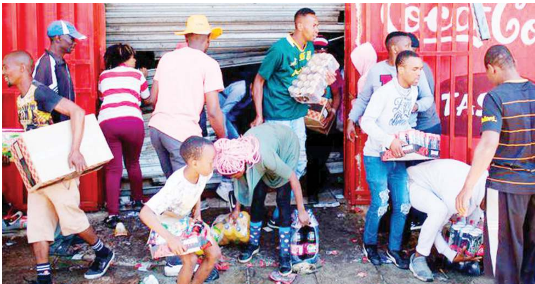
Raia wa Afrika Kusini wakipora mali katika maduka ya kigeni.

Vurugu hizo zimetokea kuelekea kongamano la kiuchumi la dunia litakalofanyika mjini Cape Town kuanzia Jumatano. DW