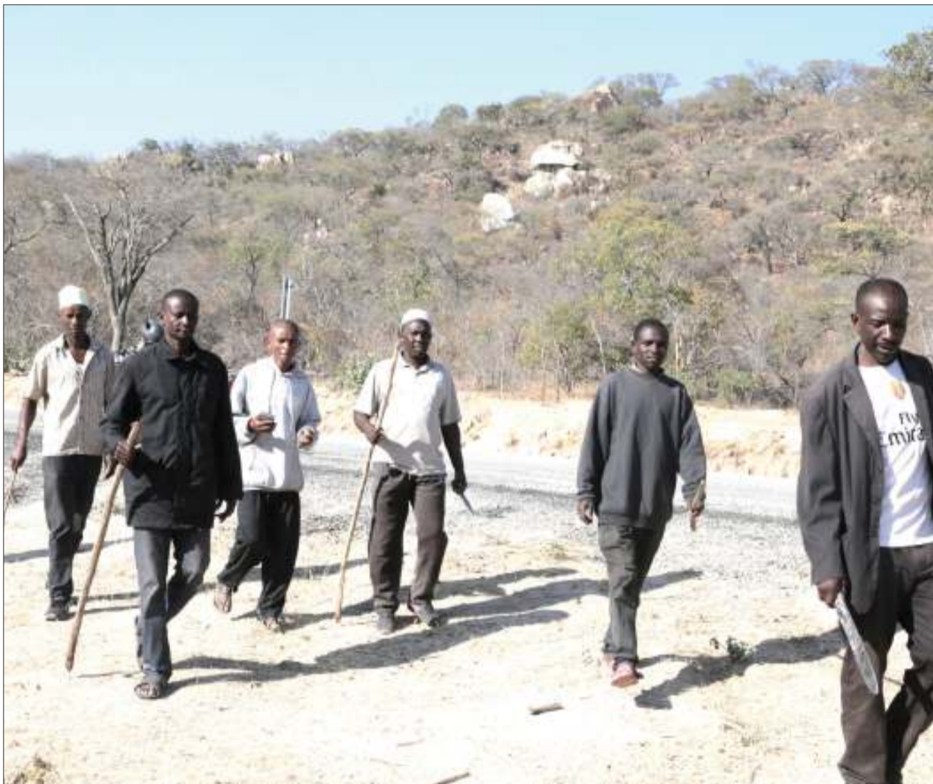
Baadhi ya wananchi wa Kijiji cha Chenene, wakishiriki kufanya doria ya ulinzi wa msitu wa Chenene, uliopo katika Wilaya ya Chamwino na Bahi mkoani Dodoma juzi, kutokana na baadhi ya watu kuuvamia na kuvuna mkaa na wengine kufanya ujangili wa kuua wanyama. Wananchi hao wanakabiliwa na changamoto ya vifaa duni vya ulinzi pamoja na usafiri jambo ambalo limekuwa likisababisha kushindwa kuwakabili wahalifu hao.

“Tunaiomba serikali kama inawezekana tujenge kituo cha afya kwani hii zahanati yetu inatumika na watu kutoka katika vi-jiji vingine vitatu hata vile vya mkoa jirani wa Iringa kuja hapa kupata tiba,” alisema Mgora.