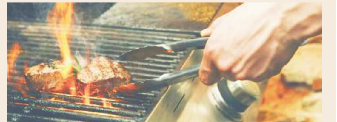
Kitongoji ambako kuna malalamiko. Picha ndogo ni jiko kunakoandaliwa mishikaki.

Anasema kuwa, harufu ya moshi wa sigara na nyama choma, zimemababishia ashindwe kuishi vizuri.