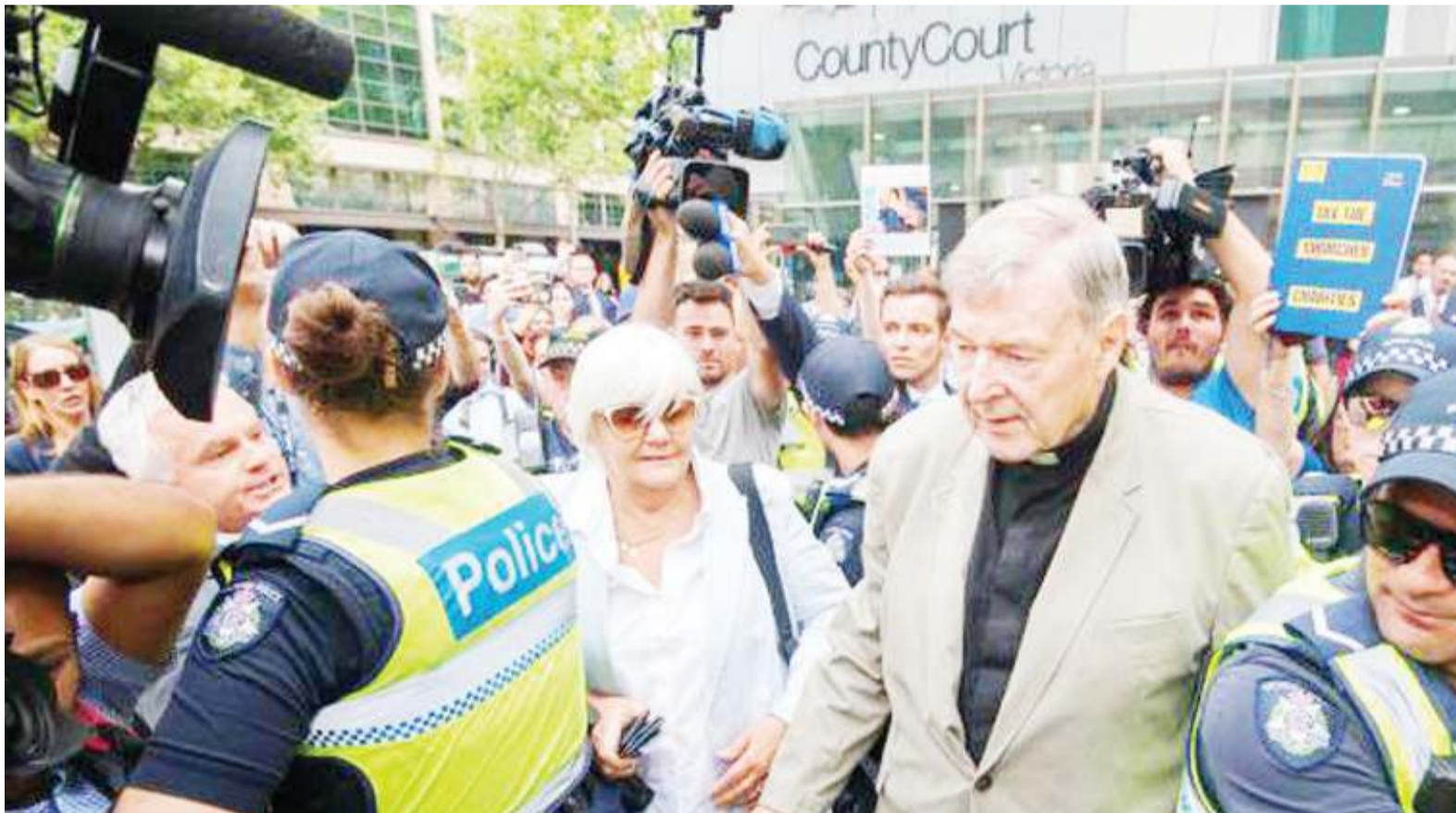
George Pell, chini ya ulinzi baada ya kuhukumiwa.