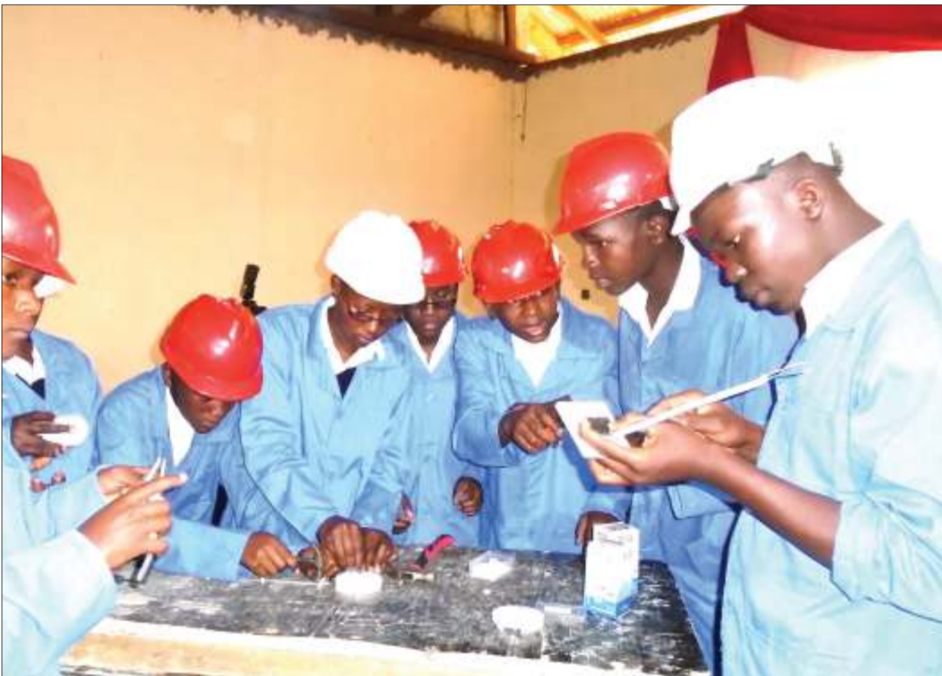
Wanafunzi wa Shule ya Sekondari ya ufundi stadi ya Healsun katika kijiji cha Muriyet, jijini Arusha, wakionyesha elimu ya ufundi kwa vitendo kwa wazazi (hawapo pichani), waliohudhuria katika mahafali ya nne ya darasa la saba ya shule hiyo, juzi.

"Barabara hii ina umuhimu mkubwa sana katika uwanja wetu wa ndege na maeneo ya shule ya sekondari na itafungua fursa kwa wanaowahi katikati ya jiji kutoka stendi kubwa ya mabasi ya mkoani inayotarajiwa kujengwa Olasit."