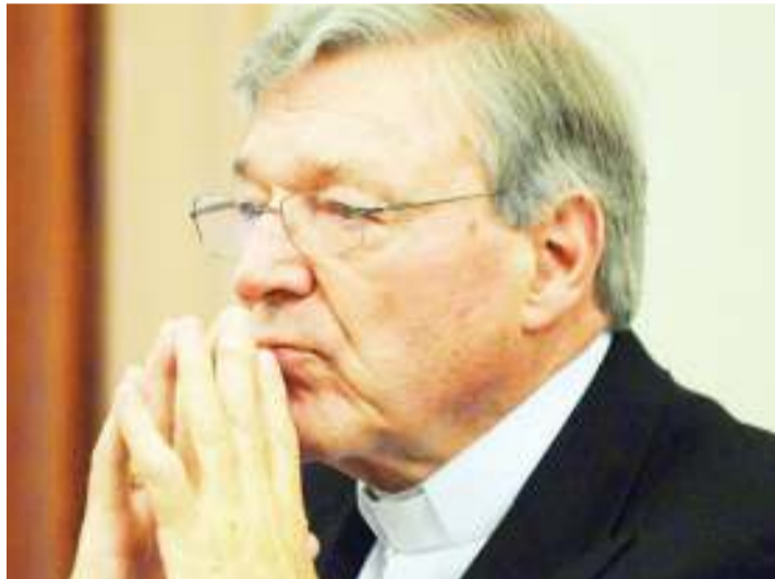
Kardinali George Pell, katika sura ya kusunoneka.