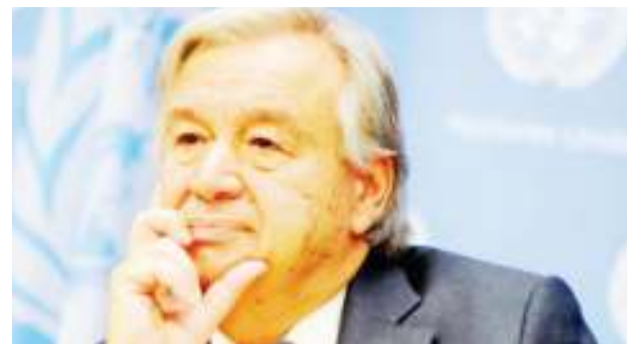
Katibu Mkuu wa Umoja wa Mataifa, António Guterres