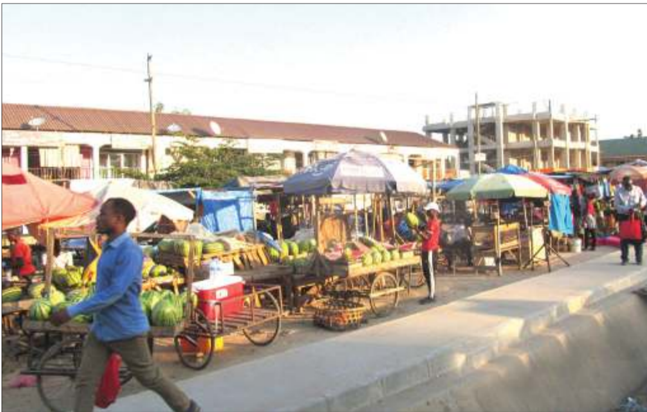
Wafanyabiashara wadogo wakiendelea na shughuli zao katika eneo la Mbezi Mwisho, jijini Dar es Salaam jana, licha ya Manispaa ya Ubungo kuwatangazia kuhama kwenda eneo la Kwa Beda, ili kupisha upanuzi wa barabara ya Morogoro na nyingine za eneo hilo.

Aidha, alisema Norway inasaidia nia ya Tanzania ya kufikia malengo ya uchumi wa kati kupitia sekta ya viwanda kwa kuongeza mapato ya makusanyo ya ndani. Kutokana na hali hiyo, alisema wanasubiri kwa hamu mfumo wa kuboresha mazingira ya kufanyia biashara nchini Tanzania, ili kuhakikisha sekta ya umma inakuwa na ufanisi na inasaidia uwekezaji katika sekta binafsi ili kuongeza mapato na kutengeneza ajira nchini.