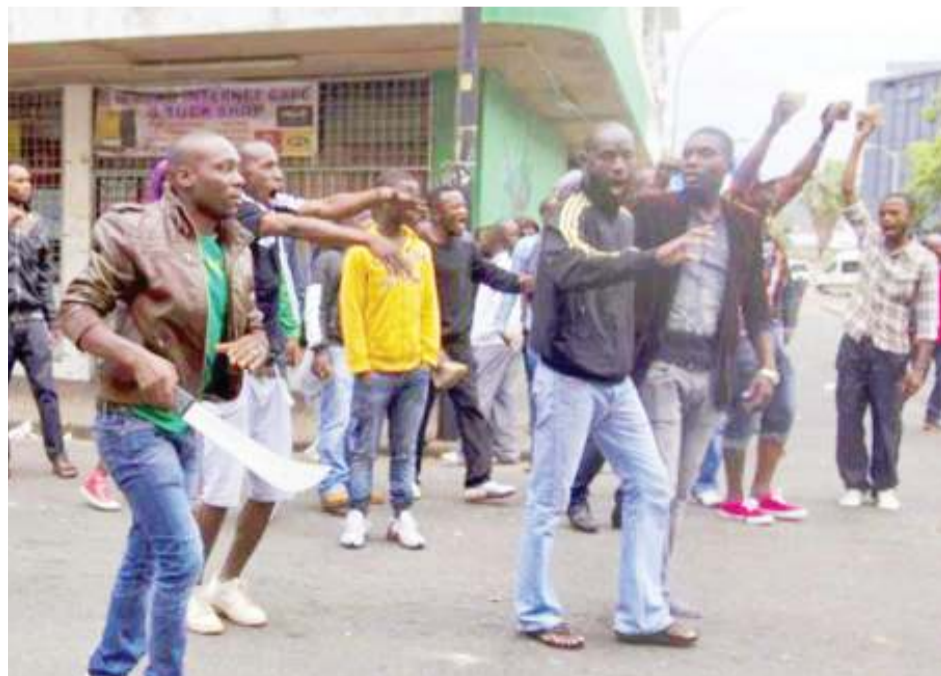
Raia wa Afrika Kusini wakiwa wameshika silaha wakishambulia maduka ya wahamiaji na kuchukua mali zao.

Licha ya kwamba baadhi hulisisha Afrika na matatizo kama mizozo na majanga, kadinali huyo anaamini kuwa Afrika ni zaidi ya yote eneo lililo na utajiri wa utu au ubinaadamu, lenye utajiri wa maadili na Imani. BBC