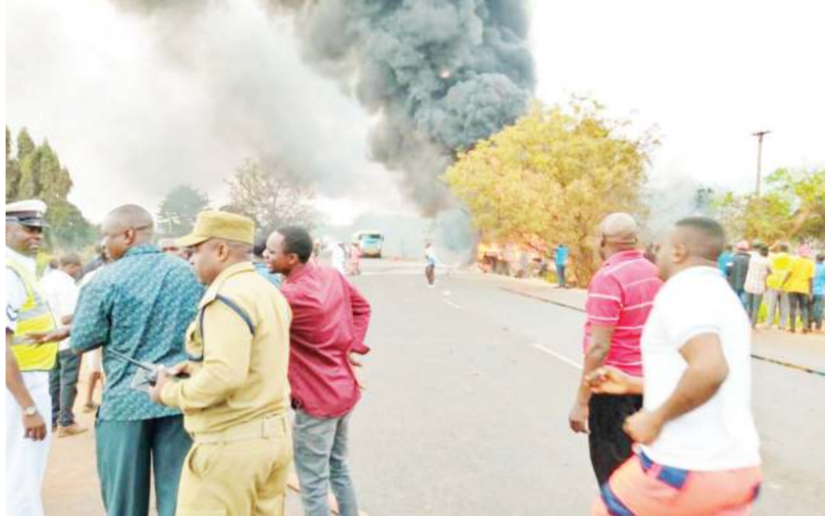
Haya ndiyo mazingira ya moto ulitokea mjini Morogoro.