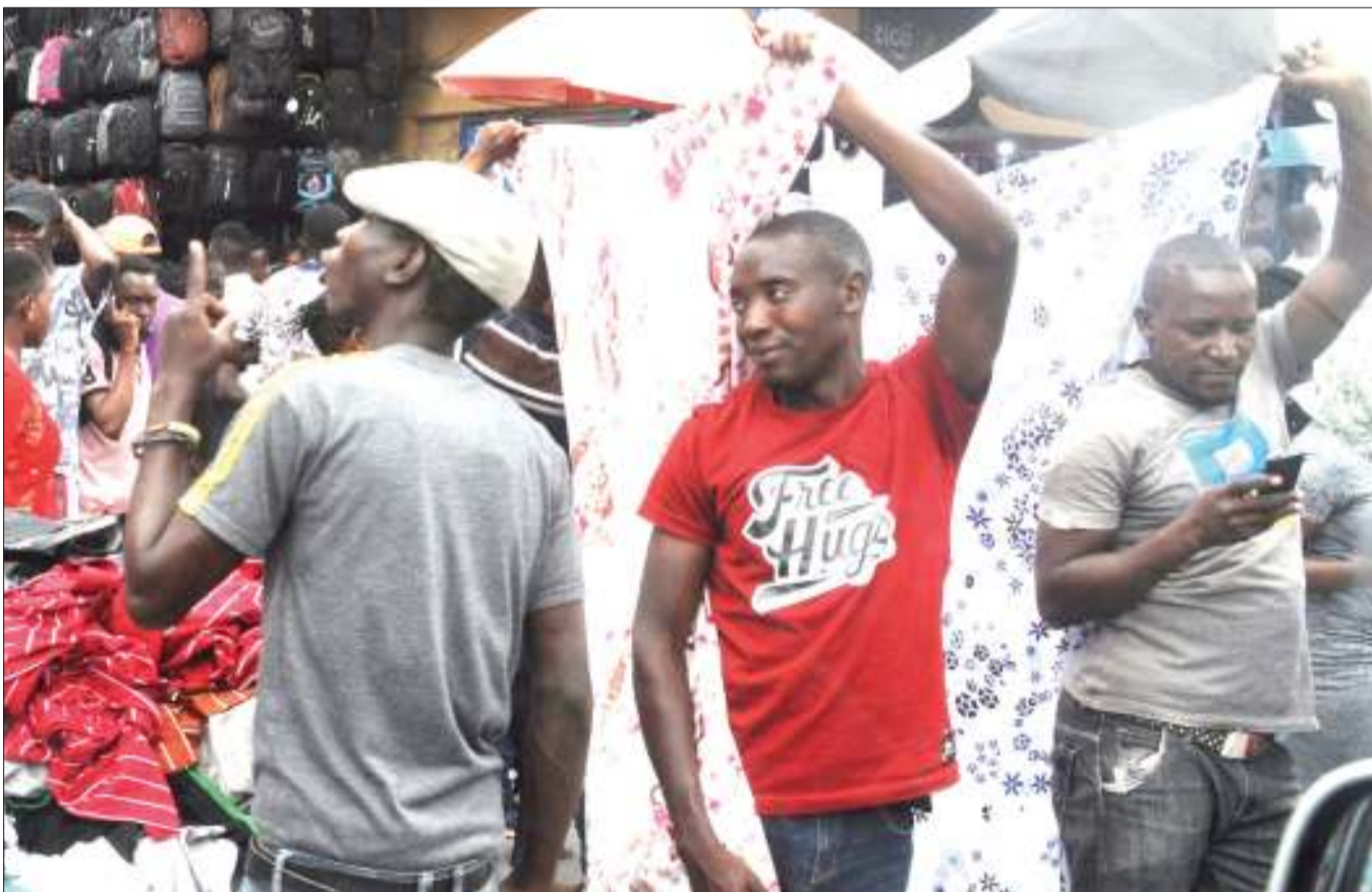
Machinga wakiwa wameyashika mashuka kwa staili, wakati wasisubiri wateja kando ya Barabara ya Msimbazi, eneo la Kariakoo, jijini Dar es Salaam jana.

Kuhusu huduma za kitabibu, Dk. Ukio alisema zinajitosheleza kutokana na kuwa na vifaa tiba vya kutosha na dawa, isipokuwa kwa suala la chakula na lishe kutoka kwa ndugu wanaowauguza majeruhi hao.