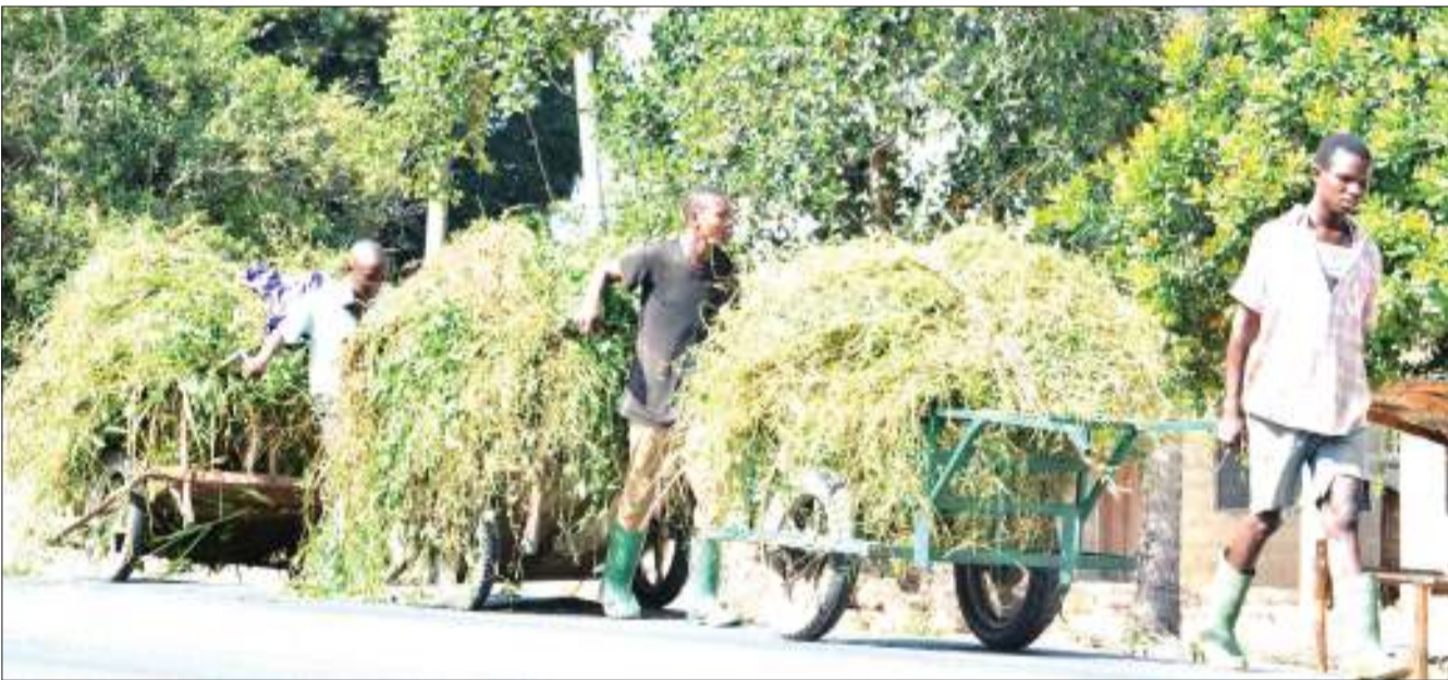
Vijana wakitoka kukata majani kwa ajili ya kulisha ng'ombe, katika eneo la Mbagala, Manispaa ya Temeke, jijini Dar es Salaam jana.

Ili kujiunga na kufurahia huduma hiyo ya Home Internet, wateja wa Tigo wanaweza kununua modem au router katika maduka ya Tigo yaliyopo nchi nzima. Wateja wa Home internet wanaweza kuwasiliana na kitengo cha huduma kwa wateja wakati wowote, yani masaa 24 kwa siku.