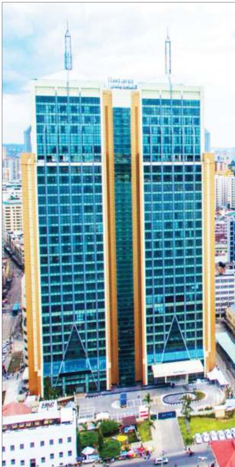
Mwonekano wa jengo jipya la 'Mwalimu Nyerere Foundation Square' lililopo jijini Dar es Salaam baada ya kukamilika kwa ujenzi. Jengo hilo lenye ghorofa 29 limejengwa na kampuni ya Kichina ya CRJE (East Africa), na linatarajiwa kuzinduliwa hivi karibuni.

Mkurugenzi Mkuu wa NEMC, Dk. Samuel Gwamaka, alibainisha kuwa walizuia makontena 280 ya vyuma hivyo kwenda nje ya nchi mbalimbali kutokana na kukiukwa kwa taratibu za usafirishaji mali hizo.