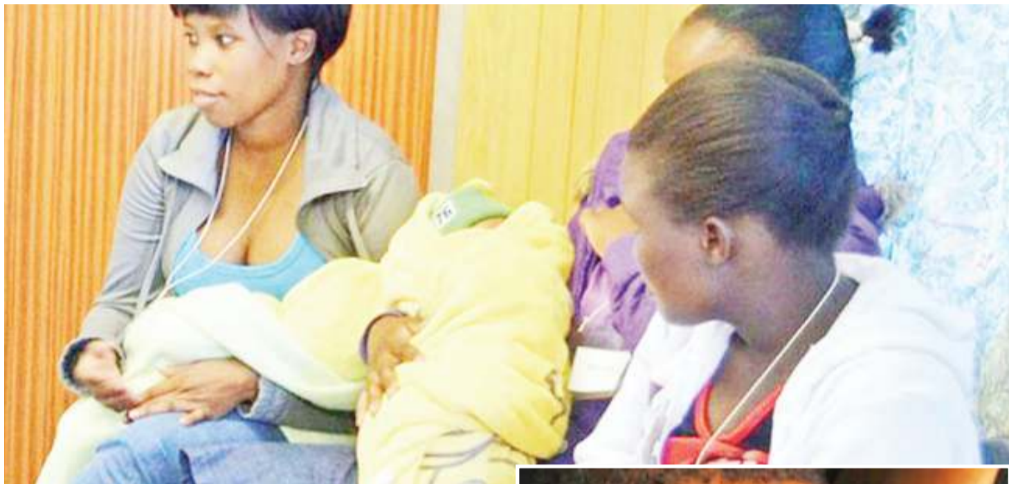
Watoto wakinyonya maziwa.

Anasema vifo vya watoto vichanga vipo juu sana nchini ambapo vifo 25 hutokea kwa kila vichanga 1000 waliozaliwa hai, huku vifo vya watoto chini ya mwaka mmoja vikiwa ni vifo 43