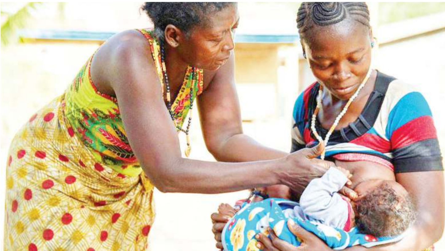
Watoto wakinyonya maziwa.