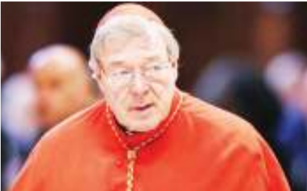
Kashfa ngono watoto ilivyomtupia mzigo wa kuhamia jela miaka sita Ukurasa 18