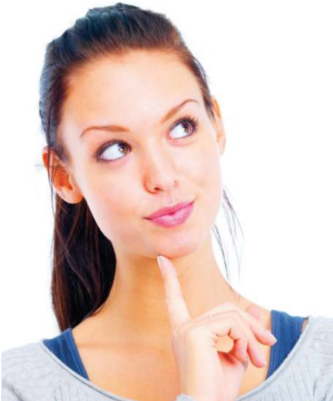
Kijana anayetafakari maisha yake.