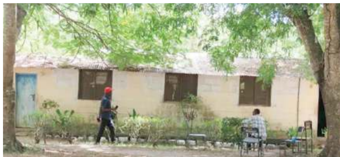
Moja ya mabweni ya Chuo cha Ualimu Vikindu ambayo hayajafanyika ukarabati kwa miaka 83 sasa.

sha kwamba changamoto ya upun- gufu wa walimu inashughulikiwa.