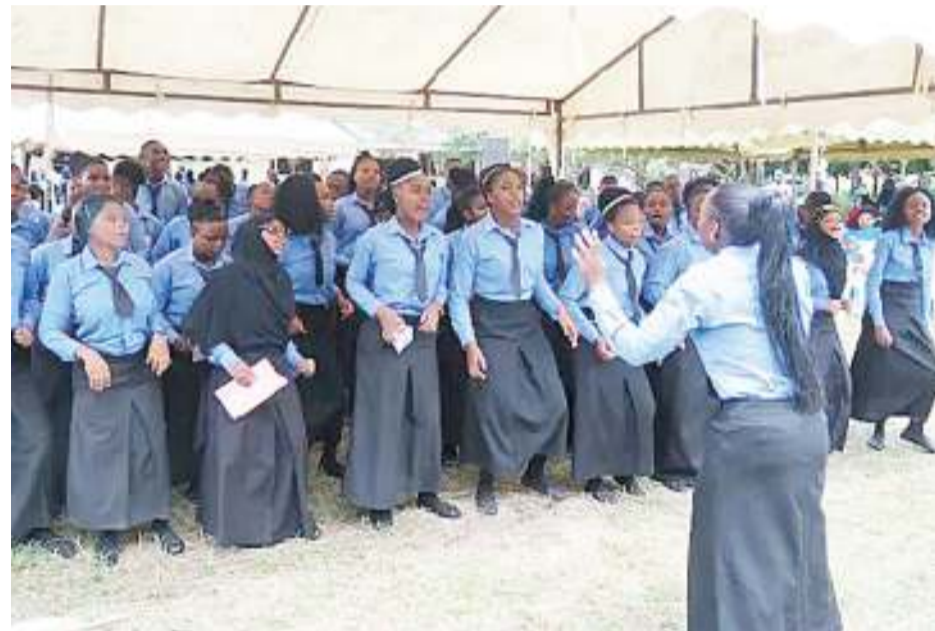
Wahitimu wa mafunzo ya ualimu Vikindu katika mahafali yaliyofanyika chuoni hapo.

Tanzania nayo kama mojawapo ya mataifa yaliyosaini utekelezaji wa SDGs imechukua hatua mbalimbali za kuhakikisha kwamba lengo Namba 4 la SDGs, linafikiwa katika suala la kuhakiki-