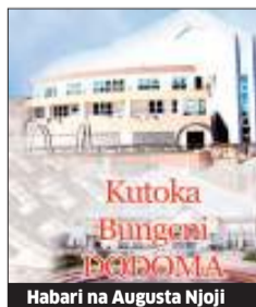
Habari na Augusta Njoji

takribani 2,000 linatambulika kama shamba Na. 69 Nambarapi na lina ukubwa wa hekta 744 (ekari 1,913).