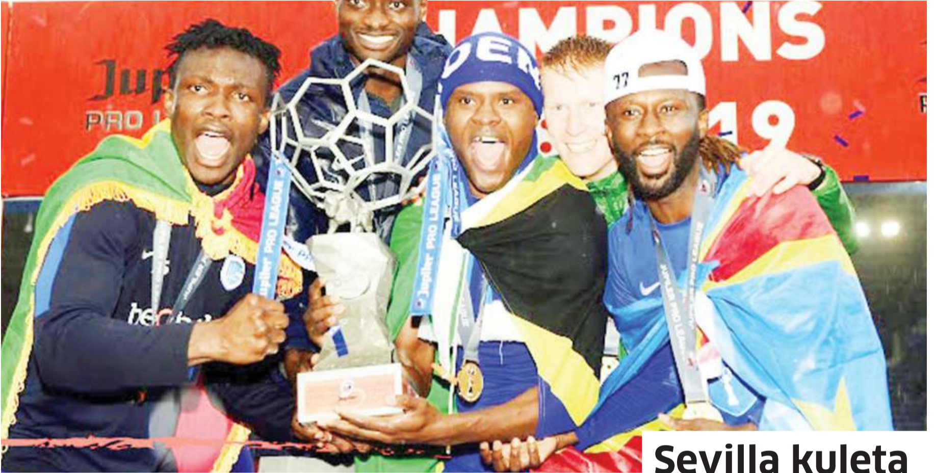
Mshambuliaji wa Kimataifa wa Tanzania, Mbwana Samatta (mwenye kombe), akisherehekea ubingwa wa Ubelgiji pamoja na wachezaji wenzake wa KRC Genk, baada ya mechi ya fungua msimu dhidi ya Standard Liege kumalizika kwa sare tasa katika Uwanja wa Luminus Arena mwishoni mwa wiki.