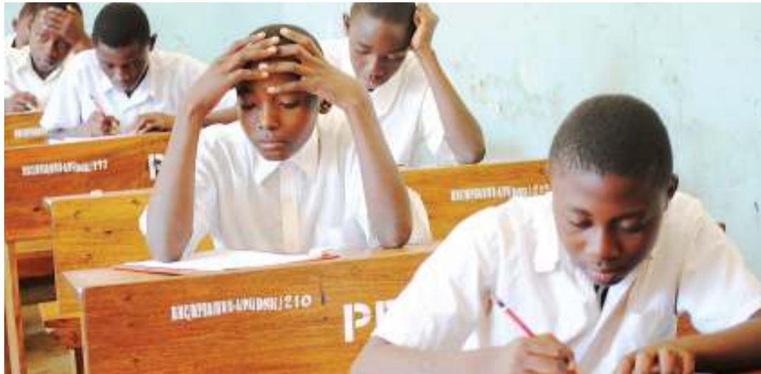
Wanafunzi wakiwa katika mtihani wa taifa wa kumaliza elimu ya msingi. Baadhi ya wanafunzi wali-ofaulu mtihani huo mwaka jana hawajaanza kidato cha kwanza kutokana na uhaba wa vyumba vya madarasa katika maeneo mbalimbali nchini kama ilivyo kwa Tarafa ya Suba, wilayani Rorya Mkoa wa Mara.

Msimbete anasema bila kuchukua hatua hizo, wanafunzi wa kike wanaweza kutumbukia katika ndoa za utotoni, huku wa kume wakijihusisha na uvuvi, kwa vile