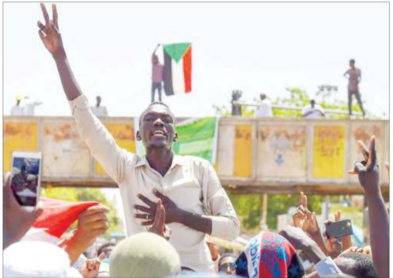
Raia wa Sudan wakiwa wamekusanyika nje ya makao makuu ya jeshi la nchi hiyo.

Siku ya Jumapili, jeshi la Iraq lilisema kuwa rocketi ilirushwa katika eneo linalolindwa sana katika mji wa Baghdad ambalo kuna nyumba za serikali na balozi za kigeni. BBC