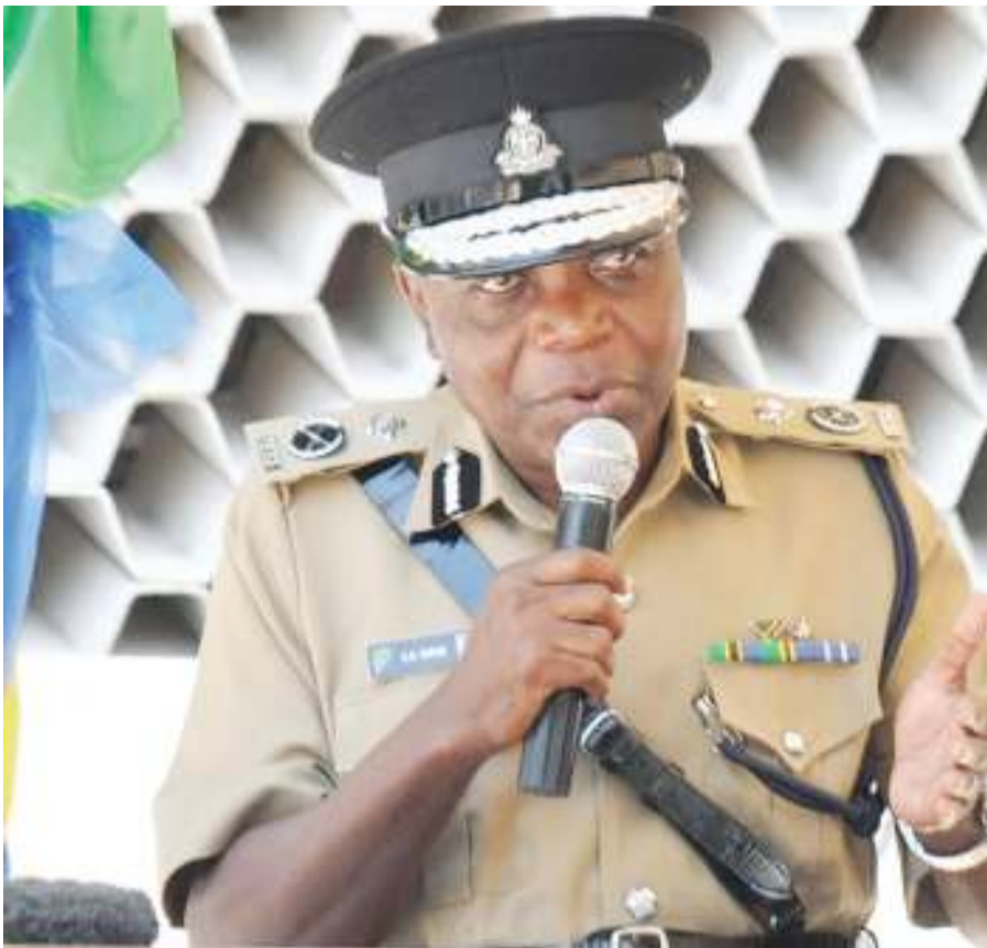
IGP Simon Sirro.