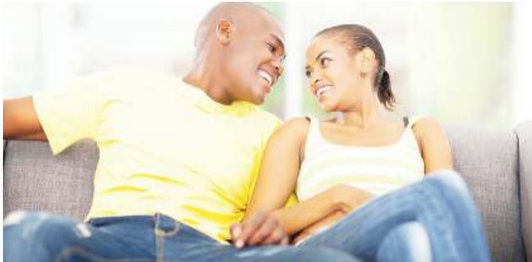
Uhusiano kama huu unahitaji kujitua kama saikolojia inavyofundisha ili uwe imara. .

Kinachofanya hoja inaleta mabishano makali ni ujumuisho wake kihisia, kwani mwanaume akisema 'wanawake wako hivi,' anajumui-