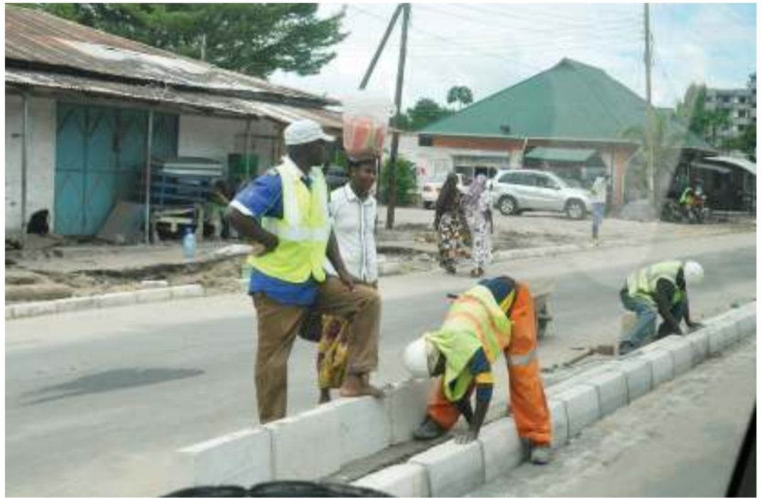
Mafundi wakiendelea na kazi ya ujenzi wa kingo za katikati za barabara ya Chang'ombe-Temeke, jijini Dar es Salaam jana.

"Serikali inachokifanya ni kumarisha mifumo ya ufuatiliaji hali ya hewa na kutoa tahadhari kwa umma kunahitaji kupewa kipaumbele, kuimarisha utoaji wa elimu ya majanga kwa umma, kujenga uwezo wa wataalamu wajue majukumu yao katika masuala ya usimamizi wa maafa," alibainisha.