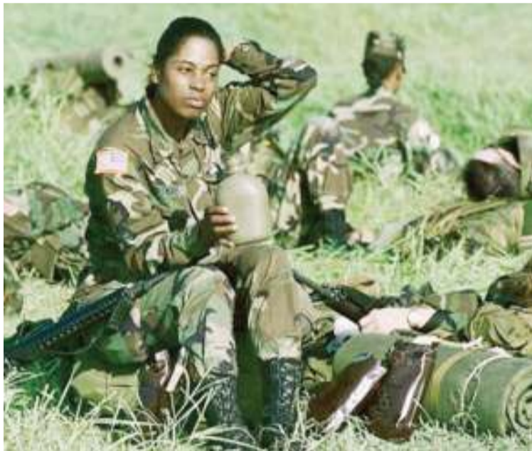
Mavazi ya kijeshi kama yanavyoonekana kwa mwanajeshi huyu, bado yametengenezwa maalumu kwa ajili ya wanaume.

Baadhi ya wanawake wameambia BuzzFeed News mwaka huu kwamba wakati wakiwa jeshini,