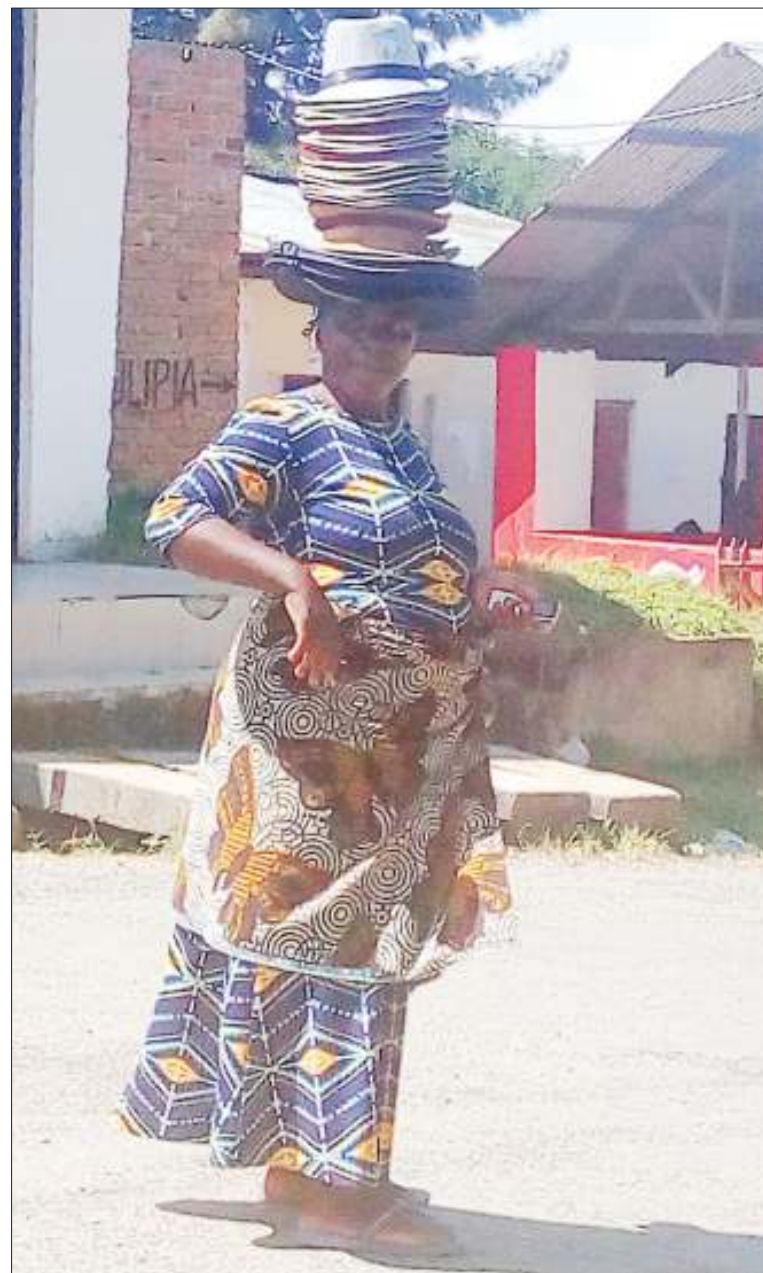
Mchuzi wa kofia akisaka wateja katika moja ya mitaa ya Jiji la Mbeya jana.

Alisema kilichopo katika kata hiyo ni mgogoro ambao hata hivyo haku-fafanua unatokana na nini, huku akidai kuwa yeye yupo chini ya mkurugenzi na kwamba mkurugenzi anajua kila kinachofanyika.