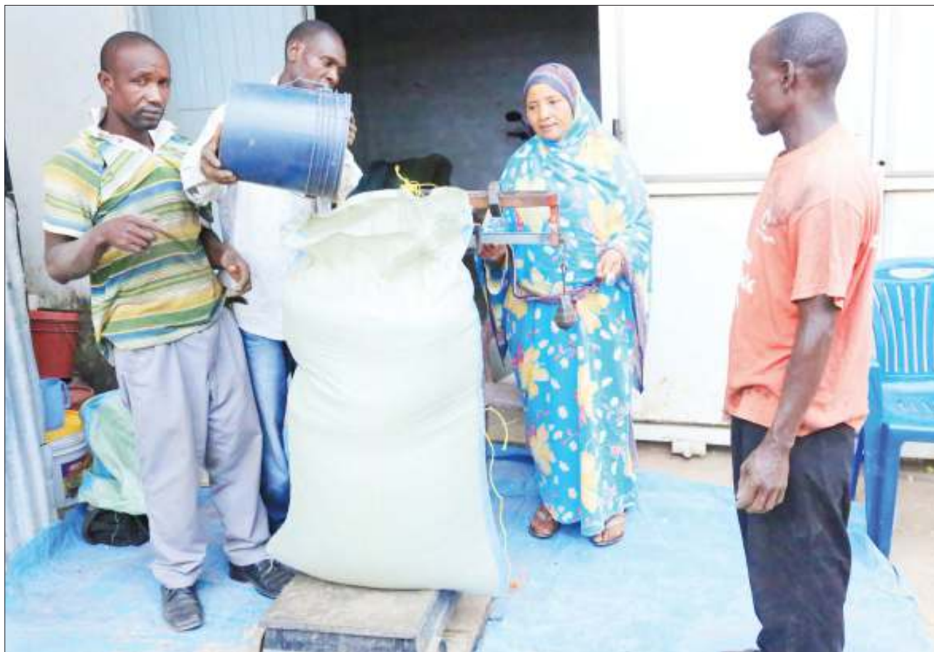
Wakulima wakipima uzito wa mazao ya ufuta kabla ya kuuza katika eneo la Mjini Kati, jijini Dodoma mwishoni mwa wiki. Baadhi ya wanunuzi wasiowaaminifu wamekuwa wakinunua mazao hayo, bila kupima na kuwadhulumu wakulima.

“Kambi hii inalenga kuimarisha huduma za kibingwa kwa mwaka wa pili mfululizo katika hospitali hii na kambi ya kwanza ilifanyika Julai, mwaka jana,” alisema.