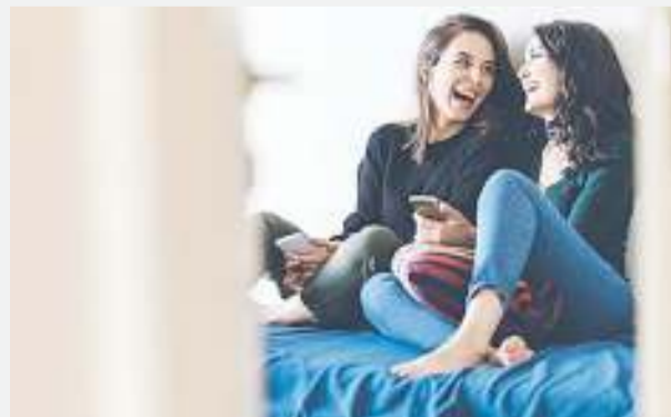
Mabinti 'wakichati' kwa kuwezesha na teknolojia ya habari na mawasiliano ambapo sasa mitandao ya kijamii inachukua muda katika maisha na hasa ya vijana.

Walibainisha kuwa muda ambao wasichana waliutumia katika mitandao ya kijamii uliwaathiri zaidi miongoni mwa, lakini athari ilikuwa ni ndogo kuliko ilivyokuwa kwa wanaume.