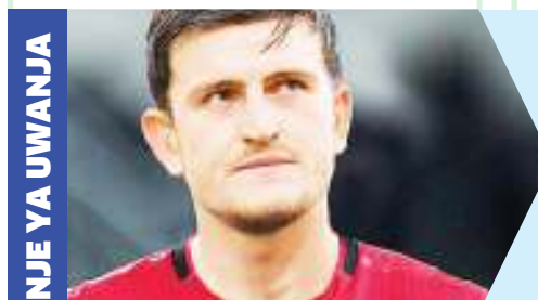
NJE YA UWANJA