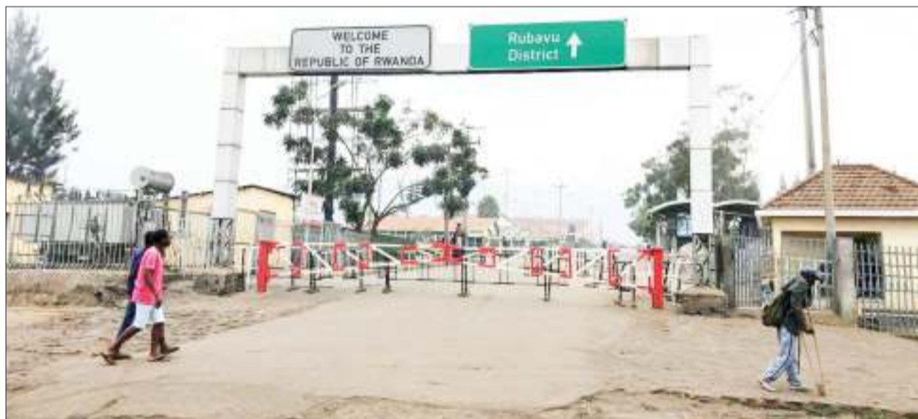
Mpaka kati ya Jamhuri ya Kidemokrasia ya Congo (DRC) na Rwanda ambao ulifungwa Agosti Mosi kwa uamuzi wa serikali ya Kigali wakati mji wa Goma unaendelea kukabiliwa na mlipuko wa ugonjwa wa ebola.

El Paso ni mji ulio karibu na mpaka wa Marekani na Mexico na wakazi wengi ni wa asili ya Mexico. VOA