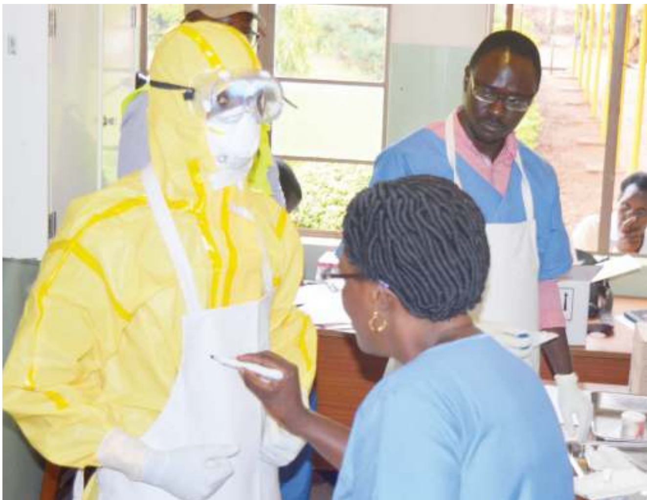
Watumishi wa afya wa Hospitali ya Rufani ya Mkoa wa Kagera, wakifanya mazoezi ya namna ya kuvaa vifaa kinga kwa ajili ya kumhudumia mgonjwa anayehisiwa kuwa na maambukizi ya ugonjwa wa ebola.