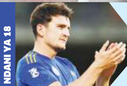
NDANI YA 18

Real Madrid sasa ni timu yenye wachezaji nyota wengi. Ramos na Marcelo wakiongoza safu ya ulinzi, Modric kiungo, Benzema akifanya yake mbele.