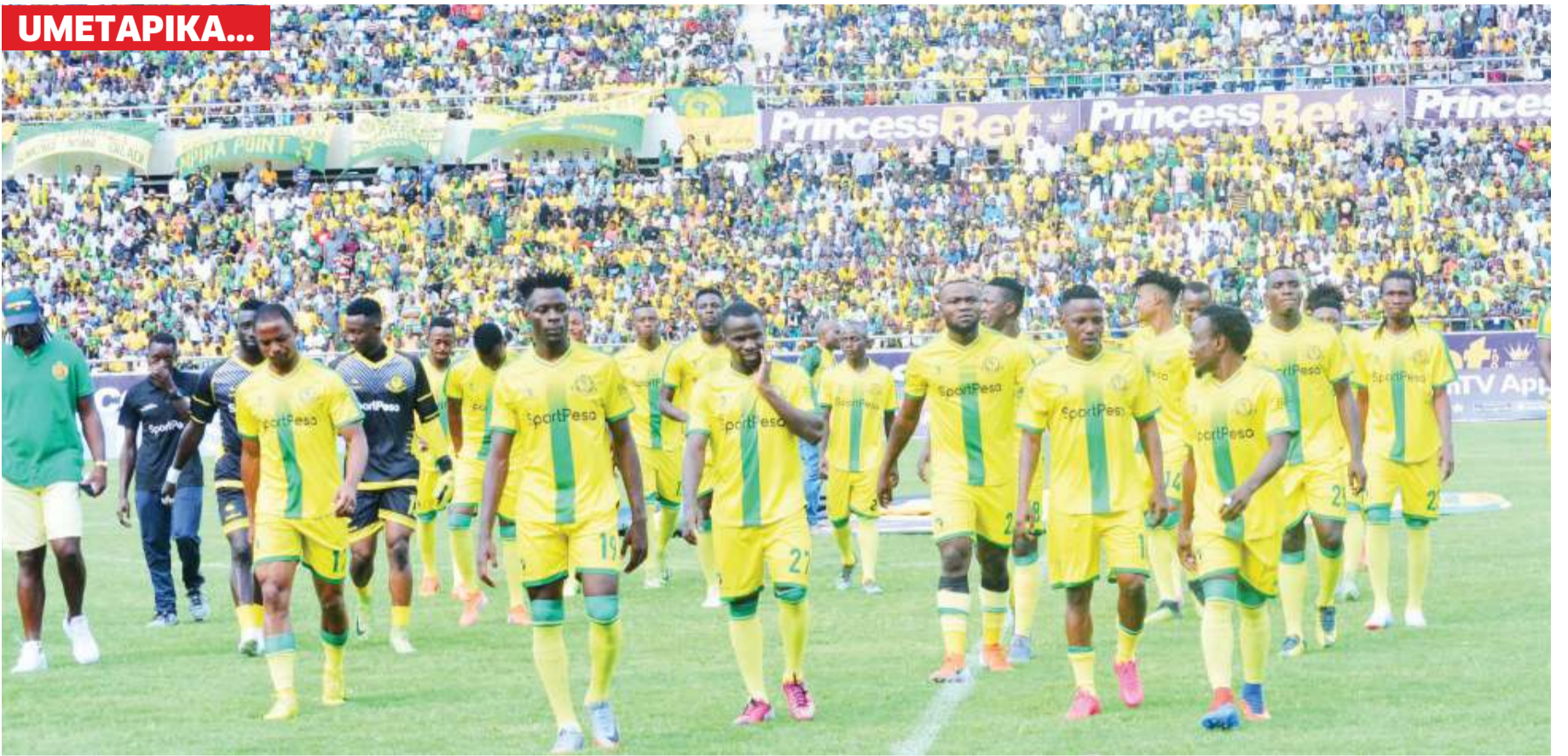
Wachezaji wa Yanga wakiingia uwanjani jana.