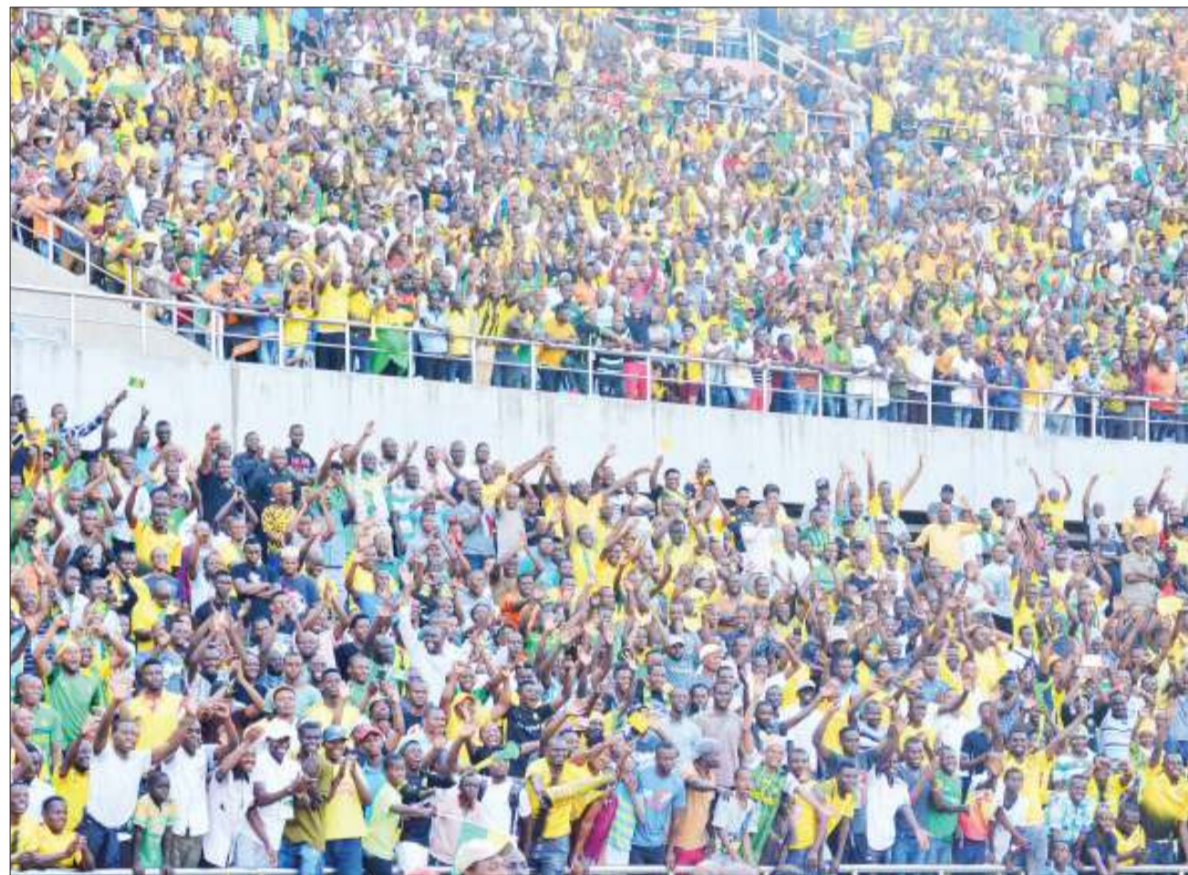
Mashabiki wa Yanga waliofurika Uwanja wa Taifa wakishangilia wakati wa kutambulishwa wachezaji wao wa msimu huu katika kilele cha Tamasha la Siku ya Mwananchi jana.

Aidha, aliwataka mashabiki kujitokeza kwa wingi kesho kushuhudia wachezaji wapya katika kilele cha wiki yao, huku akisisitiza wanunue tiketi mapema ili kuepusha usumbufu wa kuingia uwanjani na kudai kesho watafanya mambo ambayo hayajawahi kufanywa hapa nchini.