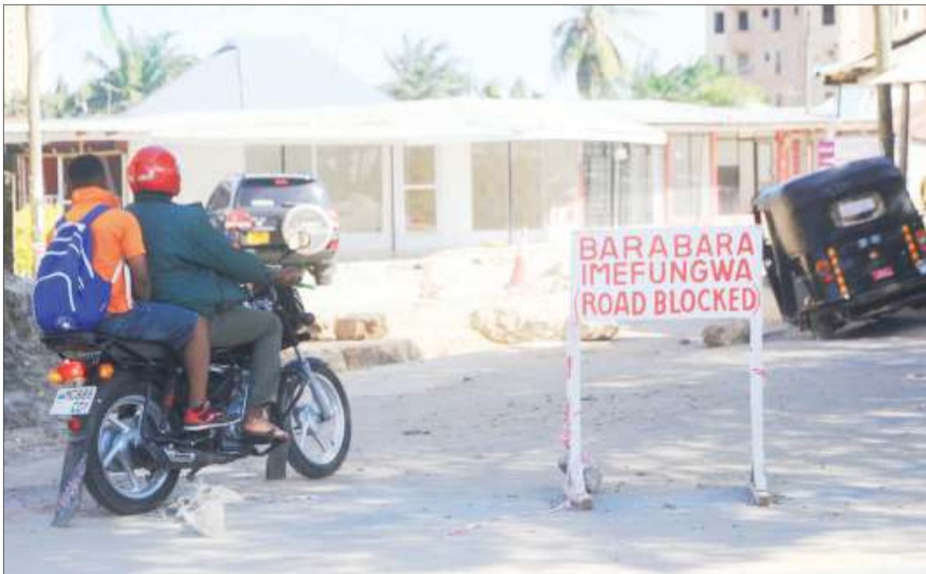
Bodaboda ikipita jirani na kibao kinachoonyesha kufungwa kwa barabara maarufu kwa jina la Kanisani kwa Pinda, Kinondoni Dar es Salaam jana, hali inayosababisha usumbufu kwa wananchi na waumini wa kanisa kupita kwa gari kutokana na kutowekewa sehemu mbadala ya kupita.

Hali hiyo inaashiria kuwapo uwezekano mkubwa wa kukwepa kulipa tozo za serikali ikiwamo ya asilimia 0.3 inayolipwa kwa halmashauri ya wilaya.