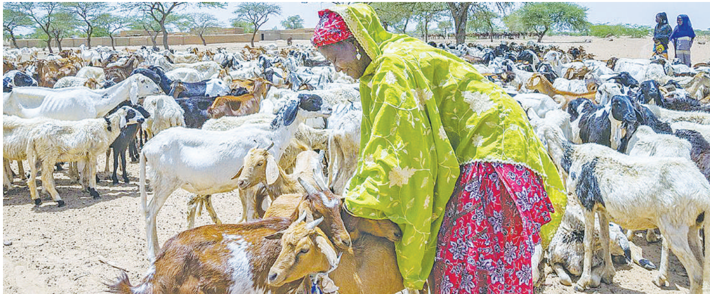
Mifugo; mbuzi na kuku ikiwa inahudumiwa. Kampeni ya kiserikali inayoendelea ni kuwachanja, ili kupata usalama wao na binadamu kiafya.

"Kama serikali, tulikuja na magonjwa 13 na kati ya magonjwa hayo, tuna uzalishaji wa chanjo aina saba hadi nane. Serikali imetoa msamaha wa kodi kwa dawa na chanjo za mifu-