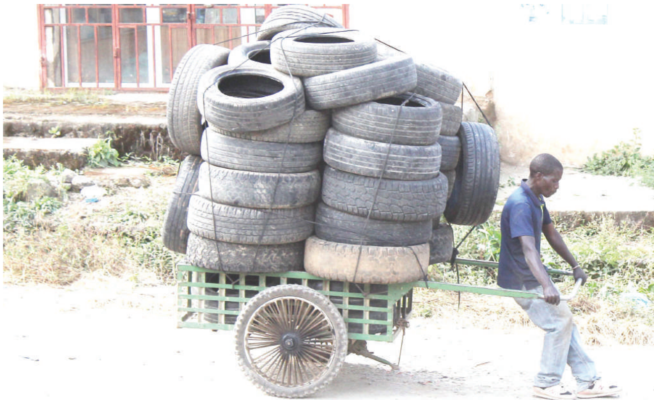
Mkazi wa Jiji la Mbeya, akivuta mkokoteni uliosheheni mzigo wa magurudumu, ili kujipatia ujira wa siku, katika eneo la Uwanja wa Sokoine juzi.

Alisema: "Serikali inajitahidi kutoa huduma za kilimo na ushirika zenye ubora, kutoa mazingira mazuri kwa wadau, kuimarisha uwezo wa mamlaka za serikali za mitaa na kuwezesha sekta binafsi kuchangia kwa ufanisi katika uzalishaji endelevu wa kilimo, tija na maendeleo ya ushirika".