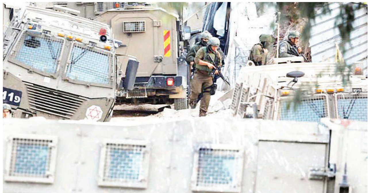
Wanajeshi wa Israel wakifanya uvamizi katika kambi ya wakimbizi ya Nour Shams iliyoko Tulkarm, katika Ukingo wa Magharibi unaokaliwa na Israel jana.