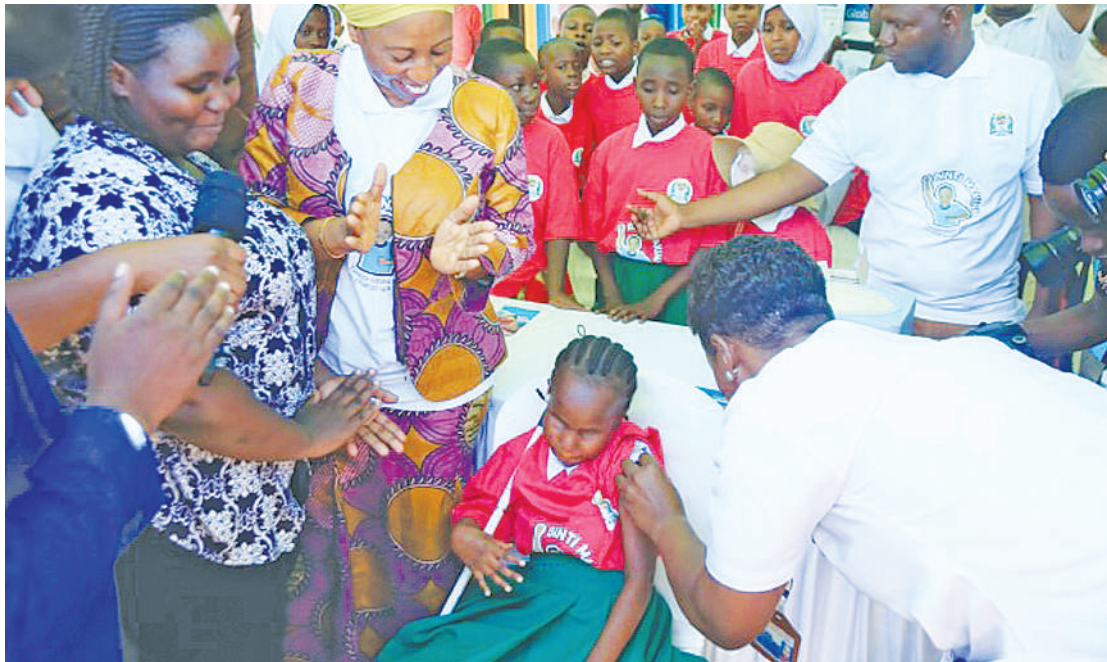
Waziri wa Afya, Ummu Mwalimu, akishuhudia uchanjaji saratani ya shingo ya kizazi, Aprili mwaka huu.

Utoaji wa huduma hizo unafanyika kwa ushirikiano na Taasisi ya Taifa ya Utafiti wa Magonjwa ya Binadamu (NIMR) kutoka mkoani Mwanza, kupitia kitengo cha utafiti MITU.