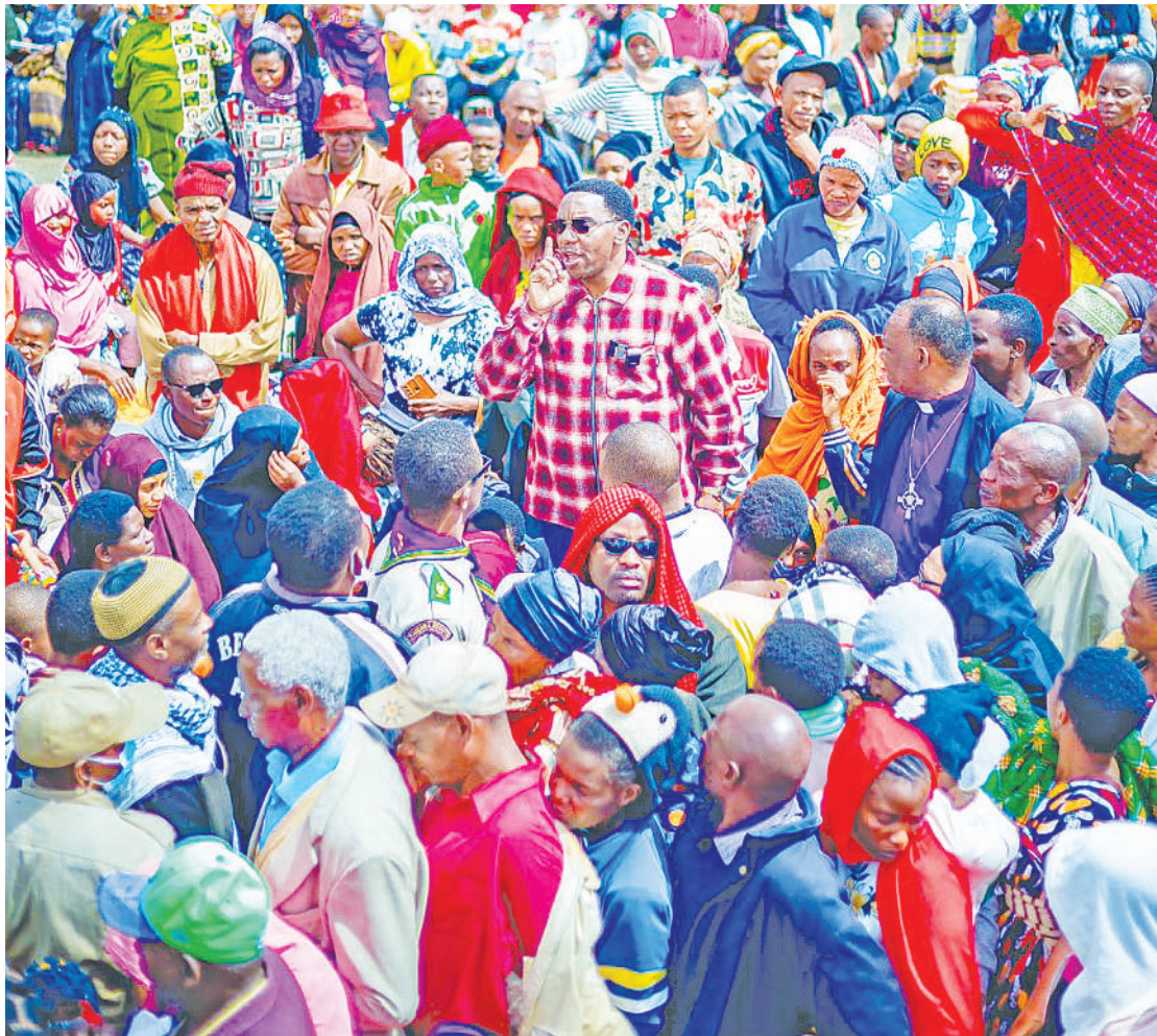
Mkuu wa Mkoa wa Arusha, Paul Makonda, akijumuika na umma, katika kampeni ya tiba bure za kibingwa katika Uwanja wa Sheikh Amri Abeid, jijini Arusha.

"Hawa watu wote tumekuja kufurika hapa uwanjani ni kwamba