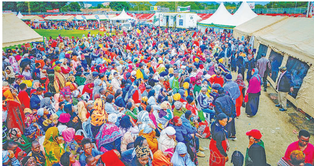
Umati uliokusanyika katika 'Kambi ya Makonda' iliyotoa tiba za kibingwa bure, katika Uwanja wa Sheikh Amri Abeid, jijini Arusha.

tunavyoongea kuna gari linakuja, lina dawa zenye thamani ya zaidi ya Sh. milioni 100. Dawa hizo ambazo Rais Samia amezitoa kupitia Bohari Kuu ya Dawa (MSD), ziko njiani..." akatamka Makonda.