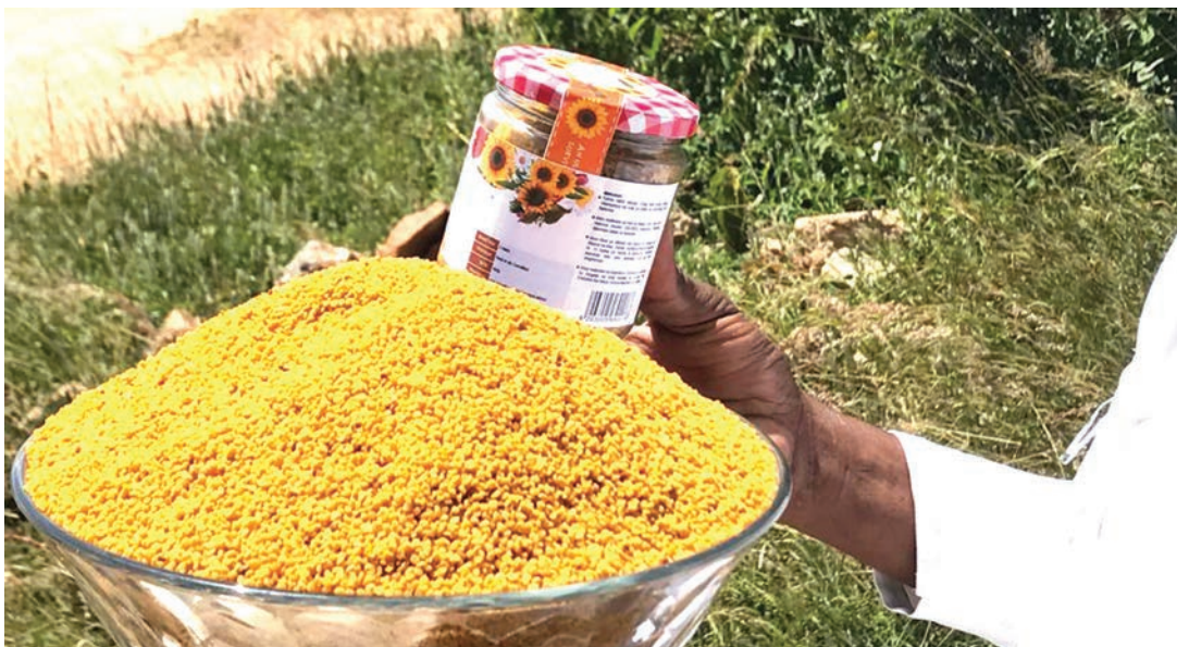
Bidhaa inayozalishwa katika Kijiji cha Asali, Singida.

Mwisho anajumuisha kwa hoja kwamba, ili kuvutia zaidi watalii katika kijiji hicho cha nyuki, wameboresha zaidi mazingira kwa kuweka miradi ya michezo, sehemu za chakula ili kusaidia wanaoishi ndani ya kijiji hicho au wanaotembelea kuwa na furaha.