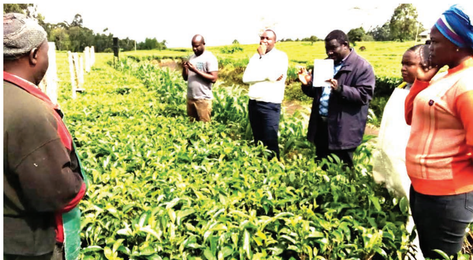
Wataalamu wakiwa kwenye majaribio ya mbolea inayotumika kwenye zao la chai

Mkurugenzi huyo pia anafafanua, sasa kunafanyika utafiti ulioibua aina nane za mbegu, zililotelewa kwa wakulima nchini kati ya mwaka 2012 na 2016 na Kuthibiti Uboza wa Mbegu