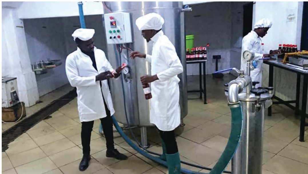
Wafanyakazi wa Kijiji cha Nyuki, wakiendelea na kazi katika kiwanda chake cha kuchakata asali.

“Niligundua kwamba shughuli hii ni lazima iendeshwe kibiashara na si kwa mazoea na ikiweze-