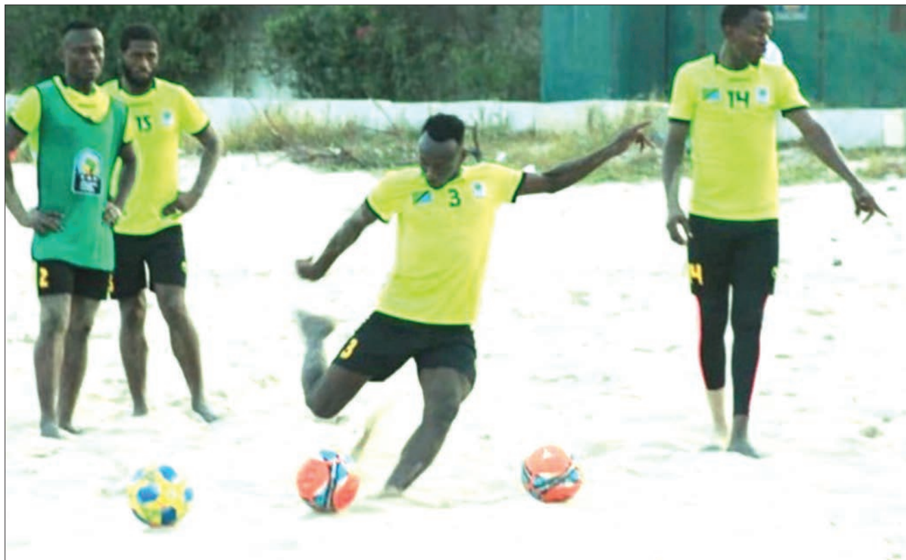
Wachezaji wa Timu ya Soka ya Taifa ya Ufukweni wakifanya mazoezi kujiandaa na mashindano ya COSAFA yanayotarajiwa kufanyika kuanzia Septemba 14 hadi 20, mwaka huu katika Mji wa Durban, Afrika Kusini.

“Sisi (kampuni Mo Boxing), tumekuza ndondi kuanzia chini mpaka ilipo sasa kwa nchi za Falme za Kiarabu (UAE) na Kazakstan, na sasa lengo letu ni kuitandisha Afrika katika nyanja za kimataifa,” alisema mratibu huyo.