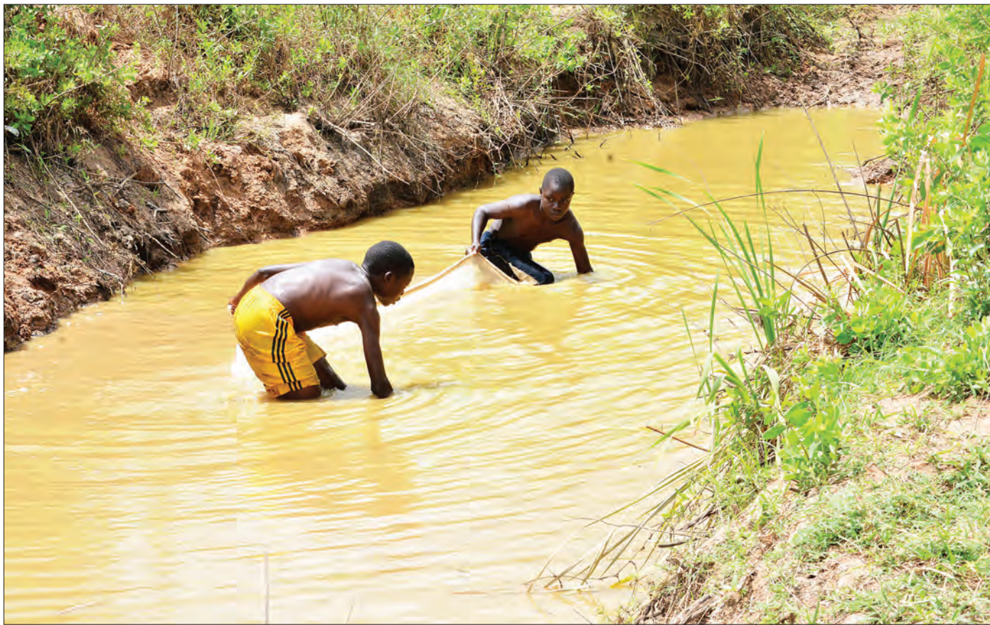
Vijana wakitumia chandarua kuvua samaki aina ya kambare katika bwawa la maji, eneo la Kibamba kwa Pombe, jijini Dar es Salaam mwishoni mwa wiki.

Shamba la korosho lililofunguliwa wilayani Manyoni lina ukubwa wa zaidi ya ekari 22,000 kwa pamoja, lakini linamilikiwa na wananchi wenyewe ambao wamegawiwa maeneo madogo madogo ambayo yameungana na kuunda shamba hilo.