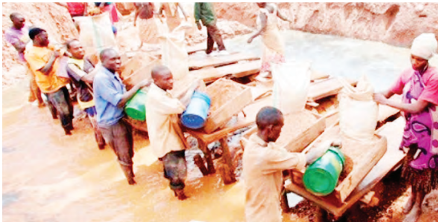
Wajasiriamali wakichenjua dhahabu, kwa teknolojia ya maji na gunia ambayo baadaye hukusanywa na kusafishwa na zebaki.

"Ibara ya 7 ya mkataba wa Minamata, inazitaka nchi wanachama kuchukua hatua za kupunguza na inapowezekana kumesha matumizi ya zebaki." Hata hivyo, anasema, ibara ya 7 haikatazi au haiweki ukomo wa matumizi ya