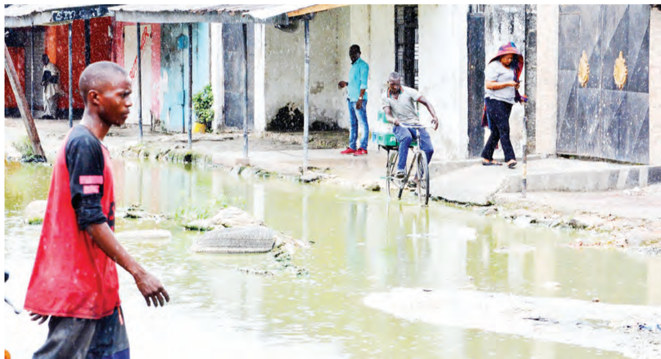
Wakazi wa Kinondoni "B" Mtaa wa Kananzi, jijini Dar es Salaam, wakilazimika kupita pembeni kukwepa maji machafu yaliyotuma na kusababisha kero kwa kuhatarisha afya za wakazi.

Kwa mujibu wa Zaipuna, mwananchi anayehitaji huduma hiyo atajisajili na kuanza kudunduliza kwa urahisi na kwamba baada ya kujiunganisha kupitia *150*68 anachagua namba mbili iliyoandikwa kibubu kisha anafuata maelekezo mengine ili kujisajili kupata huduma hiyo.