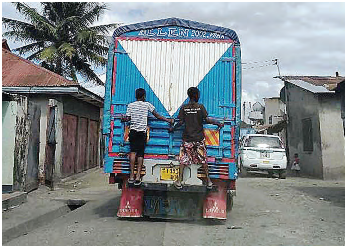
Watoto wakiwa wamedandia nyuma ya lori lililokuwa kwenye mwendo katika eneo la Buguruni kwa Mnyamani, jijini Dar es Salaam jana, kitendo kinachoweza kuhatarisha usalama wa maisha yao.