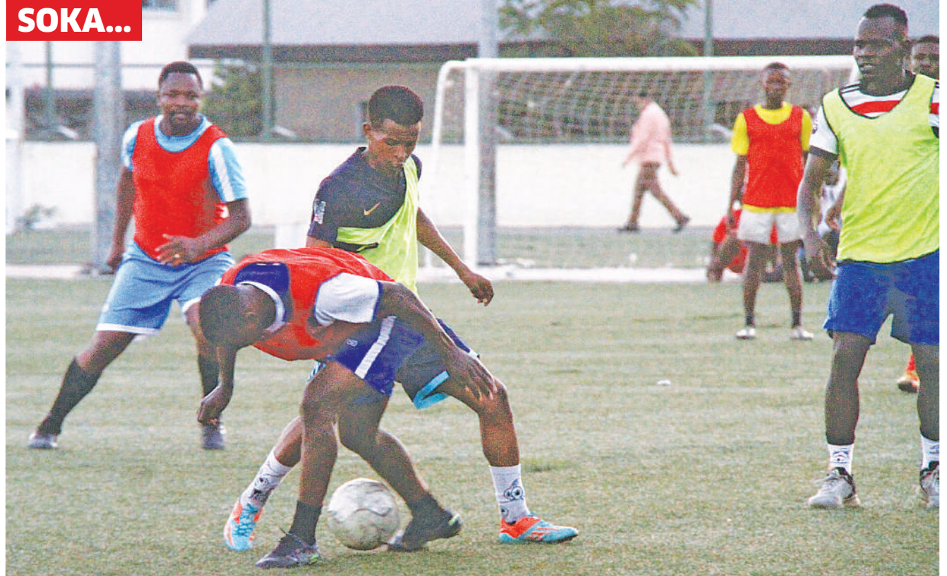
Vijana wanaolelewa katika Kituo cha Michezo cha Jakaya Kikwete jijini Dar es Salaam wakifanya mazoezi jana.