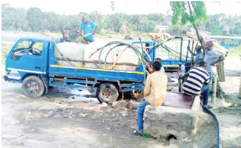
Baadhi ya wafanyabiashara wa maji wakiwajaza maji kwenye magari yao katika kioski cha Mbezi Beach, Dar es Salaam.

Kwa maoni: +255 677 020 701 Email: customerrelations@guardian.co.tz