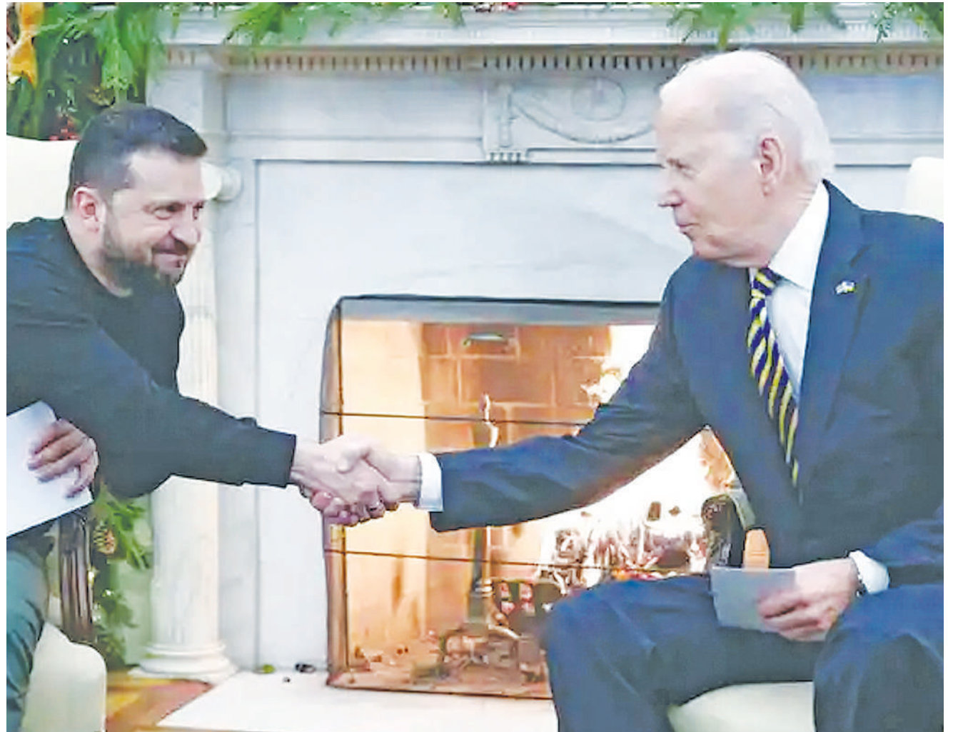
Rais wa Marekani, Joe Biden (kulia), akisalimiana na Rais wa Ukraine, Volodymyr Zelensky.

Ukraine inakadiria kuwa kuna wanajeshi 11,000 wa Korea Kaskazini huko Kursk, na kwamba uamuzi wa Rais Biden pia utaziwezesha Uingereza na Ufaransa kuipa Ukraine idhini ya kutumia makombora ya masafa marefu ya Storm Shadow ndani ya Russia. BBC