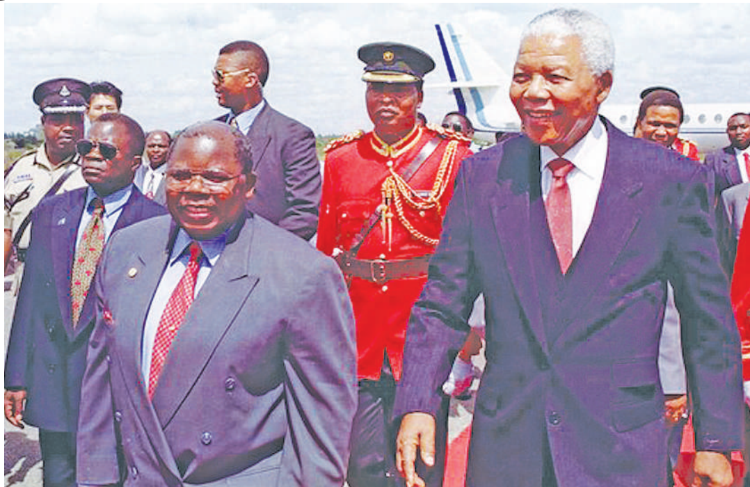
Benjamin Mkapa na Rais wa Afrika Kusini Nelson Mandela (kulia) enzi za uhai wao, wakiwa Dar es Salaam, mwaka 1998.

wa uchumi, anafanua kuwa iwe ni elimu inayompa kijana maisha siyo matarajio bila kumpatia zana za kuweza kupambana na maisha na zama hizi ambazo tatizo kubwa la ajira, hivyo elimu imwezesha kijana kujitafuta.