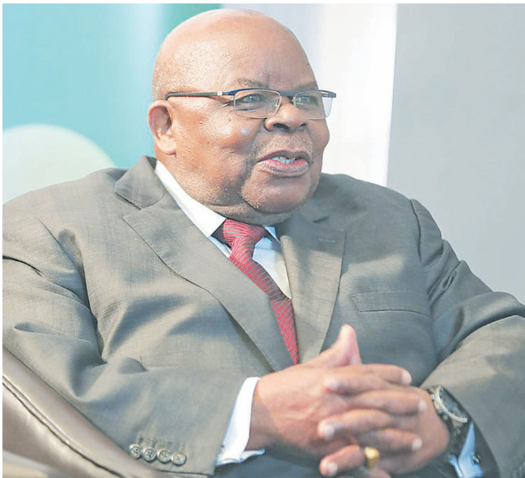
Rais mstaafu, hayati Benjamin Mkapa.

Kwa mfano, ililazimika kuunda mashirika yake yenyewe mfano la reli na ndege na kununua vi-