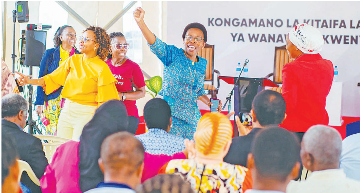
Wanawake wakifurahia mafanikio wakati wa kongamano la kuchangia maoni ya uandishi dira mpya 2050. PICHA:

Aidha, kwa kuangalia dira hiyo inayomaliza muda wake anagusia suala la chakula kuwa licha ya