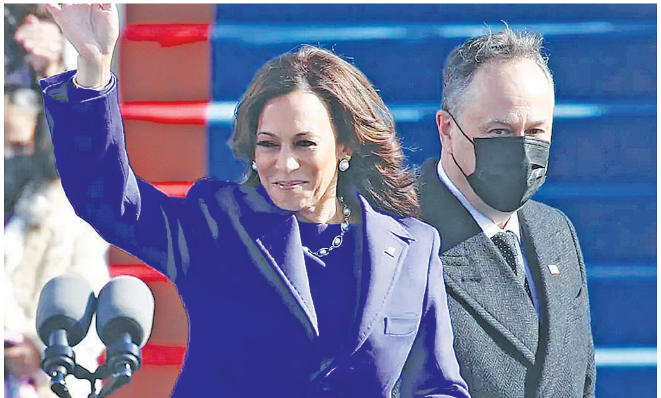
Makamu wa Rais wa Marekani aanza kampeni baada ya kuteuliwa kushiriki katika kinyang'anyiro cha kugombea kiti cha urais katika uchaguzi unaotarajiwa kufanyika Novemba mwaka huu. PICHA: MTANDAO

Wachambuzi wa siasa walisema vijana hao wanataka mageuzi katika kupambana na ufisadi, utawala bora na utoaji wa huduma zilizobora zaidi katika serikali za kaunti na kuu. DW