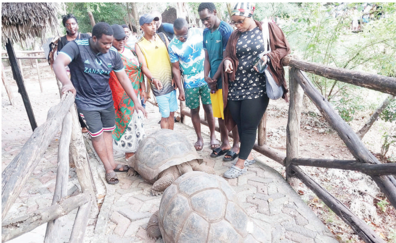
Baadhi ya wananchi wakiangalia wanyama aina ya kobe, walipotembelea kisiwa cha Prison, kilichoko katika Bahari ya Hindi, nje kidogo ya mji wa Malindi Zanzibar jana.

Serikali ya Mapinduzi ya Zanzibar inatekeleza mradi mkubwa wa kuimarisha miundombinu ya usambazaji maji mjini na vijijini chini ya ufadhili wa Benki ya Exim kutoka India sambamba na kuweka mita za kusoma matumizi ya kiwango cha maji kwa wateja.