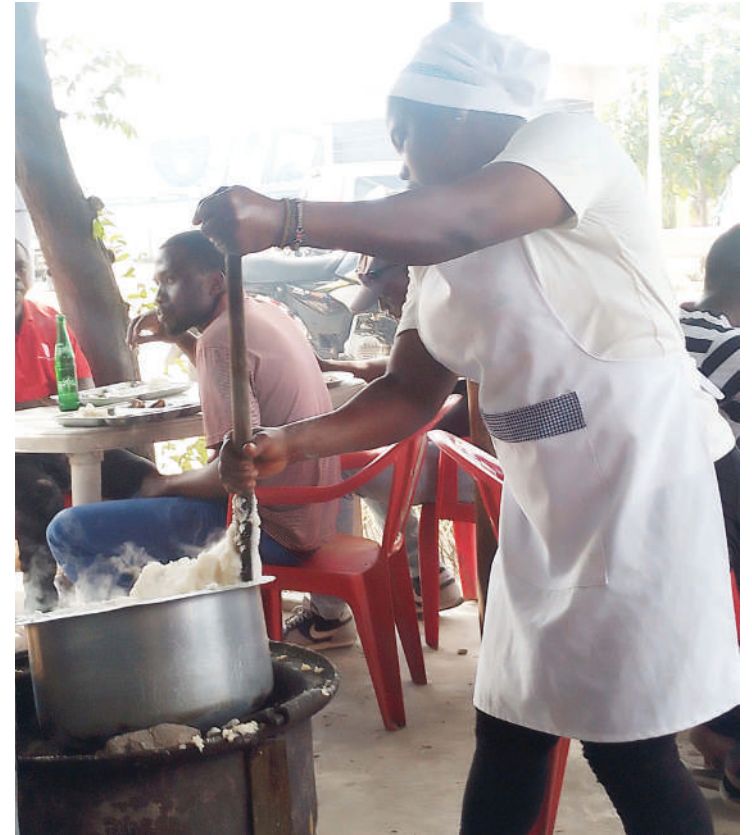
Mamalisha akiandaa ugali kwa ajili ya wateja wake katika eneo la Mwenge, Manispaa ya Kinondoni, Dar es Salaam hivi karibuni.

"Kubadili tabia za watu kunahitaji kuwa na muda wa kutosha kwenye suala zima la ubora na usalama wa chakula kinapoadaliwa hadi kumfikia mlaji, tu-