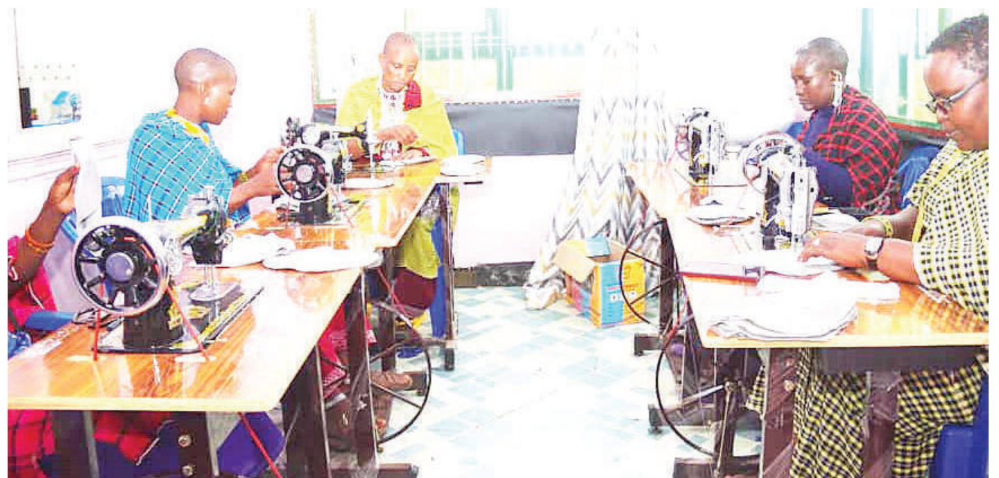
Baadhi ya kinamama wa jamii ya Kimasai wa Kata ya Kimokouwa, Wilaya ya Longido mkoani Arusha wakiwa katika mafunzo ya kushona taulo za kike maarufu 'Sodo' kwa ajili ya wanafunzi wanaotoka katika mazingira magumu wilayani humo juzi, kwa ufadhili wa shirika lisilo la kiserikali la Legal Service Facility (LSF) kupitia mradi wa Wanawake Tunaweza.

Vilevile, CAG alipendekeza kuanzishwa njia za wazi za mawasiliano na mafundi jamii ili kuhakikisha kwamba wanafahamishwa kuhusu hitaji la kuomba kuongezewa muda, iwapo kuna ucheleweshaji wa mradi na kutoa maoni ya kurefusha mara moja ili kuepusha usumbufu na migogoro isiyo ya lazima ya mradi.