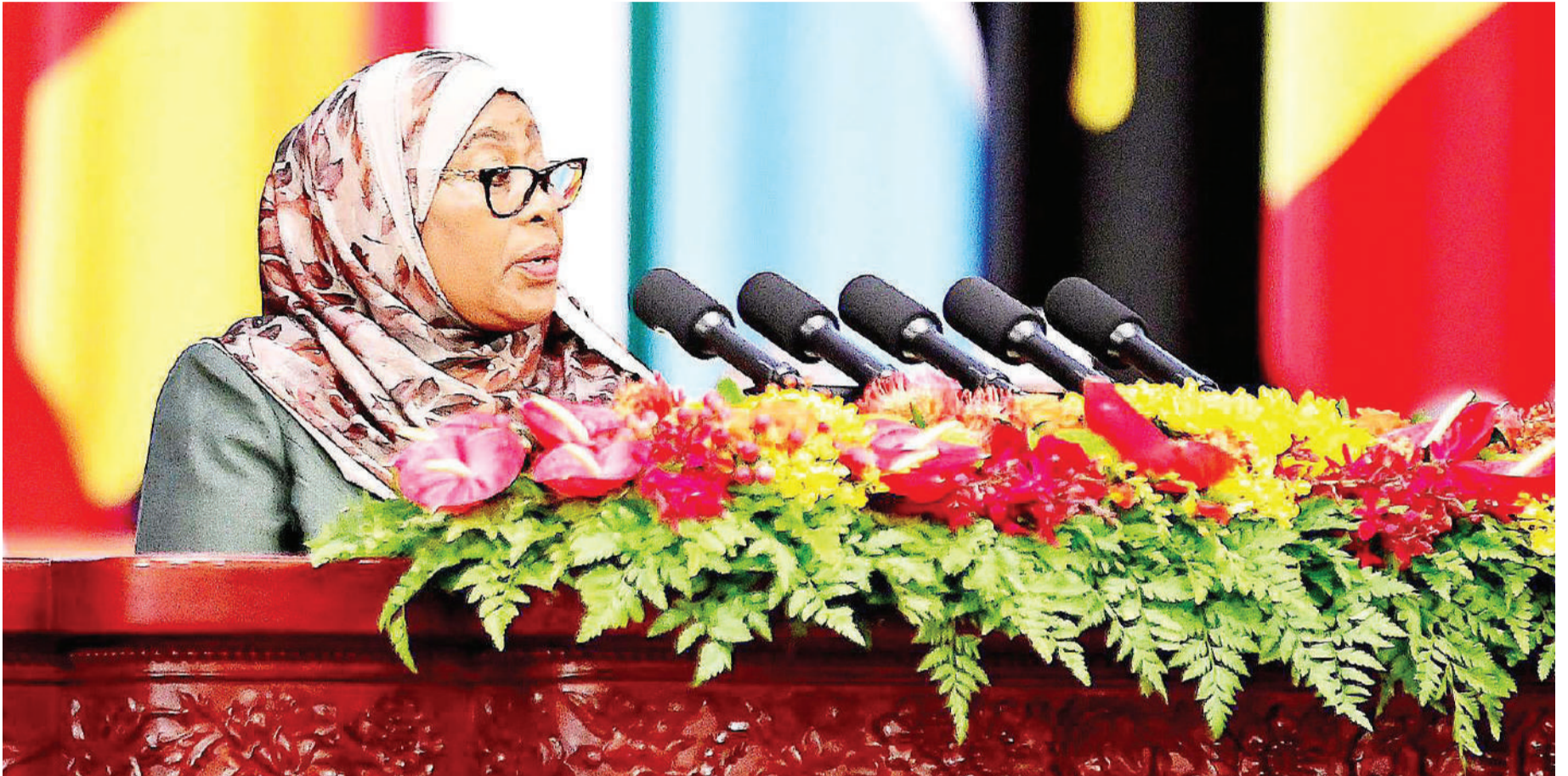
Rais Samia Suluhu Hassan, akihutubia jukwaa la Afrika, China wiki iliyopita.

• Uwekezaji popote kwenye dawa, kandanda, viwanda