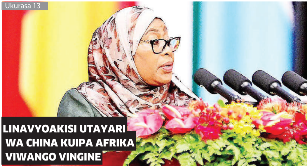
LINAVYOAKISI UTAYARI WA CHINA KUIPA AFRIKA VIWANGO VINGINE