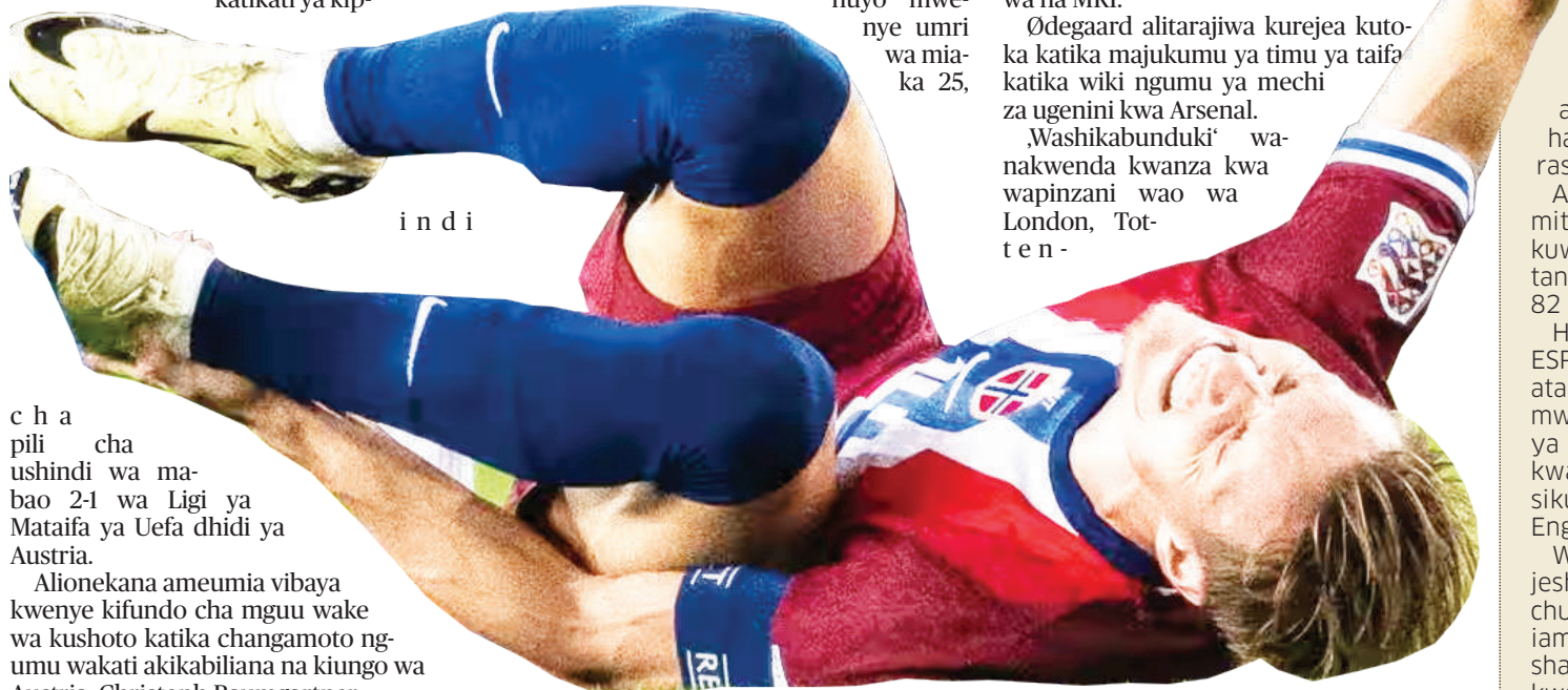
i n d i

‘Washikabunduki’ wana kwenda kwanza kwa wapinzani wao wa London, Tottenham -