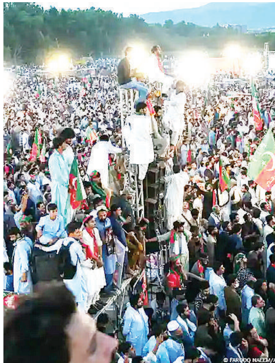
Wananchi nchini Pakistan wakiwa wamekusanyika kushinikiza kuachiwa kwa mmoja wa viongozi wakuu wa chama cha waziri mkuu wa zamani, Imran Khan, aliyewekwa kizuizini hivi karibuni.