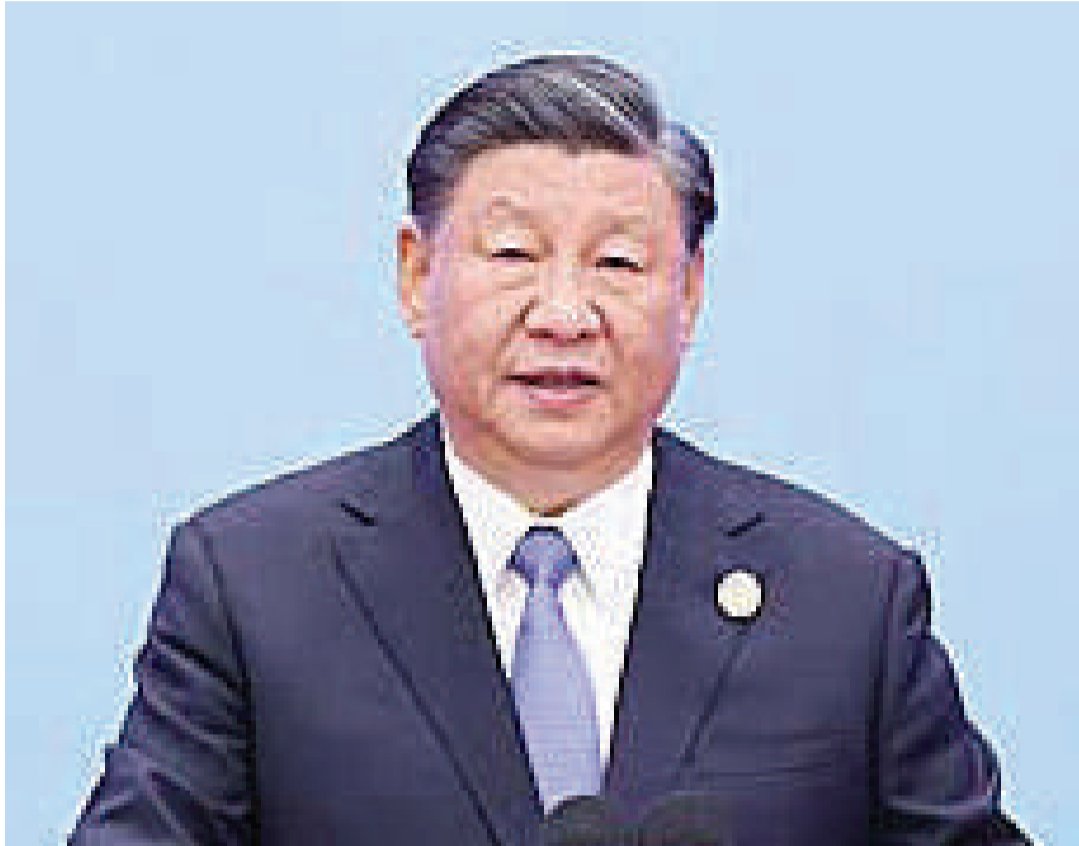
Rais wa China, Xi Jinping.

Mtandao wa usafirishaji wa Ethiopia, unasema China imejenga reli ya kisasa ya SGR inayounganisha Addis Ababa, Ethiopia hadi Djibouti, zikiwa ni kilometa 752 zinazohudumia mataifa hayo yasiyo na bandari.