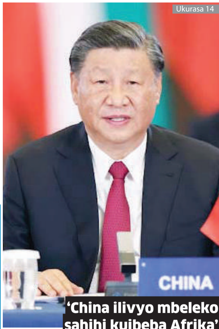
'China ilivyo mbeleko sahihi kuibeba Afrika'