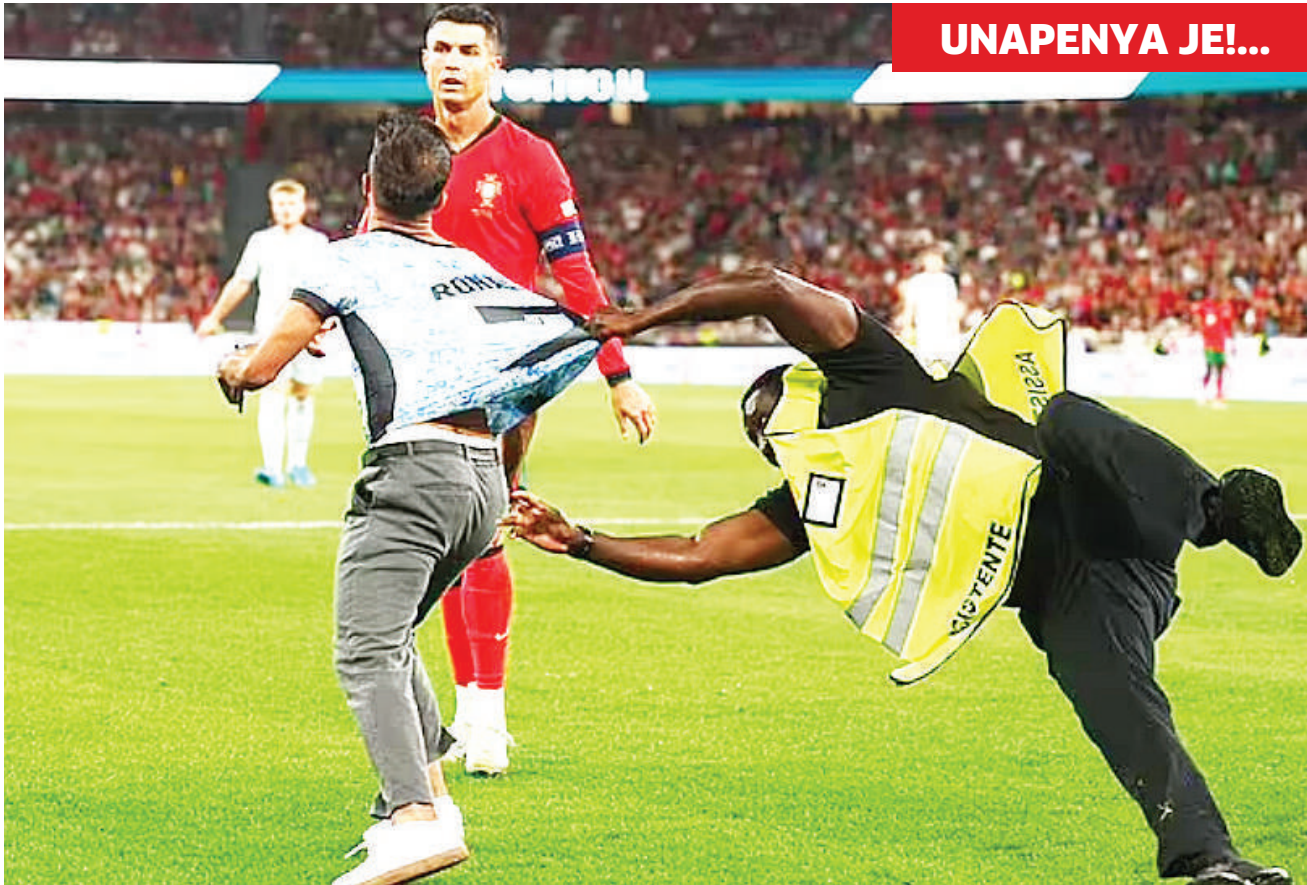
Mlinda usalama uwanjani ('Steward'), akiruka kumzuia shabiki aliyevamia uwanjani (pitch invader) kwenda kumkumbatia, mshambuliaji wa Ureno, Cristiano Ronaldo, kwenye mechi ya Ligi ya Mataifa ya Ulaya dhidi ya Scotland, iliyopigwa Jumapili iliyopita katika Uwanja wa Estadio da Luiz uliopo Benfica, Ureno. Wenyenjeji hao walishinda kwa mabao 2-1.