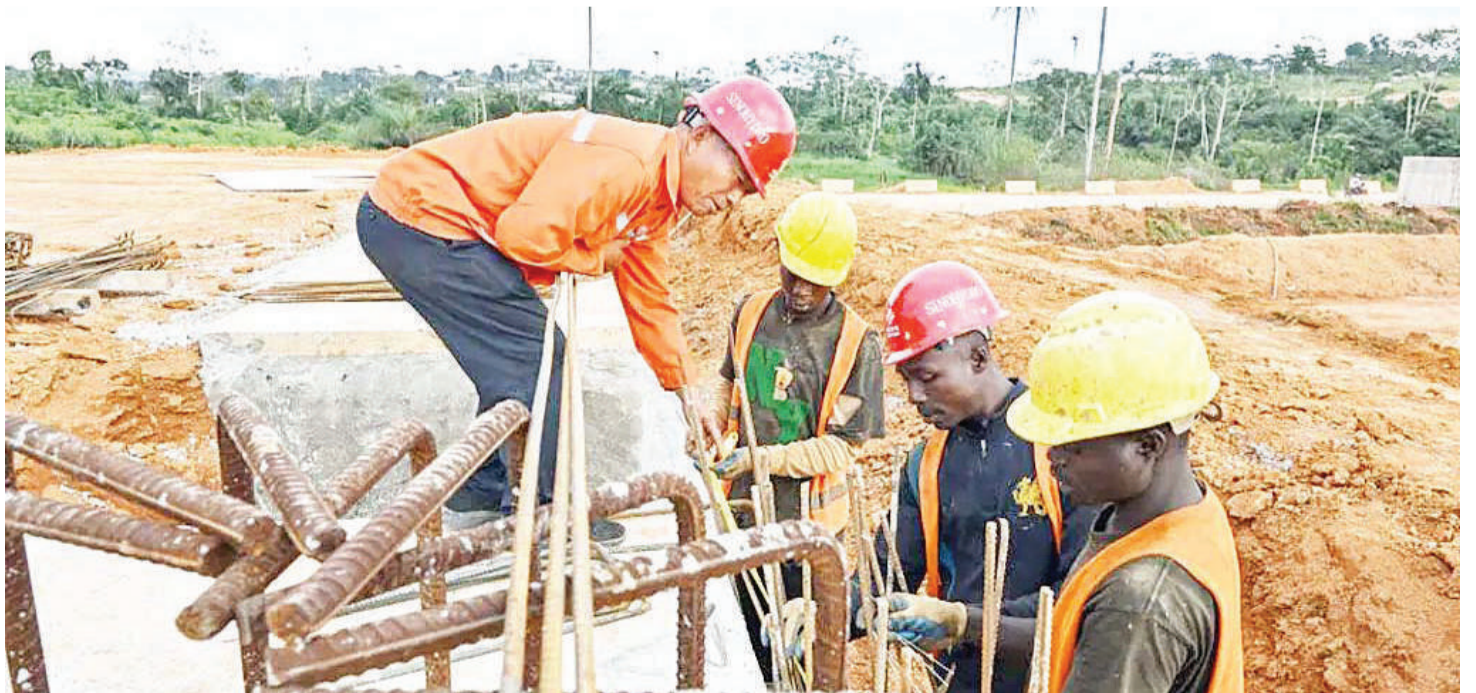
Makandarasi wa China wakijenga miundombinu Afrika.

China kwa kifupi misaada yake na kazi zake siyo hewa, mfano nchi za Magharibi zinaweza kutoa ahadi ya kuchangia fedha kwenye mfuko wa mabadiliko ya tabianchi lakini kinachoonekana ni kusuasua zaidi.