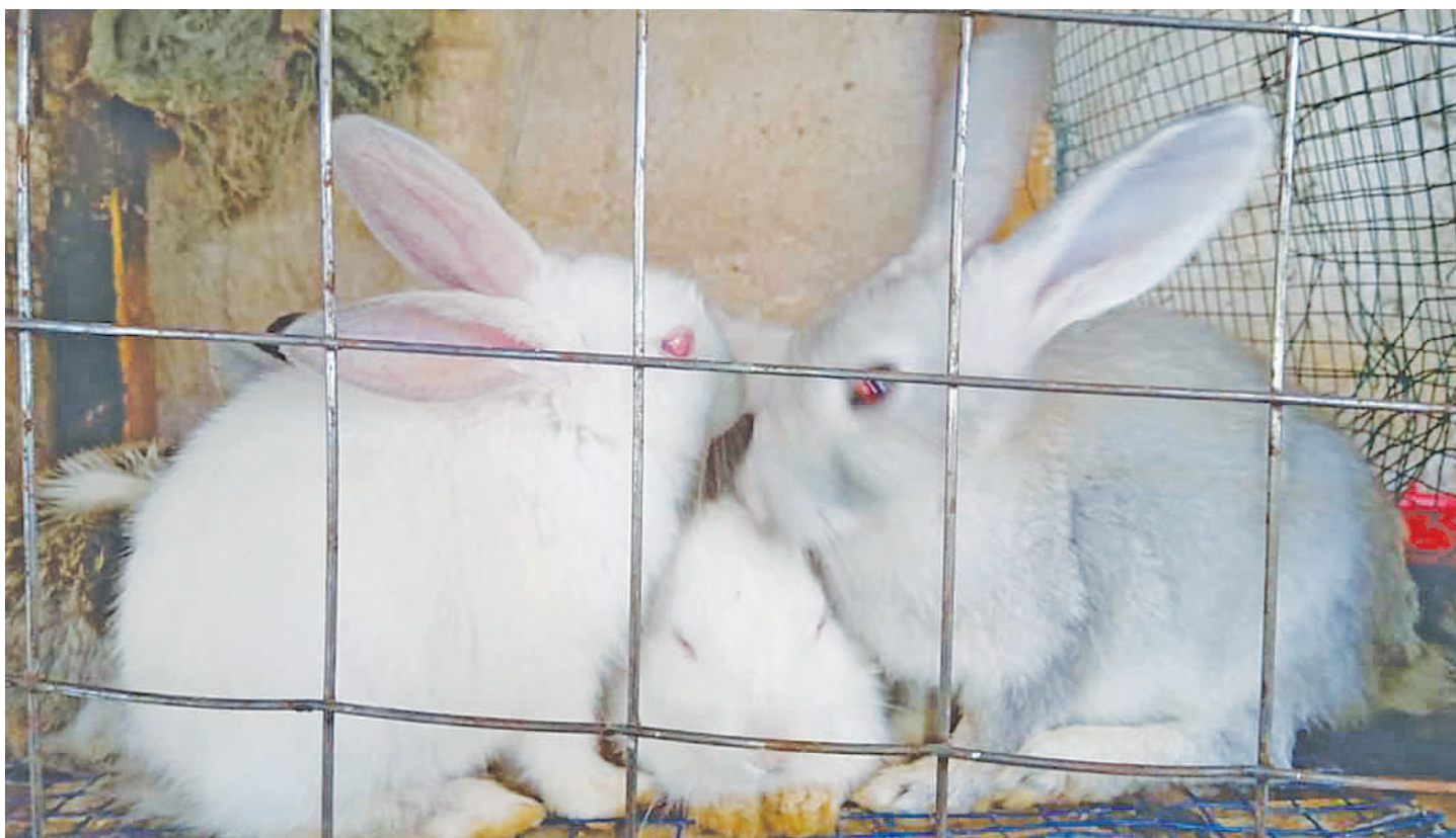
Sungura wakiwa bandani.

• Kuanzia samadi, mkojo hadi manyoya ni pesa