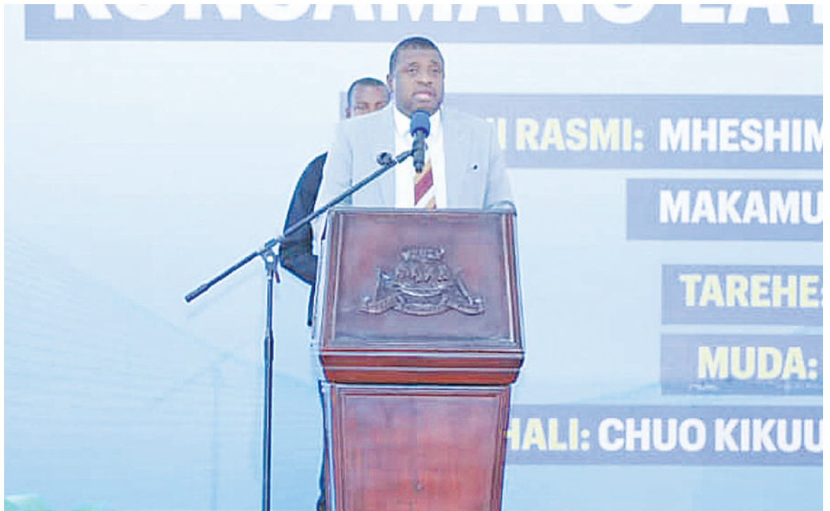
Makamu wa Pili wa Rais wa Zanzibar, Hemed Suleiman Abdulla, akizungumza na viongozi mbalimbali wa chama na serikali, wadau wa maendeleo na wananchi waliofika katika ufunguzi wa kongamano la ukusanyaji wa maoni na wadau kuhusu Dira ya Taifa 2050 katika ukumbi wa Mikutano wa Chuo Kikuu cha Taifa cha Zanzibar (SUZA), Tunguu jana.

Baada ya kumpata mgombea wa nafasi ya EALA, Septemba 5, mwaka huu, wabunge wa Bunge la Jamhuri ya Muungano wa Tanzania, watapiga kura kumpitisha mbunge huyo.