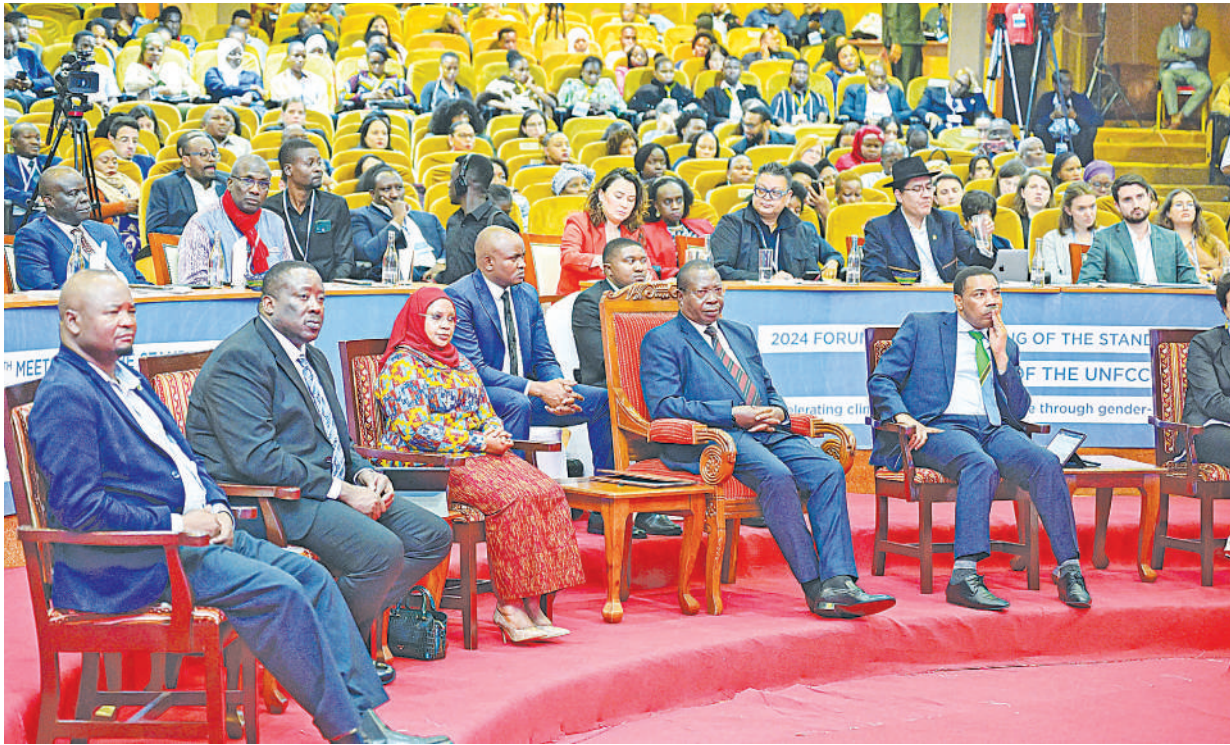
Makamu wa Rais, Dk. Philip Mpango (katikati), akishiriki katika Ufunguzi wa Mkutano wa 35 wa Kamati ya Kudumu ya Fedha ya Mkataba wa Umoja wa Mataifa kuhusu Mabadiliko ya Tabianchi unaofanyika katika Kituo cha Mikutano cha Kimataifa cha Arusha (AICC) jana.