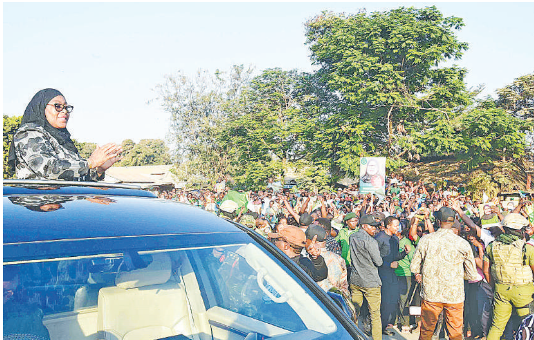
Rais Samia Suluhu Hassan akiwasalimia wakazi wa Kibaoni, Ifakara ikiwa sehemu ya ziara yake ya kikazi mkoani Morogoro.

Kuwaelimisha na kuwahamasisa wakulima kutaihakikishia nchi amani na kumaliza ugomvi kati ya wakulima na wafugaji na kuchangia maendeleo kwani sekta