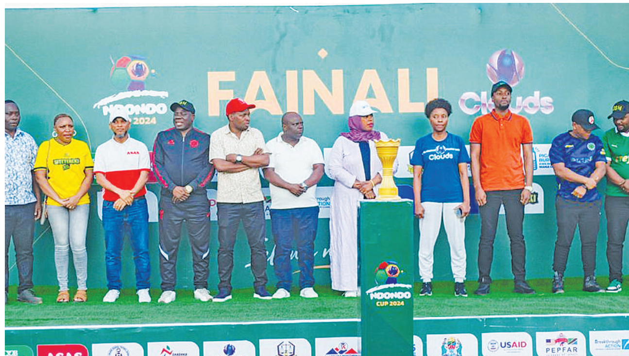
Wawakilishi wa udhamini wa michuano ya Ndongdo Cup 2024, wakiwa tayari kutoa medali kwa washindi mbalimbali wa fainali hizo ambazo zilichezwa jijini Dar es Salaam mwishoni mwa wiki. Wakati wa mashindano hayo, vijana 10,000 walifaidika na huduma za afya ikiwamo kupima VVU na chanjo.

Ndongdo Cup imeonesha jinsi matukio ya michezo yanavyoweza kutumika kama kichocho chenye nguvu cha kuhamasisha afya na ustawi, na hivyo kuweka kiwango kipya cha kuboresha afya ya umma kupitia ushirikishwaji wa jamii.