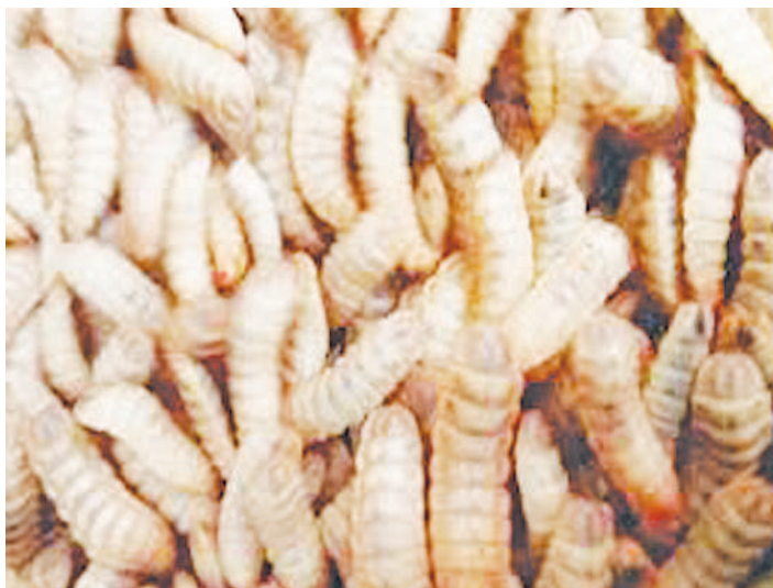
Wadudu (black soldiers), walio tayari kulishwa na kuku, bata na nguruwe.

zowafanya wanyama kunenepa,” anasema Masanja.