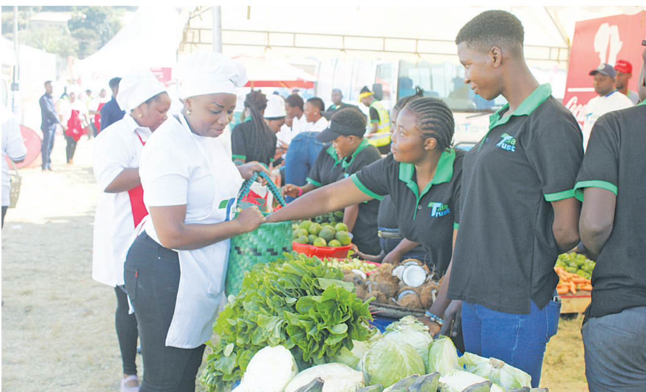
Baadhi ya mama na babalisha wa Jiji la Mbeya walio Shiriki Tamasha la Mapishi la Tulia Cooking Festival, wakichukua bidhaa kwenye soko la mfano lililokuwa limeandaliwa na Taasisi ya Tulia Trust juzi, wakati wa fainali ya tamasha hilo.