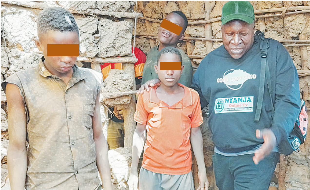
Baadhi ya watoto waliookolewa kutoka kwenye utumikishwaji katika machimbo ya madini yaliyoko Kijiji cha Dilifu, Manispaa ya Mpanda, mkoani Katavi.

• Faini makosa rushwa ngono kuongezwa, kugusa uchaguzi, michezo kubahatisha... Uk. 2