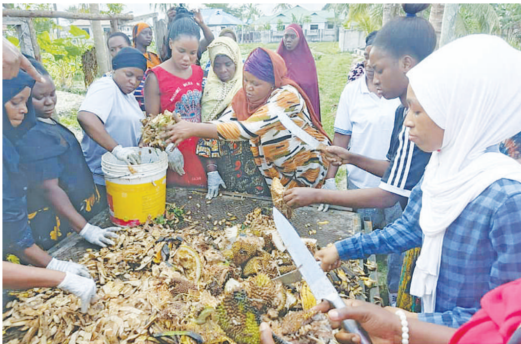
Wajasiriamali Kipunguni wakiandaa matunda na makombo ili kuzalisha wadudu au protini ya kulisha mifugo.

“Baada ya siku 21, wadudu waitwao ‘black soldiers’ wamezalishwa na wako tayari kuvunwa kwa ajili ya kulisha ng’ombe, nguruwe au kuku. Wanaprotini nyingi zina-