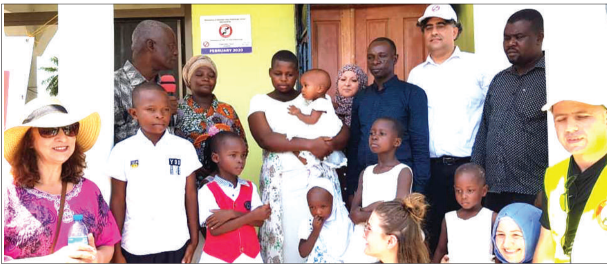
Watoto wanaolelewa katika kituo cha Amazing Steps, kilichoko wilayani Bagamoyo, mkoani Pwani, wakiwa kwenye picha ya pamoja na viongozi wa Taasisi ya Time to Help ya Uholanzi na viongozi wa shule za Feza, waliokarabati kituo hicho.

Alisema wadudu hao vamizi kwa mara ya kwanza waliingia nchini miaka ya 2000 wakitokea mataifa ya Amerika Kusini na wamesababisha madhara makubwa kwa wakulima, wakishambulia mahindi, ngano, ulezi, pamba, mtama, tumbaku, viazi na mpunga.