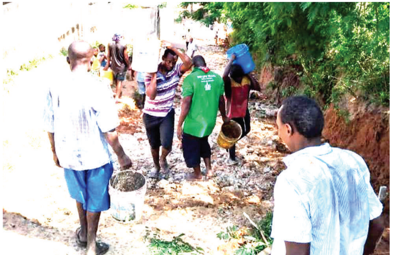
Wakazi wa Tabata Kisukuru, jijini Dar es Salaam, wakijitolea kujenga barabara ya mtaa wao, kwa kiwango cha zege, baada ya kuharibiwa vibaya na mvua.

Alidai Jeshi la Polisi wilayani Muheza lilifika eneo la tukio na kuichukua miili ya vijana hao na kuipeleka chumba cha kuhifadhi maiti cha hospitali teule ya wilaya hiyo.