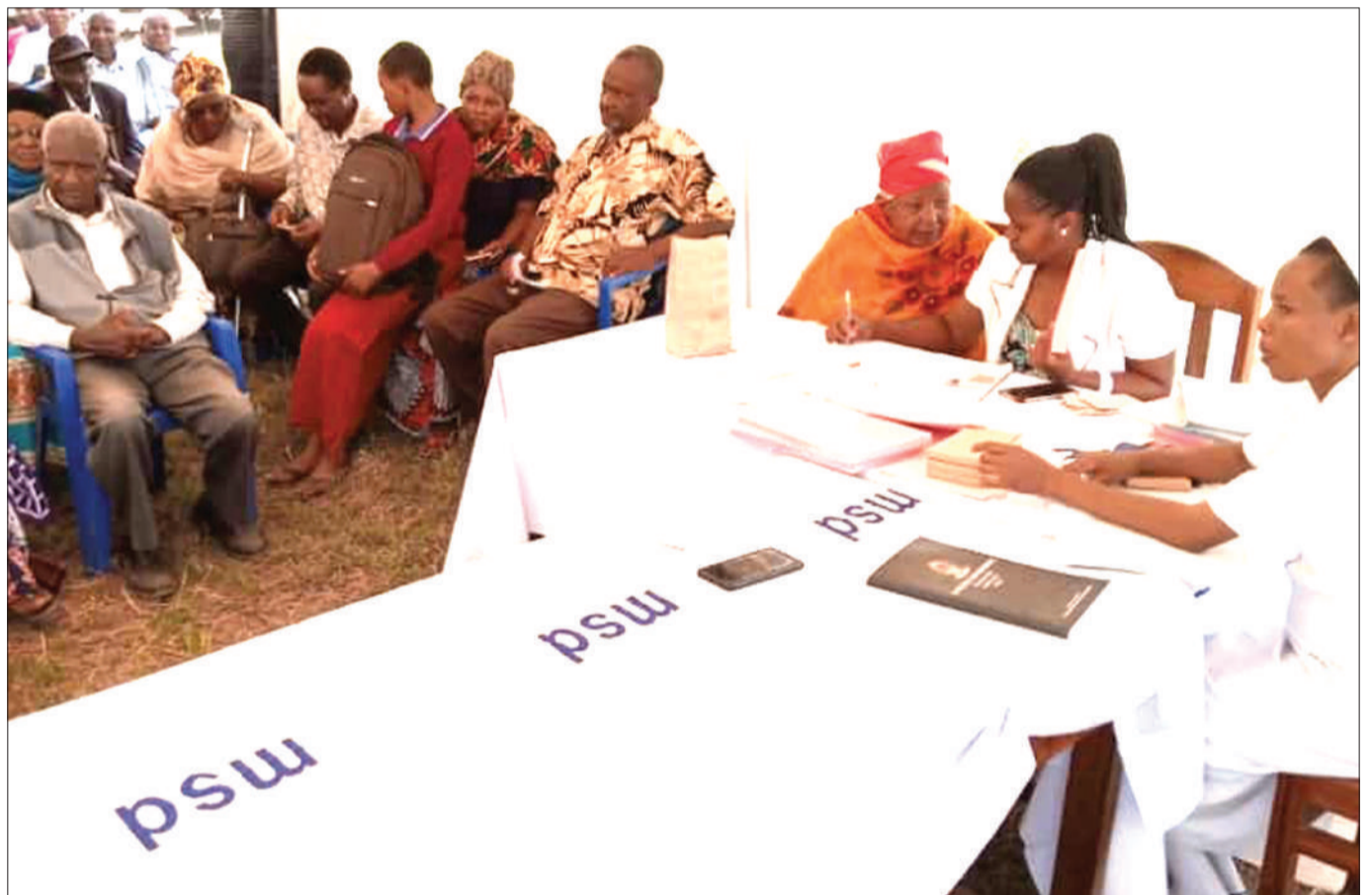
Baadhi ya wananchi wa Wilaya ya Hai, mkoani Kilimanjaro, wakisubiri kufanyiwa uchunguzi wa magonjwa mbalimbali ikiwamo homa ya ini na madaktari bingwa wa Hospitali ya Rufani ya KCMC na Hospitali ya Mawenzi, jana.

Alisema Hifadhi ya Taifa ya Mkomazi ni miongoni mwa chache zenye wanyama aina ya faru ikiwa ndio inayotumika kuzalisha idadi ya wanyama hao kwa ajili ya kuimarisha utalii katika hifadhi za Tanzania.