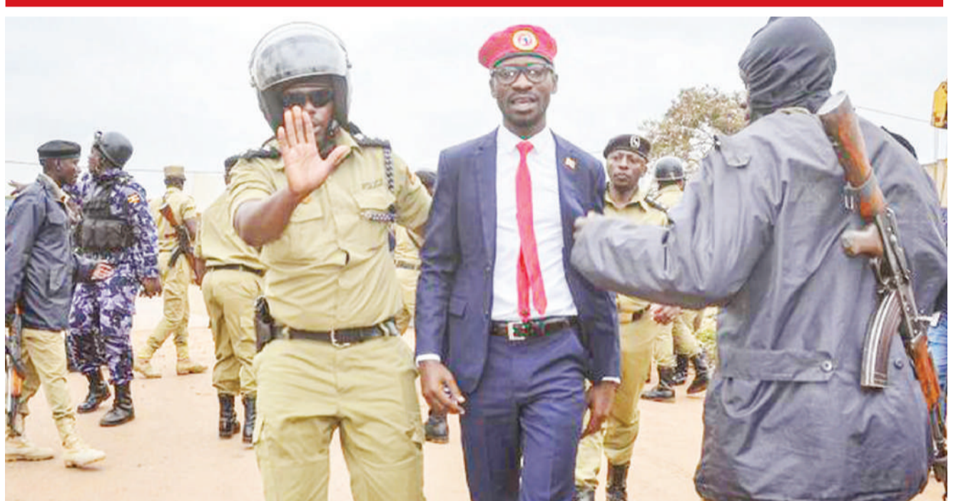
Mwanasiasa wa Uganda, Bobi Wine (katikati), akiwa amekabiliwa na polisi walipokuwa wakijaribu kuzuia mikutano yake. PICHA: AFP

Rais Trump alihitimisha ziara yake jana katika Mji wa New Delhi alipozungumza na Modi. DW