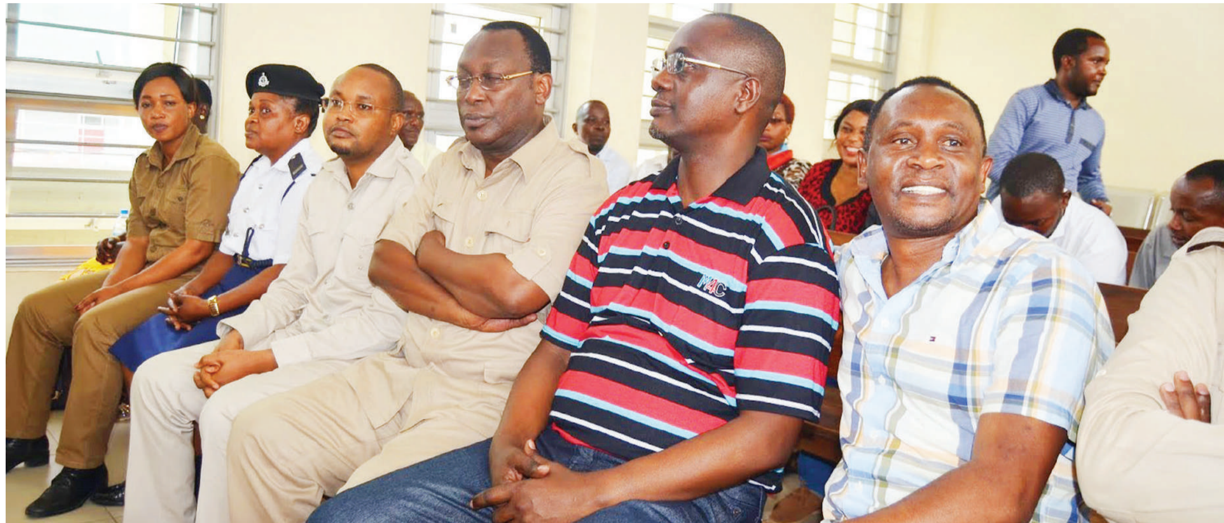
Dk. Mashinji akiwa na Mwenyekiti Mbowe na viongozi wengine wa Chadema mahakamani.

"Tulivyofika kabla ya kupokea machapisho yetu alituhoji kama tuna kadi ya chama na kutataka kuchukua kadi, lakini hakujua kuwa uanachama ulikiwa moyoni zaidi kuliko kushika kadi, nilichukua kadi za Chadema, Machi mosi, mwaka 2011 na kuwa mwanachama ambaye nilipenda kufanyakazi kwa kujitoea zaidi," anaeleza.