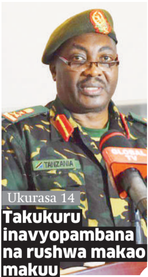
Ukurasa 14 Takukuru inavyopambana na rushwa makao makuu

Uchaguzi serikali za mitaa DRC wapigwa tena kalenda