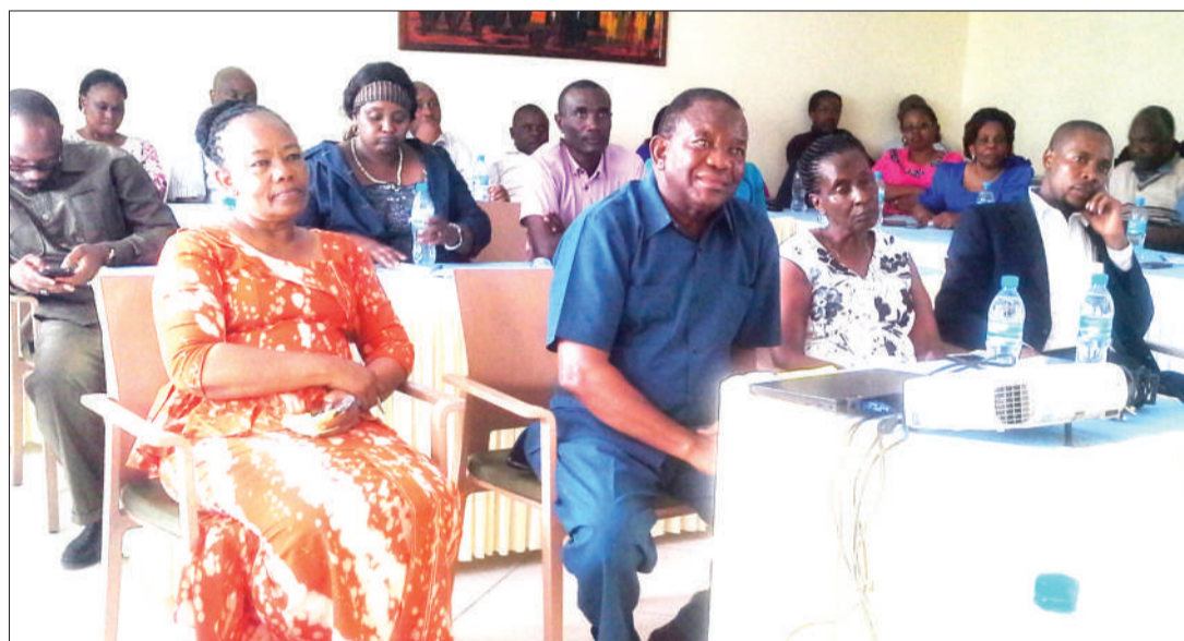
Wakufunzi wa wenye ulemavu wa uziwi na wasioona kutoka Chuo cha Ualimu cha Patandi, wakimsikiliza Mkurugenzi Msaidizi Elimu Maalumu na Elimu ya Watu Wazima katika Wizara ya Tawala za Mikoa na Serikali za Mitaa (hayupo pichani), wakati akifungua warsha ya kujengewa uwezo ili kuboresha upatikanaji elimu bora kwa viziwi na wenye ulemavu mwingine, iliyoratibiwa na Shirika la Kimataifa la Sense International, Tengeru, mkoani Arusha juzi.