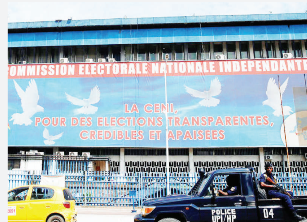
Makao makuu ya Tume ya Uchaguzi, huko Kinshasa, nchini DRC.