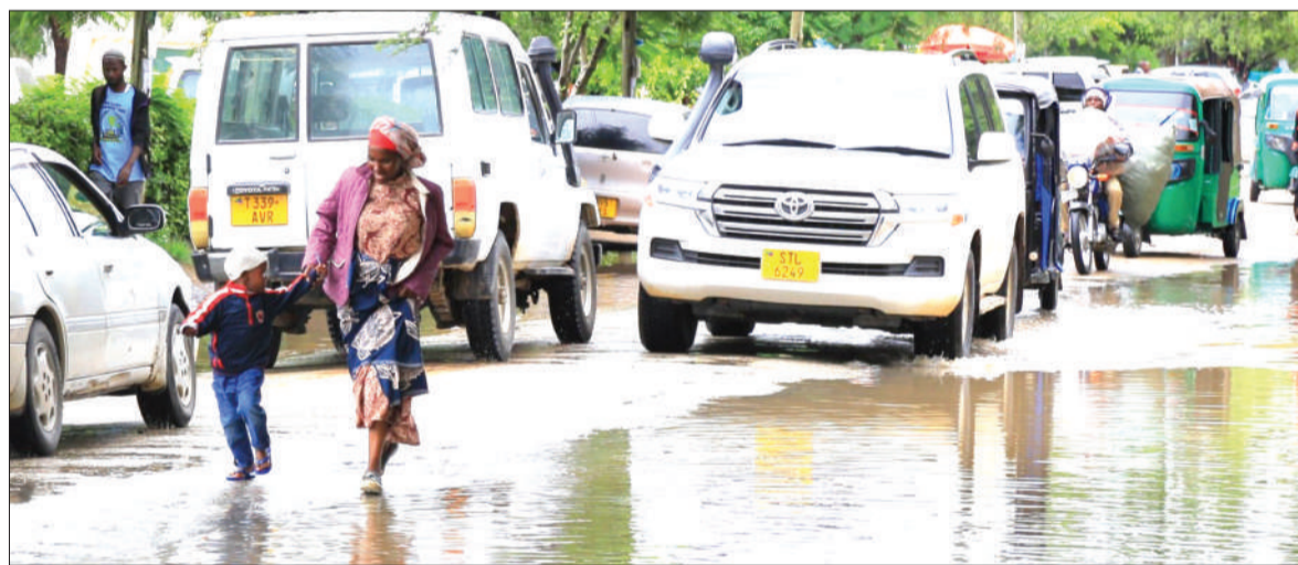
Mama na mtoto wake wakijaribu kuvuka katika Barabara ya Sido, jijini Dodoma jana, huku wakichukua tahadhari ya magari na dimbwi la maji, lililotokana na mvua zilizoonyesha katika jiji hilo.

Alisema jitihada na mikakati ya mtandao huo itasaidia kwenye masuala mbalimbali ikiwamo katika kukabiliana na mimba na ndoa za utotoni.