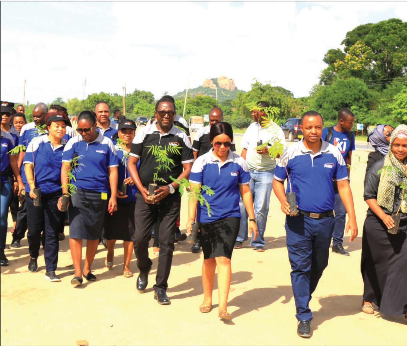
Baadhi ya wafanyakazi wa Benki ya NMB, Mkoa wa Dodoma, wakiwa kwenye kampeni ya upandaji miti eneo la Area C, jijini Dodoma mwishoni mwa wiki. Miti 500 ilipandwa ili kuunga mkono kampeni ya serikali ya kutunza mazingira.

“Pia itamwezesha kujua matumizi sahihi ya viuatilifu kulingana na vi-sumbufu lengwa kwa kuwasiliana na mamlaka ya TPRI pamoja na wamiliki wa viuatilifu na kutoa taarifa sahihi kwa TPRI kuhusu viuatilifu ambavyo havina ubora kwa ajili ya ufuatiliaji na kuchukua hatua,” alisema.