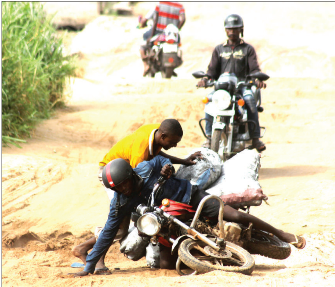
Msamaria mwema akimsaidia mwendesha pikipiki, baada ya kuanguka huku akiwa amepakia magunia ya mkaa katika eneo la Chanika, nje kidogo ya Jiji la Dar es Salaam jana.