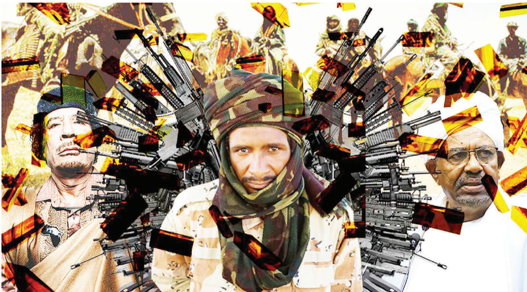
Wanamgambo wa 'Janjawid' wanaojipamba kwa risasi, wanadaiwa kuwa watu weusi takribani 300,000 kwenye jimbo la Darfur nchini Sudan.