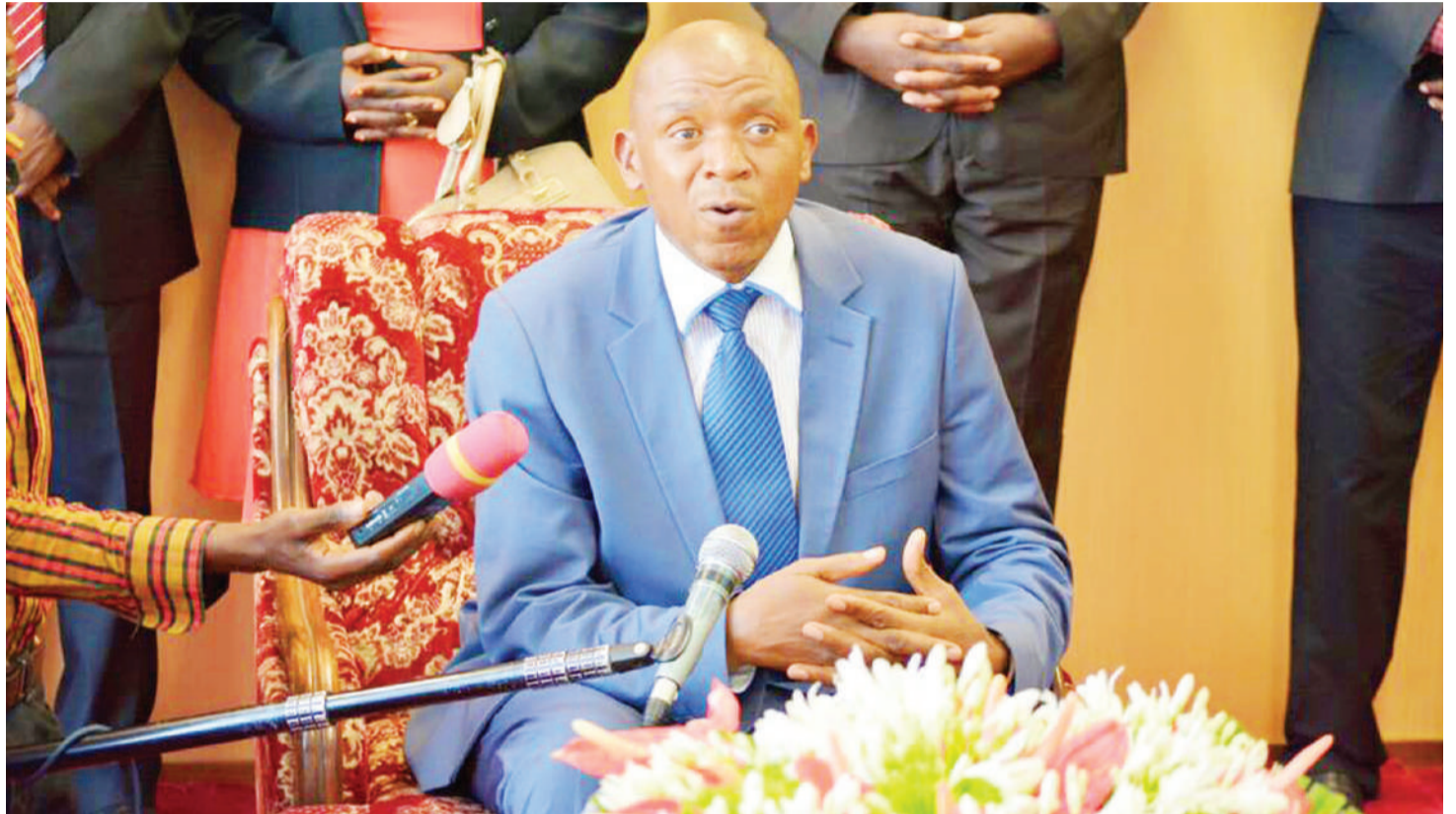
Mgombea urais wa Burundi, Agathon Rwasa.

Bunge la nchi hiyo, lilipitisha sheria ya malipo ya 'kiinua mngongo' yanayozidi Dola 500,000 na jumba la kifahari kwa rais anayetoka madarakani.