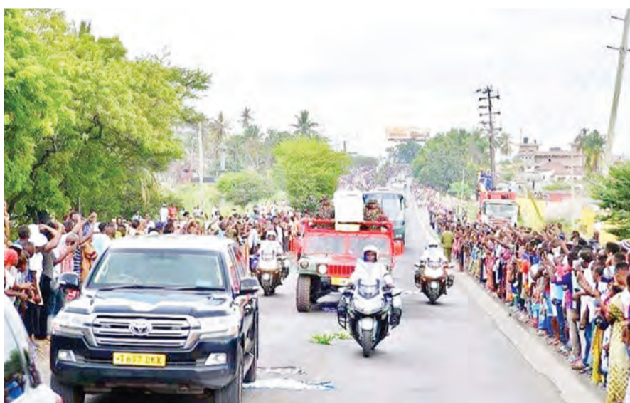
Umati wa wakazi wa Jiji la Dar es Salaam, wakiwa kando ya Barabara ya Kawawa, wakiangalia msafara wa magari uliokuwa umebeba jenea lenye mwili wa Hayati Dk. John Magufuli ukielekea katika Uwanja wa Uhuru.