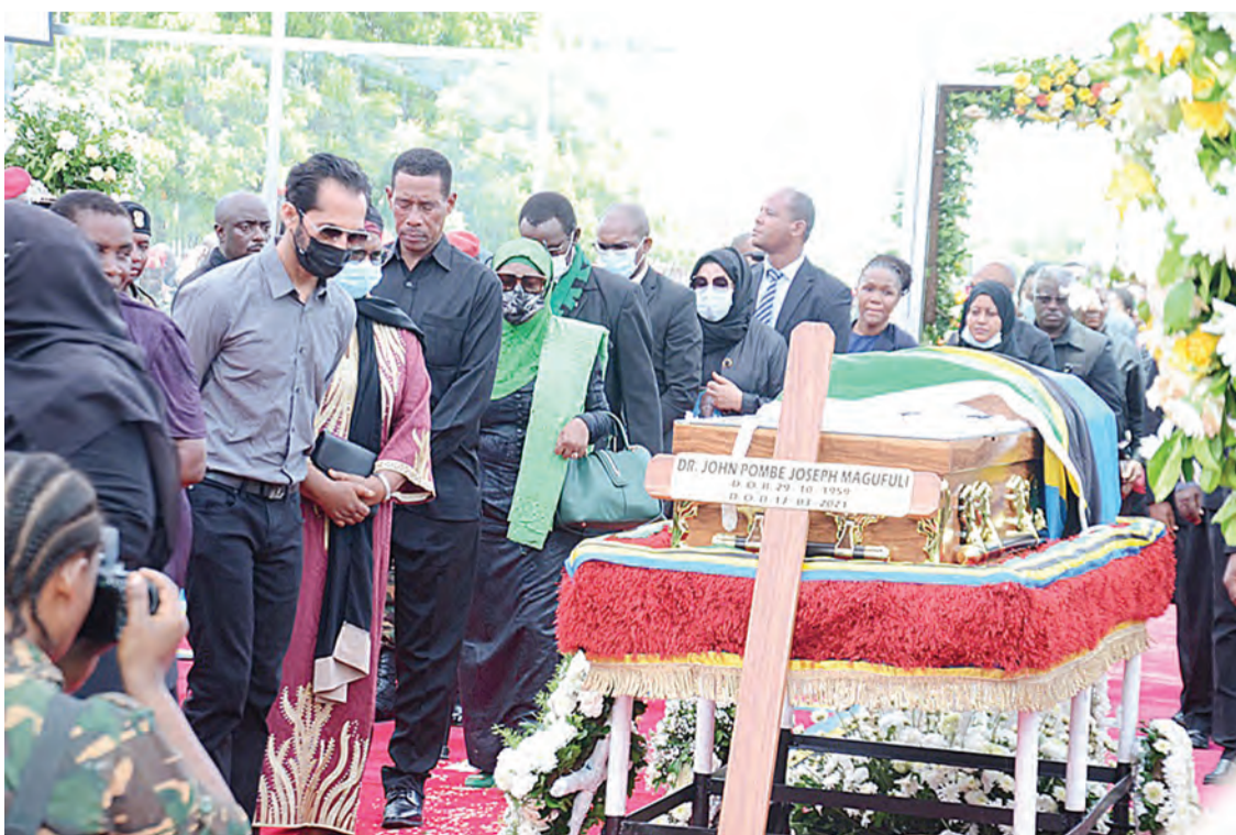
Waombolezaji wakiaga mwili wa Hayati Dk. John Magufuli, katika Uwanja wa Uhuru.