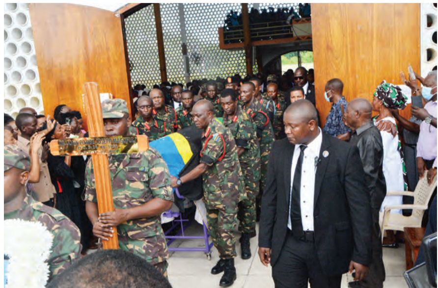
Maofisa wa Jeshi la Ulinzi wa Wananchi Tanzania (JWTZ), wakilitoa nje jenea lenye mwili wa aliyekuwa Rais, Hayati Dk. John Magufuli, baada ya kumalizika kwa ibada katika Kanisa Katoliki Parokia ya Mtakatifu Petro Oysterbay.