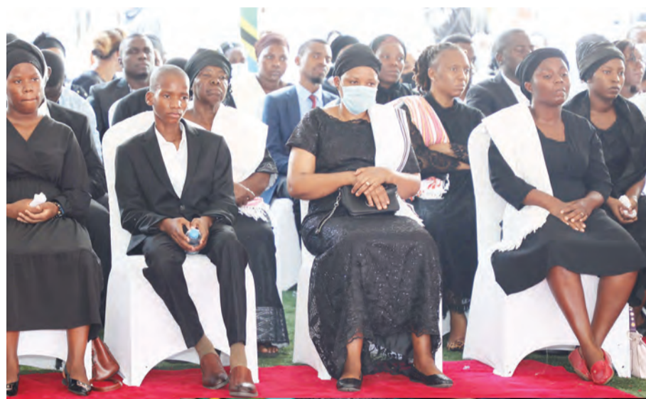
Familia ya Hayati Dk. John Pombe Magufuli, wakati wa kuaga katika Uwanja wa Uhuru.