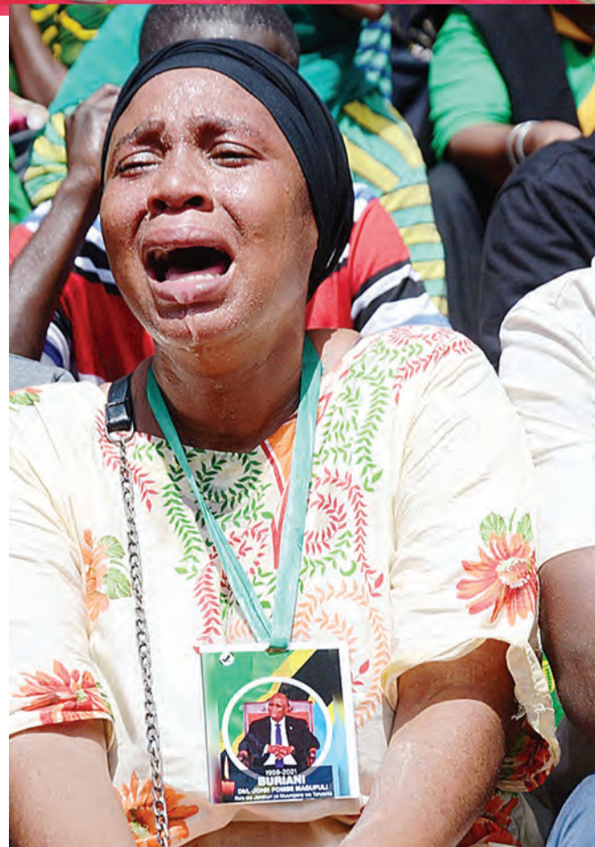
Mmoja wa waombolezaji akiangua kilio, wakati wa kuaga katika Uwanja wa Uhuru.