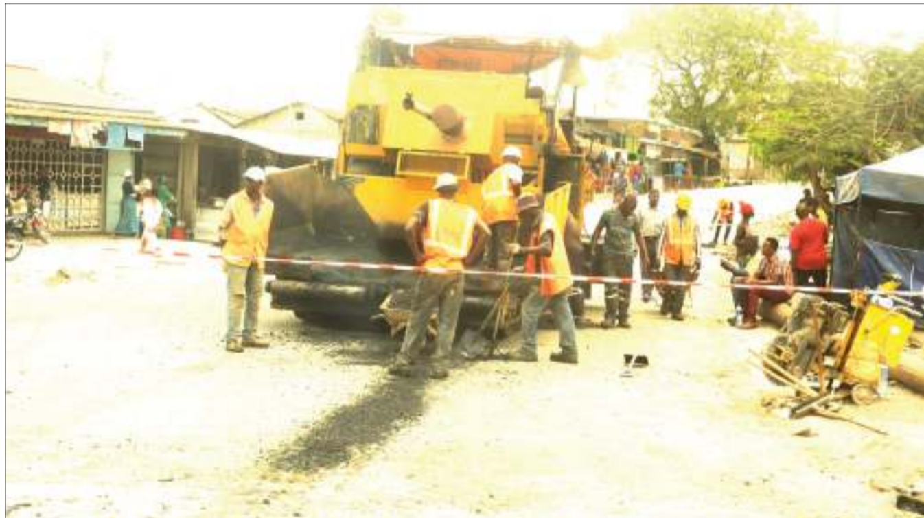
Mafundi wa kampuni ya CCECC wakiwa wameifunga barabara ya kwenda Tandale Sokoni katika Manispaa ya Kinondoni, jijini Dar es Salaam wikiendi, kwa ajili ya kukarabati sehemu ya barabara hiyo kwa kiwango cha lami.

Alisema kuwa baada ya hapo, kupitia Kamati ya Ulinzi na Usalama ya Wilaya, atatoa ripoti zaidi juu ya tukio hilo.