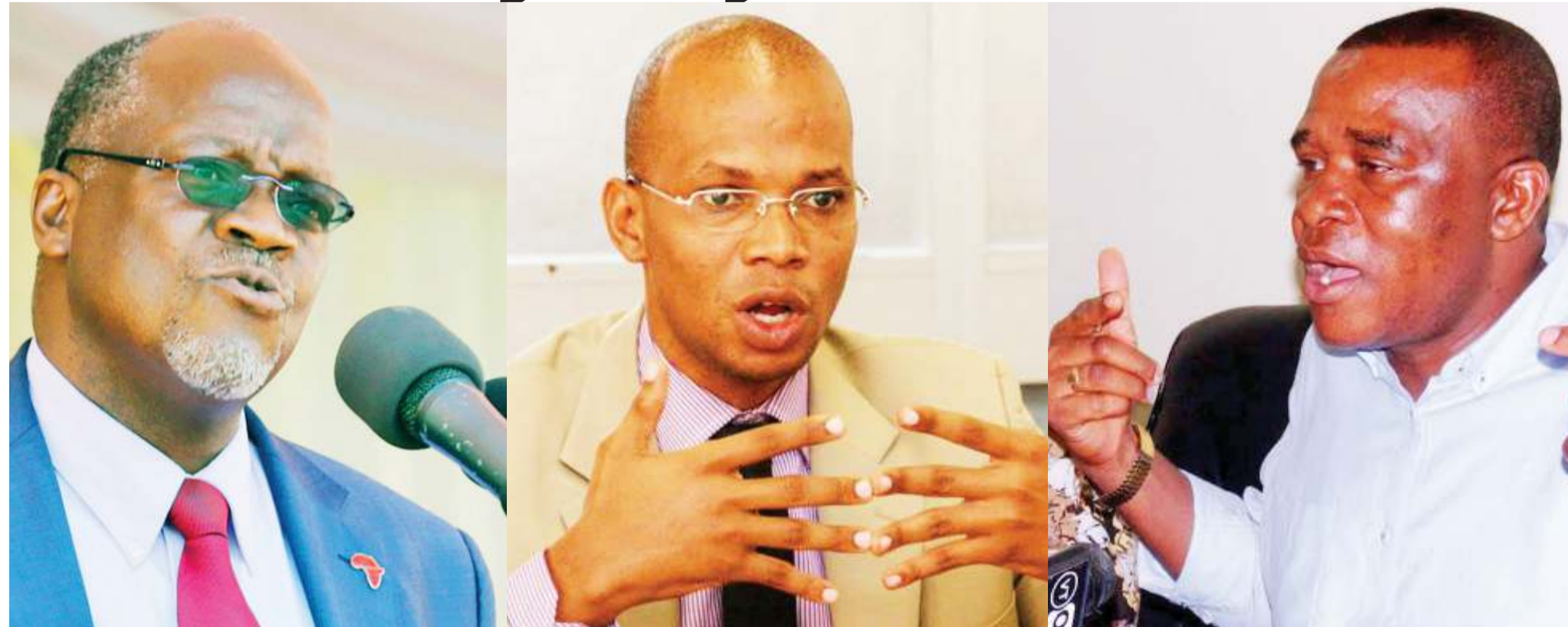
Rais John Magufuli (kushoto), William Ngeleja (kulia) na Januari Makamba, wanasiasa vijana ambao inaarifiwa walimwomba msamaha, kufuatia kuvuja kwa mazungumzo mtandanoni yakimsema Rais.