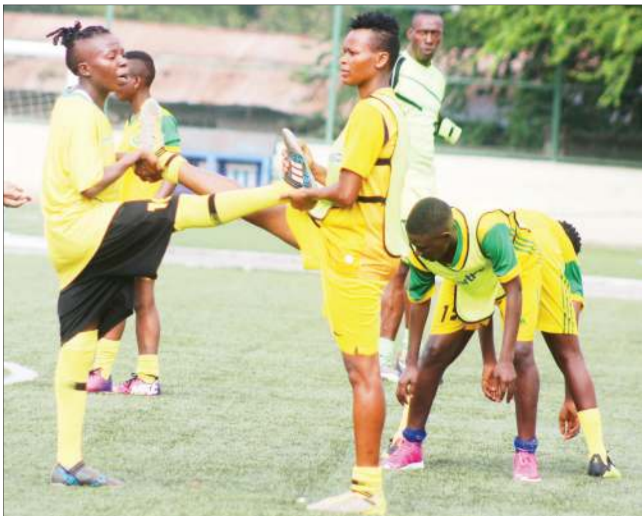
Wachezaji wa timu ya Yanga ya Wanawake, Yanga Princess, wakifanya mazoezi katika viwanja vya Jakaya Kikwete jijini Dar es Salaam jana, ikiwa ni sehemu ya maandalizi ya Ligi Kuu ya Wanawake itakayoanza baadaye mwezi huu.

Kwa sasa Yanga ambayo inaburuza mkia kwenye Ligi Kuu Bara baada ya kushuka dimbani mara moja na kupoteza mechi hiyo dhidi ya Ruvu Shooting, inajiandaa kuikaribisha Polisi Tanzania katika mchezo wa ligi hiyo utakaopigwa Uwanja wa Uhuru kesho.