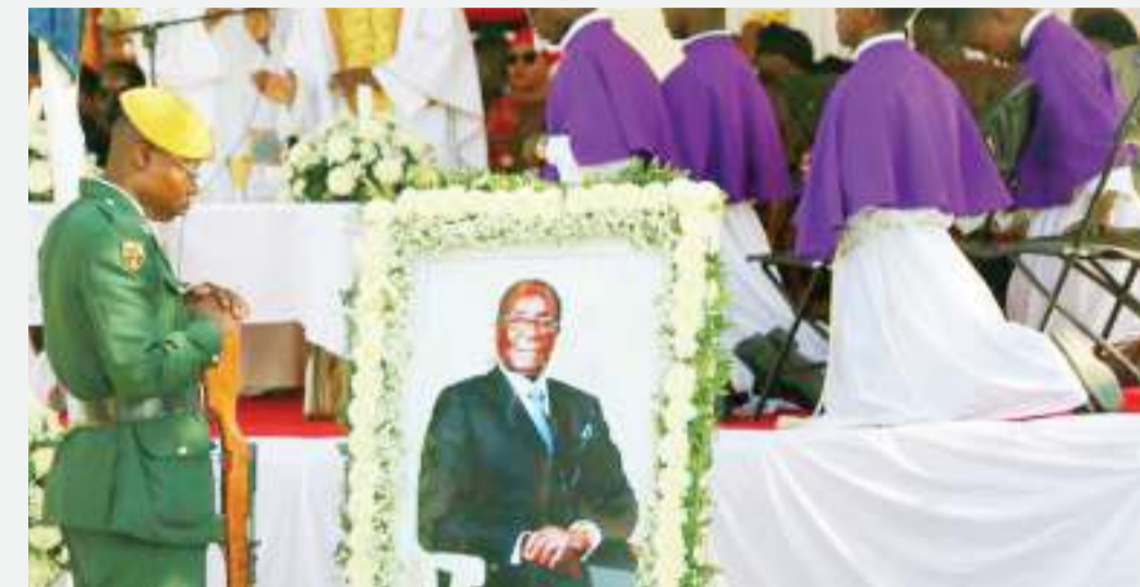
Ibada ya mazishi ya Robert Mugabe ambaye ni Rais wa zamani wa Zimbabwe iliyofanyika kijijini kwake. Kutama, Wilaya ya Zvimba kilomita 90, Magharibi mwa mji mkuu Harare.

RAIS wa zamani wa Zimbabwe Robert Mugabe alifariki wiki tatu zilizopita nchini Singapore alikokuwa akipatiwa matibabu ya maradhi yaliyokuwa yakimsumbua.