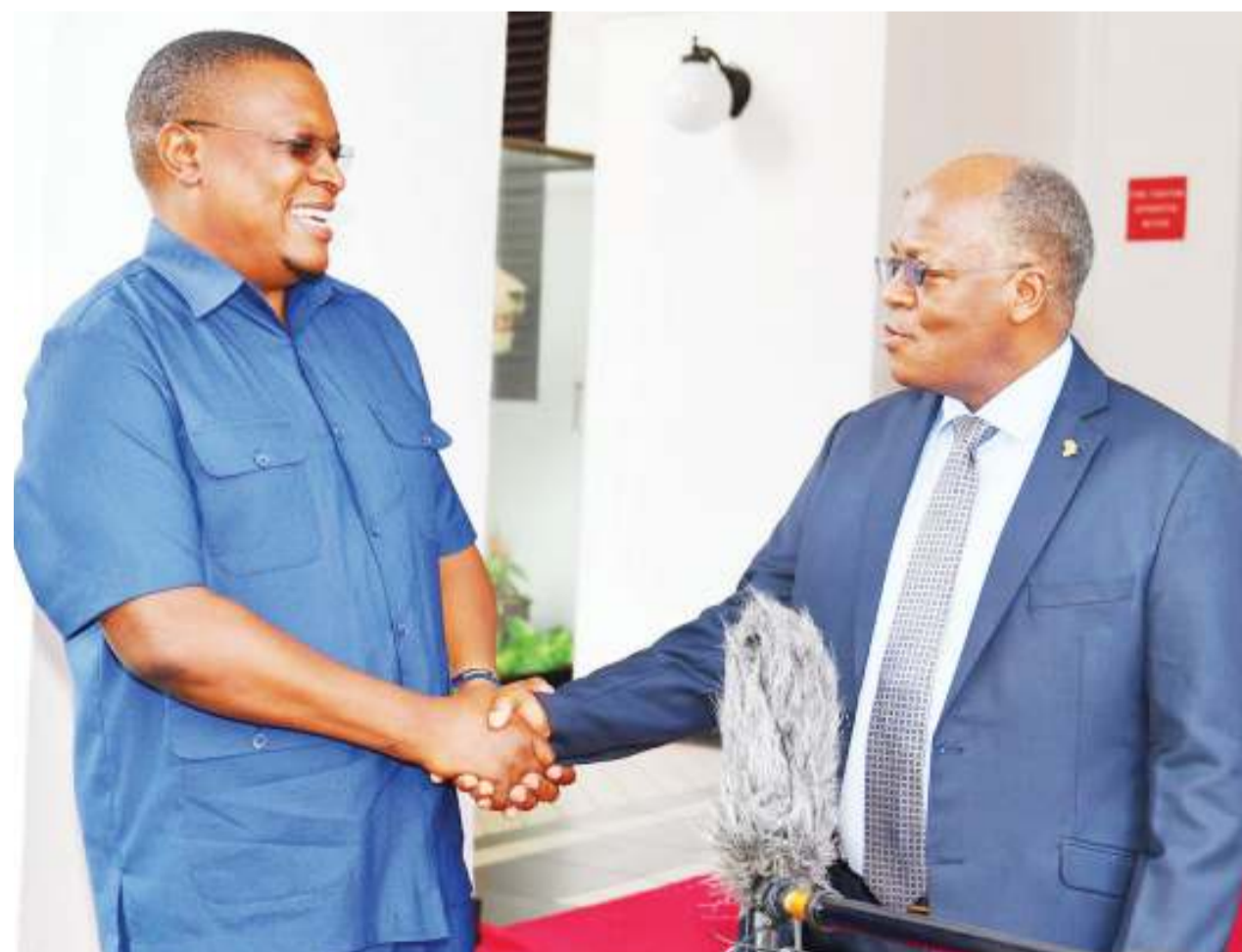
Rais John Magufuli (kulia) akiwa na Nape Nnauye alipokwenda Ikulu kuomba msamaha kufuatia kuvuja kwa mazungumzo mtandaoni yaliyokuwa yakimsema Rais.

Pia inatoa fursa kwa mtoa habari, mjadala au makala kujua maoni ya watu kuhusiana na taar-