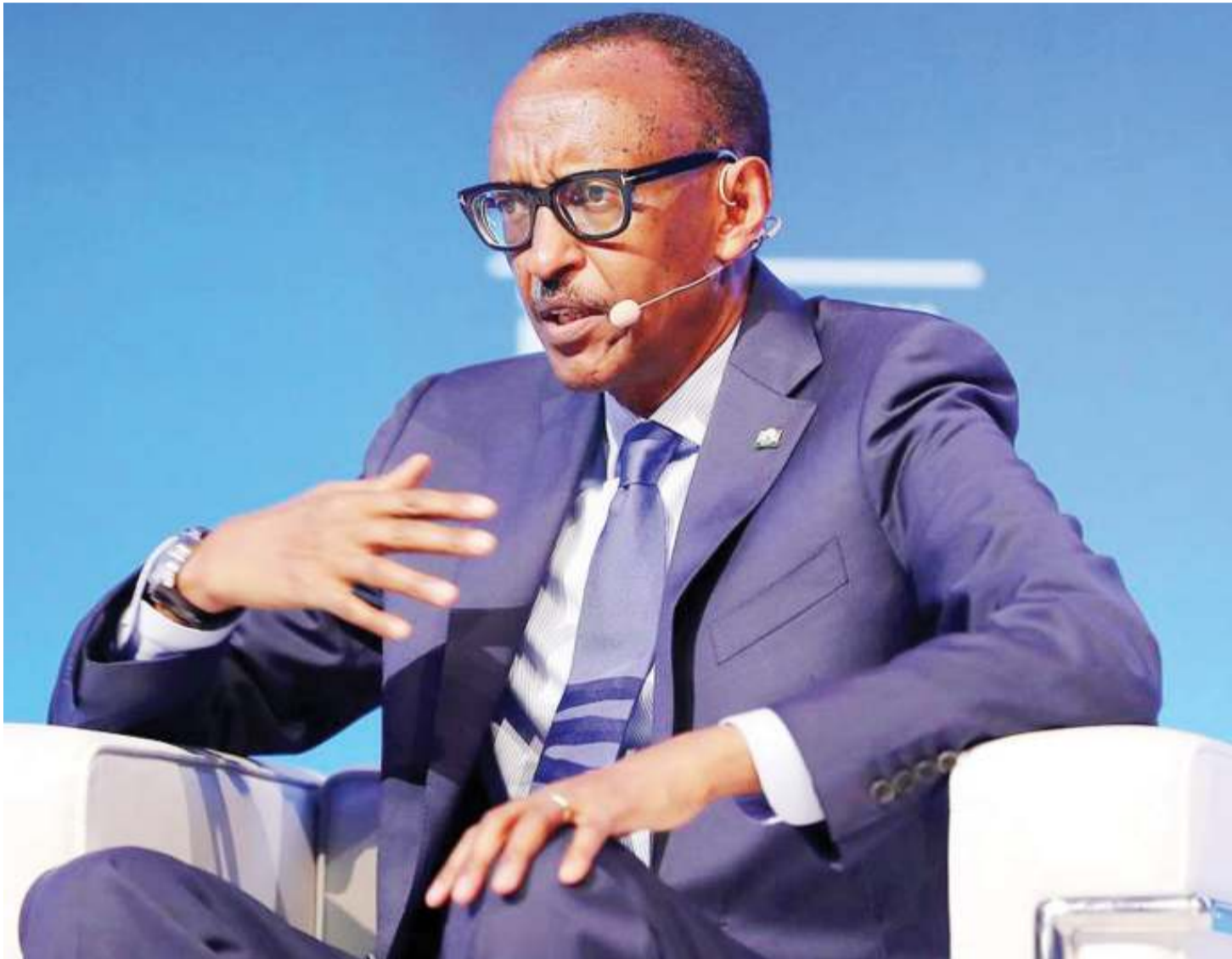
Rais Paul Kagame wa Rwanda.