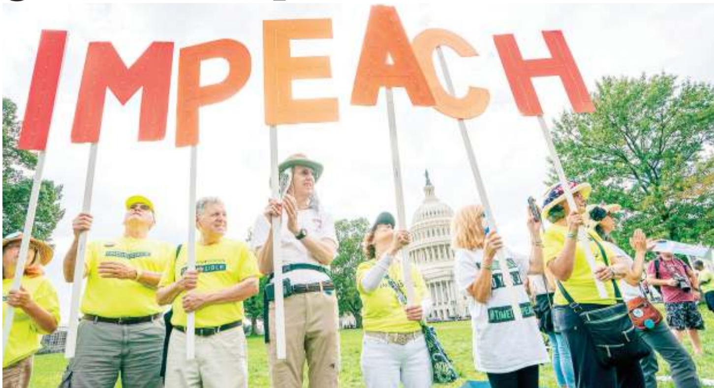
Baadhi ya raia wa Marekani wakiwa na mabango yanayoshinikiza kumshtaki Rais Donald Trump wa Marekani.