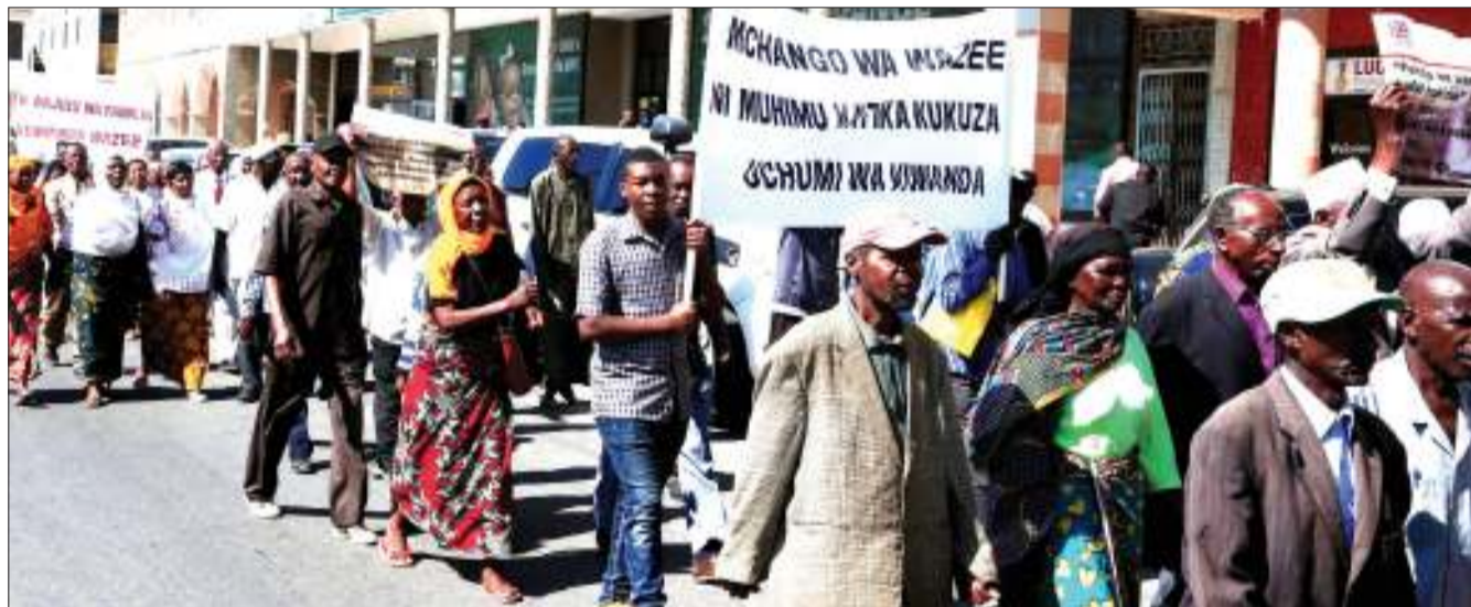
Baadhi ya wazee wa Mkoa wa Dodoma, wakishiriki maandamano kuadhimisha Siku ya Wazee Duniani, katika barabara ya Nyerere, jana.

Kadhalika, alisema Taasisi hiyo imekamaliza majalada 15 ya uchunguzi ikiwemo kufungua mashauri nane ambayo washtakiwa wake ni watu binafsi, watumishi wa sekta mbalimbali ikiwamo elimu na kilimo. Pia wamo watumishi wa Mamlaka ya Vitambulisho (NIDA), Wakala wa Barabara (Tanroads), watendaji wa kata, vijiji, na askari wa jeshi la akiba.