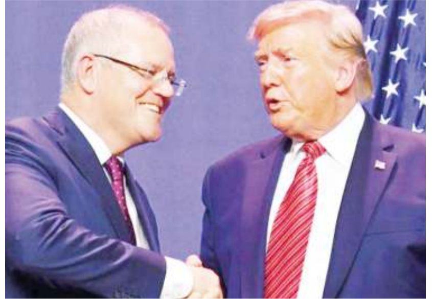
Rais wa Marekani Donald Trump (kulia) na Waziri Mkuu wa Australia, Scott Morrison.

Mwenyekiti wa kamati ya bunge ya masuala ya kijasusi, Adam Schiff, pamoja na wenyeviti wa kamati nyingine mbili zinazongozwa na Wademocratic zimetoa hati hiyo kwa Giuliani na kumpa hadi Oktoba 15 kuwa amewasiliana