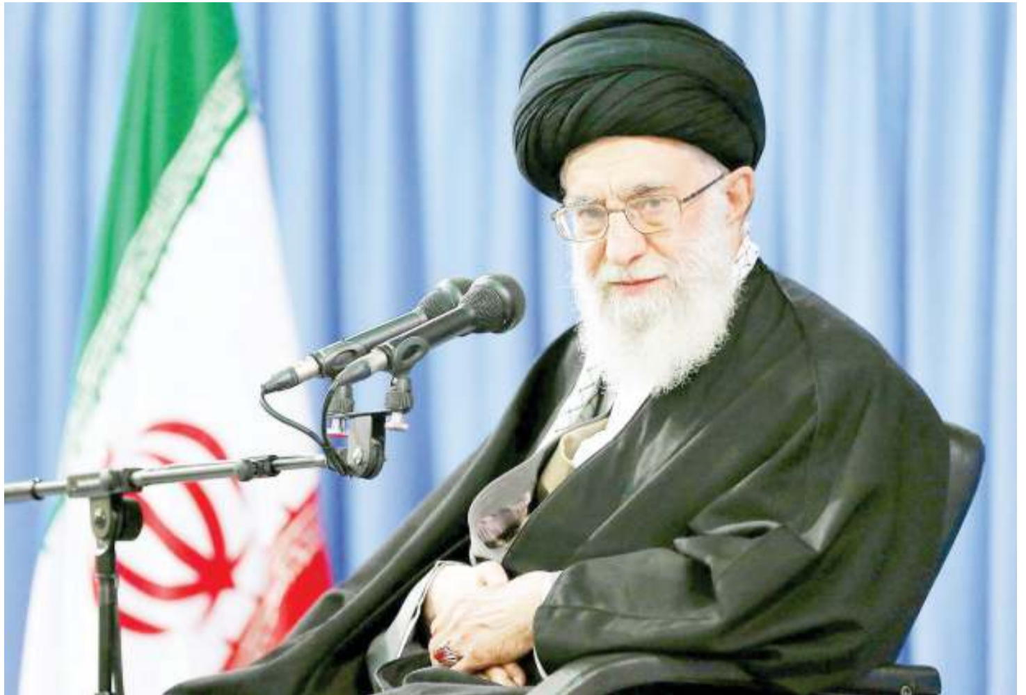
Kiongozi wa Iran, Ayatollah Ali Khamenei.

Tofauti ni kuwa kuna nchi kadhaa zenye hifadhi kubwa ya mafuta inayoweza kutumika katika hali kama hii, kwa mfano Rais Trump aliongelea uwezekano wa kupunguza hifadhi ya Marekani ya mafuta, wakati wahifadhi wengine wakubwa kama Russia, Japan na China walikuwa pia wanaangalia hali inavyokwenda.