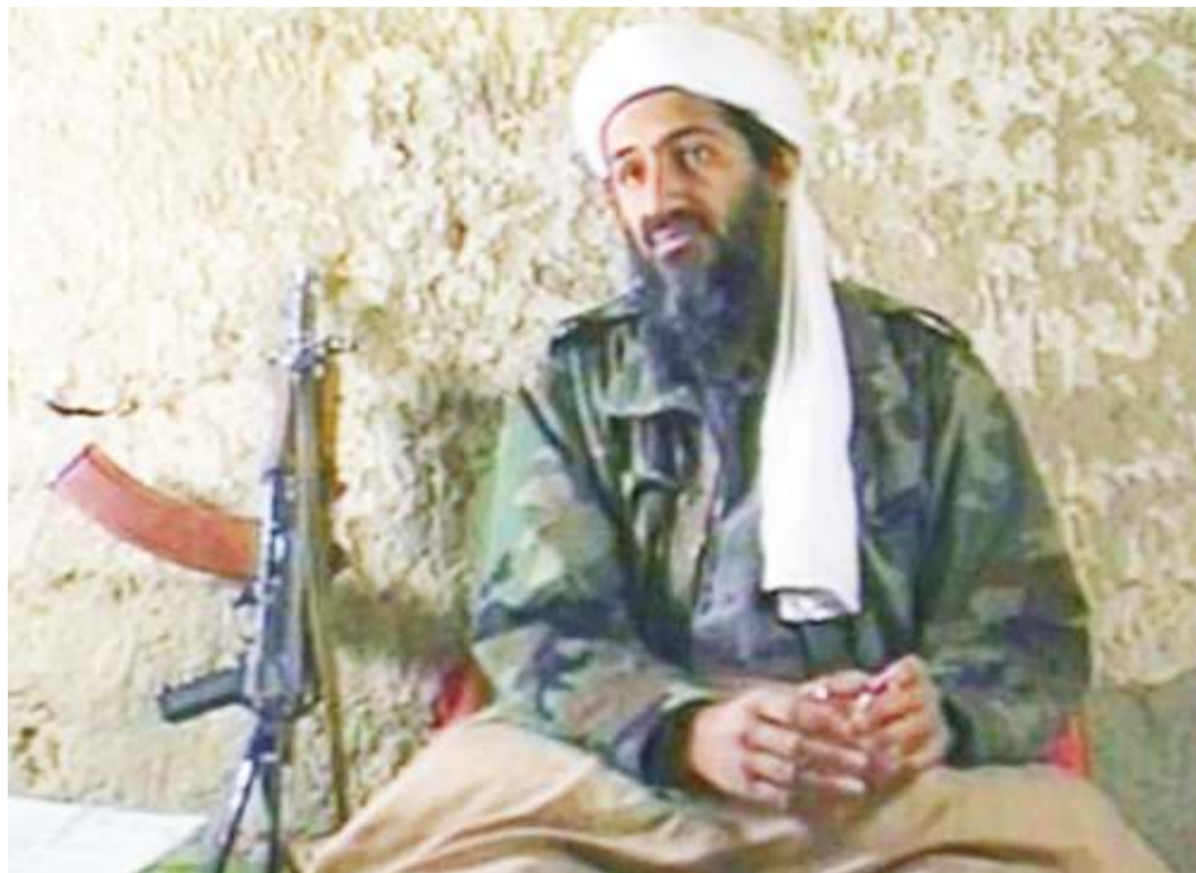
Osama Bin Laden. PICHA: MTANDAO