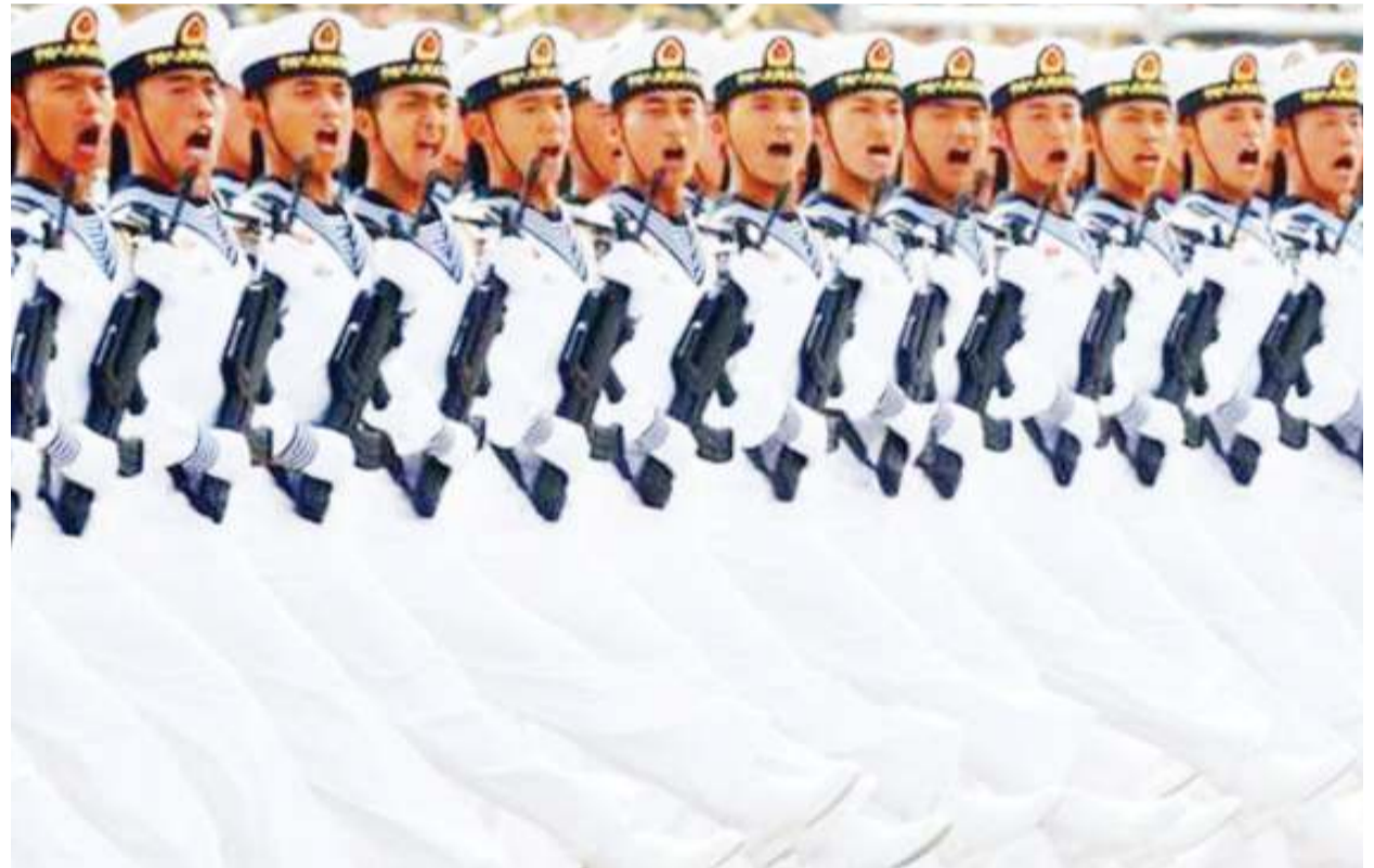
Sehemu ya Kikosi cha Jeshi la China kilichoshiriki gwaride la kijeshi jana.

"Tukisubiri urudi nchini kwako kwa hiari tutakuwa tunategemea hiari yako wewe binafsi, lakini sisi tunaangalia sababu iliyokufanya utoroke nchi yako ilikuwa hoja ya amani na usalama," alisema. BBC