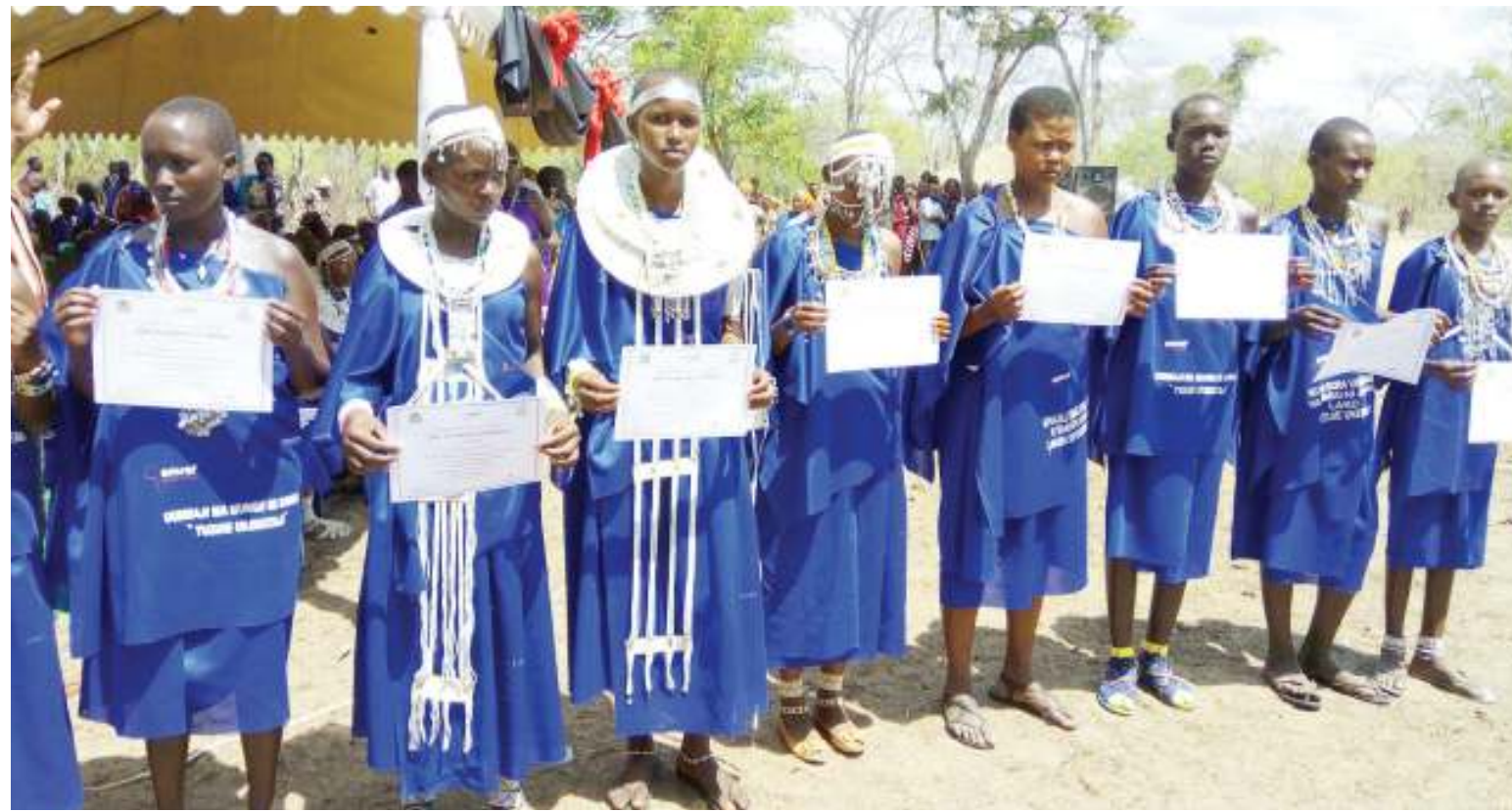
Baadhi ya wasichana walionusurika kukeketwa katika Kata ya Kang'ata, wilayani Handeni.

UN iliweka siku hii kwa kuzingatia kuwa kitendo hicho pamoja na kukiuka haki za binadamu kinakwamisha harakati za maendeleo ya kundi hilo wakati huu ambapo dunia inasaka si