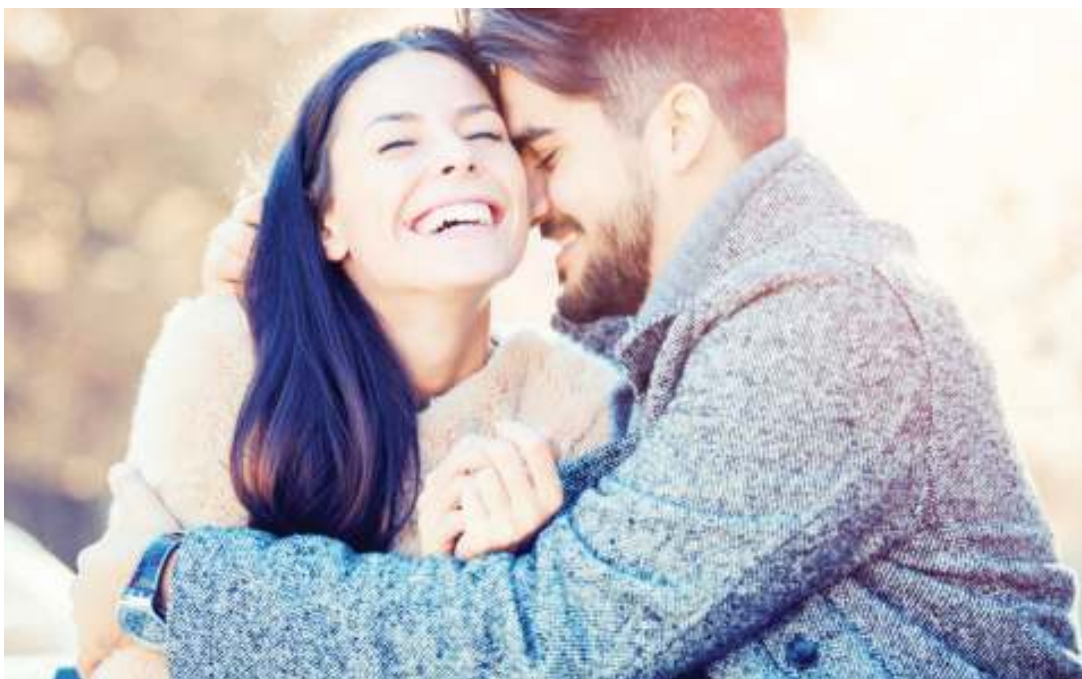
Wapenzi nchini India.

WAPO mwanamume atashindwa kutimiza ahadi ya kumuoa mwanamke, ngono baina ya wapenzi wawili walioelwana inaweza kuchukuliwa kama ubakaji?