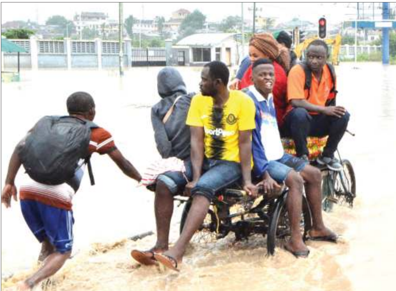
Watumiaji wa barabara ya Morogoro jijini Dar es Salaam, wakivushwa na guta kwa malipo ya Sh. 500 na pikipiki kwa Sh. 1,000 katika eneo la Jangwani jijini Dar es Salaam kufuatia mvua kubwa jana.