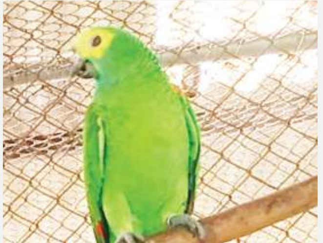
Kasuku ajulikana kwa jina la Freddy Krueger, ambaye si wa kawaida kutokana na matendo yake.

ANAJULIKANA kwa jina la Freddy Krueger na kimsingi si kasuku wa kawaida.