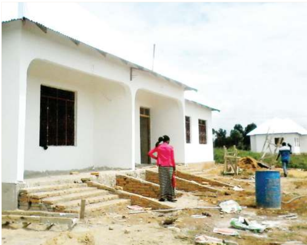
Baadhi ya nyumba za walimu zilizojengwa kwa msaada wa TASAF, Shule ya Sekondari Mlowa.

• Mchango wa TASAF wazisaidia sekondari hizo