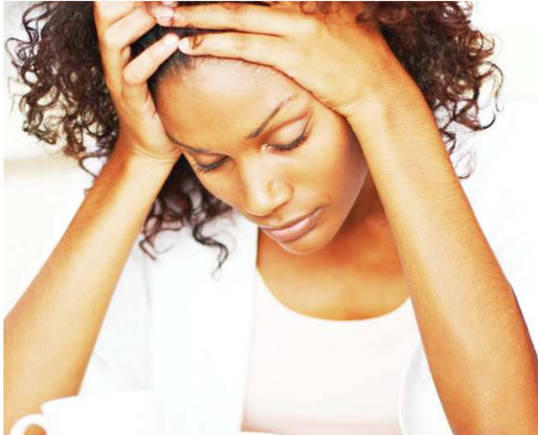
Msongo wa mawazo ni moja ya sababu ya watu kujiua kwa mujibu wa utafiti.

Ni katika mazingira hayo ambako Socrates aliingia katika mzozo na wakuu wa mji wa Athens, zaidi kidogo ya miaka 300 kabla ya Kristo, na wakati mmoja akahukumiwa kifo kwani mafundisho yake yalikuwa yanapingana na maelezo ya makuhani katika mahekalu ya miungu ya Wayunani.