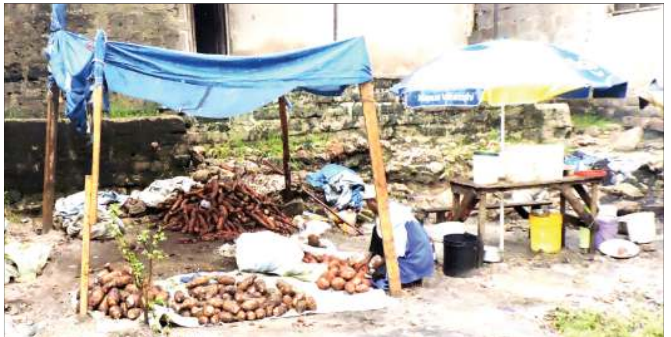
Mchuuzi wa viazi, mihogo na magimbi akipanga bidhaa zake pembezoni mwa barabara eneo la Tandale jijini Dar es Salaam jana. Vyaku-la vya aina hii vimeshamiri katika masoko mengi, kutokana na mfungo wa Mwezi Mtukufu wa Ramadhani.