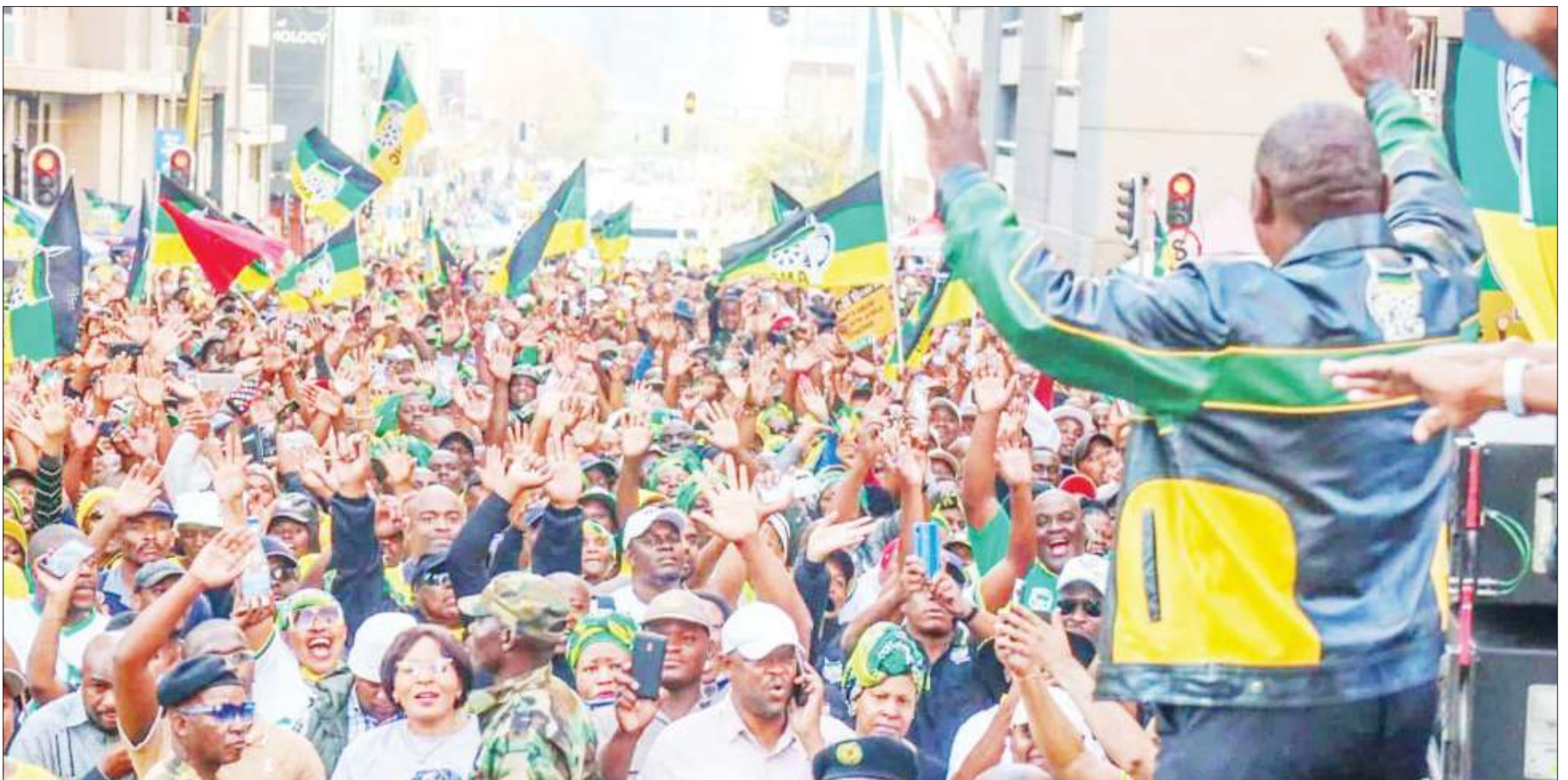
Wanachama wa chama cha ANC Afrika Kusini, wakishangilia ushindi baada ya chama chao kutangazwa mshindi kwa kupata asilimia 57 ya kura zilizopigwa.

Hashtag zinazohusiana na masuala ya kisiasa sio maarufu kuliko masuala mengine ya kijamii, lakini hashtag ya #Kenya@50 ilitajwa kuwa miongoni mwa hashtag maarufu za kisiasa barani Afrika. BBC