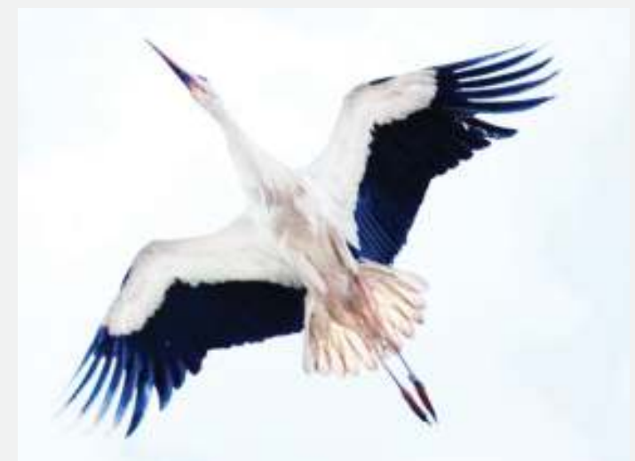
Ndege ni moja ya viumbe waliotumika katika ujasusi.

Popo ni ndege watulivu na wao huendelea na operesh-