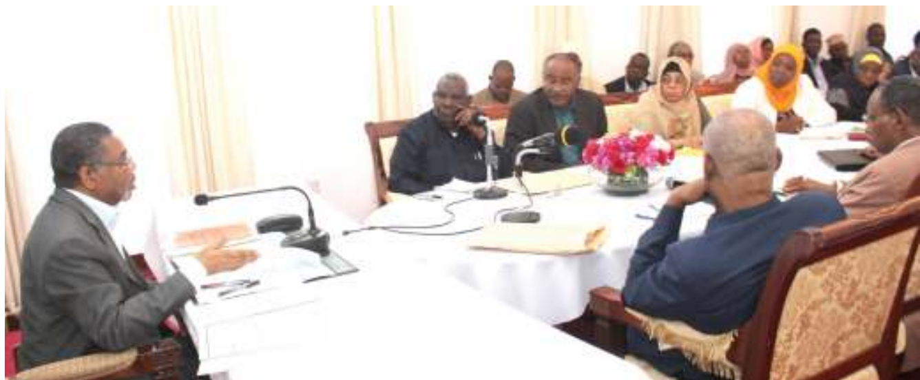
RAIS wa Zanzibar na Mwenyekiti wa Baraza la Mapinduzi, Mhe.Dk. Ali Mohamed Shein, akizungumza na Uongozi wa Wizara ya Afya Zanzibar, wakati wa Mkutano wa Utekelezaji wa Mpango Kazi wa Wizara ya Afya Zanzibar kwa Kipindi cha Julai 2018 -Marchi 2019.