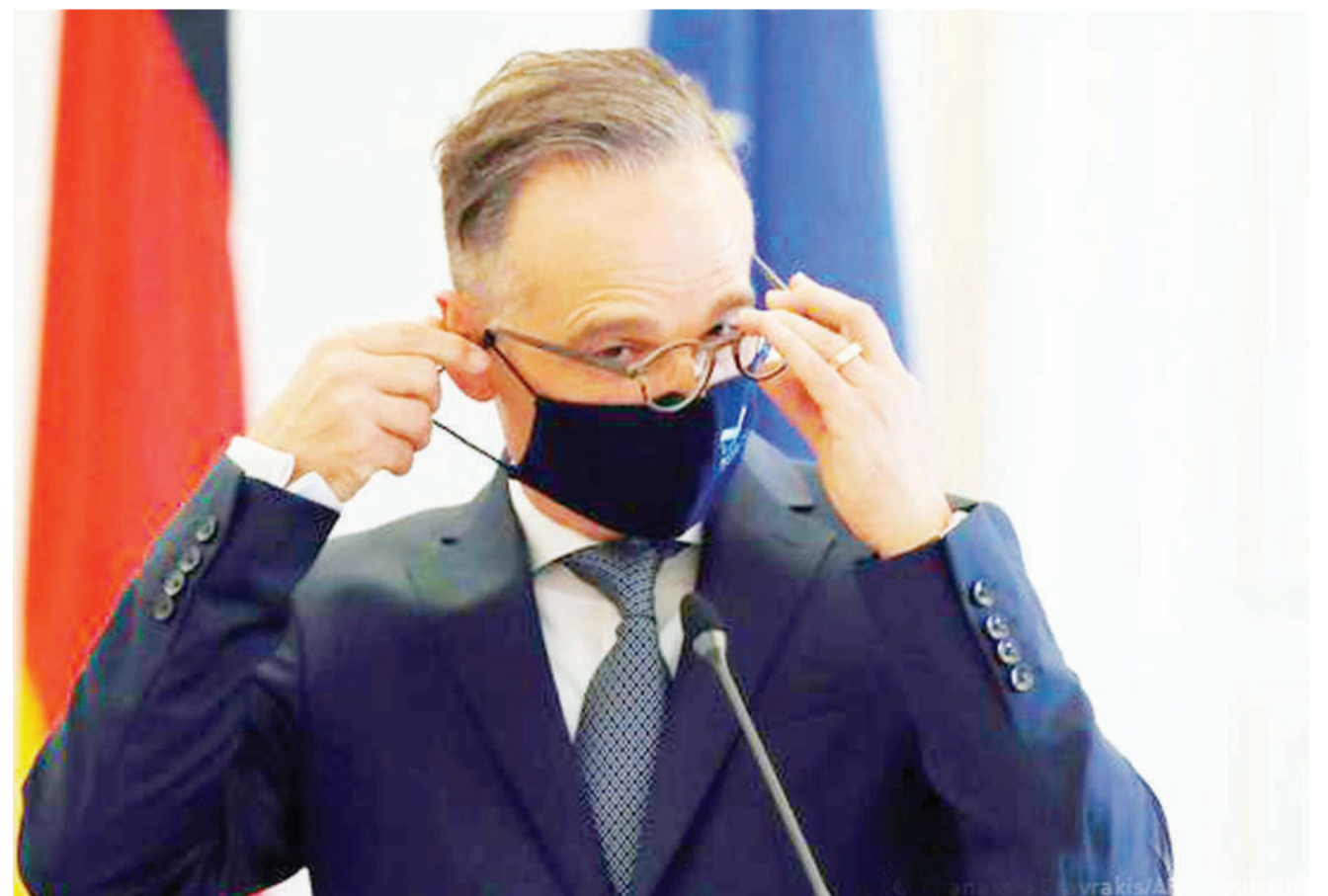
Waziri wa Mambo ya Nje wa Ujerumani, Heiko Maas (54), akivaa barakoa kujikinga na virusi vya corona. Maas amejiweka karantini baada ya mmoja wa walenzi wake kupata maambukizi.

Rais alisema atamteua jaji wa kike kuongoza mahakama hiyo Jumamosi ambaye atachukua nafasi ya Jaji Ginsburg, aliyefariki Ijumaa iliyopita. BBC