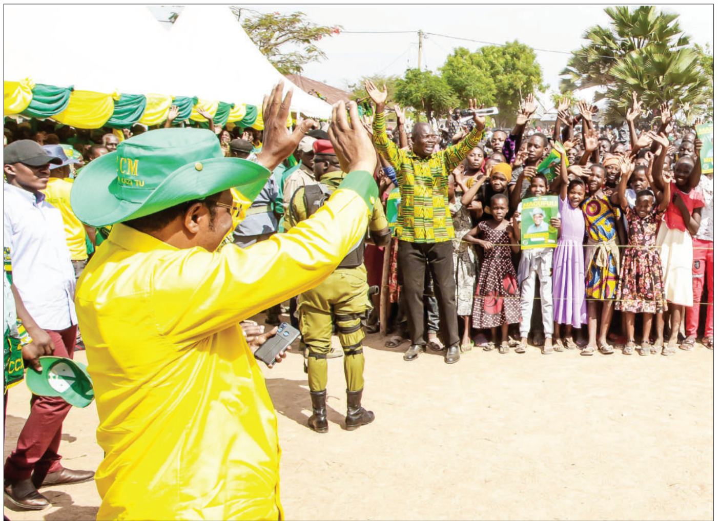
Mjumbe wa Kamati Kuu na Waziri Mkuu, Kassim Majaliwa, akiwasalimbia wananchi wa Kata ya Misungwi, wilayani Misungwi, mkoani Mwanza, katika mkutano wa kampeni za uchaguzi mkuu jana.