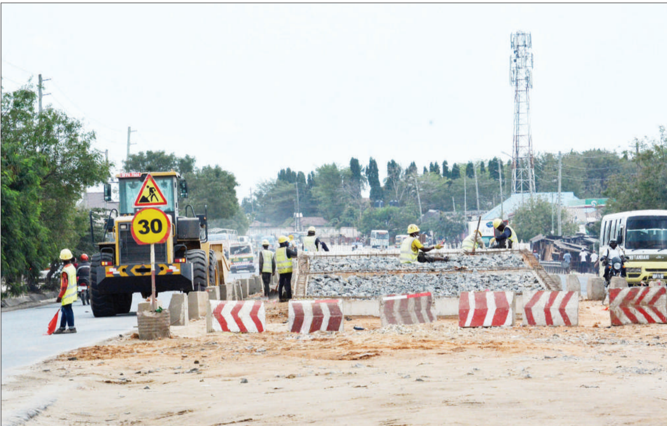
Mafundi wakijenga kituo cha mabasi ya mwendokasi katika mradi unaoendelea wa ujenzi wa miundombinu ya mabasi hayo katika barabara ya Kilwa eneo la Mbagala Zakhem, jijini Dar es Salaam jana.