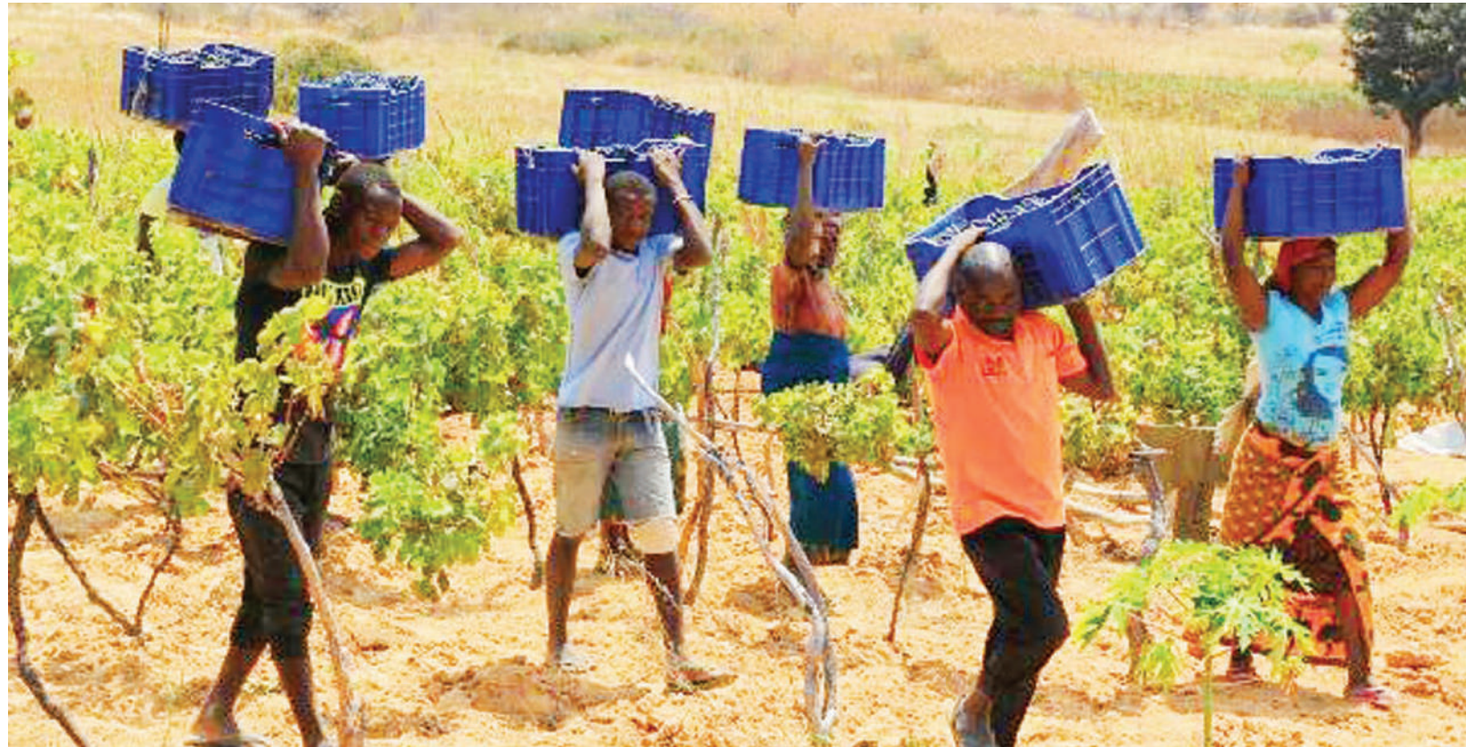
Baadhi ya wakulima wa zabibu, kijijini Matumbulu, wakiwa wamebeba kreti za zao hilo baada ya kuvuna.

Dk. Massawe anasema uchakataji huo umekuwa na faida,