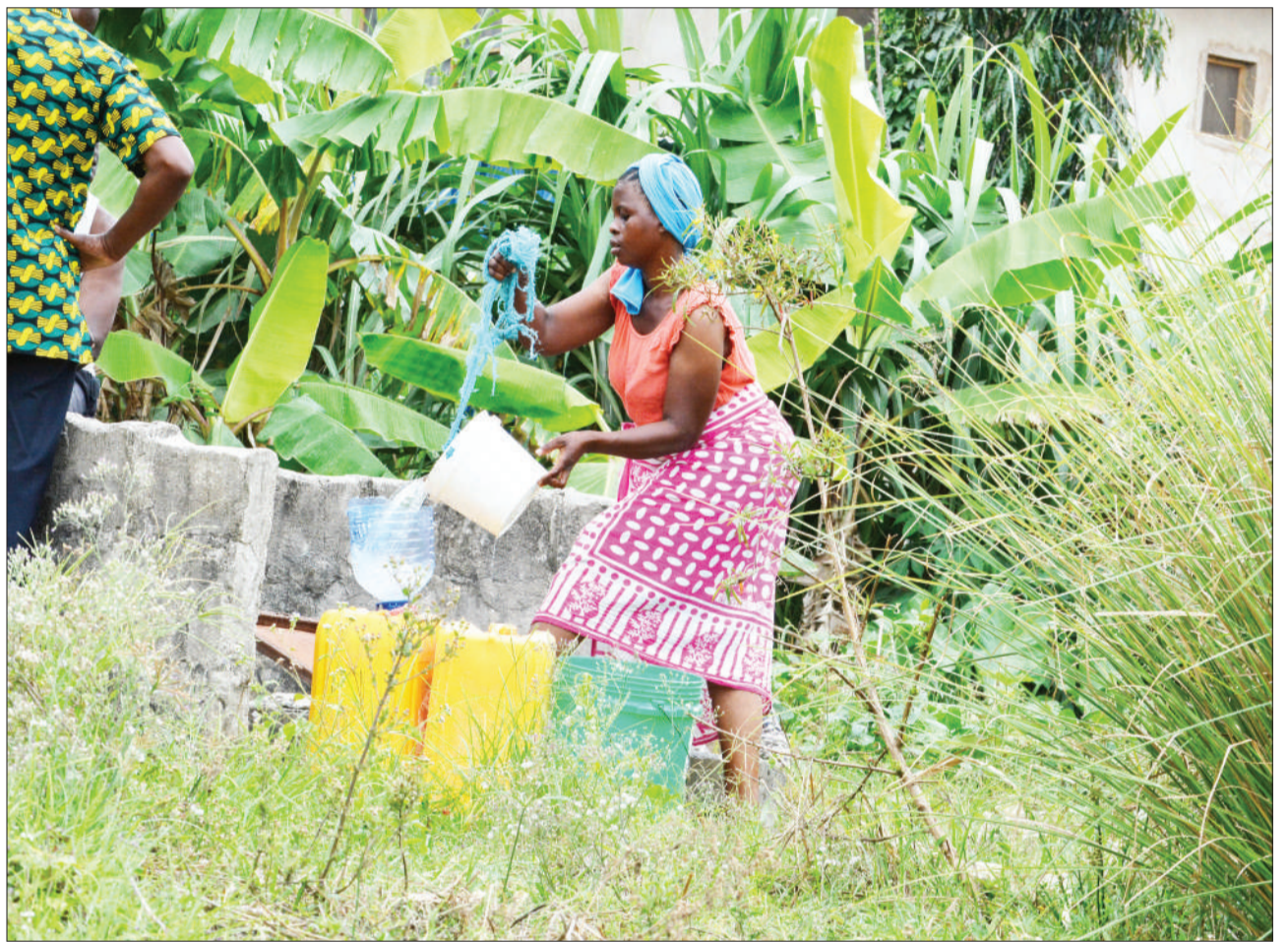
Mkazi wa Kata ya Kwembe Mpakani Manispaa ya Ubungo, jijini Dar es Salaam, akichota maji kwenye kisima jana, ambapo ndoo moja ya maji huuzwa kwa 200/-

Alisema mkutano wa Arusha umelenga pia kuwakumbusha vijana kuwa wana nafasi ya kuleta mabadiliko.