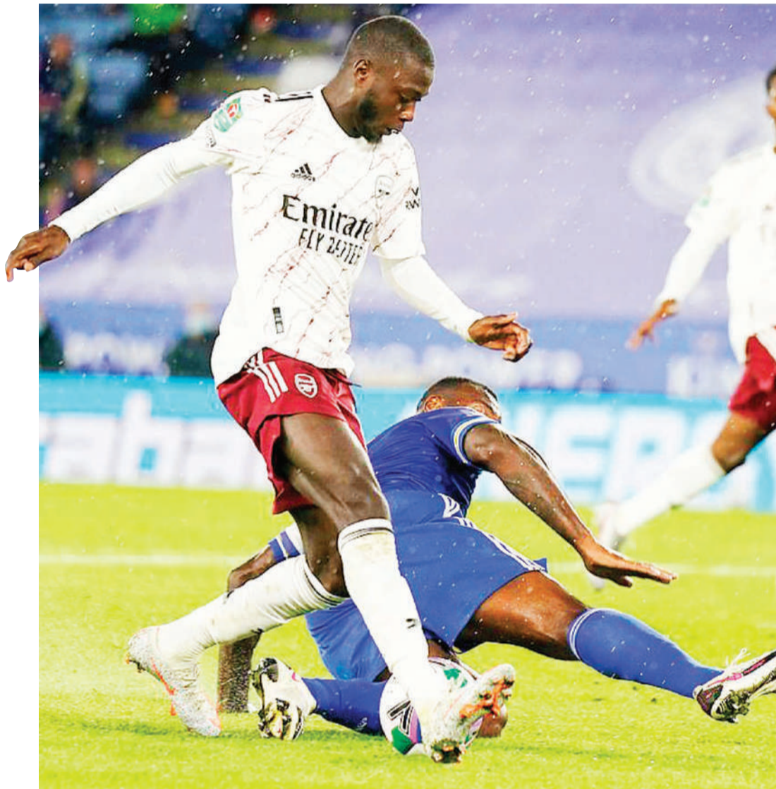
Mshambuliaji wa Arsenal, Nicolas Pepe (kushoto), akijaribu kumtoka beki wa Leicester City, Wes Morgan (aliyeanguka), katika mechi ya Kombe la Ligi iliyochezwa kwenye Uwanja wa King Power juzi usiku. Arsenal ilishinda mabao 2-0.