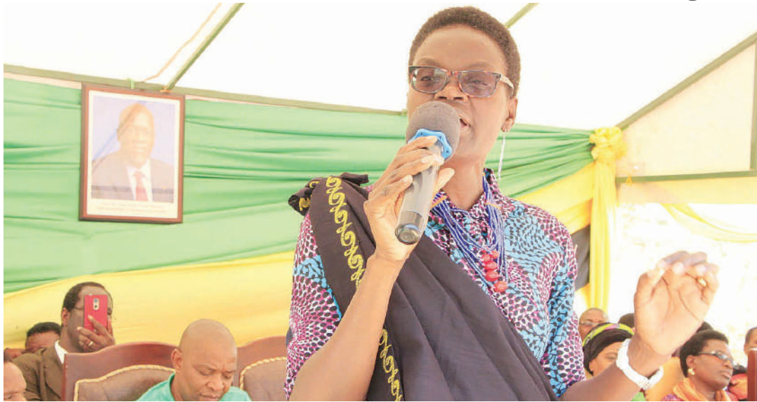
Naibu Spika Dk. Tulia Ackson.