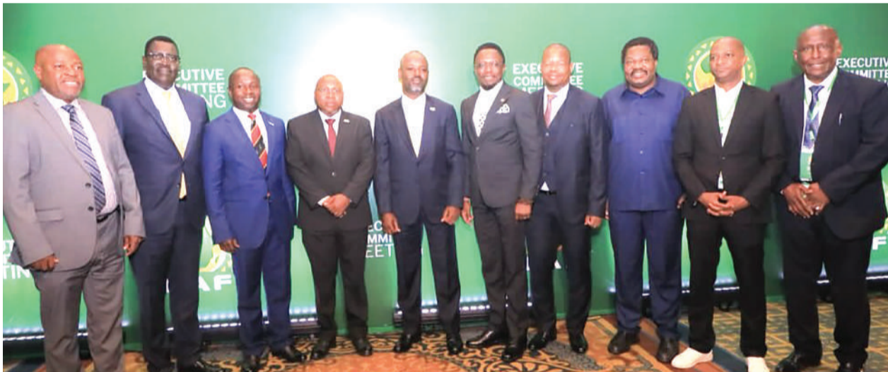
Viongozi wa serikali na vyama vya michezo wa Tanzania, Kenya na Uganda wakiwa katika picha ya pamoja Cairo, Misri wakati wakisubiri kutangazwa kwa mwenyeji wa fainali za AFCON 2027.

walipocheza nao mechi ya kwanza bado anaendelea kuwafuatilia kwa kutizama mchezo wao wa Ligi Kuu ya Misri, ambao Future ilipata ushindi wa mabao 2-1 dhidi ya El Dakhleg. "Tumefika salama Misri na tunaendelea na maandalizi dhidi ya Future FC, tumeongea na wachezaji wetu na kuwaeleza tuna kazi kubwa ya kupata matokeo chanya kwenye mechi ya marudiano. Tunaanza upya kusaka matokeo, safu ya ushambuliaji iko imara na kufanyia kazi madhaifu yaliyojitokeza mechi zilizopita," alisema kocha huyo.