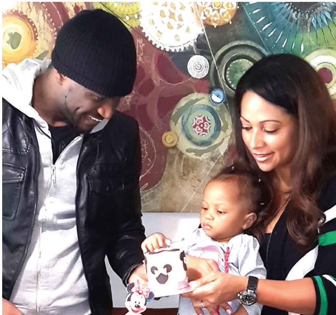
Walivyo wanafamilia kwenye mkusanyiko wao.

“Novemba saba hadi 10 mwaka 2023, TGNP tunatarajia kufanya Tamasha la 15 la Kijinsia Dar es Salaam, linalotarajiwa kuhudhuriwa na watu zaidi ya 1500, watakatoka nchi mbalimbali wa hapa nchini na kutoka nje ya nchi, hapo watarajia kujadili mambo kadhaa,