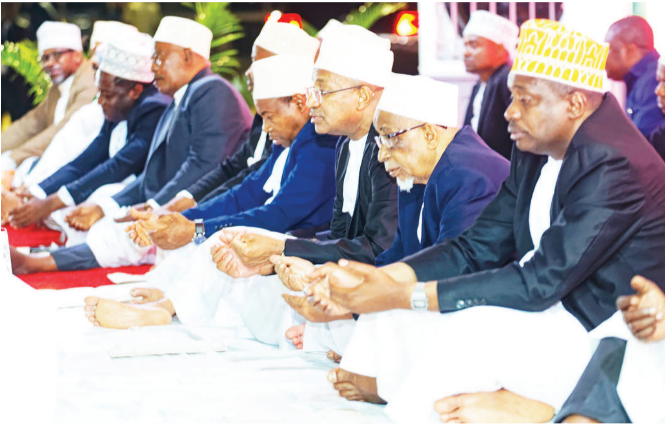
Rais wa Zanzibar, Alhaj Dk. Hussein Ali Mwinyi akijumuika na waumini wa Dini ya Kiislamu kuadhimisha Maulid ya Mfungo sita 1445 Hijria sawa na 2023 Miladia, sherehe tukufu ya kuzaliwa na kumuenzi Mtume Muhammad S.A.W katika uwanja wa Maisara, Mkoa wa Mjini Magharibi juzi.

Aidha, alisema katika maadhimisho hayo kutakuwa na maonyesho ya wazee ambapo wataonesha bidhaa na kazi mbalimbali wanazofanya.