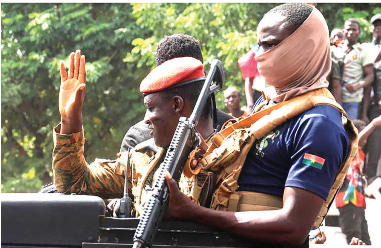
Kiongozi wa utawala wa kijeshi nchini Burkina Faso Ibrahim Traore akiwapungia wananchi waliojitokeza barabarani.