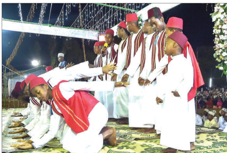
Wanafunzi wa Jumuiya ya Maulidi ya Homu kutoka Mtaa wa Mtendeni, Wilaya ya Mjini Unguja, wakisoma Maulid ya Homu katika maadhimisho ya kuzaliwa kwa Mtume Muhammad (S.A.W) katika viwanja vya Maisara Suleiman.