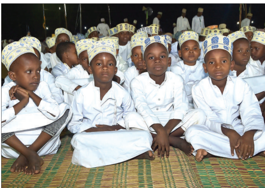
Wanafunzi wa Madrassatul Sufaiya kutoka Mwanakwerekwe, Wilaya ya Mjini Unguja wakijumuika katika Maadhimisho ya Maulid ya kuzaliwa kwa Mtume Muhammad (S.A.W) katika viwanja vya Maisara Suleiman juzu usiku.