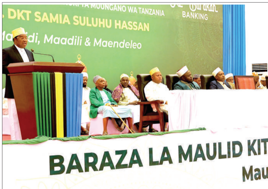
Waziri Mkuu, Kassim Majaliwa akizungumza alipomwakilisha Rais Samia Suluhu Hassan katika Baraza la Maulid Kitaiifa kwenye Kituo cha Mikutano cha Jakaya Kikwete, jijini Dodoma jana.