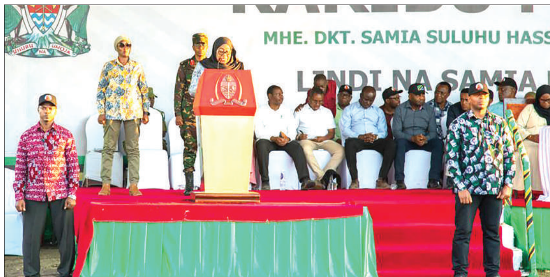
Rais akizungumza wiki iliyopita, alipokuwa ziarani mkoa wa Lindi.

amelitolea ufafanuzi ziarani kwamba, hilo limefanyika kuwainua kiuchumi jamii hiyo na kasi ya uzalishaji wa mazao hayo ya kibiashara, ili inapofika hatua ya kundolewa ruzuku hiyo miaka michache ijayo, iwe katika sura ya ushindi kimaendeleo kwa ujumla na pato la taifa.