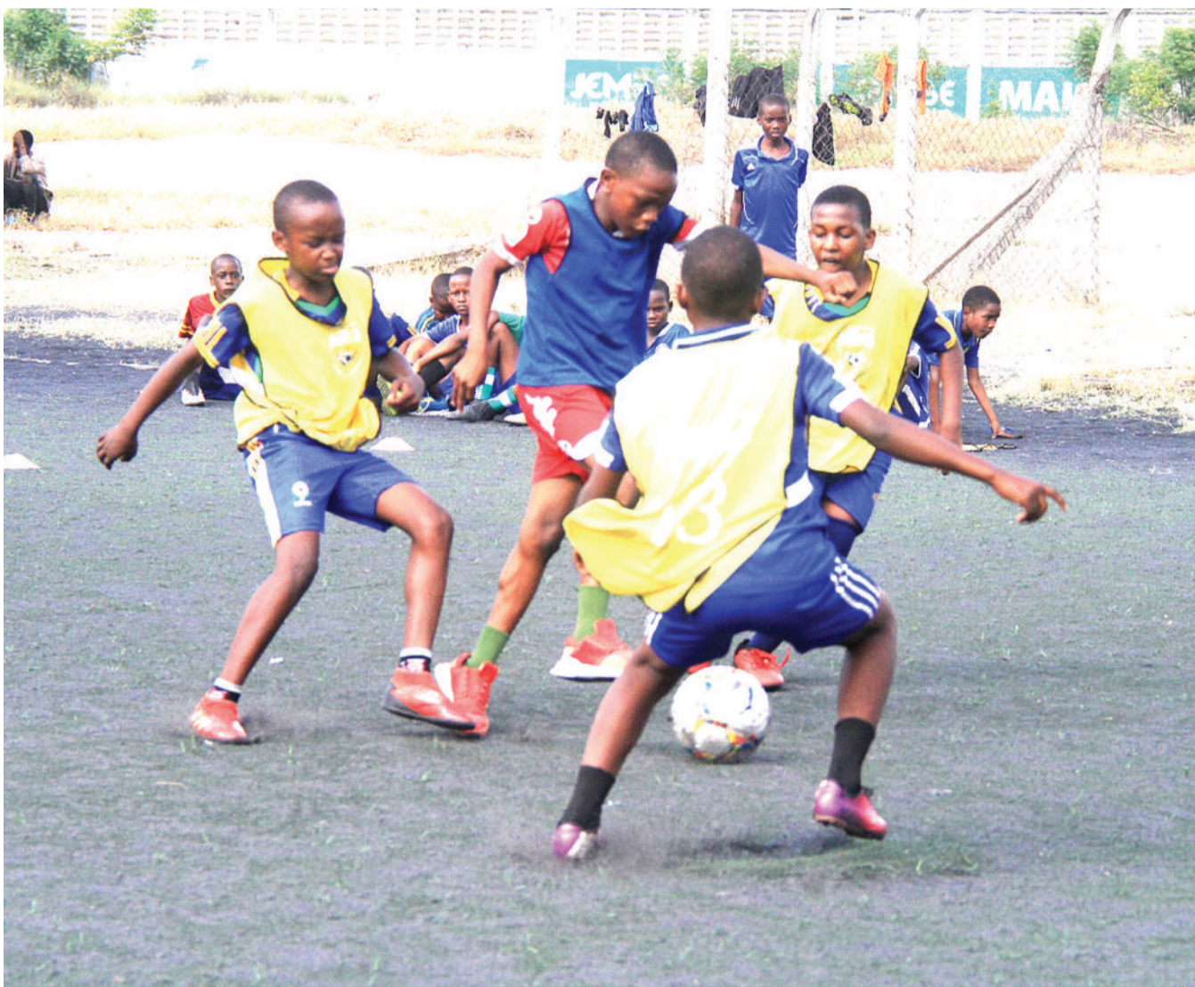
Wachezaji vijana wanaolelewa katika Kituo cha Shirikisho la Soka Tanzania (TFF), wakicheza mpira kwenye Uwanja wa Karume jijini, Dar es Salaam juzi.

Twiga Stars imecheza fainali za WAFCON wakati huo zikiitwa AWC mara moja, ikiwa ni mwaka 2010, fainali hizo zikichezwa Afrika Kusini na ilikuwa chini ya Boniface Mkwasa ‘Master’.