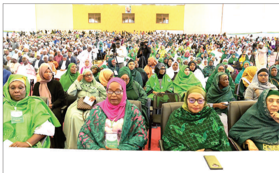
Baadhi ya waumini wa dini ya kiislamu wakimsikiliza Waziri Mkuu, Kassim Majaliwa alipozungumza katika Baraza la Maulid jijini Dodoma jana.