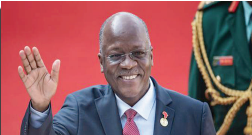
HAYATI DKT. JOHN POMBE JOSEPH MAGUFULI 1959 – 2021

Mtandao wa Wanawake Katiba, Uchaguzi na Uongozi, wenye zaidi ya Mashirika 200 ya utetezi wa Wanawake, Wasichana na Watoto, unaoratibiwa na Women Fund Tanzania Trust, unaungana na watanzania wenzetu, kutoa pole nyingi kwako Mheshimiwa Raisi, Samia Suluhu Hassan, viongozi wa Serikali, familia na watanzania wote kwa kuondokewa na aliyekuwa Raisi wa Jamhuri ya Muungano wa Tanzania, Mheshimiwa Dkt. John Joseph Pombe Magufuli Raisi wa Awamu ya Tano (5).