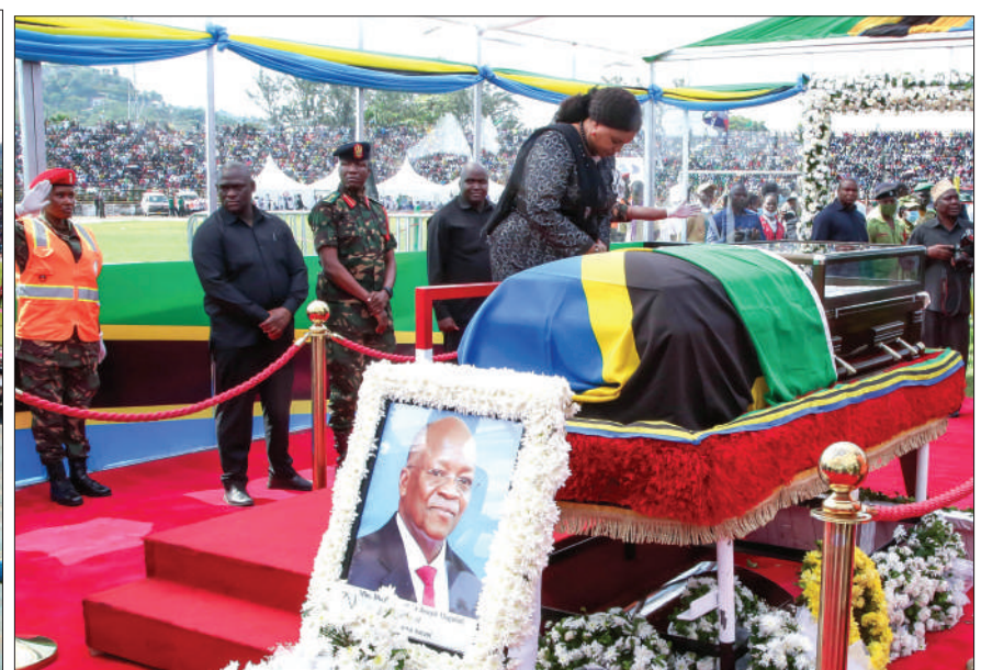
Waziri wa Nchi, Ofisi ya Waziri Mkuu Sera, Bunge, Kazi, Vijana, Ajira na Wenyewe Ulemavu, Jenista Mhagama, akitoa heshima za mwisho kwa mwili wa Dk. Magufuli.