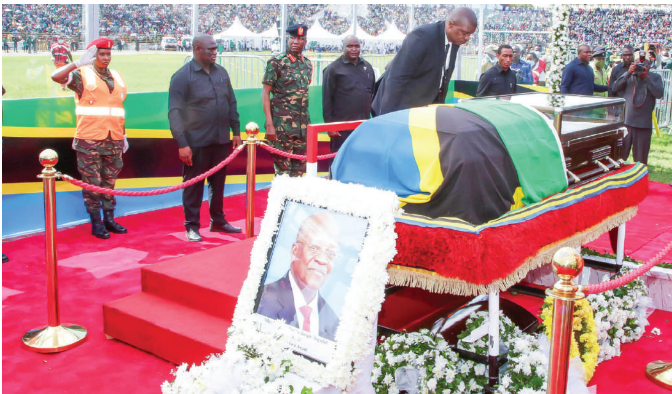
Makamu wa Pili wa Rais wa Zanzibar, Hemed Suleiman Abdulla, akitoa heshima za mwisho kwenye jeneza lenye mwili wa aliyekuwa Rais Dk. John Magufuli, katika Uwanja wa CCM Kirumba, jijini Mwanza jana.

Dk. Slaa aliwataka Watanzania kuchangamkia fursa mbalimbali wanazozitengeneza mabalizi vinginevyo wataendela kuzisikia kama historia.