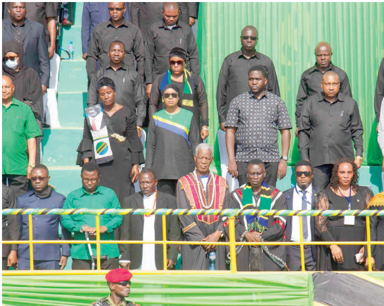
Viongozi mbalimbali wakiwa jukwaani kwenye Uwanja wa CCM Kirumba jijini Mwanza jana wakati wa kuaga mwili wa aliyekuwa Rais wa Tanzania, Dk. John Magufuli kabla ya kusafirishwa kwenda Chato mkoani Geita kwa maziko yatakayofanyika kesho.

chake na katika kura za awali ndani ya chama mwaka 2016 akishindana na aliyewahi kuwa Seneta wa Jimbo la Vermont tangu mwaka 2007, Bernie Sanders.