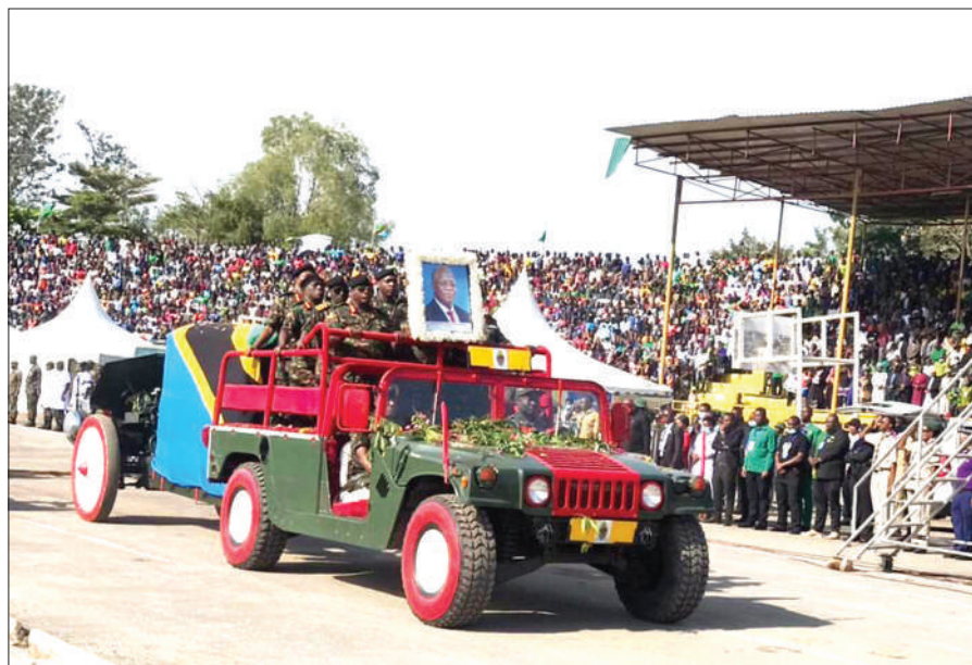
Gari maalum lililobeba mwili wa Hayati Dk. John Magufuli likiingia katika Uwanja wa CCM Kirumba, jijini Mwanza jana, kwa ajili ya kuagwa.