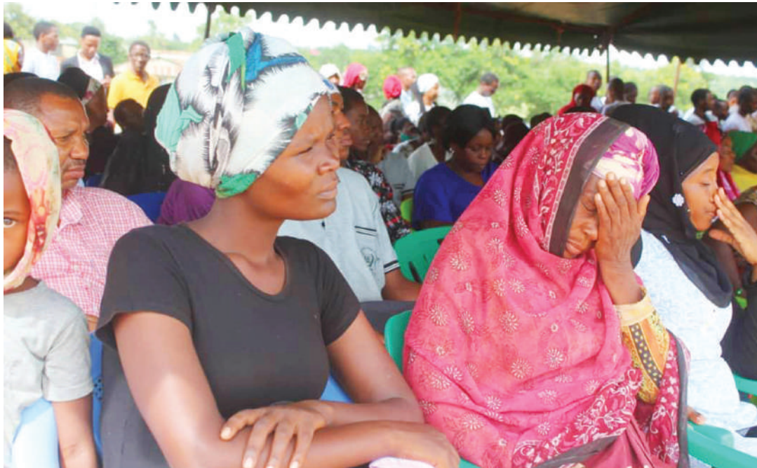
Sehemu ya umati uliokusanyika kumwombea.

Anasema, wema kiimani kwa Mungu, umedhihirika kwa ishara nyingi, ikiwamo kufanikisha mchakato wa kukabidhi madara-