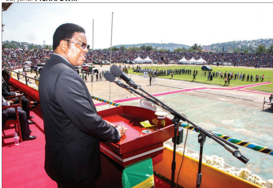
Waziri Mkuu, Kassim Majaliwa akizungumza na wananchi wa Mwanza wakati wa tukio la kuaga mwili wa Hayati Dk. Magufuli.