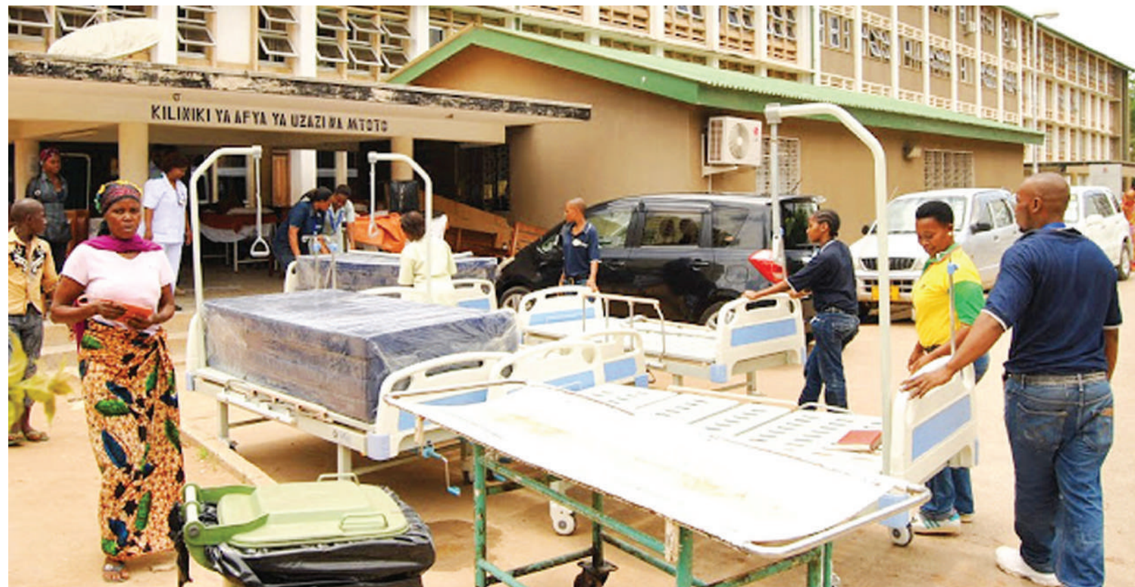
Vitanda na mahitaji mengine yakihamishiwa wadini, baada ya ofisi kuondolewa kwa agizo la Rais Dk. John Magfuli.

• Kila alichogiza ziara ya ghafla 2015 zimetetelezwa • Miaka minne; dawa zapatikana 96% kutoka 40% • Upasuaji kihistoria, ubia rasmi na Mloganzila • Wazunguka kugawa ujuzi hospitali zote za mikoa