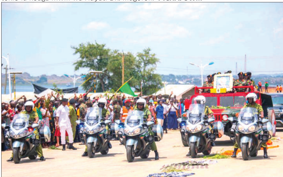
Wananchi wakiwa wametandika kanga chini ili gari lililobeba mwili wa Dk. Magufuli lipite, baada ya kutoka kwenye kivuko cha MV Mwanza, eneo la Busisi wilayani Sengerema jana.