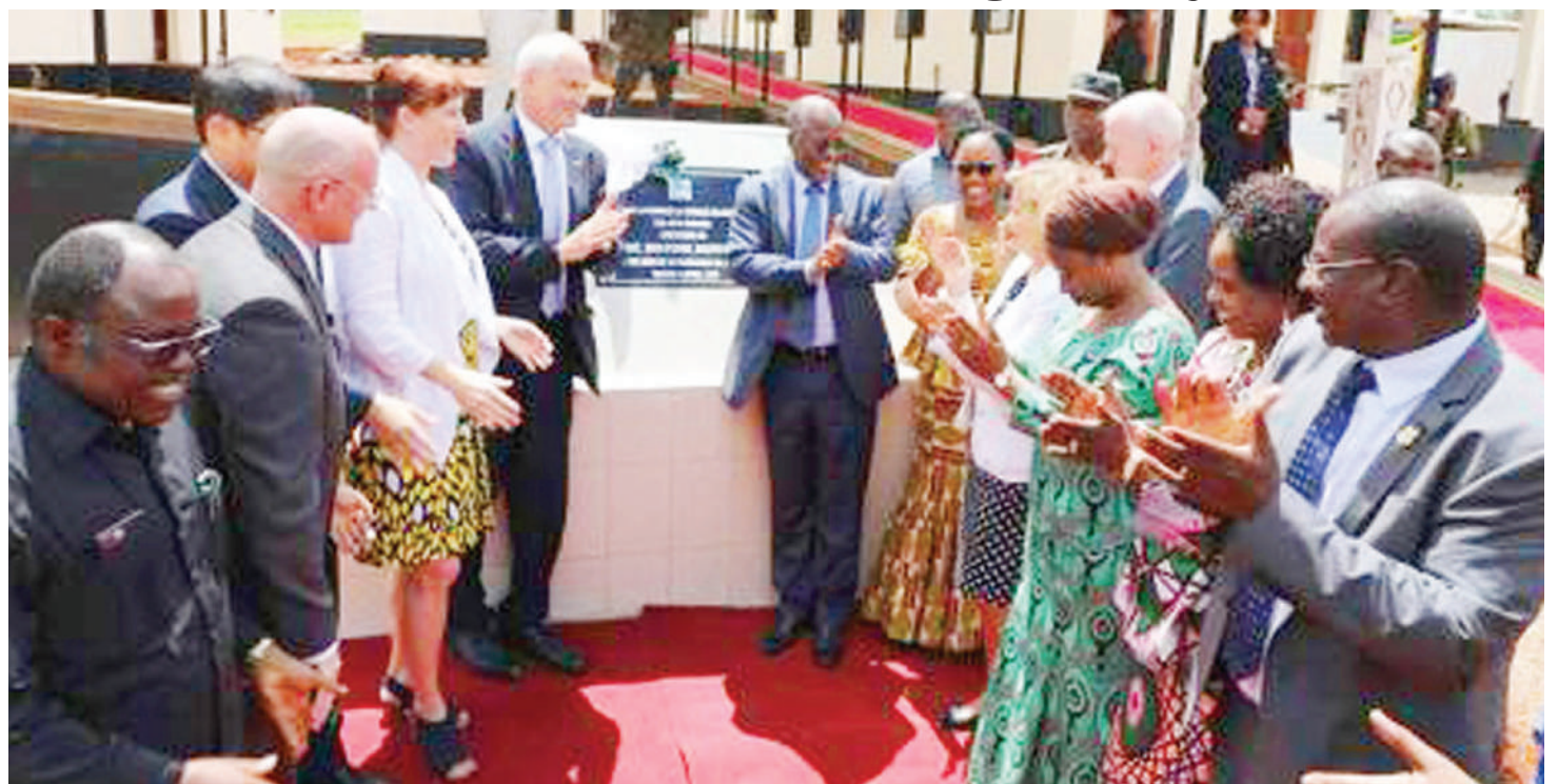
Siku Rais Dk. John Magufuli, alipozindua Kituo cha Afya Madaba, mkoani Ruvuma.

za ustawi wa jamii ikiwamo elimu na afya ikijumuisha MAM, alihamishia ofisini kwake, kutoka Ofisi ya Waziri Mkuu.