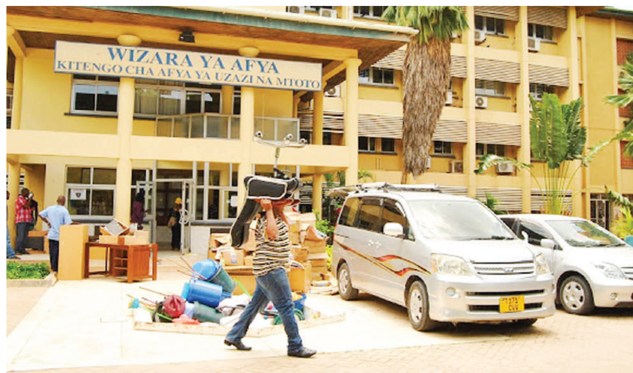
Kazi ya kuhamisha vifaa vya kiofisi kutoka sehemu ya wodi katika Hospitali ya Taifa Muhimbili (MNH).

“ongezeko la vyumba hivyo, imesaidia kupungua msongamano katika upasuaji, hata kurahisisha utoaji huduma kwa watoto kutoka mara nne hadi mara 10 kwa wiki.”