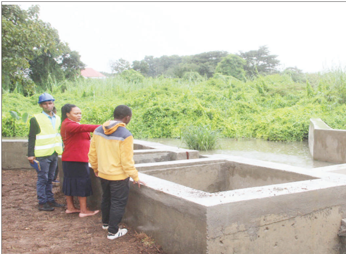
Baadhi ya maofisa wa Mamlaka ya Majisafi na Usafi wa Mazingira Mbeya (Mbeya-WSSA), wakikagua chanzo cha maji cha Nzovwe juzi, ambacho ni miongoni mwa vyanzo 16 vya maji vinavyohudumia Jiji la Mbeya na Mji Mdogo wa Mbalizi.

Alisema wana imani kubwa kwa Rais Samia kuendeleza mambo yote ambayo yalikuwa ni ndoto ya mtangulizi wake katika kuhakikisha anajenga uchumi imara ikiwamo upatikanaji wa mikopo kwa makundi hayo.