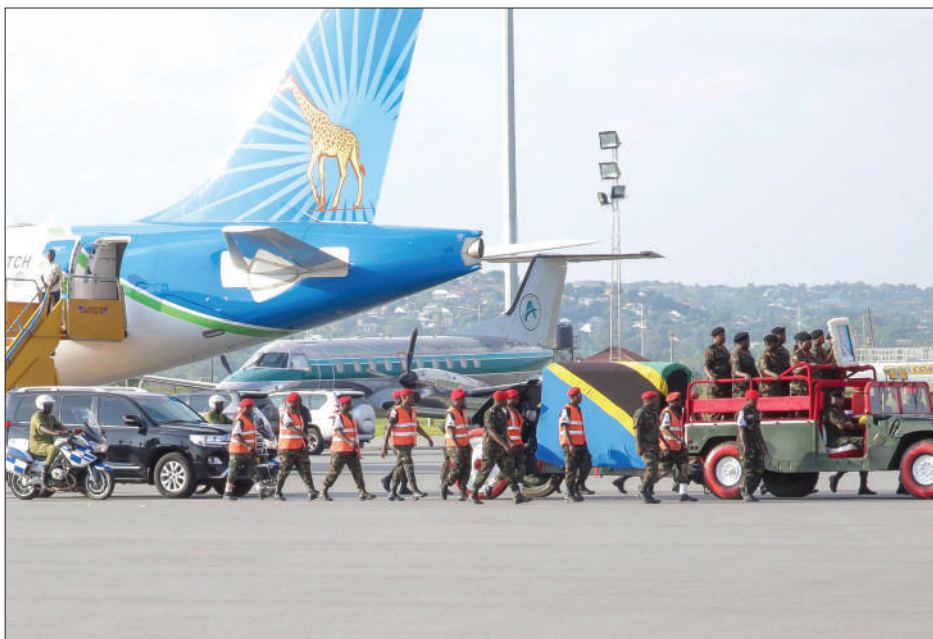
Mwili wa Hayati Dk. John Magufuli, ukiwasili kwenye Uwanja wa Ndege wa Mwanza, jana.