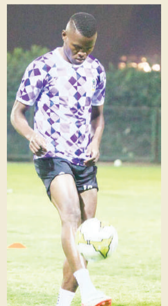
anayecheza soka la kulipwa huko Australia.