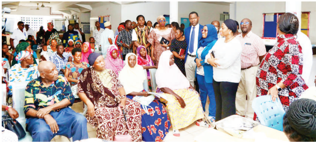
Waziri wa Afya, ummy Mwalimu, alipozuru Kituo cha Afya Chanika, nje kidogo ya Jiji la Dar es Salaam, siku chache zilizopita.

• Akumbusha kliniki presha, kisukari kitaifa