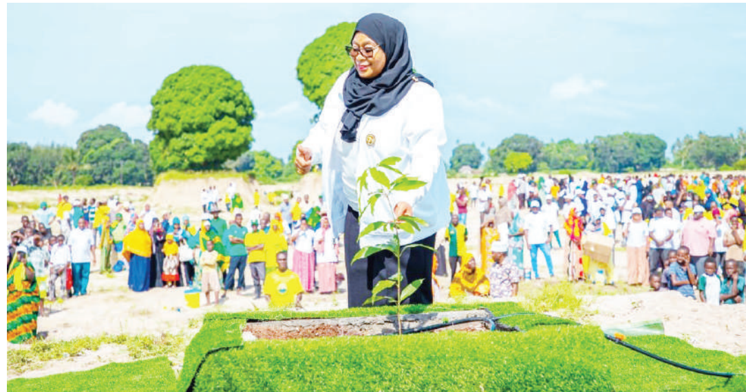
Rais Dk. Samia Suluhu Hassan, akiadhimisha siku yake ya kuzaliwa mwaka huu, huko Muwanda Donge, Zanzibar, ambako akashiriki kupanda miti na wananchi wa eneo hilo kutunza mazingira.

"Mkapiame, maeneo hayo na myaweke katika mashamba