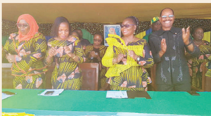
Mwenyekiti wa Umoja wa Wanawake Tanzania (UWT), alipokuwa katika Maadhimisho ya Siku ya Wanawake Tanzania, mkoani Songwe.

Pia, anatoa rai kwa wazazi na walezi kuacha kuwalaza chumba kimoja watoto wa kiume na kike na hata ndugu wa jinsia furani wanapokuja kusalimia nyumbani wasiwalaze pamoja na watoto wa jinsia tofauti ili kukwepa