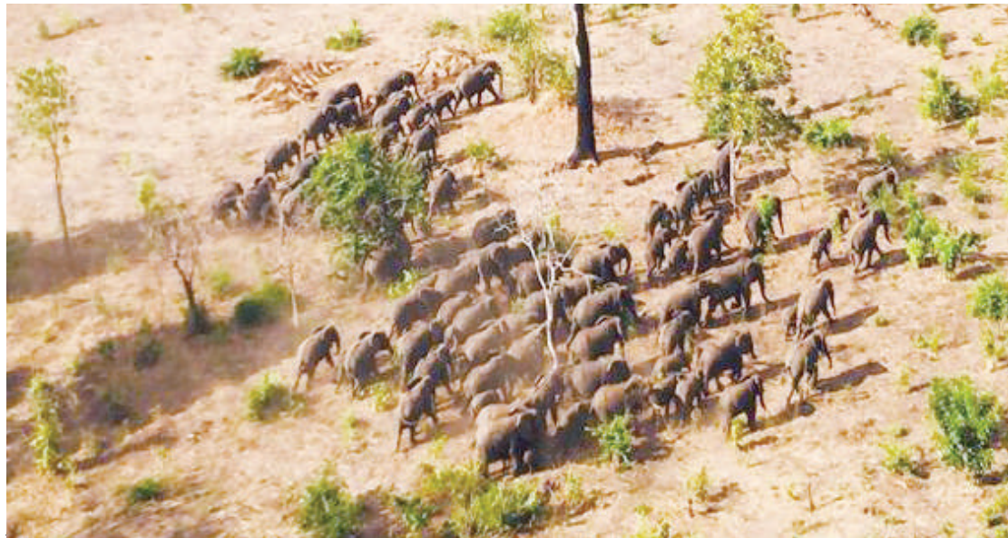
Sehemu ya tembo waliovamia kijijini Nditi, Nachingwea.