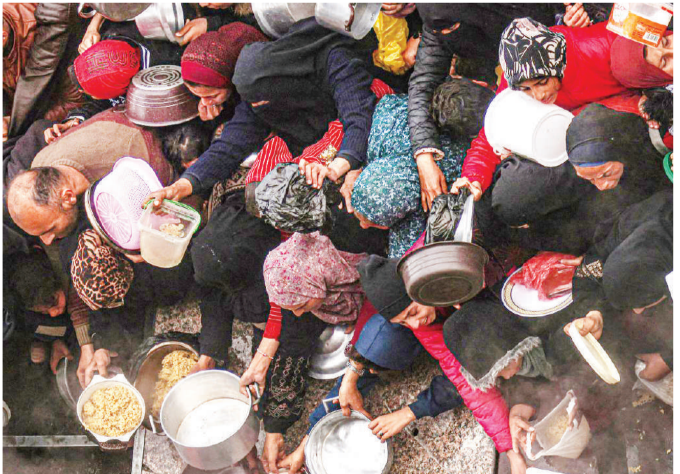
Baadhi ya Wapalestina wakipata msaada wa chakula kutoka kwa mashirika ya kibinadamu wanaotoa huduma eneo la Ukanda wa Gaza juji.

Wakati huo huo, ndege zisizo na rubani za Ukraine zimelishambulia jengo la idara ya usalama ya Russia (FSB) katika mji wa mpakani wa Belgorod. DW