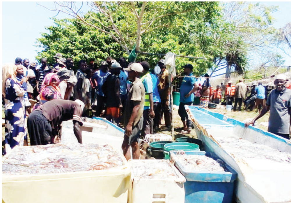
Wavuvi wa pweza kutoka vijiji sita vya kata ya Boma, wilayani Mkinga mkoani Tanga, wakiwaandaa kwa ajili ya kuwapima ili kuwauza, wakati wa kufungua mwamba wa makazi ya samaki hao jana, ambao ulifungwa kwa siku 90 ili wazaliane ambapo kilogramu 2,284 zilivuliwa. Zoezi la ufungaji wa miamba bahari kwa ajili ya kuongeza uzalishaji wa pweza linasimamiwa na Shirika la Mwambao Coastal Community Network Tanzania chini ya mradi wa NORAD.