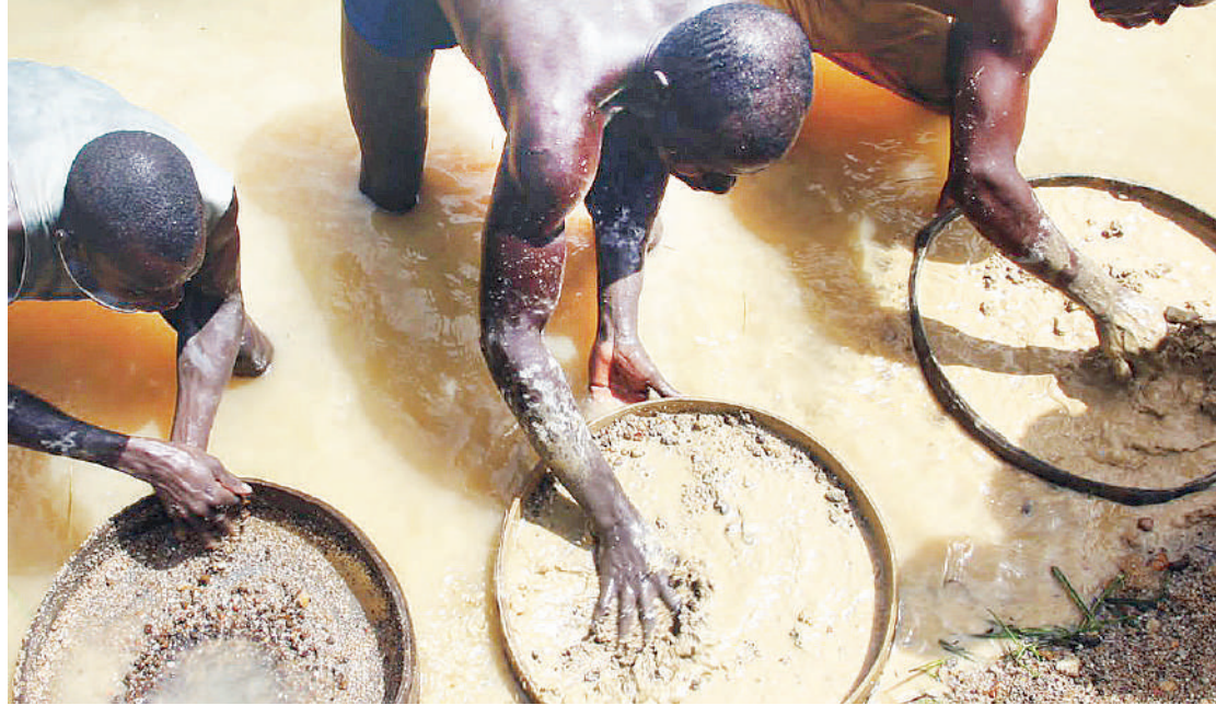
Wachenjuaji madini wakiwa kazini.

“Wachimbaji wadogo wengi wanatumia zebaki kama njia rahisi kwao ya uchenjuaji. Sasa sisi wajibu wetu kwenye mradi huu,