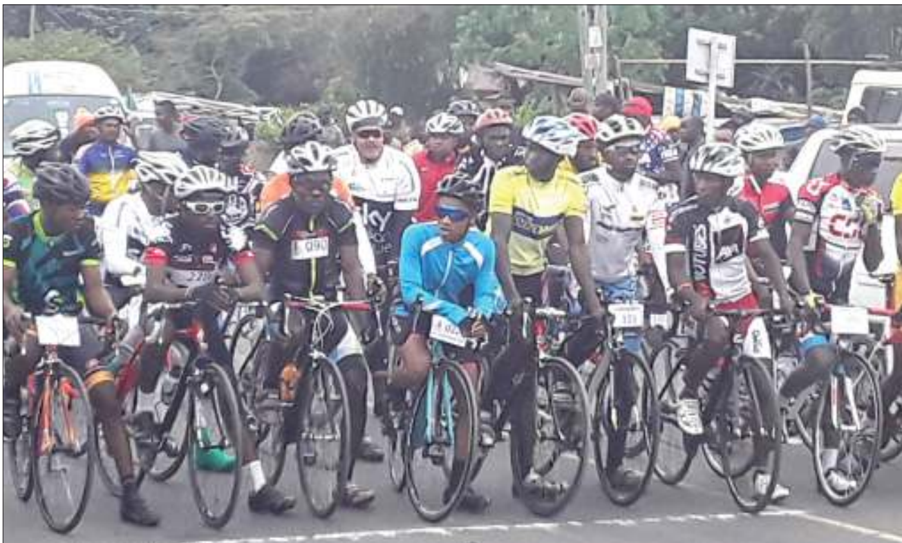
Washiriki wa mbio za baiskeli mkoani Arusha wakijiandaa kuanza mbio hizo, zilizofanyika Jumamosi mkoani humo.

Mchezaji huyo aliyeifungia Zesco bao la kusawazisha katika dakika za majeruhi, aliwahi kuitumikia Yanga kabla ya kuachwa na kutimkia Zambia kujiunga na 'Mafundi wa Umeme' hao.