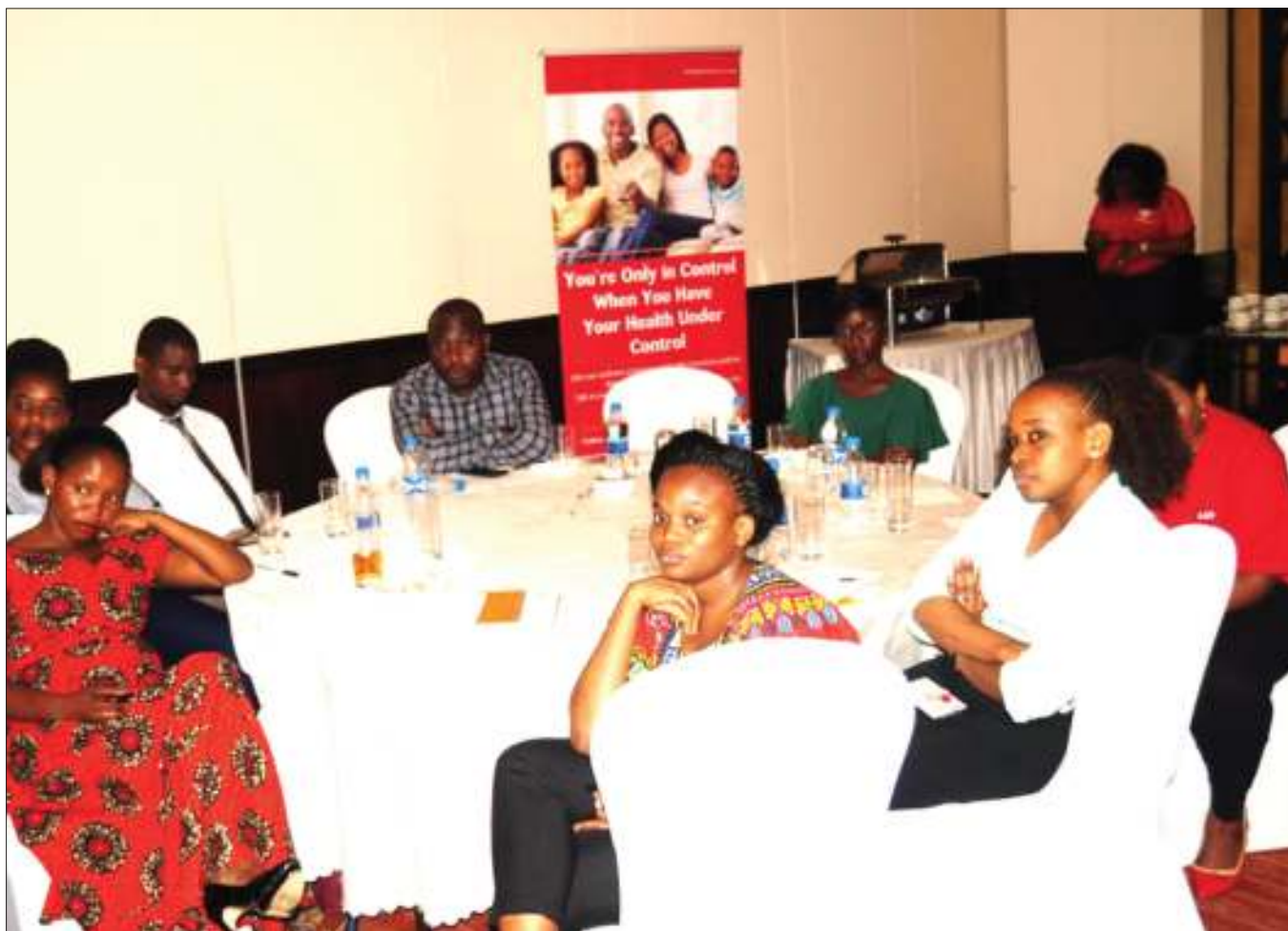
Mawakala wa bima wa Kampuni ya Bima ya AAR Brokers wakiwa katika mashauriano kuhusu ustawi jijini Dar es Salaam mwishoni mwa wiki.