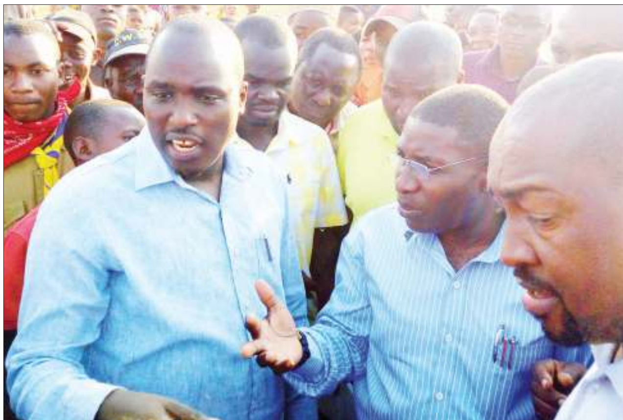
Waziri wa Madini, Doto Biteko (kushoto) na Waziri wa Nishati, Dk. Medard Kalemari (wa pili kushoto), wakitembelea machimbo ya madini yaliyopo wilayani Bukombe mkoani Geita mwishoni mwa wiki.