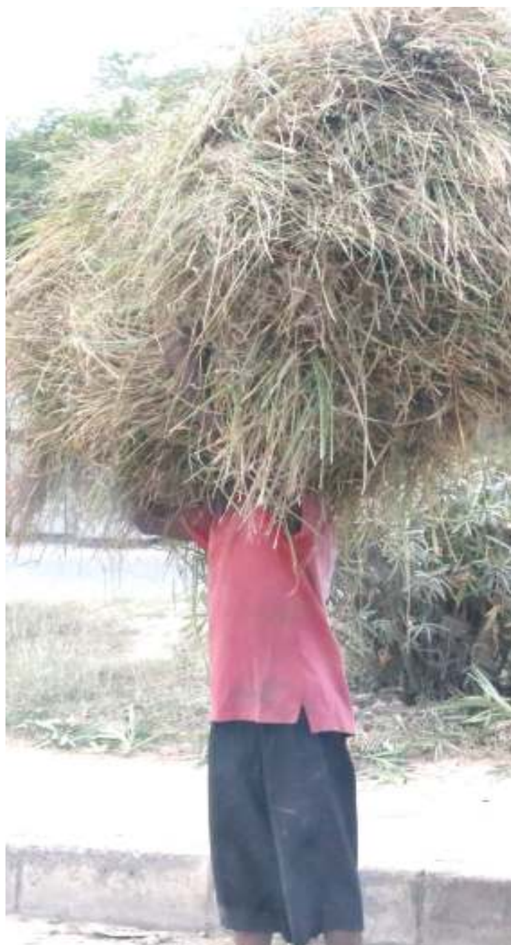
Mkazi wa Dar es Salaam akiwa amebeba nyasi kwa ajili ya malisho ya mifugo yake ili kutekeleza sheria inayowabana wafugaji wa mijini mifugo kutozurura ovyo mitaani.