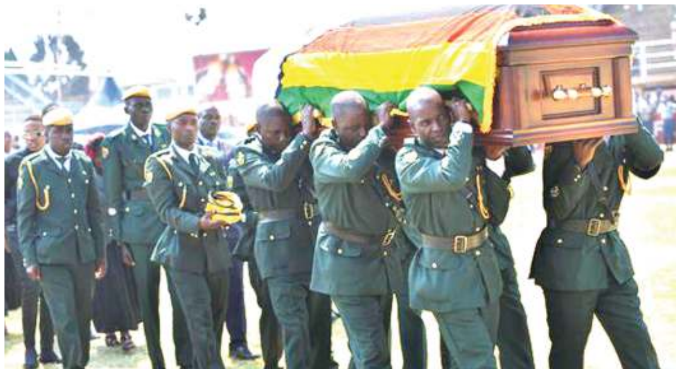
Askari wakiwa wamebabe mwili wa aliyekuwa Rais wa Zimbabwe, Robert Mugabe.