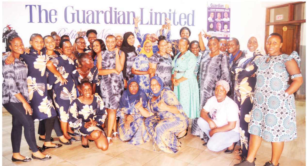
Baadhi ya wafanyakazi wanawake wa Kampuni ya The Guardian Ltd (TGL), inayochapisha magazeti ya The Guardian na Nipashe, wakiwa wenye furaha, wakati wa kilele cha maadhimisho ya Siku ya Wanawake Duniani, katika ofisi za TGL, Mikocheni Dar es Salaam jana.