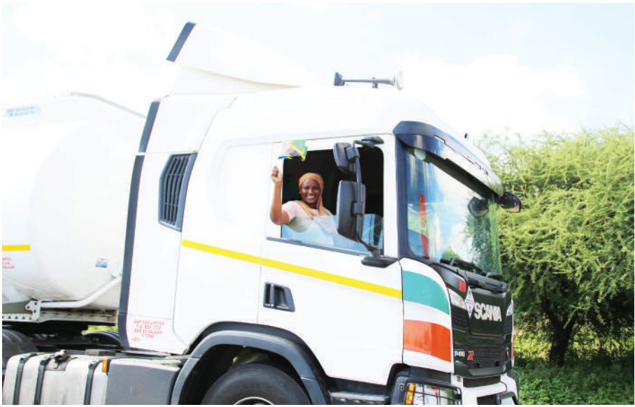
Dereva mwanamke akiwapungia kwa bendera kinamama (hawapo pichani), waliokuwa wakiandamana katika kilele cha Siku ya Wanawake Duniani, wilayani Chamwino jana.