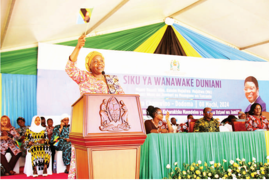
Waziri wa Maendeleo ya Jamii, Jinsia, Wanawake na Makundi Maalumu, Dk. Dorothy Gwajima, akiwahutubia wananchi kwenye kilele cha maadhimisho ya Siku ya Wanawake Dumiani, wilayani Chamwino mkoani Dodoma jana.