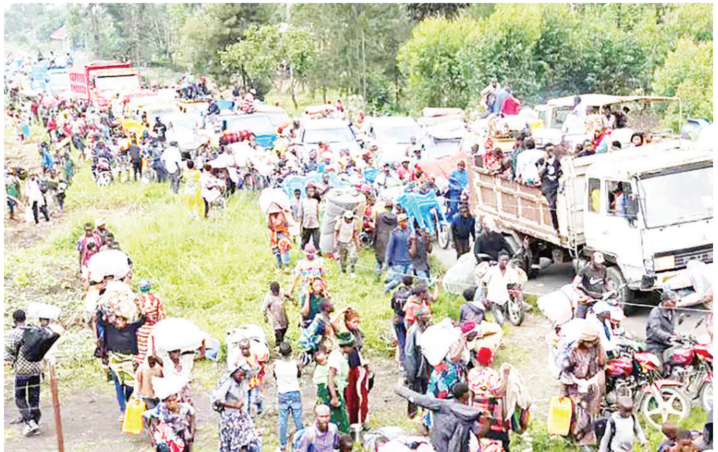
Raia wakiwa njiani kuukimbia mji wa Kibirizi nchini Jamhuri ya Kidemokrasia ya Congo (DRC) baada ya waasi wa M23 kuuteka na kuudhibiti juu.