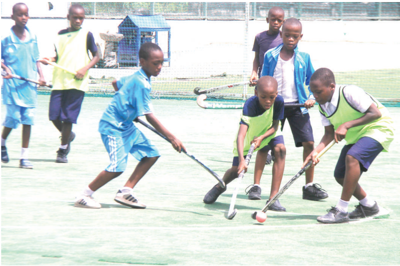
Wanafunzi wa Shule ya Msingi Mzambarauni (waliovaa bips) wakichuana na wenzao kutoka Shule ya Msingi Gereza katika mpira wa magongo kwenye viwanja vya JKM Park jijini Dar es Salaam jana.

Katika msimamo wa Ligi Kuu Tanzania Bara, Singida FG yenye pointi 21 iko kwenye nafasi ya 11 wakati Mtibwa Sugar yenye maskani yake Turiani, Morogoro inaendelea kuburuza mkia ikiwa na pointi 12 mkononi na imechesha michezo 18.