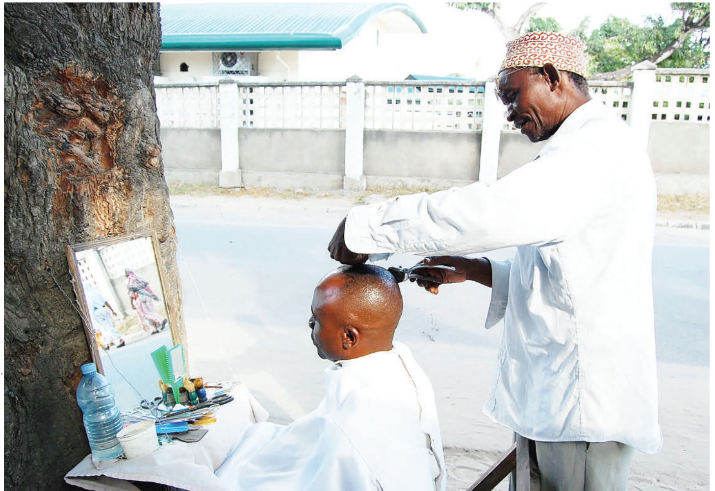
Picha hii inaonyesha hali halisi ya vinyozi wa zamani waliokuwa wakifanyia kazi chini ya miti enzi hizo.

Ukiachilia mbali madada wa mjini, au wa kisasa enzi hizo, huku uswahilini zikikaribia nyakati za sikukuu, iwe Krismasi, Pasaka, au Idd El Fitri, utaona jinsi wasichana wanavyohangaika