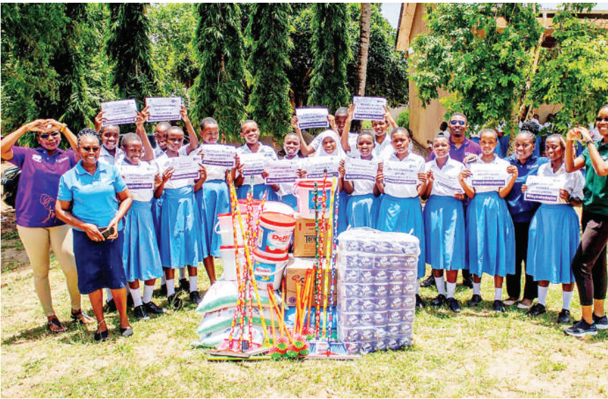
Wafanyakazi wa BRAC kutoka Makao Makuu ya Shirika hilo wakikabidhi msaada wa chakula na vifaa vya usafi kwa wanafunzi wa Shule ya Wasichana ya Bethesda ya Mpiji Magohe, Dar es Salaam jana, kama sehemu ya maadhimisho ya Siku ya Wanawake Duniani.