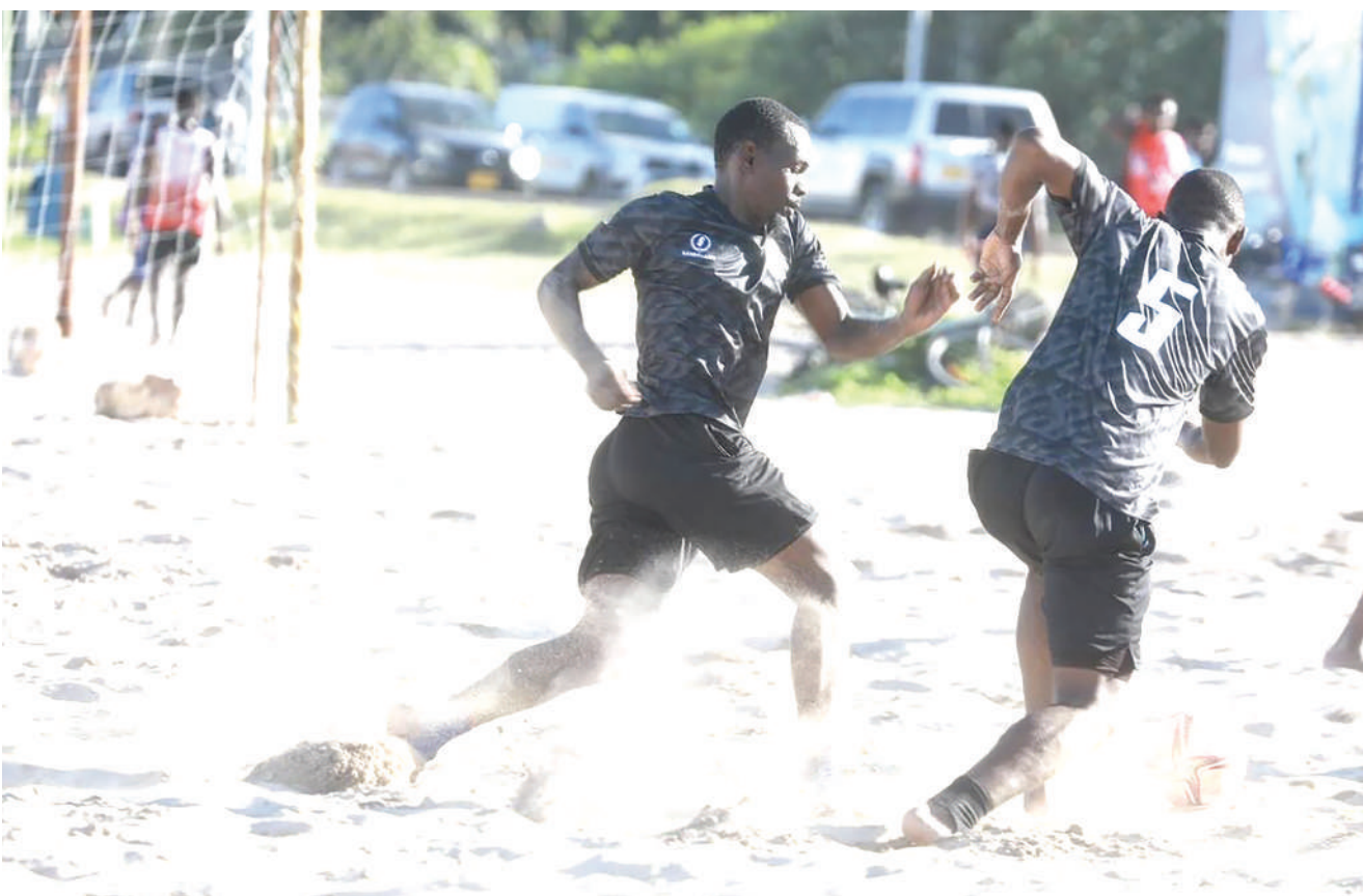
Wachezaji wa Timu ya Soka ya Taifa ya Ufukweni wakifanya mazoezi kwa ajili ya kujiandaa na mashindano ya kimataifa ya COSAFA yatakayofanyika baadaye mwezi huu nchini Afrika Kusini.

Baada ya hapo ikachapwa bao 1-0 dhidi ya Azam kabla ya kufungwa mabao 2-0 dhidi ya Mtibwa Sugar.