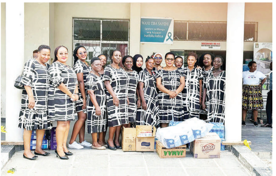
Wanawake wa Taasisi ya Watumishi Housing Investments (WHI) wakiwa na vitu mbalimbali kabla ya kutoa msaada wa dawa na mahitaji muhimu kwa wagonjwa katika Taasisi ya Saratani Ocean Road jijini Dar es Salaam jana, kusherehekea Siku ya Wanawake Duniani.