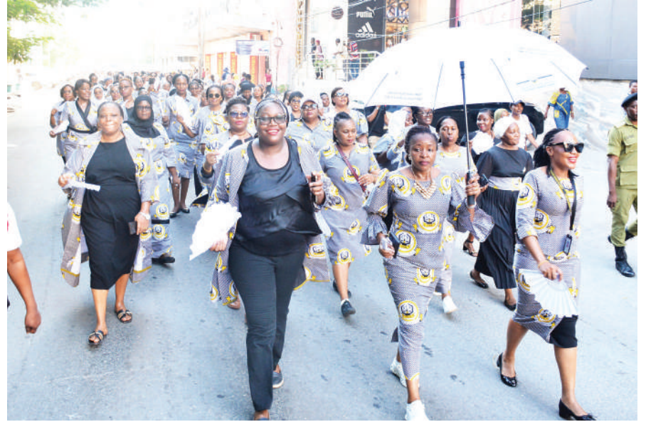
Wanawake wa Mamlaka ya Mapato Tanzania (TRA), wakiwa kwenye maandamano katika barabara ya Samora, jijini Dar es Salaam jana, wakiadhimisha Kilele cha Siku ya Wanawake Duniani.