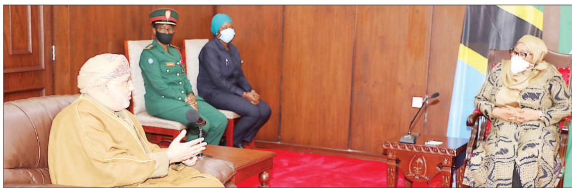
Rais Samia Suluhu Hassan, akizungumza na Balozi wa Oman hapa nchini aliyemaliza muda wake, Ali Bin Abdallah Bin Salim Al Mahrouqi, aliyefika Ikulu Chamwino, mkoani Dodoma jana kwa ajili ya kuaga.

"Ikumbukwe yalikuwapo magonjwa makubwa yaliyoikumba dunia tangu hatujazaliwa, zamani kama vile polio, surua, ndui yakatolewa chanjo. Je, waliokuwapo wasingetuchanja pengine wengine tusingekuwa hapa?" Alihoji.