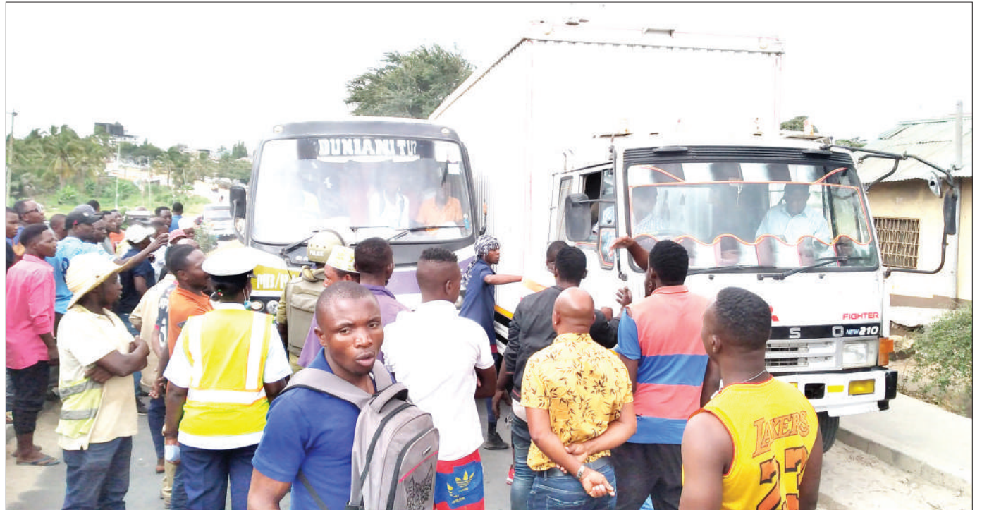
Askari Polisi Kikosi cha Usalama Barabarani, akiangalia mzozo wa dereva wa daladala linalofanya safari zake kati ya Mbagala na Kawe na wa lori la mizigo, baada ya kugongana katika Barabara ya Kawawa, jijini Dar es Salaam jana.

Hata hivyo, alishindwa kutoa ufafanuzi kuhusu gari lililokamatwa na maofisa wa serikali likitorosha mawe yanayodaiwa kuwa na dhahabu.