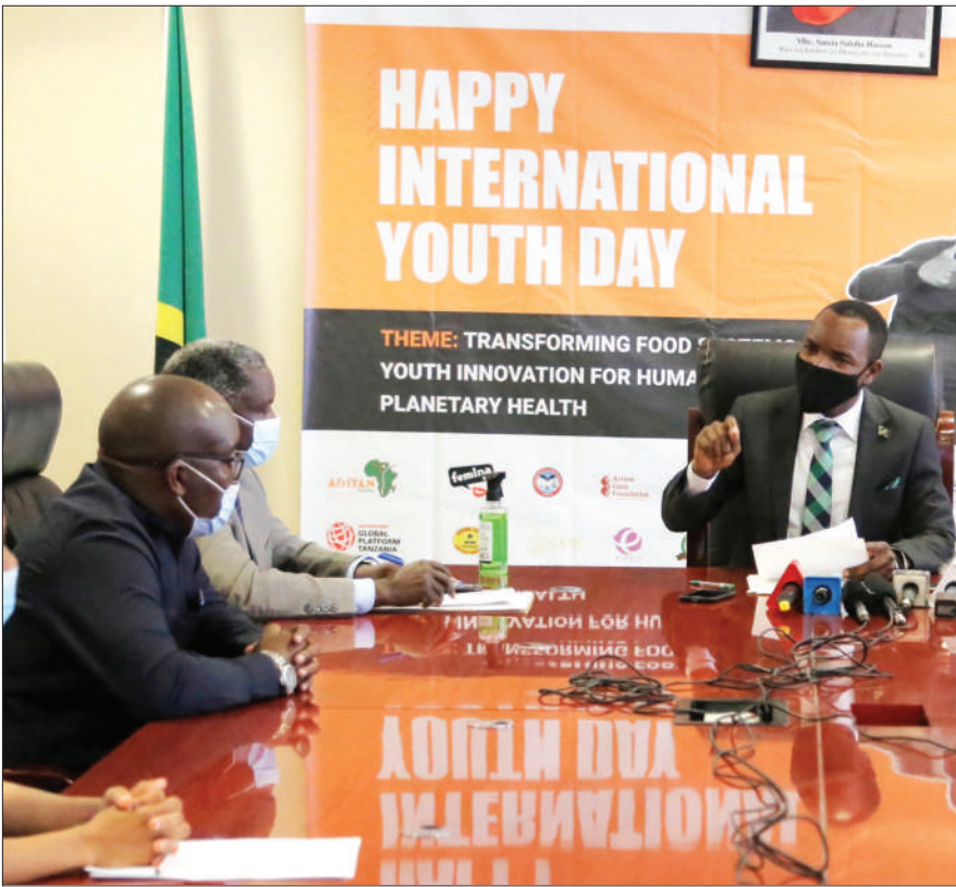
Naibu Waziri Ofisi ya Waziri Mkuu, Kazi, Ajira na Vijana, Patrobas Katambi, akizungumza kwenye maadhimisho ya Siku ya Vijana Kimataifa iliyofanyika jijini Dodoma jana kwa kuwashirikisha vijana kutoka maeneo mbalimbali nchini.