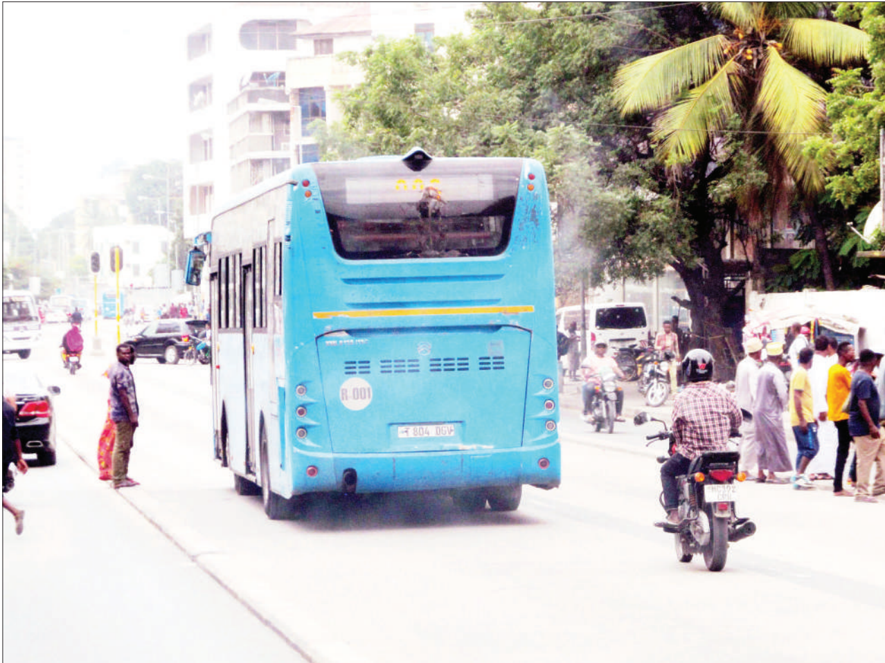
Dereva wa bodaboda akipita kwenye barabara ya mabasi ya mwendokasi, eneo la Msimbazi Kariakoo, jijini Dar es Salaam jana, kitendo ambacho ni ukiukwaji wa sheria za usalama barabarani.

Hata hivyo washtakiwa walikana makosa na kupelekwa rumande, kutokana na wadhamini wao kushindwa kutimiza masharti ya dhamana, na kesi hiyo namba 07/2021 itatajwa tena Agosti 24, mwaka huu.