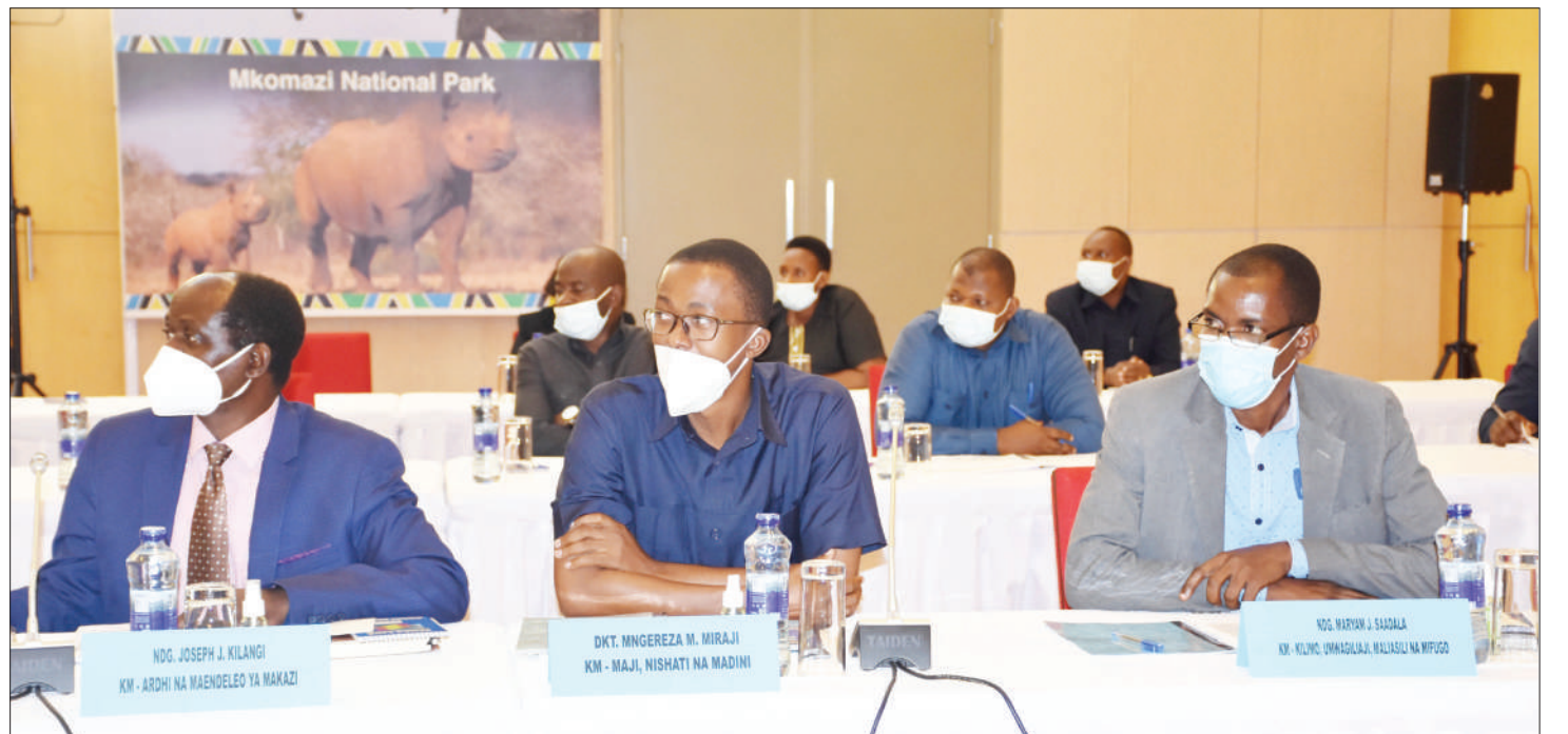
Makatibu wakuu kutoka Serikali ya Mapinduzi ya Zanzibar (SMZ), wakiwa katika kikao cha pamoja na makatibu wakuu kutoka Serikali ya Jamhuri ya Muungano wa Tanzania (SMT), katika ukumbi wa Jakaya Kikwete Ikulu, jijini Dar es Salaam juzi, ikiwa ni maandalizi ya kikao cha kamati ya pamoja ya kushughulikia masuala ya Muungano.

Hata hivyo, alisema inasikitisha baadhi ya wanasiasa kuendelea siasa za malumbano badala ya kusimamia siasa za kukosoana kwa nguvu za hoja na kutetea msimamo wa Rais wa Jamhuri ya Muungano wa Tanzania juu ya msimamo wake wa uendeshaji wa serikali.