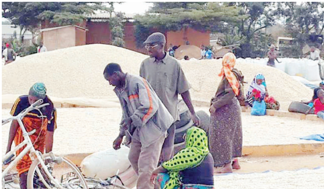
Wafanyabiashara wa mahindi wakiwa sokoni Kibaigwa mkoani Dodoma.