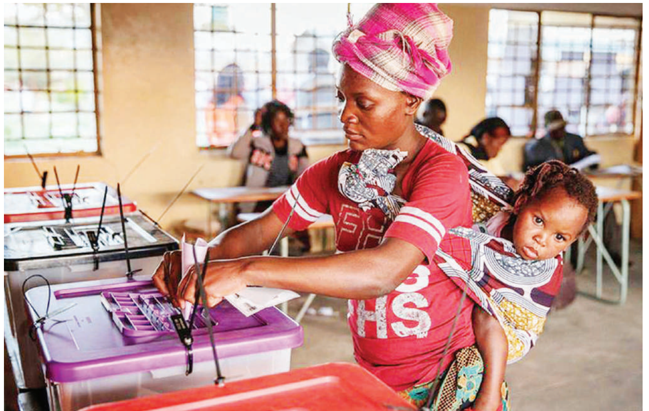
Mwananchi nchini Zambia akishiriki kupiga kura katika uchaguzi uliofanyika jana wa kumchagua rais na wabunge.