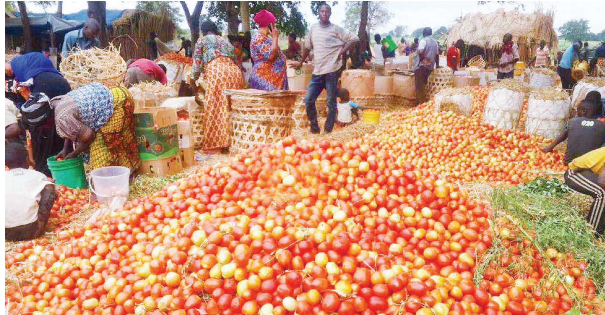
Wadau wanatamani nyanya kama hizi, matunda kuwa na soko la uhakika na kuwapa kwa viwanda vingi vya kuyachakata.

Pamoja na ahadi hiyo ya serikali, wanaamini kuwa ujenzi wa viwanda vidogo vingi nchini, un-