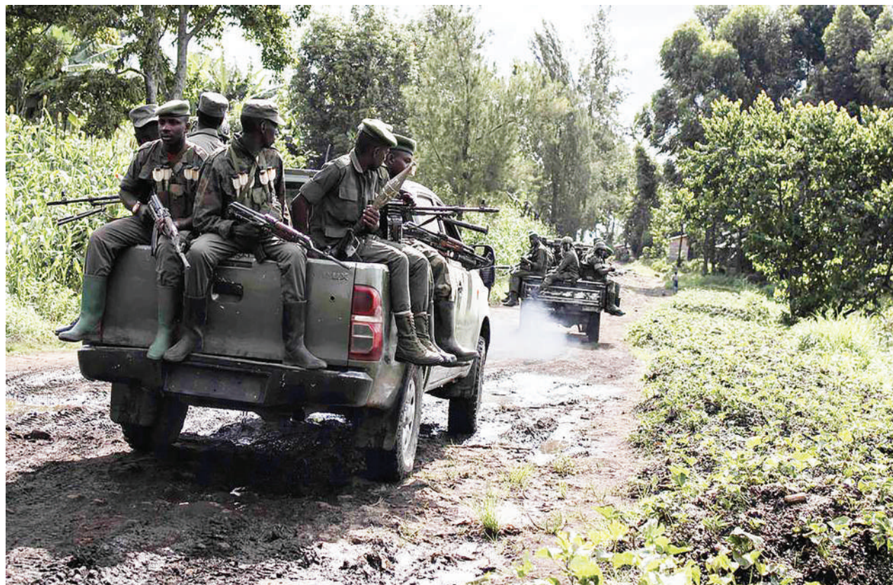
Wanamgambo wa kundi la waasi la M23 wakiwa katika harakati zao mashariki mwa DRC, ambako mauaji ya watu 15 yalifanyika juzi.