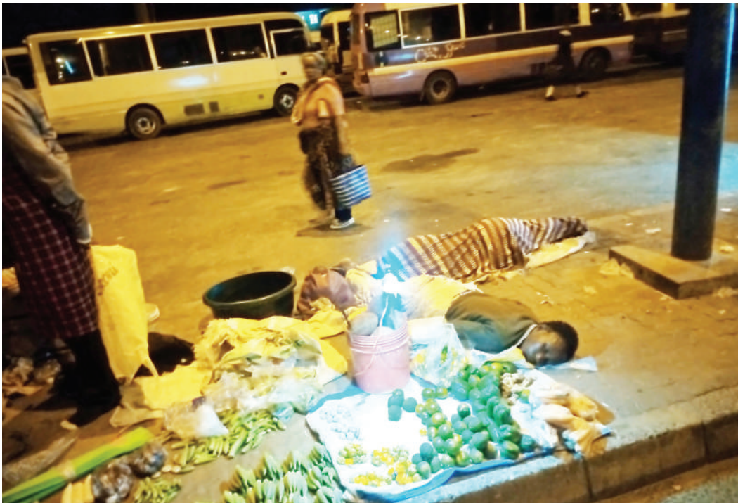
Wachuuzi wa mboga wakiwa wamejipumzisha, baada ya kukesha wakifanyabiashara, katika kituo cha daladala cha Mbezi Mwisho, Manispaa ya Ubungo, Dar es Salaam, alfajiri ya kuamkia jana.