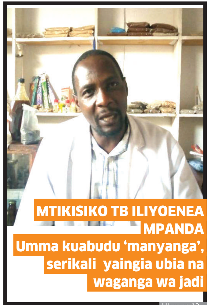
MTIKISIKO TB ILIYOENEA MPANDA