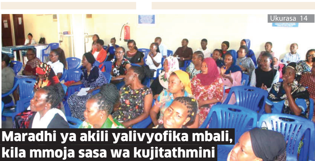
Maradhi ya akili yalivyofika mbali, kila mmoja sasa wa kujitathmini