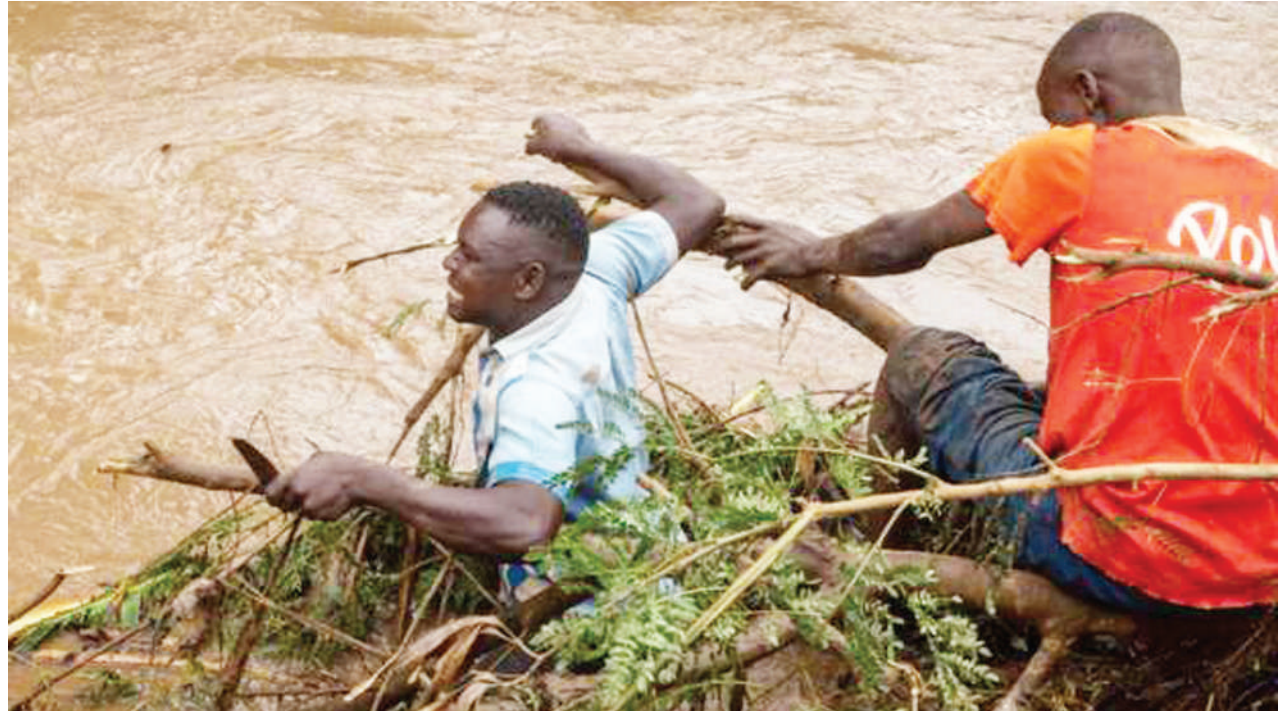
Baadhi ya raia wa kijiji cha Kasese, magharibi mwa Uganda chini ya milima ya Ruwenzori wakijiokoa kwa kutumia matawi ya miti baada ya eneo hilo kukumbwa na mafuriko yaliyoambatana na maporomoko ya ardhi.