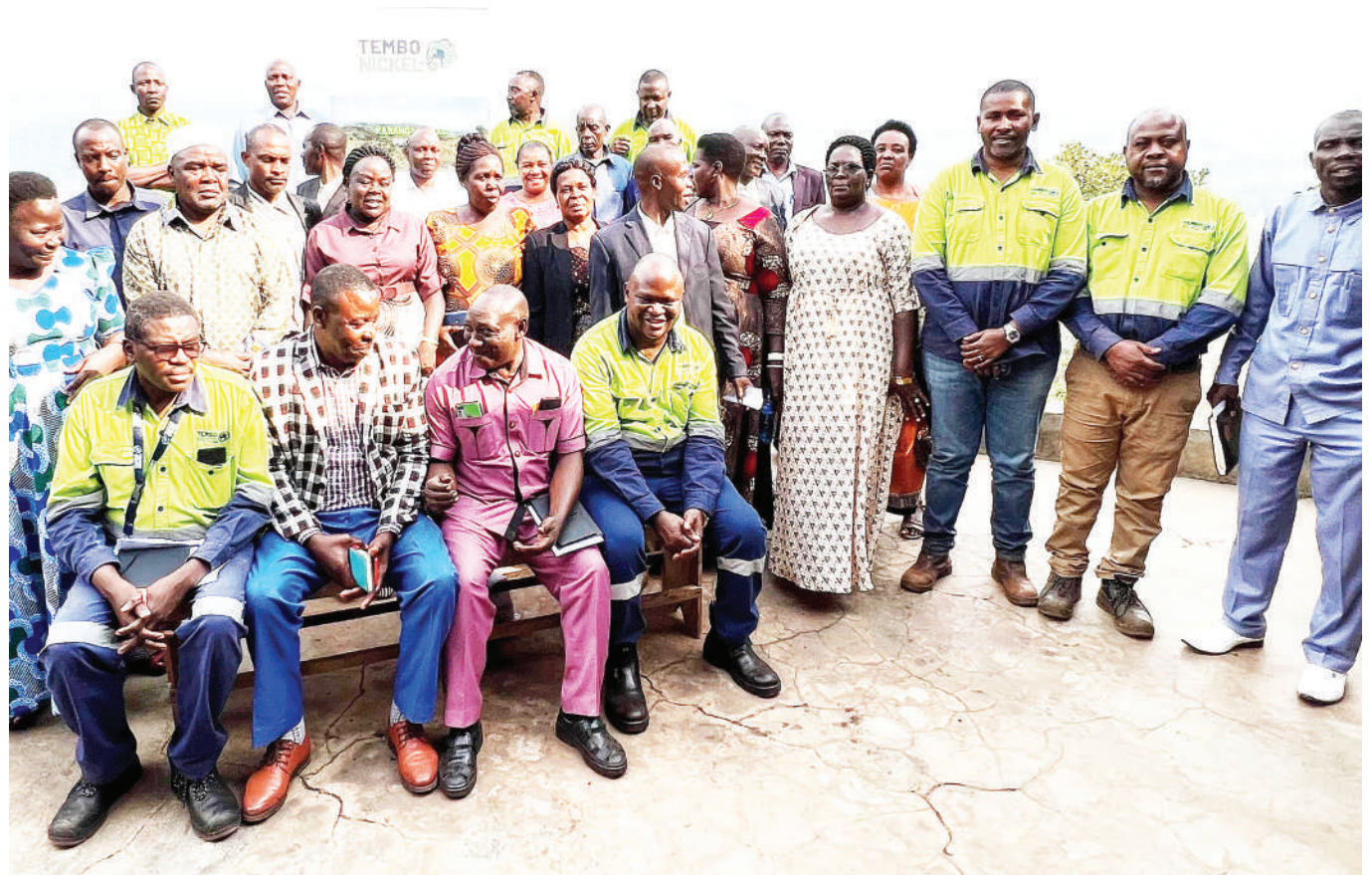
Madiwani wa Halmashauri ya Wilaya ya Ngara wakiwa katika picha ya pamoja na mameneja na maofisa wa Tembo Nickel, walipofanya ziara ya mafunzo katika eneo la mradi huo wilayani Ngara.

Alisema kwa kuwaacha walanguzi kuingia mashambani kumesababisha wakulima kutopata faida inayotokana na kazi yao kwa sababu ya ulanguzi unaofanywa huko shambani.