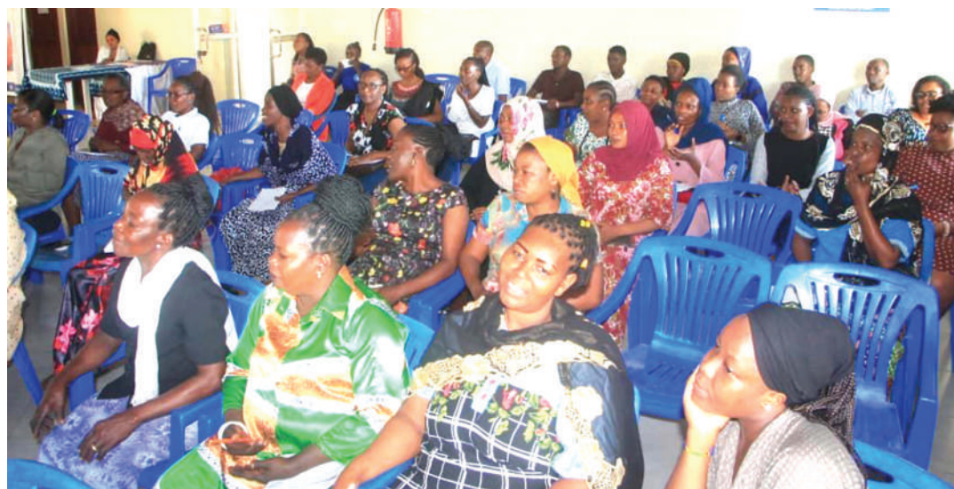
Baadhi ya washiriki wa mafunzo ya jinsia na maendeleo (DSS), wakisisiliza mada ya afya ya akili, iliyoandaliwa na Jukwaa la Kuzuia Watu Kujiua Tanzania (TSPC).

"Asilimia 46 ya wanandoa hufanyiwa ukatili wa kijinsia; asilimia 36 walifanyiwa ukatili wa kimwili;