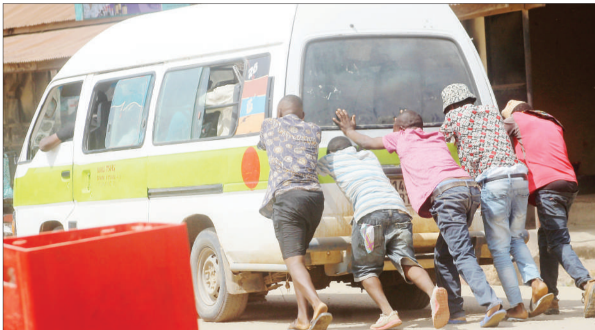
Wasamaria wema waki-saidia kusu-kuma gari ya abiria katika eneo la Mbande Chamazi baada ya kuzimika ghafla jijini Dar es Salaam jana.

Katika kikao hicho vyambo vya habari vikiongozwa na Taasisi ya Vyombo vya Habari Kusini mwa Afrika (MISA-TAN), vilikubaliana kushirikiana na asasi zisizo za kiserikali kuripoti habari za kina ili kuwaelimisha wananchi.