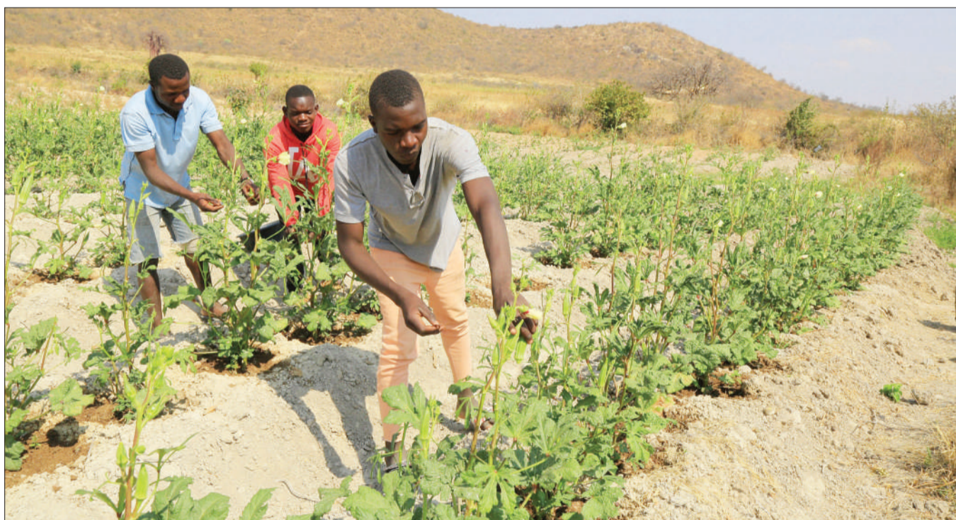
Vijana wakivuna bamia kwenye shamba lao mwisho wa wiki katika Kijiji cha Mtumbulu Wilaya ya Dodoma mkoani humo. Kilimo hicho kinawasaidia vijana kujijiri pamoja na kuajiri wengine.

“Hatutachoka kuendelea kuibua wabunifu kwa sababu tunahitaji kuona Tanzania ya viwanda inazidi kukua,” alisema.