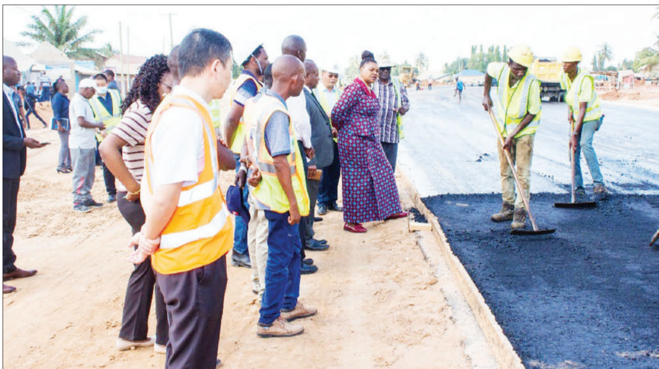
Waziri wa Nchi, Ofisi ya Waziri Mkuu, Sera, Bunge, Kazi, Vijana, Ajira na Wenye Ulemavu, Jenista Mhagama (mwe- nye kitenge), akikagua ujenzi wa barabara inayounganisha daraja la Mwalimu Nyerere na makazi ya watu Kigam- boni jijini Dar es Salaam.

Aliigiza pia halmashauri ya wilaya hiyo, kuanza kufanya maandalizi ya uendeshaji wa soko hilo ili litakapokamilika lianze kufanya kazi haraka.