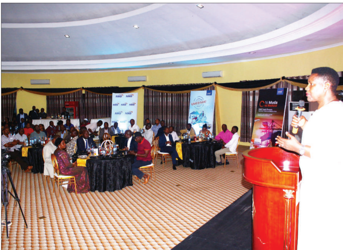
Naibu wa Waziri wa Ardhi, Nyumba na Maendeleo ya Makazi, Angelina Mabula, akizungumza kwenye hafla ya mtandao wa wafanyabiashara wakubwa na wakati ambao ni wateja wa NMB Kanda ya Ziwa, iliyofanyika jijini Mwanza.

Aklisema amefarijika sana kuona waziri ametambua kazi inayofanywa na TBA kuwa ni yenye ubora na ameahidi kuyafanyia kazi yale yote ambayo waziri aliyagaiza.