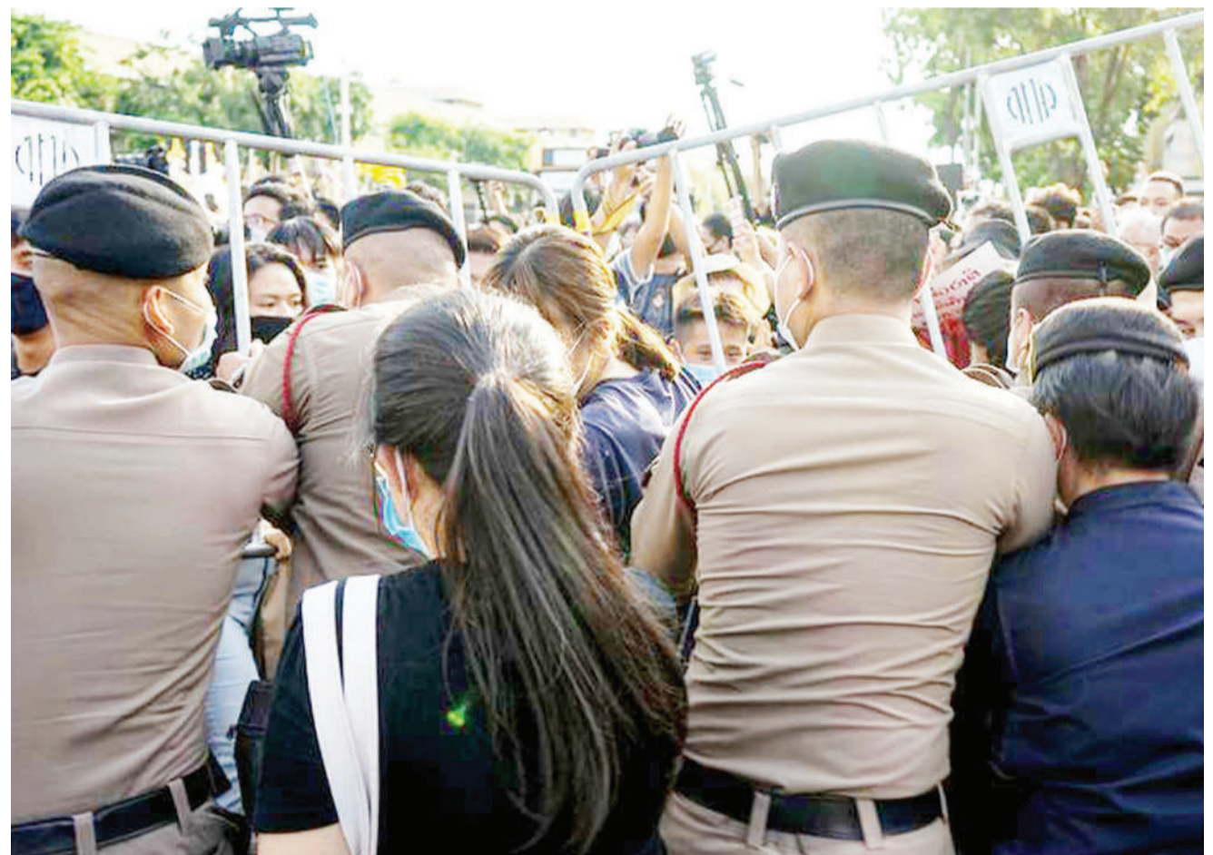
Polisi mjini Bangkok wakijaribu kuwazuia waandamanaji kuufikia mnara wa demokrasia wakati wa maandamano nchini Thailand.

Katika historia ya miaka 75 ya UN, Marekani haijawahi kutengwa kama hivi leo.